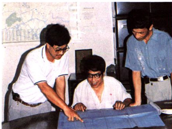
温州市药品化工一厂领导在研讨发展规划