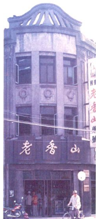
名老药店一老香山