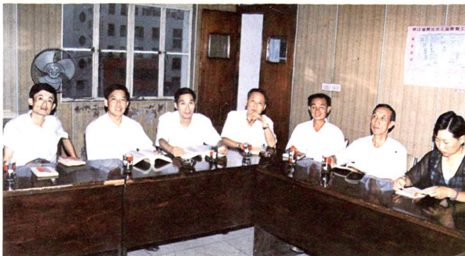
局领导与修志人员在评审志稿