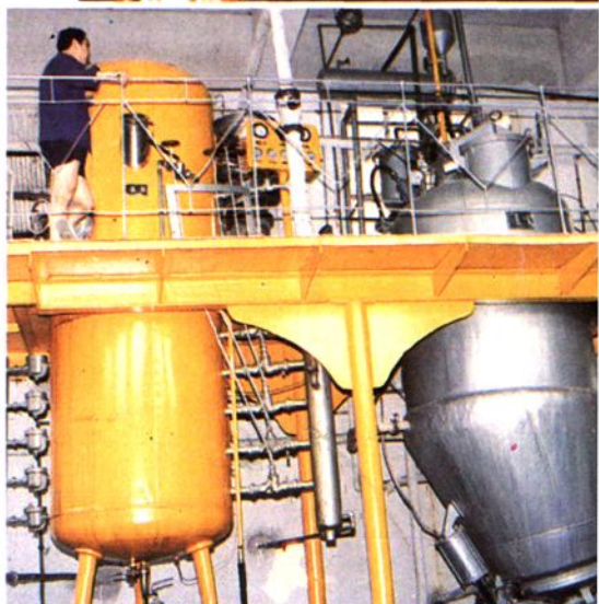
温州中药厂提取车间