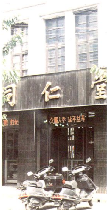
名老药店一同仁堂