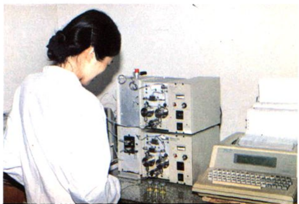
www.ertongbo 温州市药品化工二厂测定室