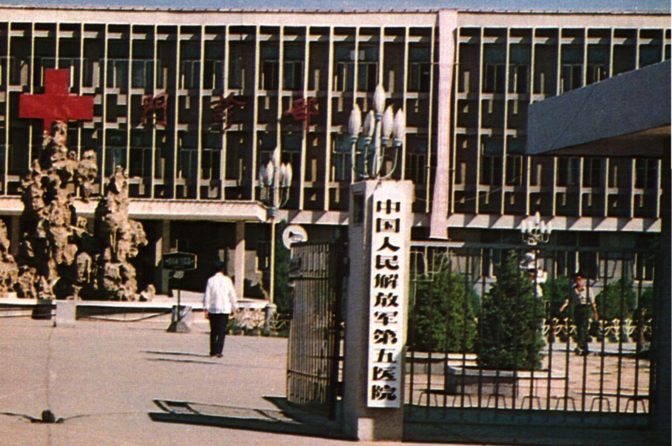
医院大门及门诊楼