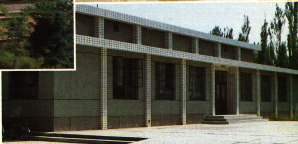
学术文化活动中心