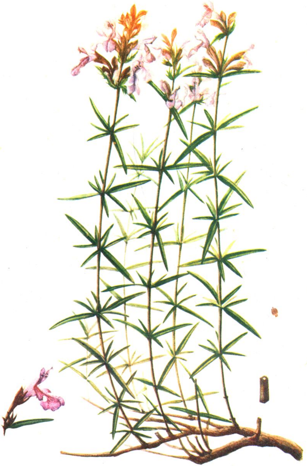
彩图3. 全叶青兰 Dracocephalum integrifolium Bge.