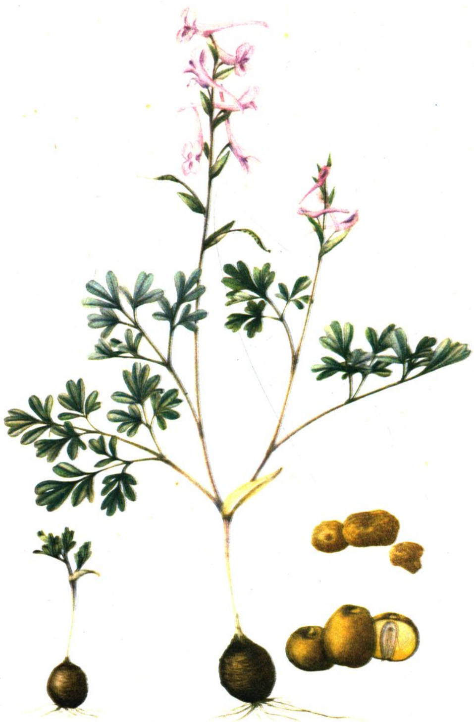
彩图4. 新疆元胡 Corydalis glaucescens Rgl.