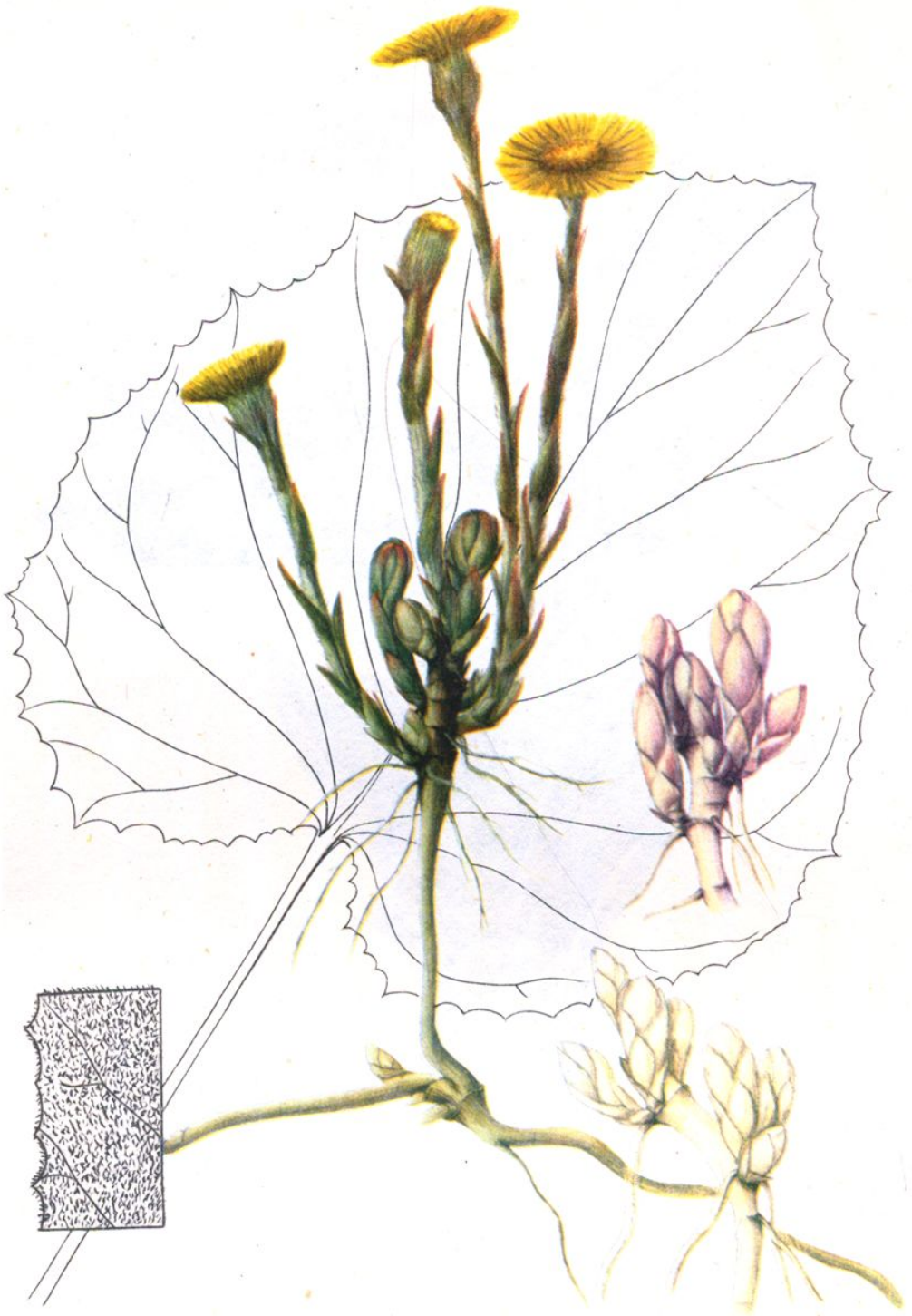
彩图5. 款 冬 Tussilago farfara L.