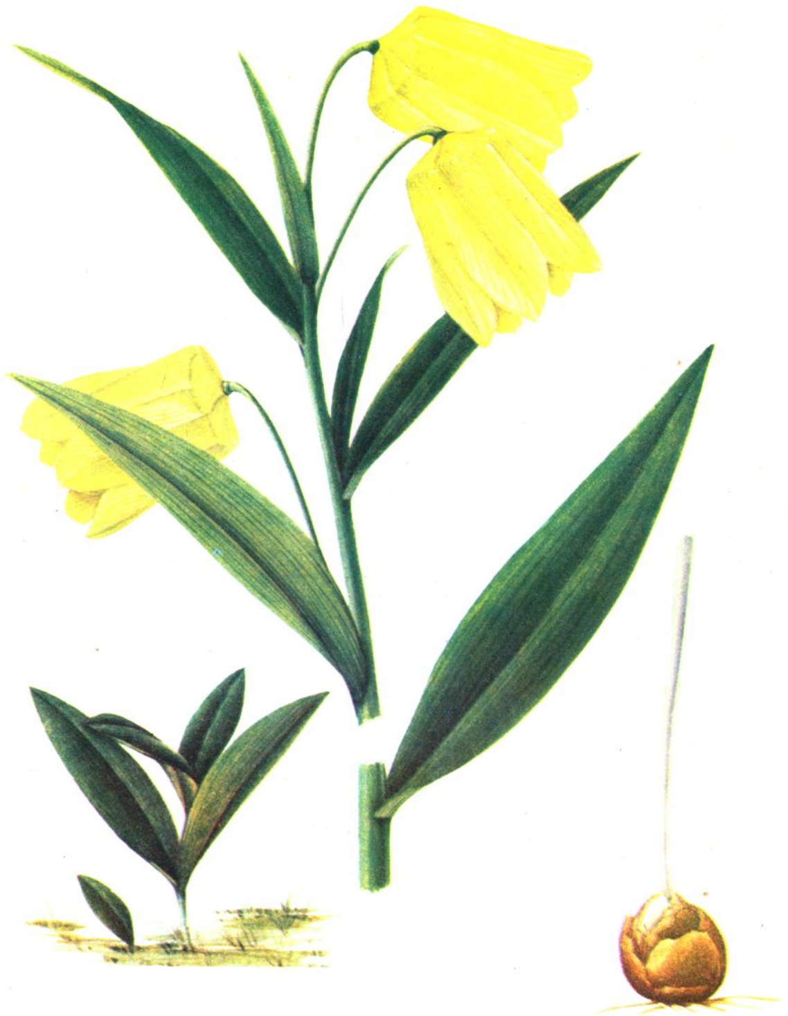
彩图1. 伊贝母 Fritillaria pallidiflora Schrenk