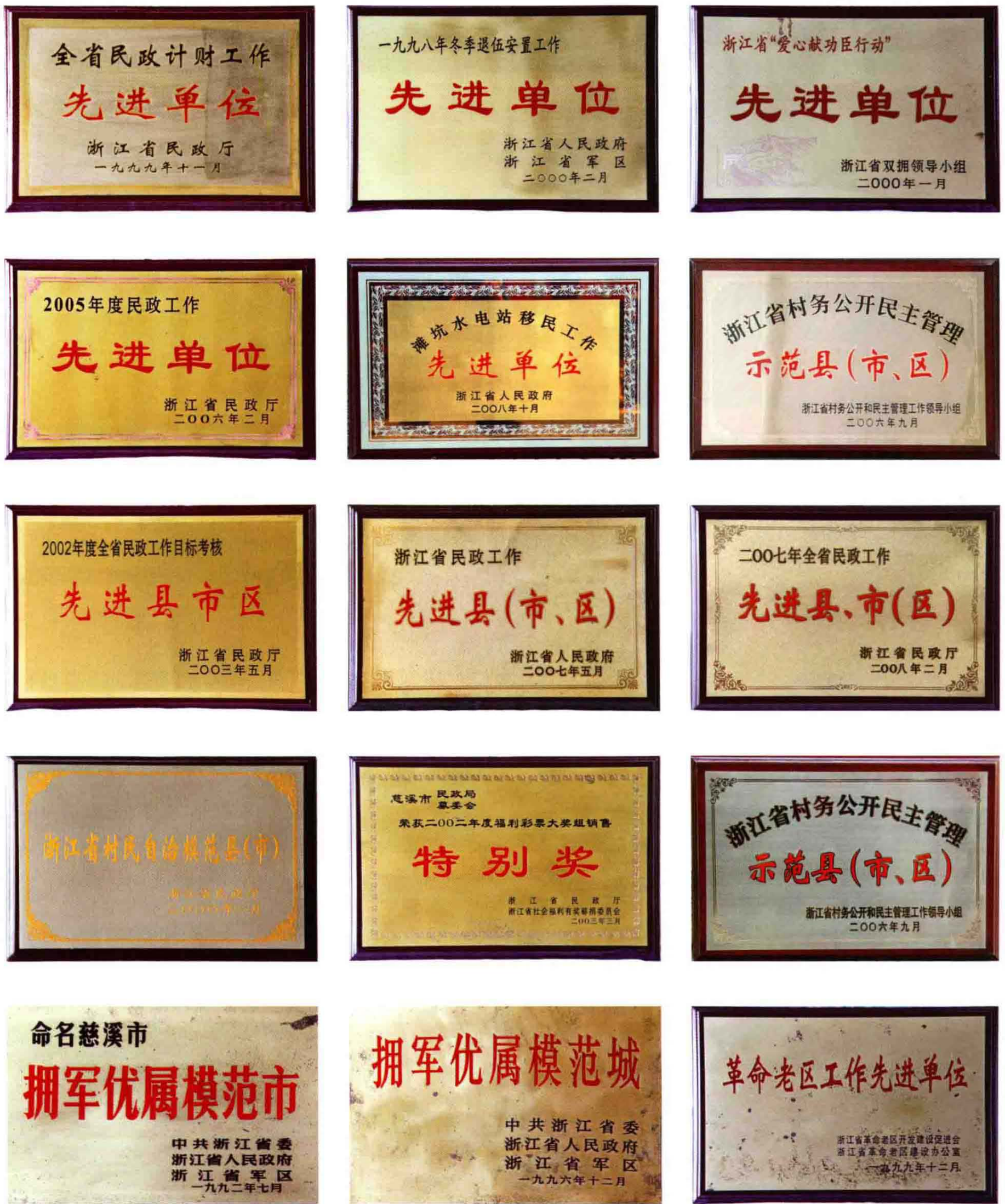
1992—2008年省级荣誉部分奖牌