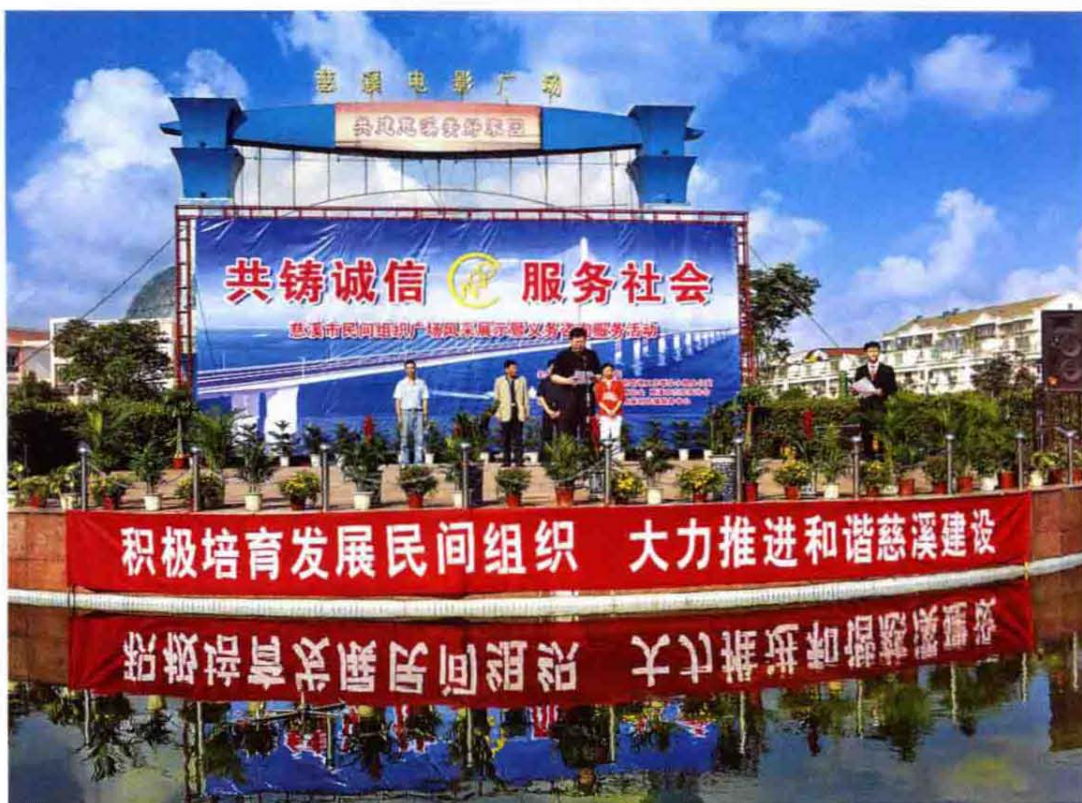
2006年9月26日慈溪市民间组织广场风采展示活动