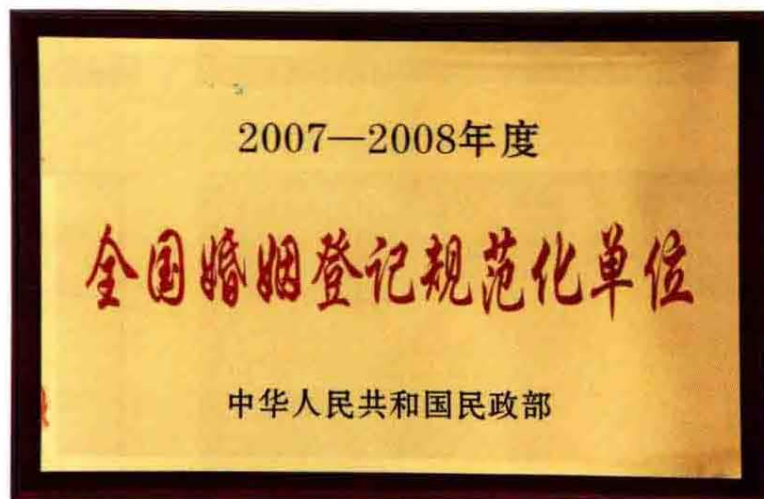
2007—2008年度全国婚姻登记规范化单位