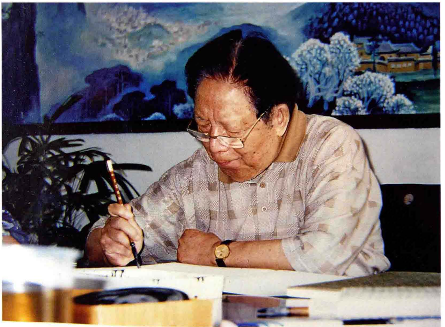
1998年9月23日原中共浙江省委书记铁瑛考察慈溪革命烈士纪念馆并题词