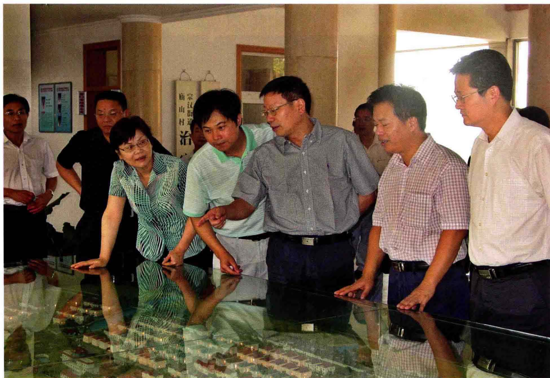
2007年7月5日浙江省副省长陈加元(右三)在宗汉街道庙山村调研农村社区