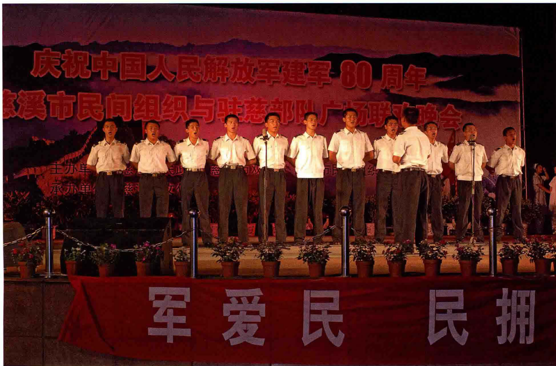
2007年7月26日慈溪市民间组织与驻慈部队广场联欢晚会