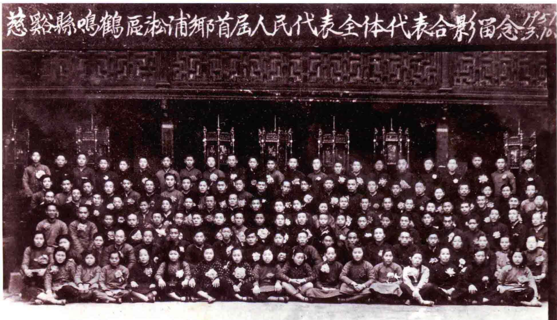
1951年3月鸣鹤区淞浦乡首届人民代表大会全体代表合影