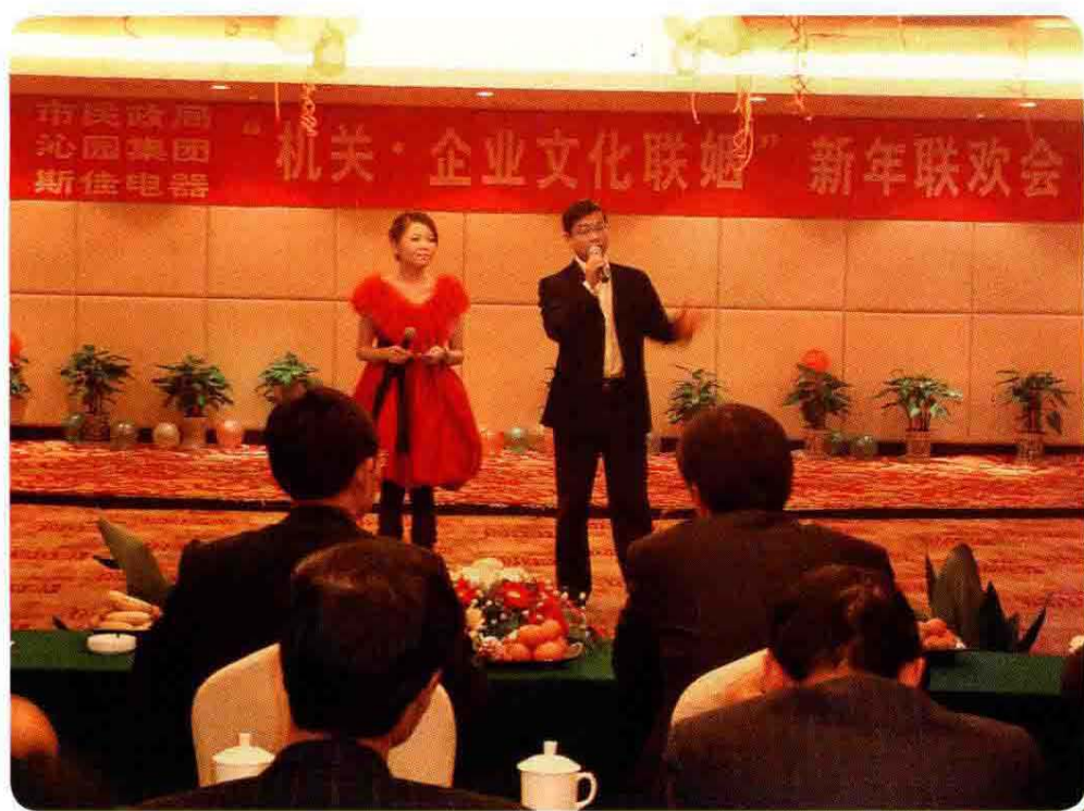
2007年局机关与企业文化联姻新年联欢会