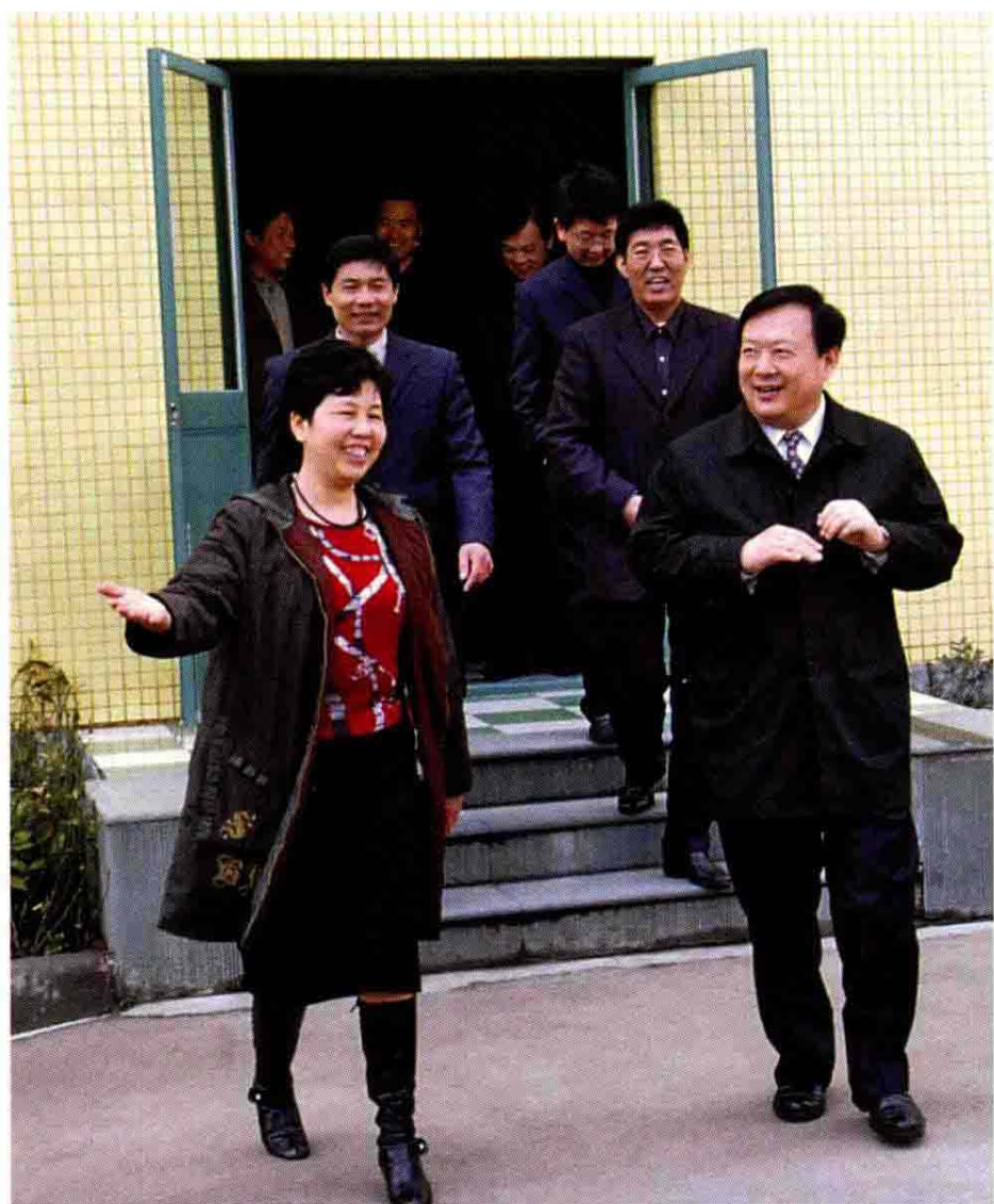
2005年3月24日中共浙江省委副书记夏宝龙(右一)视察慈吉教育集团