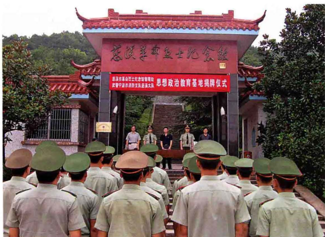
2007年7月10日市消防大队与慈溪革命烈士纪念馆共建思想政治教育基地