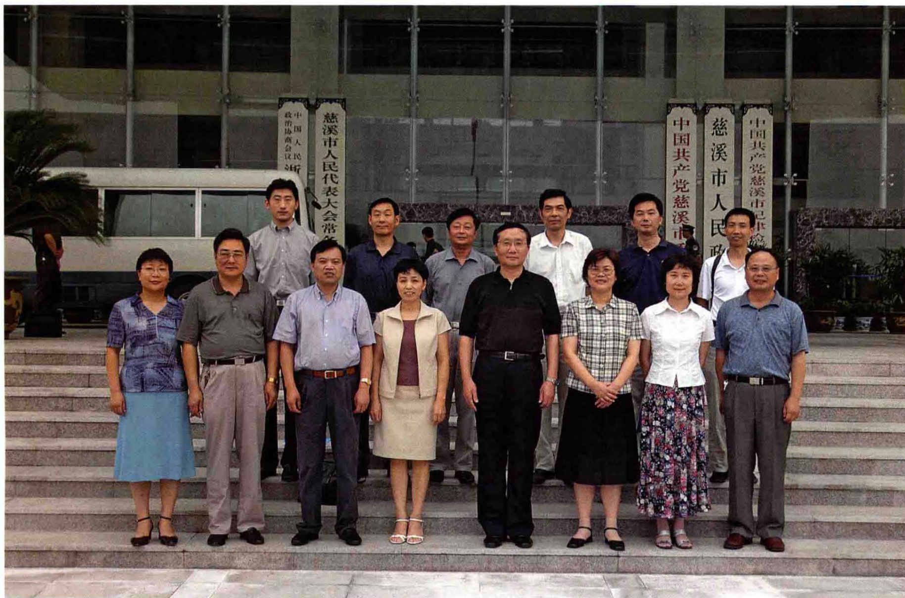
2004年8月4日全国老龄委常务副主任兼老龄办主任李本公(一排左五)率团考察慈溪创建全国老龄工作先进县(市)区工作时与市领导合影