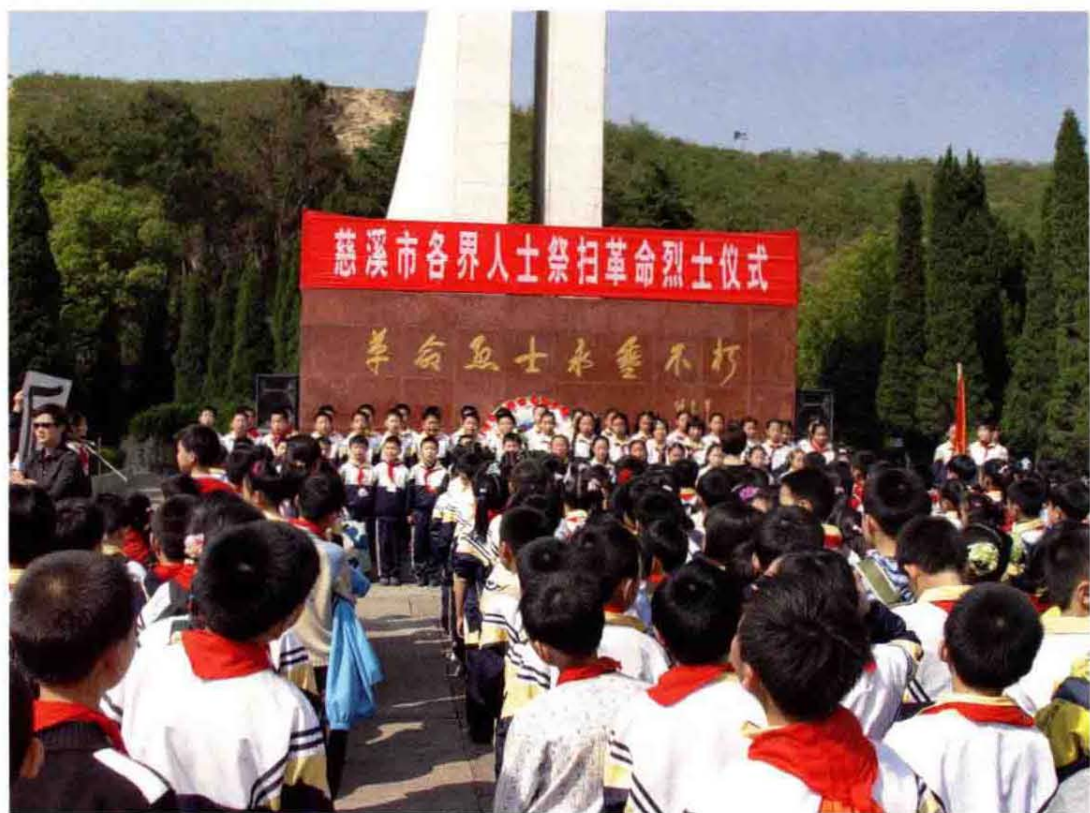
2006年清明祭扫革命烈士