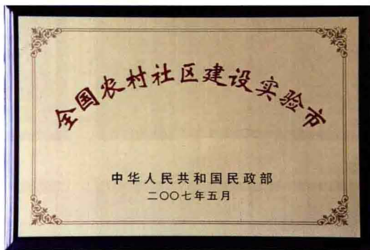
2007年全国农村社区建设实验市