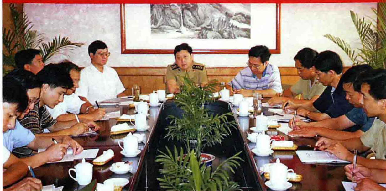
1992年2月慈溪市双拥工作汇报会