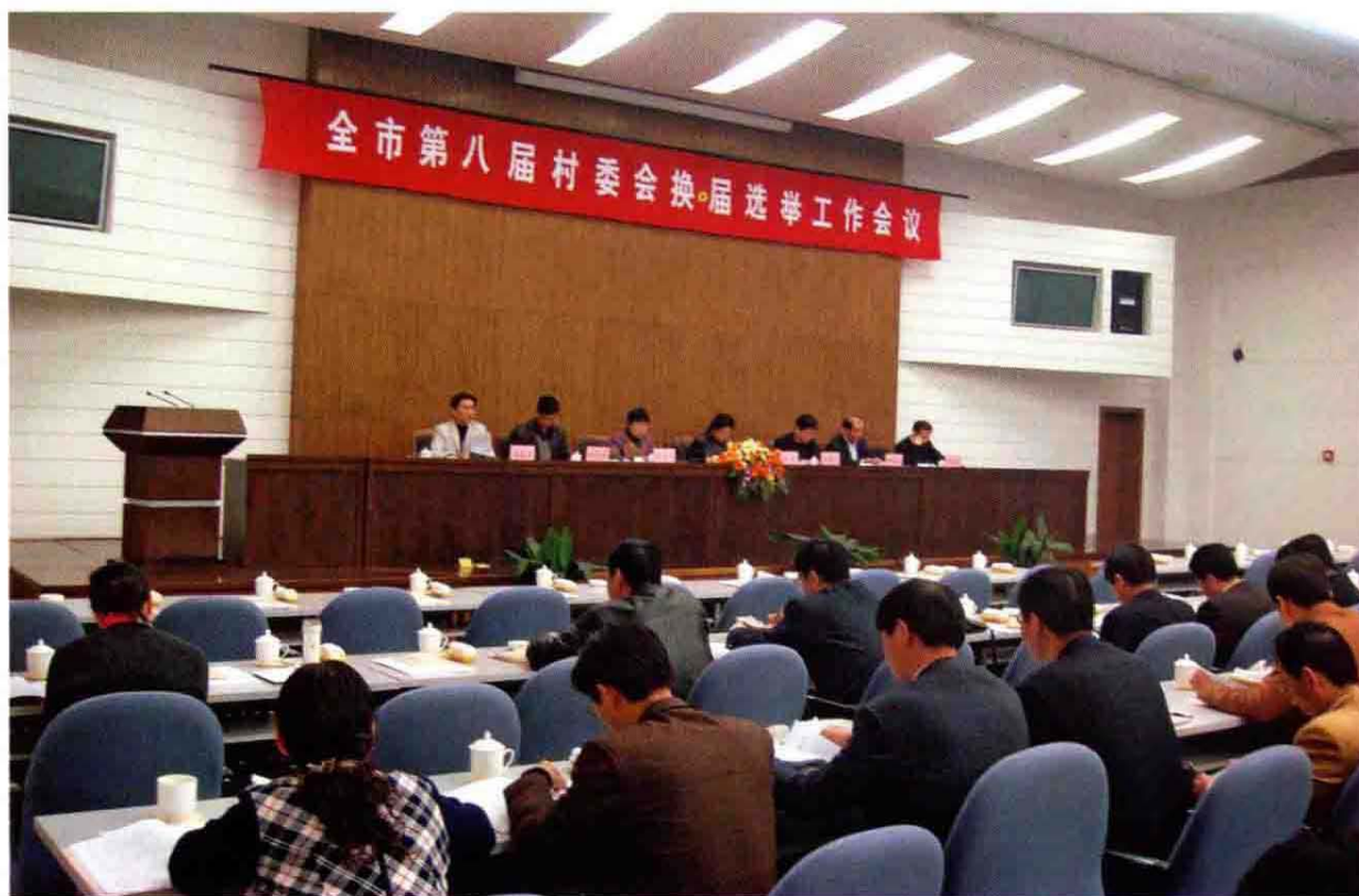
2008年3月19日慈溪市第八届村委会换届选举工作会议