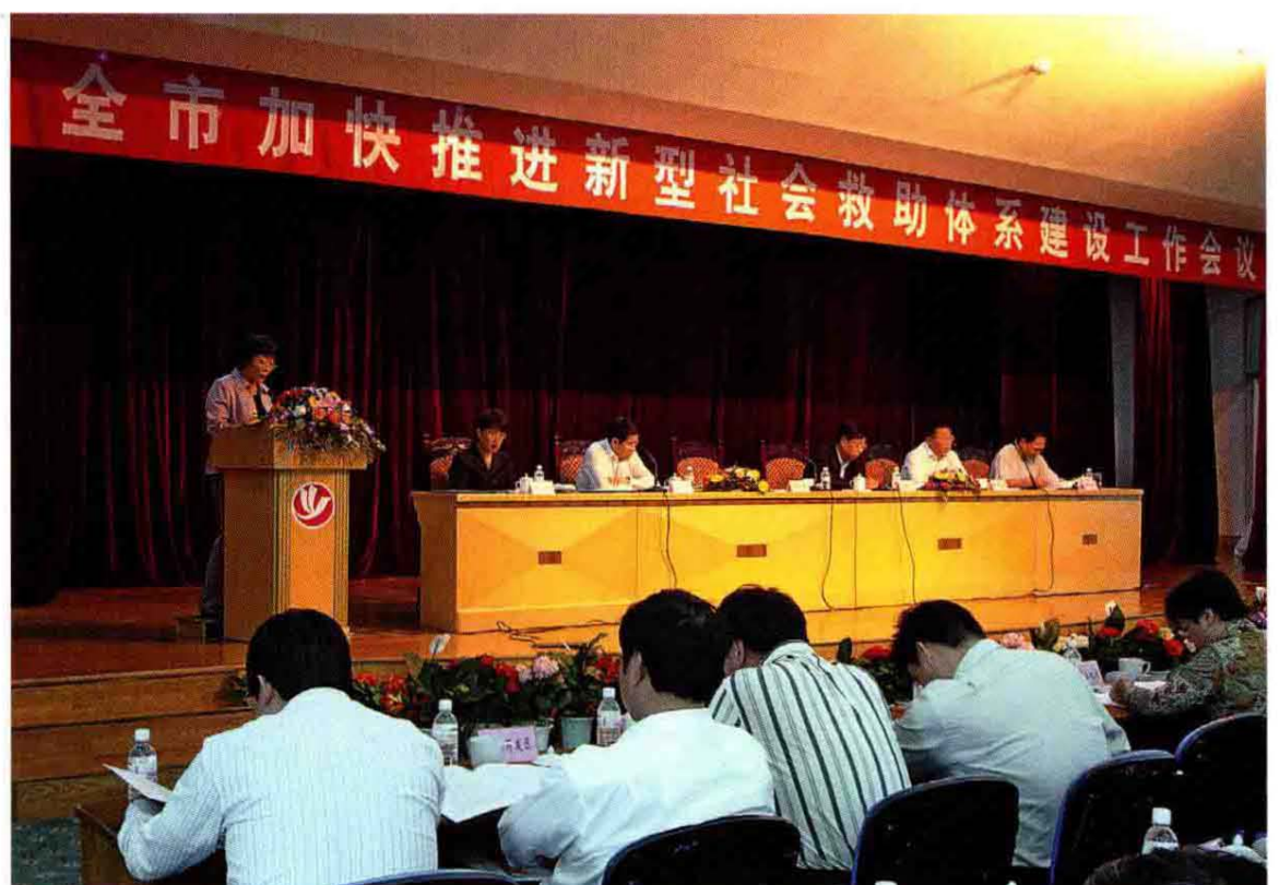
2006年5月10日慈溪市加快推进新型社会救助体系建设工作会议