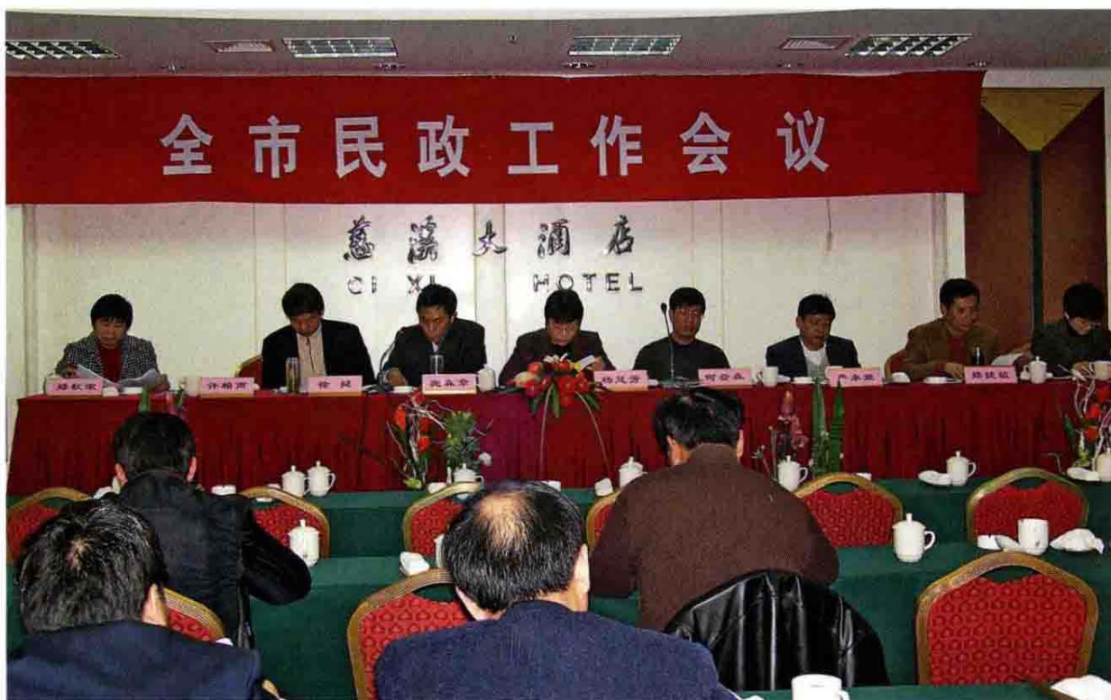
2008年3月13日慈溪市民政工作会议