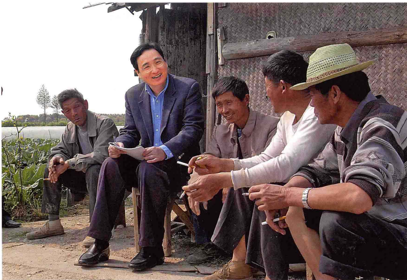
2008年中共慈溪市委书记洪嘉祥(左二)下乡了解民情