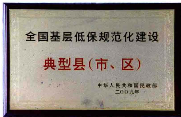
2008年全国基层低保规范化建设典型市