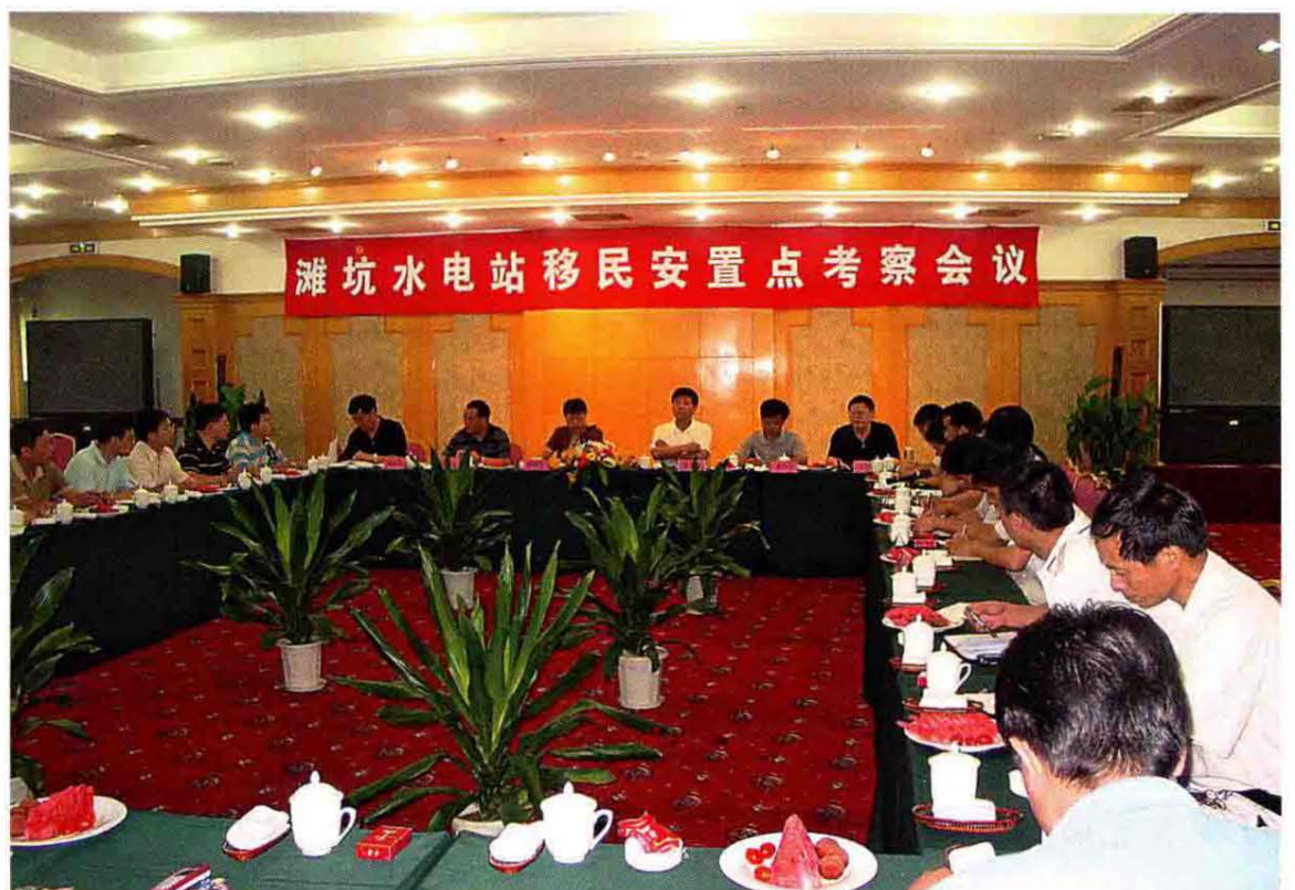
2005年7月13日滩坑水电站移民安置点考察会议