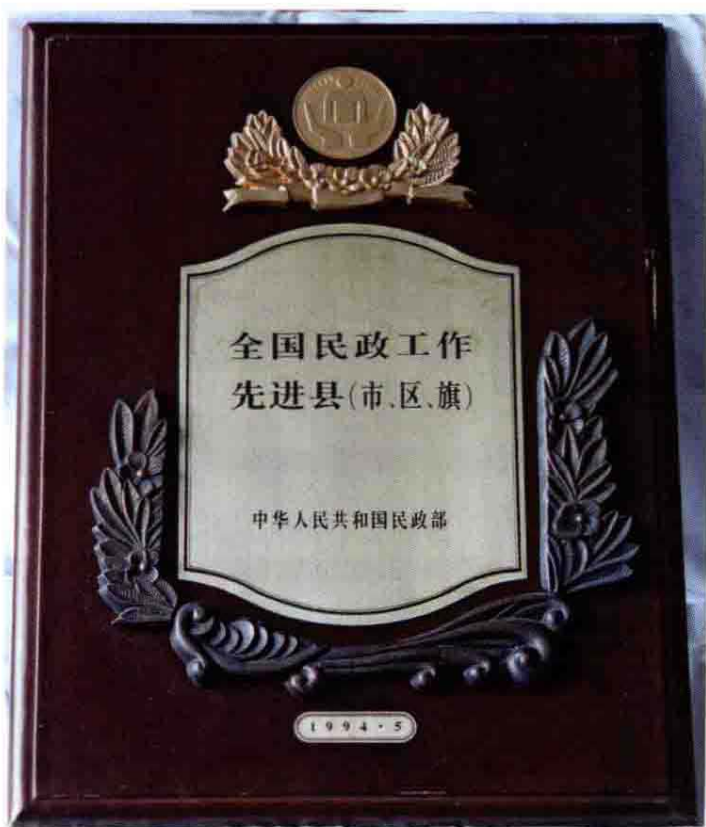
1994年全国民政工作先进市