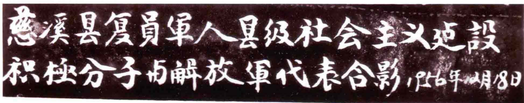
1956年12月慈溪县复员军人县级社会主义建设积极分子与解放军代表合影