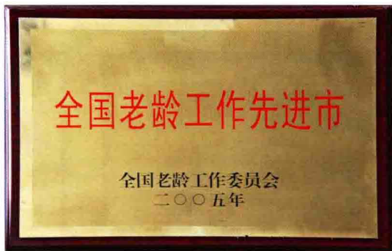
2004年全国老龄工作先进市