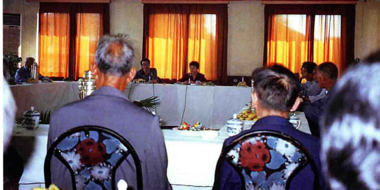
1999年全市建国功臣代表座谈会