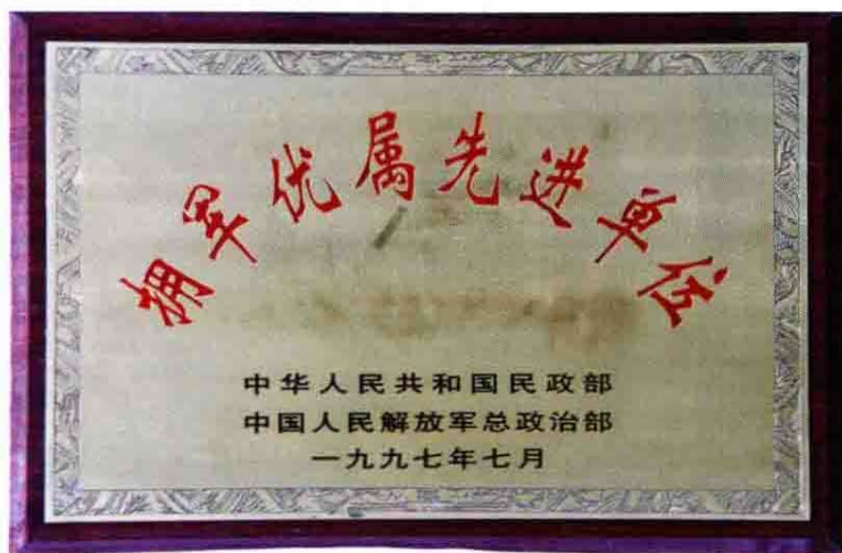
1997年全国拥军优属先进单位