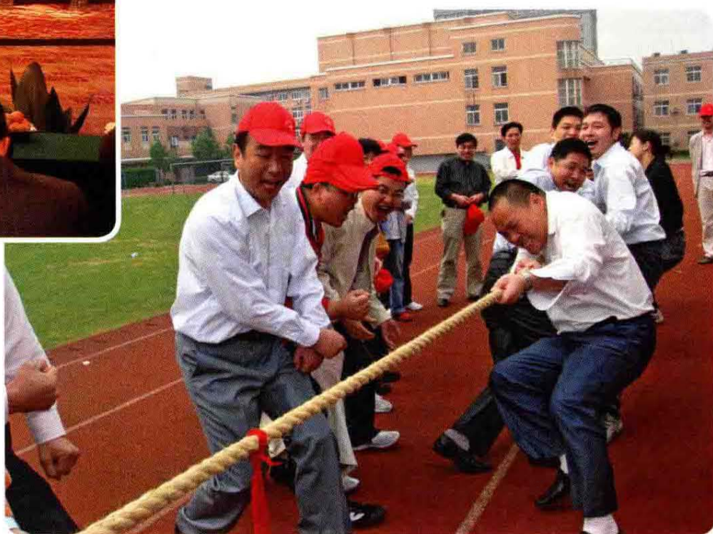
2008年5月慈溪市民政局第一届职工运动会