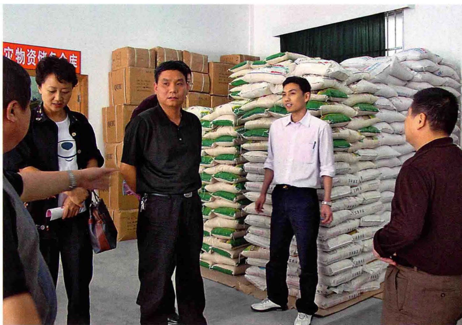
2006年5月浙江省民政厅副厅长纪圣麟(中)在慈溪市避灾中心视察指导工作