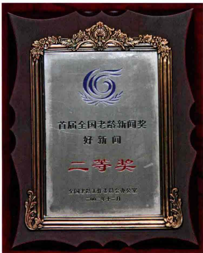
2003年首届全国老龄新闻奖好新闻二等奖