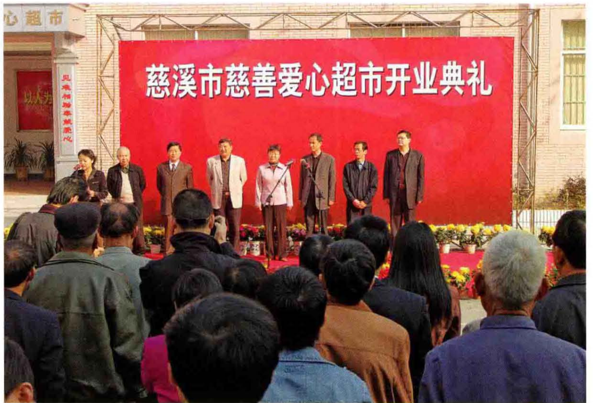
2004年11月19日慈溪市慈善爱心超市开业典礼