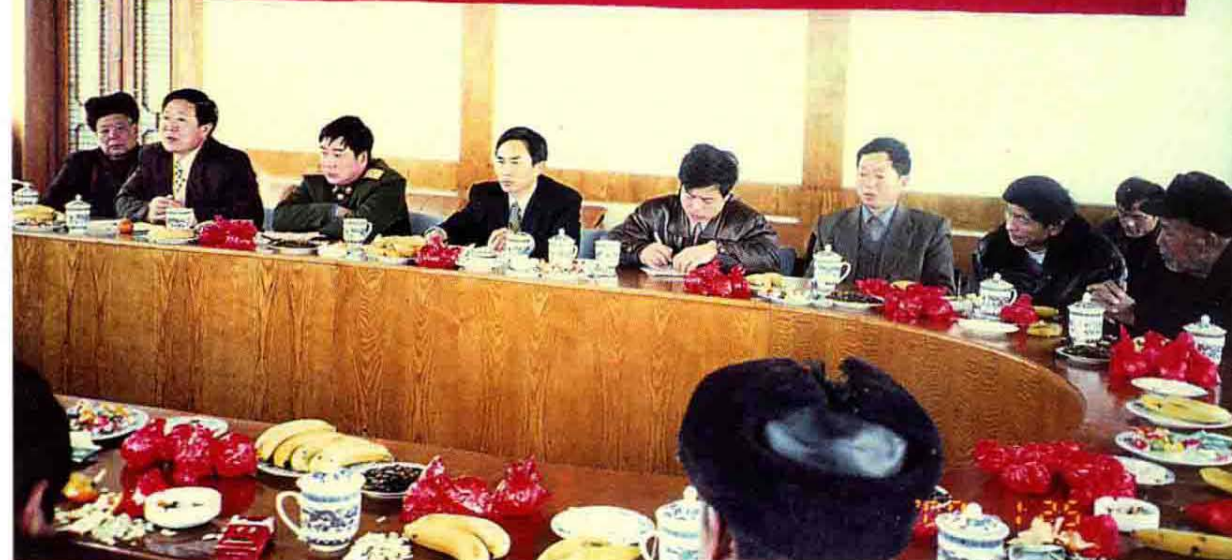
2000年新春优抚对象代表座谈会