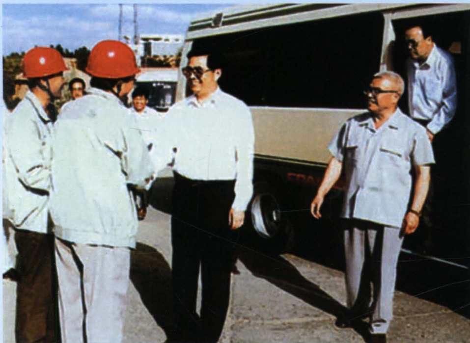
1995年6月20日，时任中共中央政治局常委、书记处书记胡锦涛在自治区党委书记黄璜陪同下视察青铜峡水利枢纽工程。