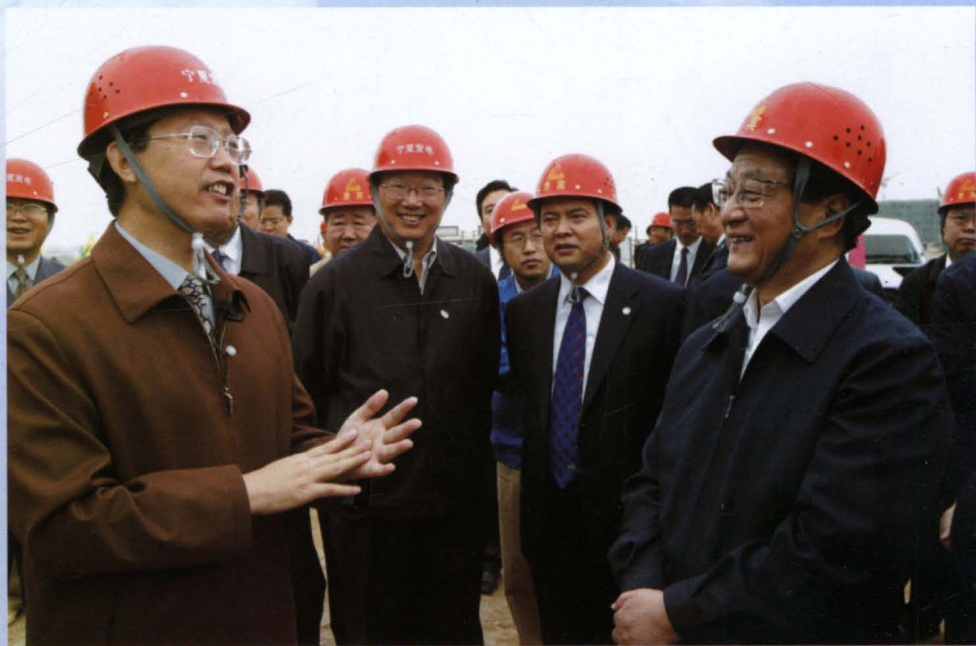
2004年9月24日，中共中央政治局常委、国务院副总理黄菊视察宁夏马莲台发电厂项目工程。