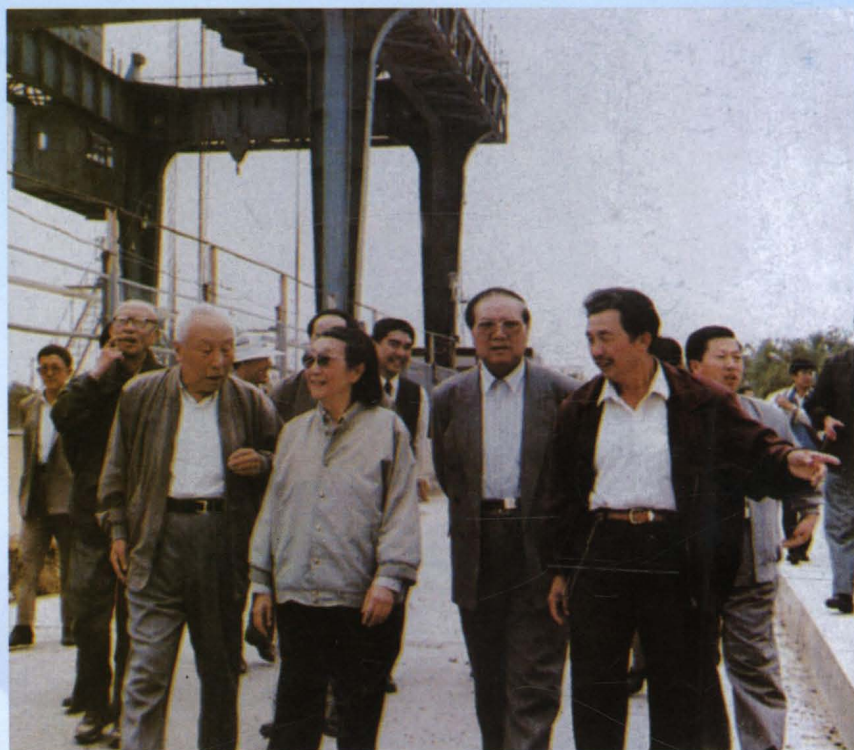
一九九四年九月十四日，原水电部部长、全国政协副主席钱正英在原青铜峡工程局总工程师礼荣勋的陪同下视察青铜峡水电站大坝。