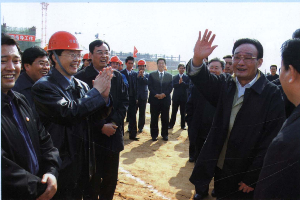
2005年3月21日，中共中央政治局常委、全国人大常委会委员长吴邦国到马莲台电厂工地视察。