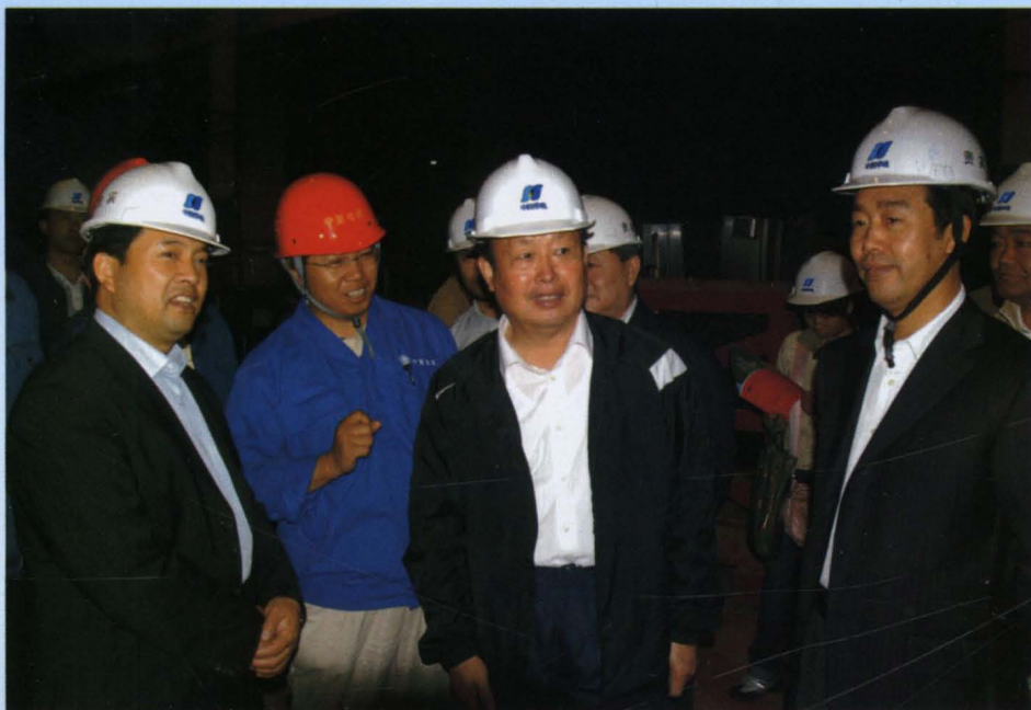
2007年6月20日，自治区领导陈建国、王正伟、于革胜，在公司副总经理兼建安公司经理陈学富的陪同下，到灵武电厂一期工程视察（前排中为陈建国，左为王正伟，右为于革胜）。