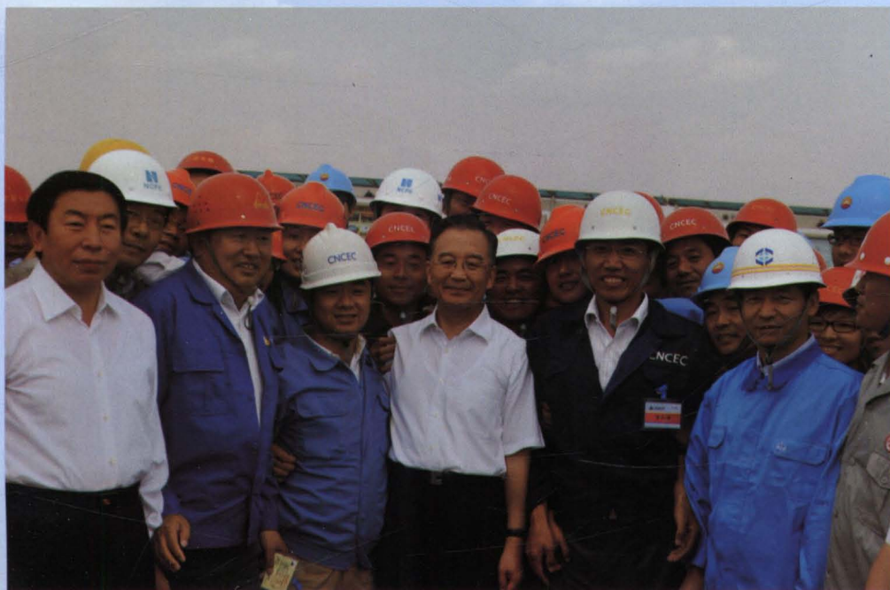
2008年8月15日，中共中央政治局常委、国务院总理温家宝到公司承建的烯烃动力站工程项目视察。