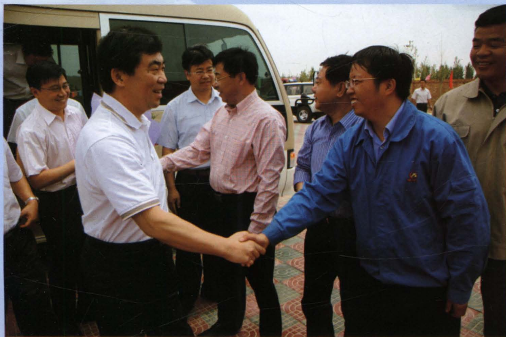
2006年6月13日，华电集团总经理曹培玺到灵武电厂工程建设现场视察。