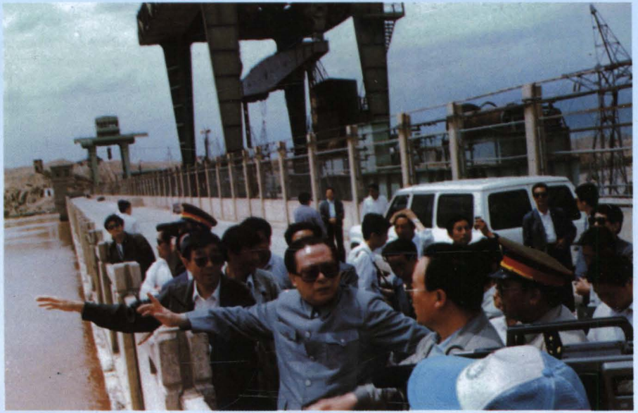
1991年6月17日，江泽民总书记视察青铜峡水利枢纽工程。