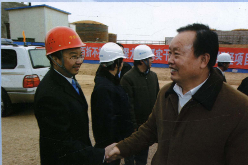
2009年2月12日，自治区党委书记陈建国在烯烴动力站项目工地视察。