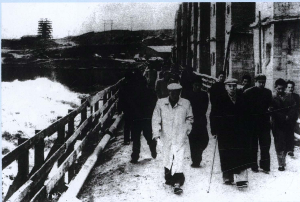
1963年10月18日，董必武副主席视察青铜峡水利枢纽工程施工现场。