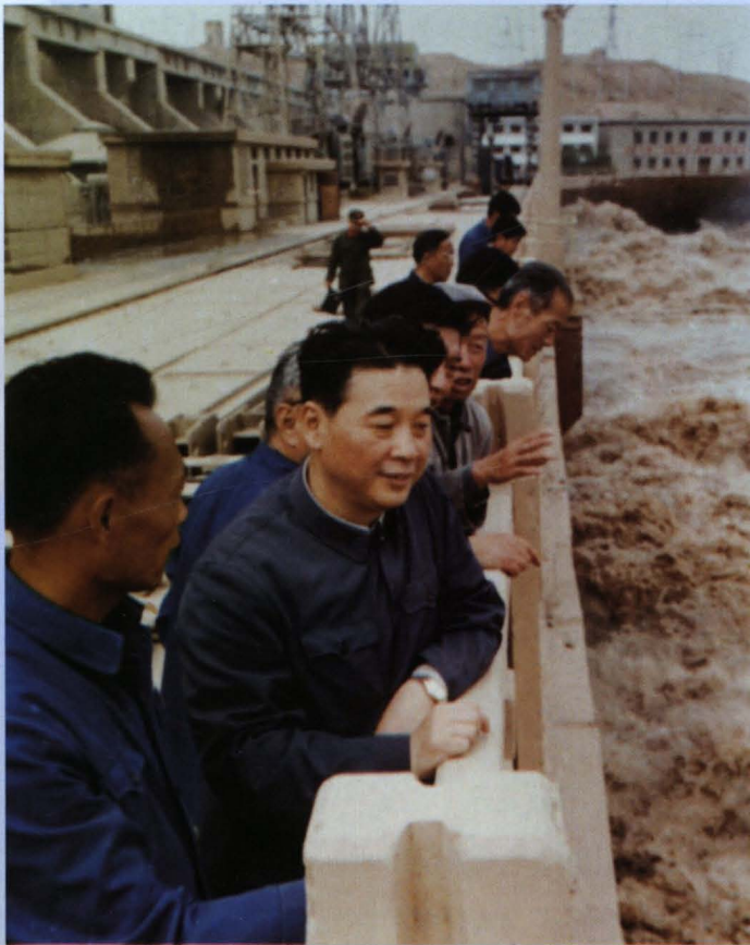
一九八一年九月二十二日，时任水电部副部长李鹏在青铜峡水电站视察防汛工作。