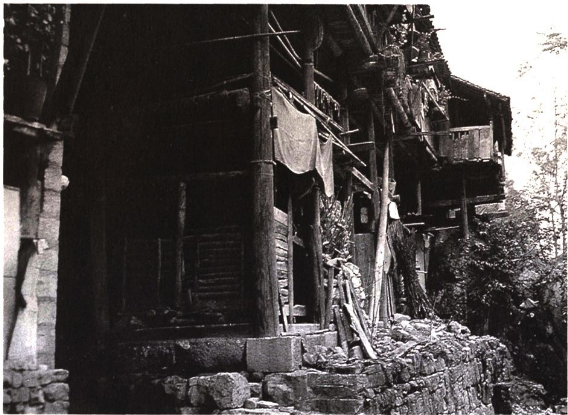
吊脚楼底层是养牲畜和堆放杂物的好地方，这是吊脚楼合理利用空间的绝妙之处

的部落内以血缘和亲缘为纽带的群体关系上升为以地缘为纽带的群体关系，这大大地有利于人种的改良和先进文化的传播。血缘关系——亲缘关系——地缘关系——业缘关系的发展模式是人类社会生产方式和社会形态发展所决定的。