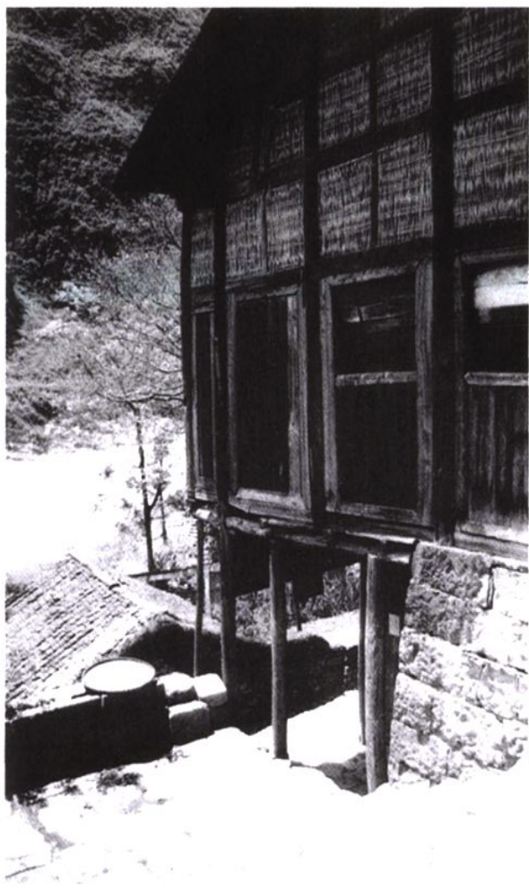
具有巴渝本土山地民居建筑特色的吊脚楼