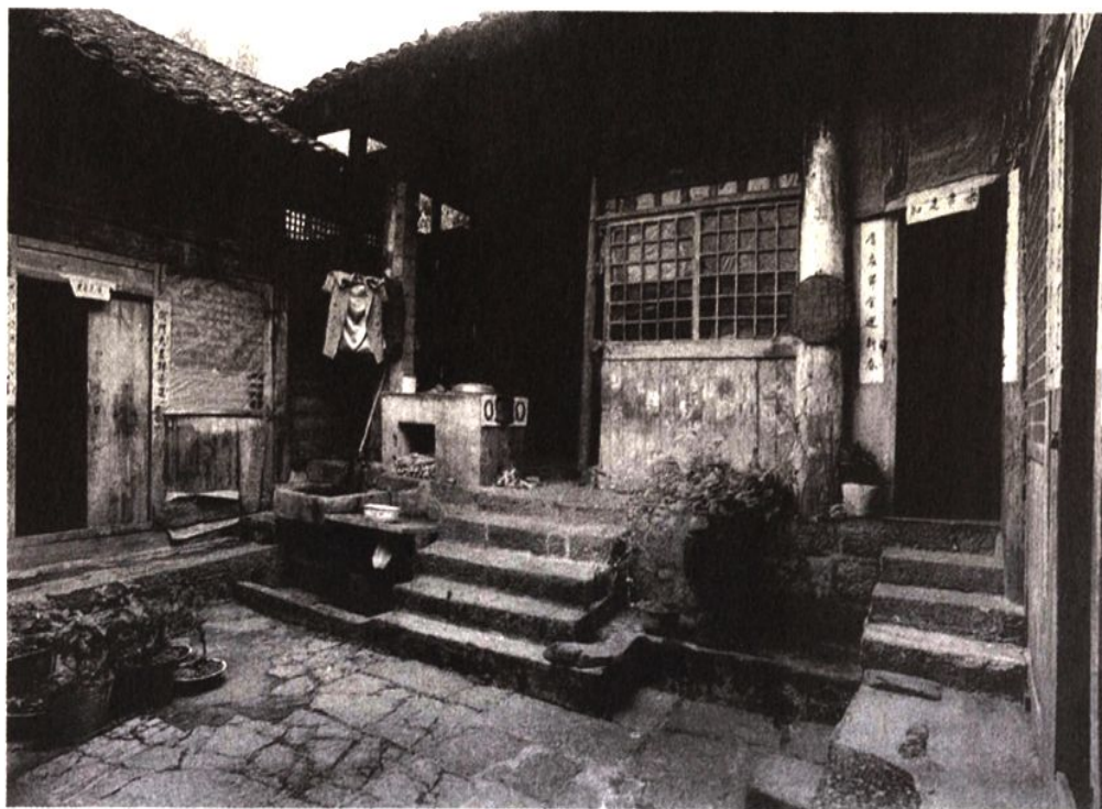
黔东南地区的一座建于清代的祭祀土司的庙宇，它属较典型的巴渝本土建筑风格

体和党、政、军机构内迁来渝。其中相当多的人在抗战胜利后仍留驻重庆，成为永久移民。