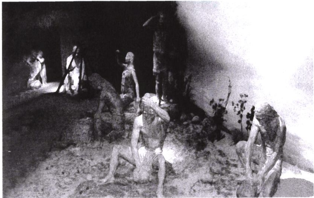
万州苏和坪房址是三峡地区保存最好的新石器时代建筑遗址

佛教文化和艺术传入中国近千年后，到了宋代，到了大足，在浓厚的巴渝文化的滋养造化中，完成了它的中国化、本土化的过程，大足石刻成为中国佛教造像艺术的经典之作，成为佛教艺术中国化的代表。1999年，大足石刻被列入联合国教科文组织的世界遗产名录，成为全人类的文化遗产。这是重庆对世界历史和文化作出的第二个贡献。