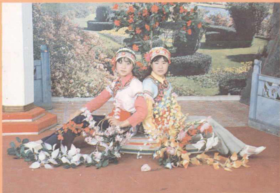
安化彝族少女服饰