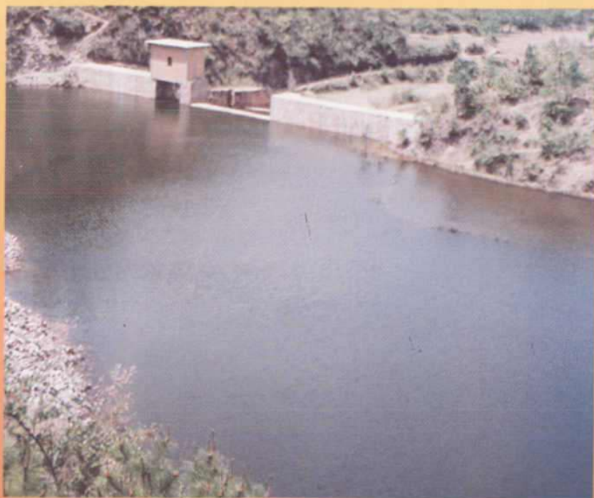
位于董炳河中流的拦河闸