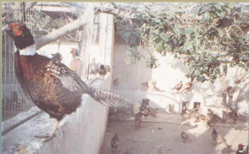
安化乡党职校饲养的七彩山鸡