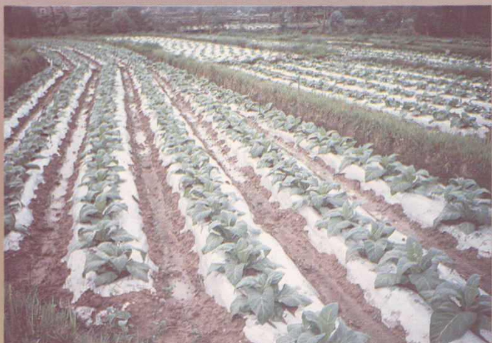
烤烟独垄地膜覆盖