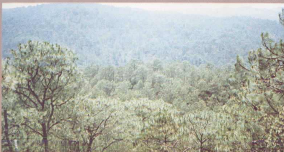
安化大山万顷松涛