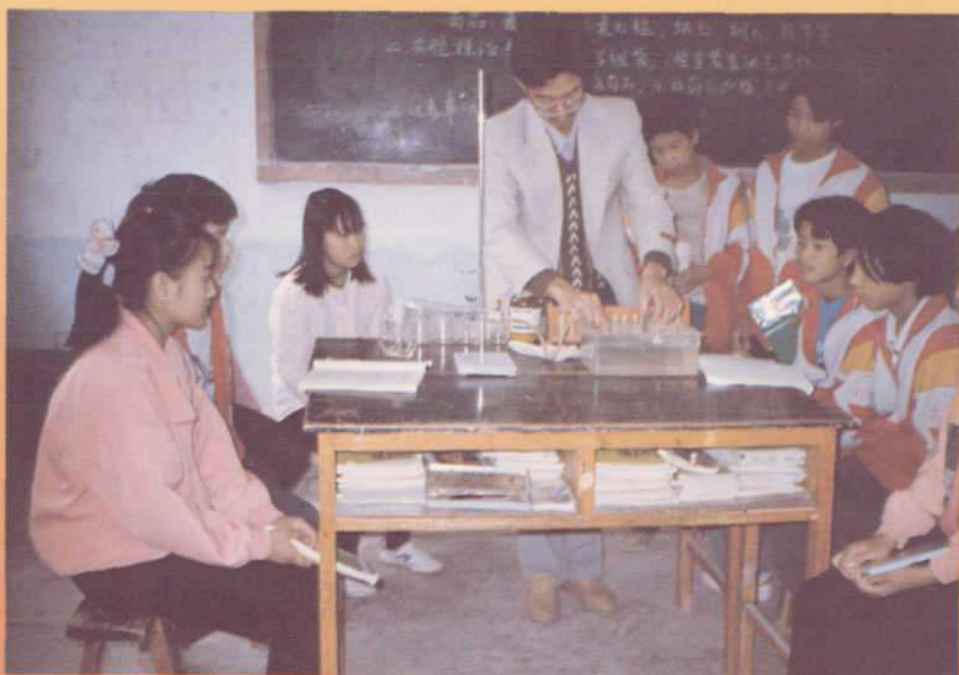
乡中学教师正在指导学生做实验