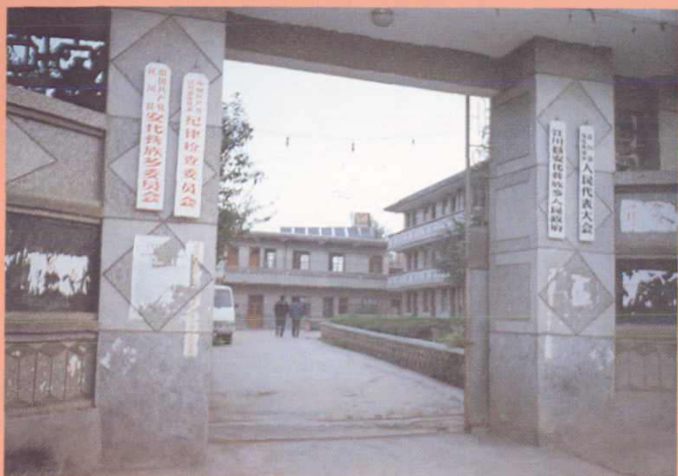
中共江川县安化乡委员会 江川县安化彝族乡人民政府