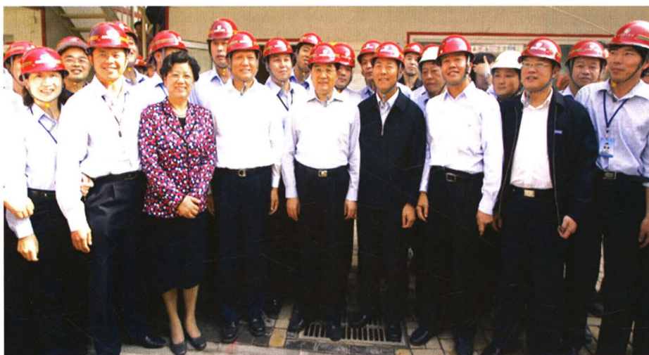
胡锦涛视察国家会议中心工程（2006）