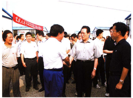
周永康慰问集团抗震救灾工程援建人员 (2008)