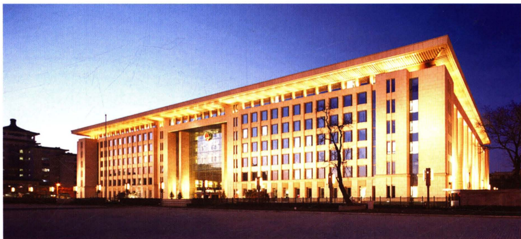
全国人大机关办公楼 (2010)