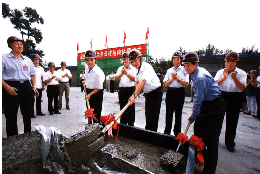
吴邦国出席全国人大机关办公楼工程封顶仪式（2009）