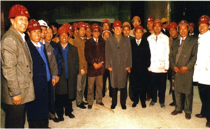
江泽民视察北京西站工程（1995）