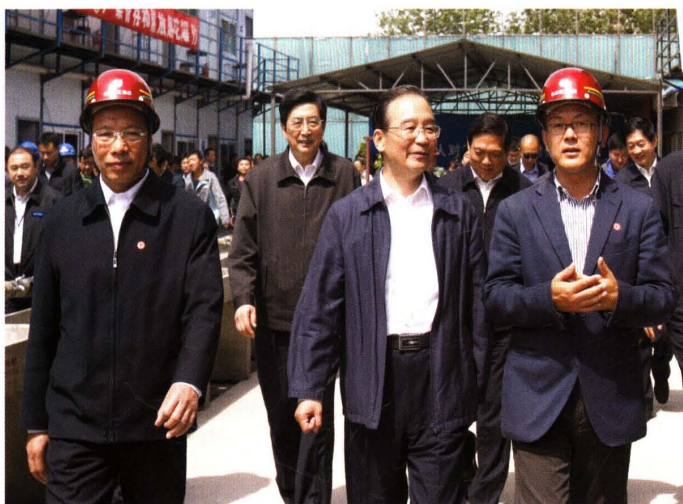
温家宝视察王四营保障性住房工程（2010）