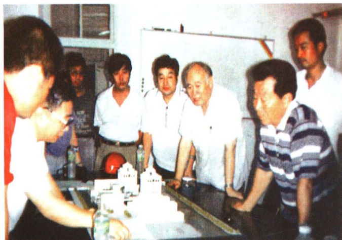
李瑞环视察全国政协办公楼工程（1994）