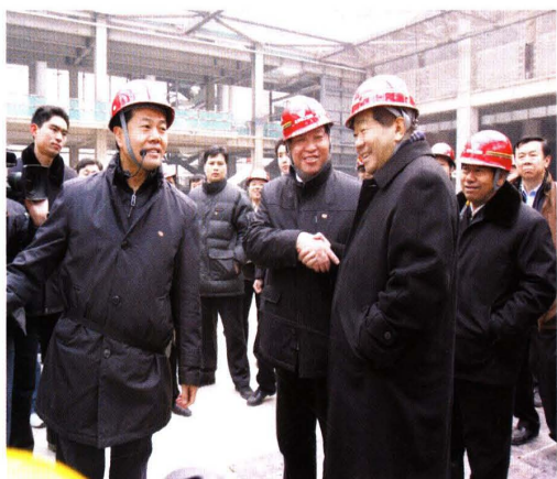
贾庆林视察国家会议中心工程（2007）