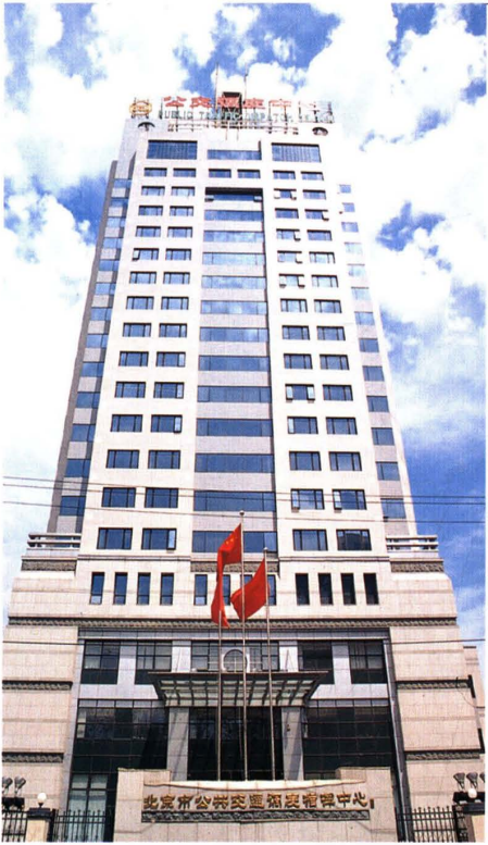
北京市公共交通调度指挥中心 (1999)