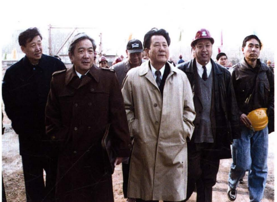
张百发视察外交部办公楼工程 (1997)