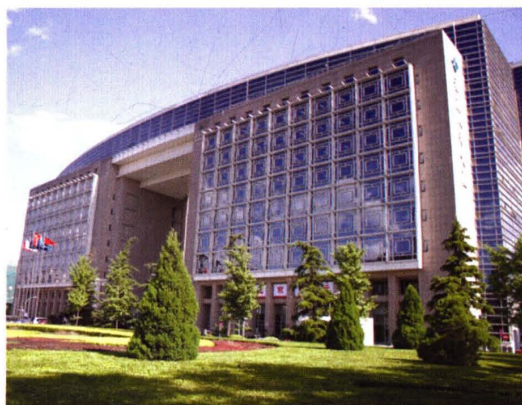
北京国际金融大厦 (1998)