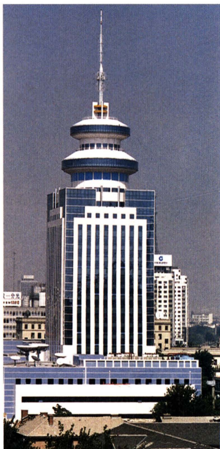
中央人民广播电台 (1996)