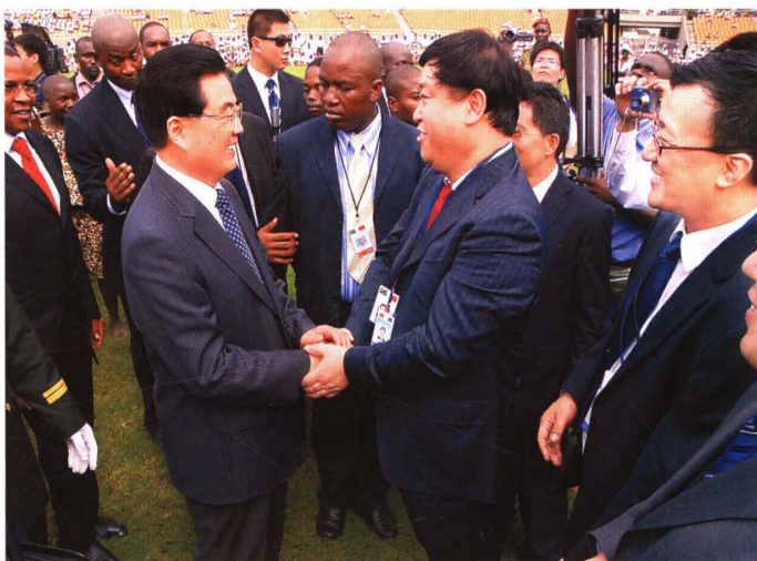
胡锦涛会见集团坦桑尼亚体育场建设者（2009）