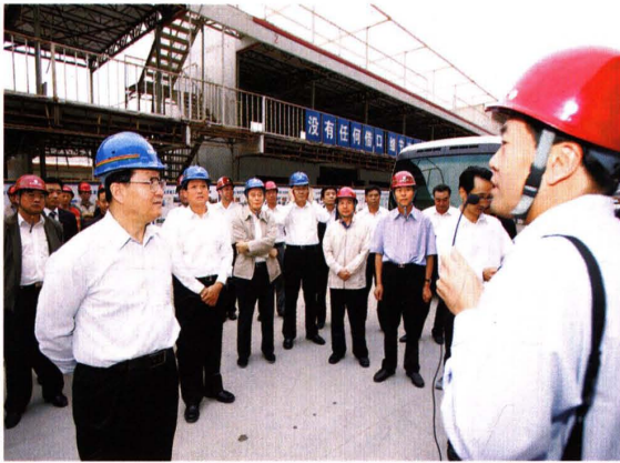
李长春视察国家会议中心工程 (2007)