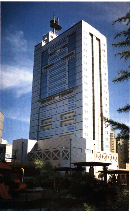
全国海关信息管理中心 (2002)