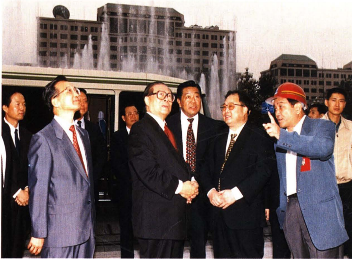
江泽民视察东方广场工程（1999）