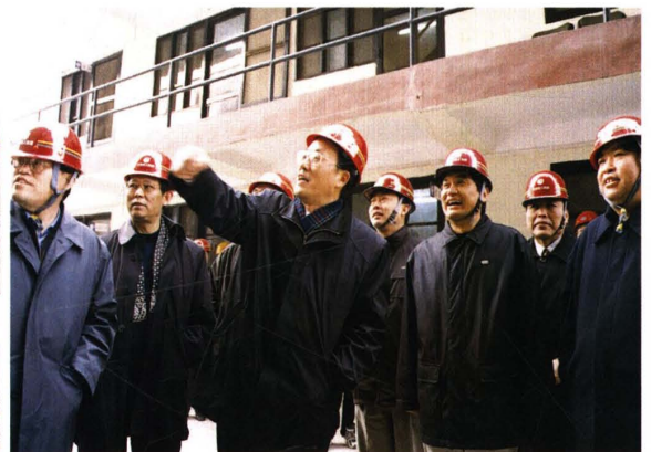
刘敬民视察京西宾馆改造工程 (2002)