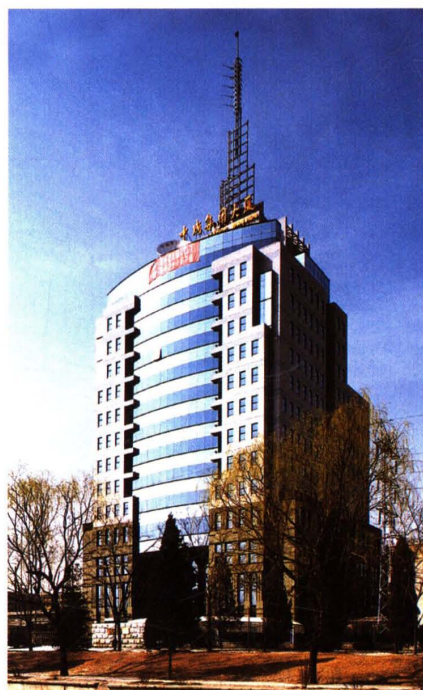
中国成套公司综合办公楼 (1997)