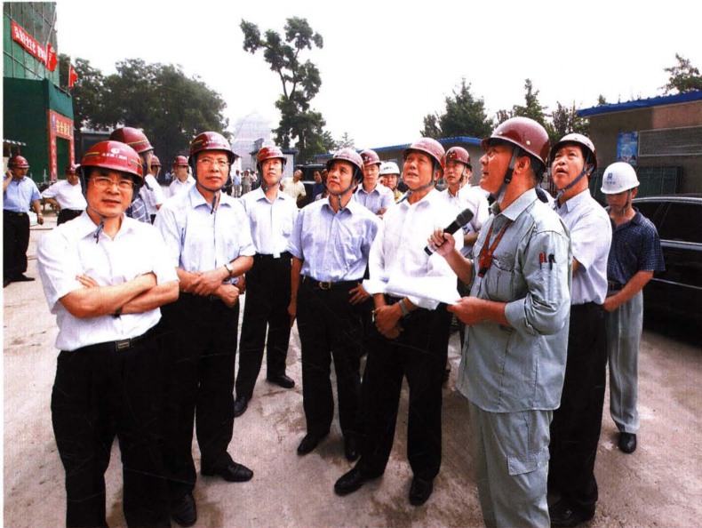
刘淇视察全国人大机关办公楼工程 (2009)