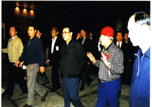
李鹏视察东方广场工程（1999）