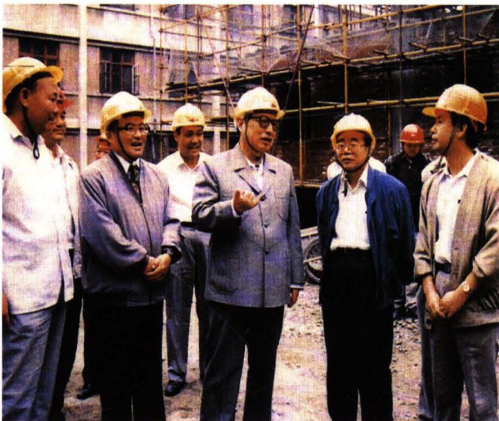
乔石视察人大办公楼工程（1993）