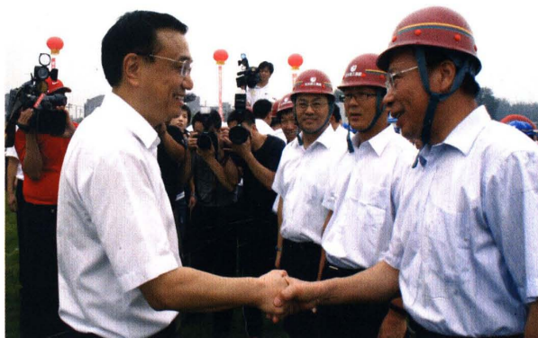
李克强视察定福庄保障性住房工程（2010）