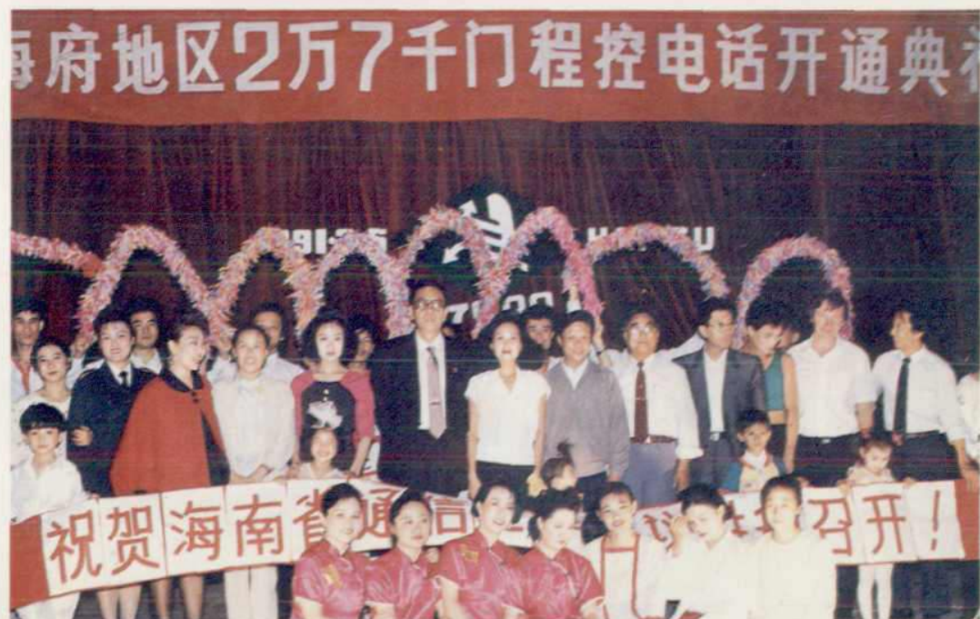
△1991年3月5日，海府地区2.7万门程控电话开通，实现了市话交换程控化