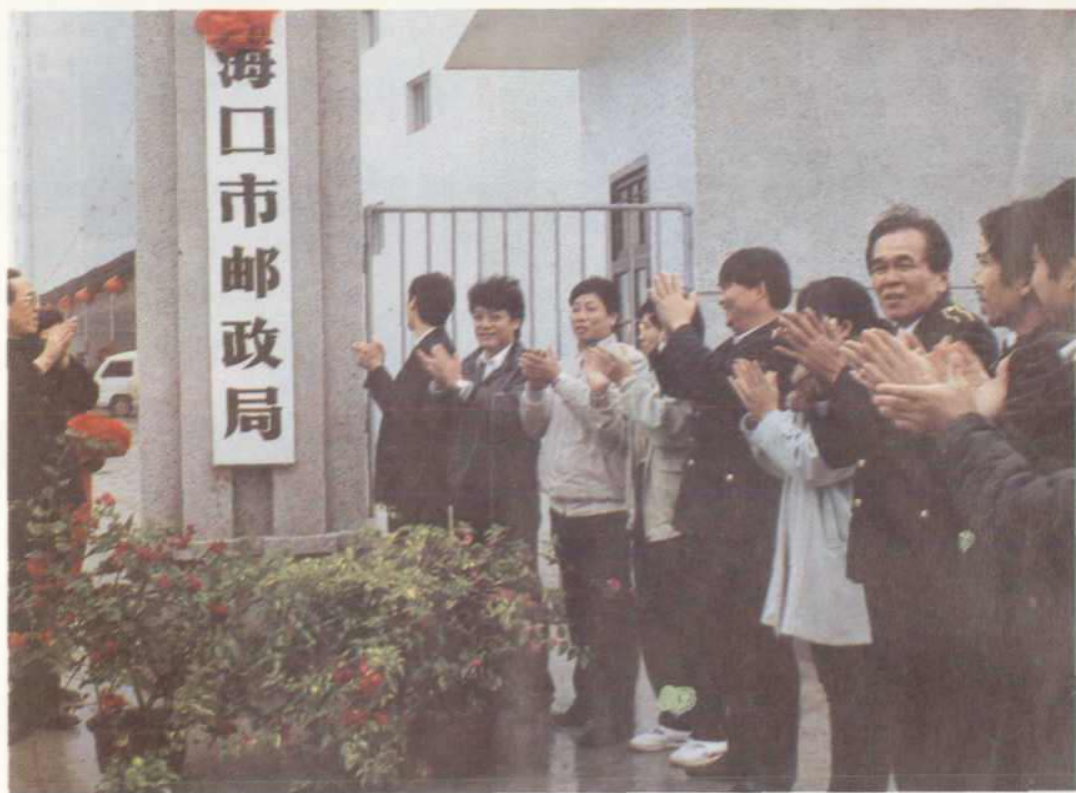
△1991年12月，海口市邮政局成立揭牌