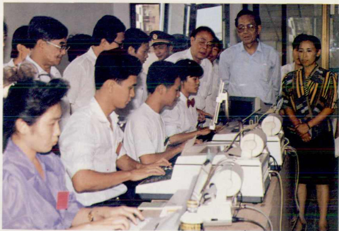
△ 电传电报练功比赛