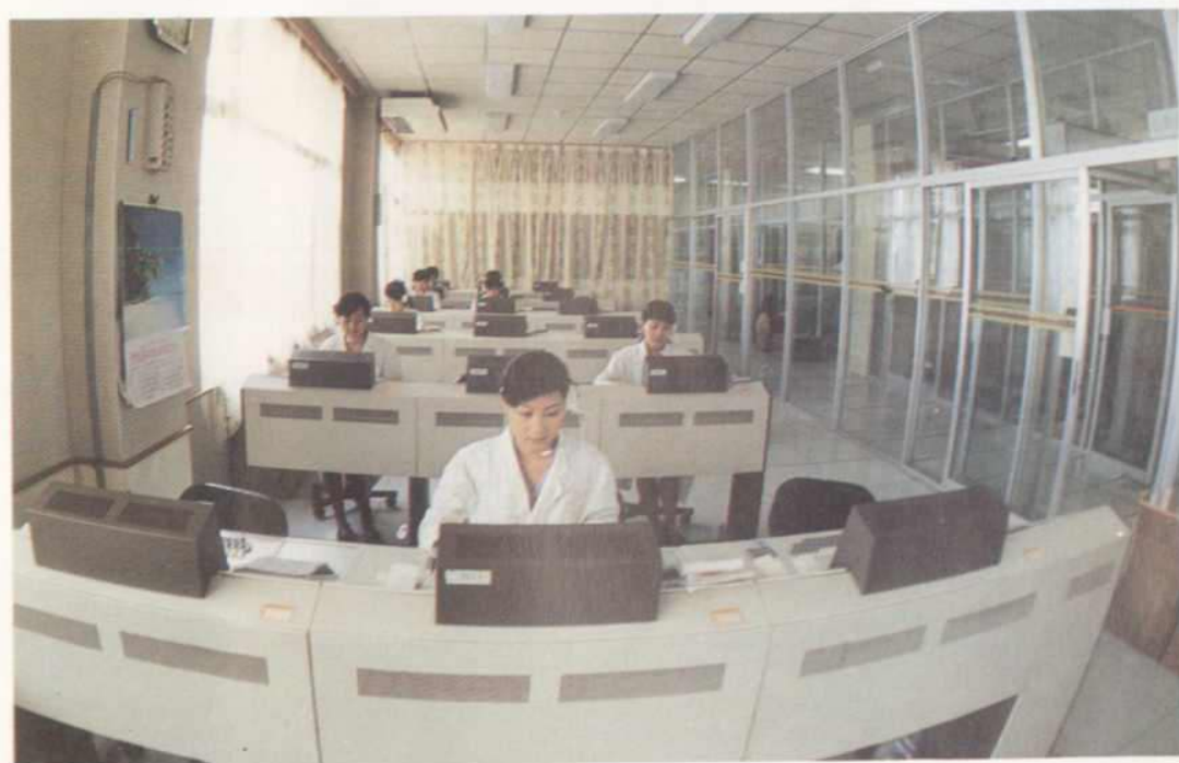
△通讯机房 126 台