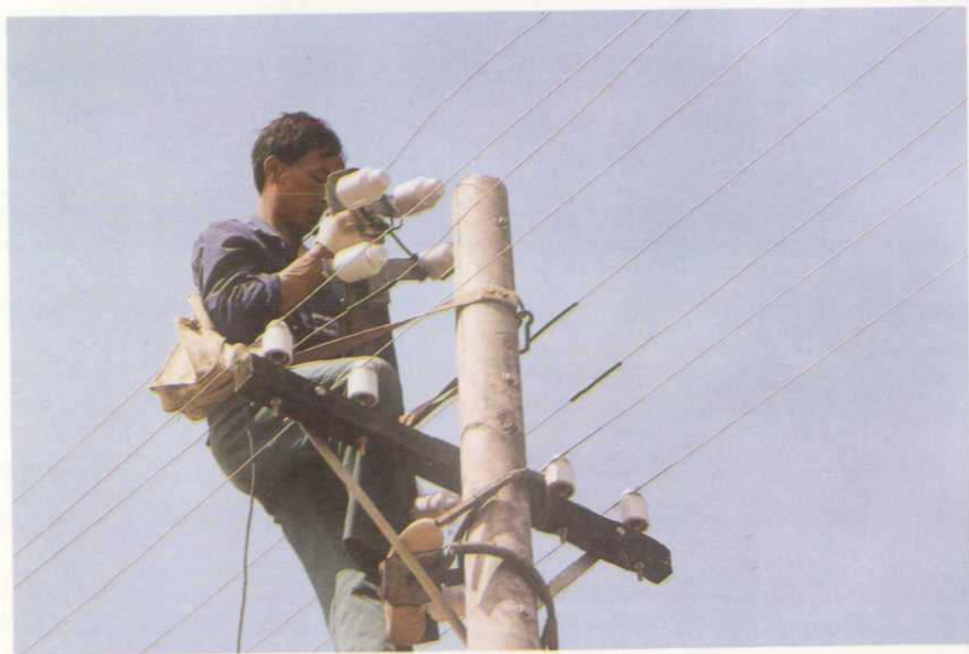
△ 线路架设练功比赛