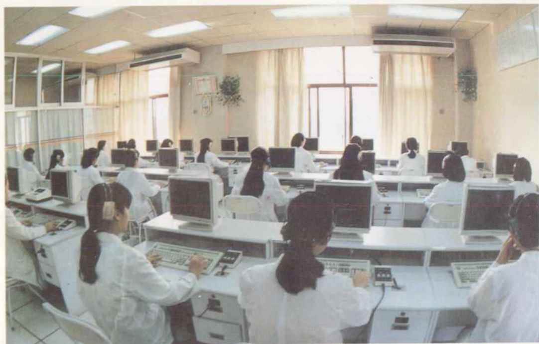
△通讯机房 173 台