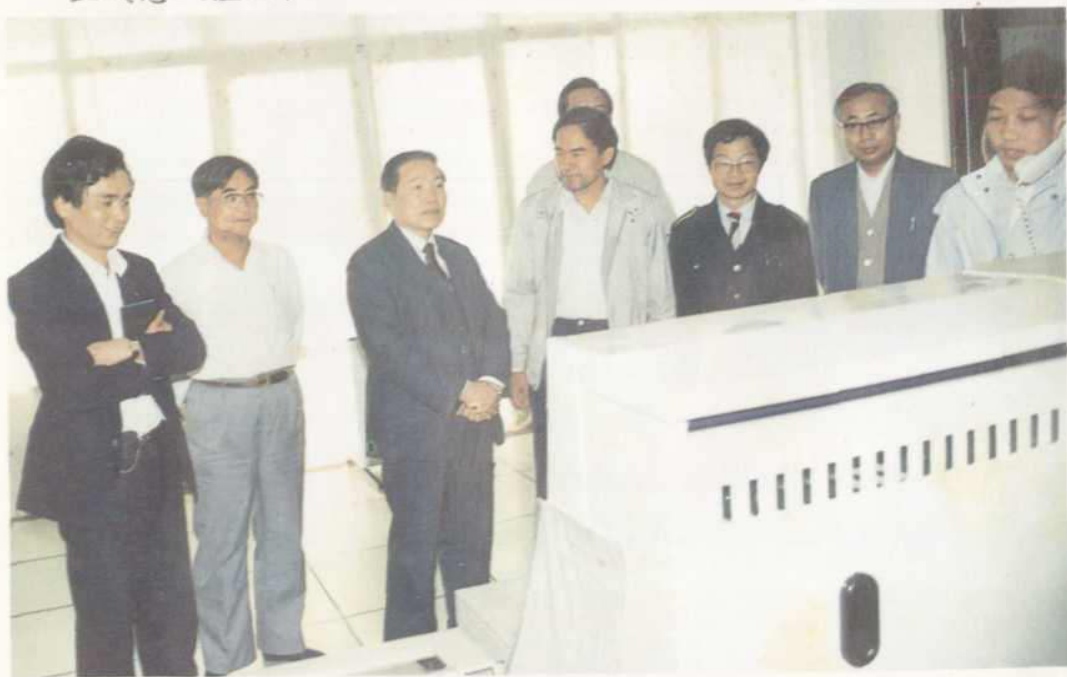
△邮电部部长杨泰芳（左三）视察海口程控机房