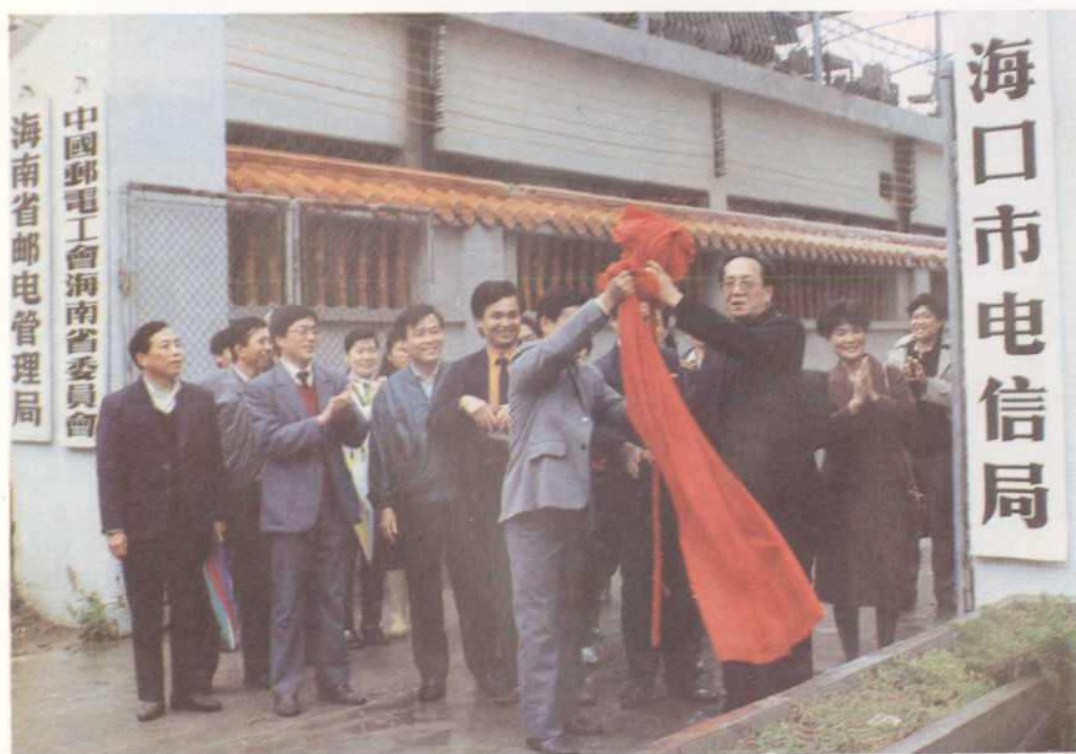
△1991年12月，海口市电信局成立揭牌