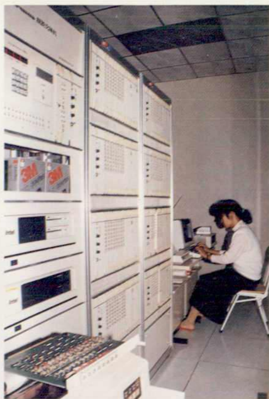
△电报自动转报机房