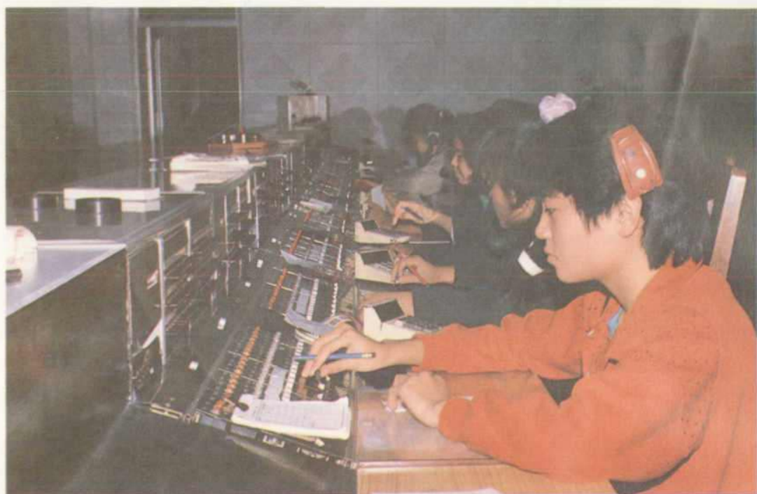
△长话台话务员聚精会神接转电话