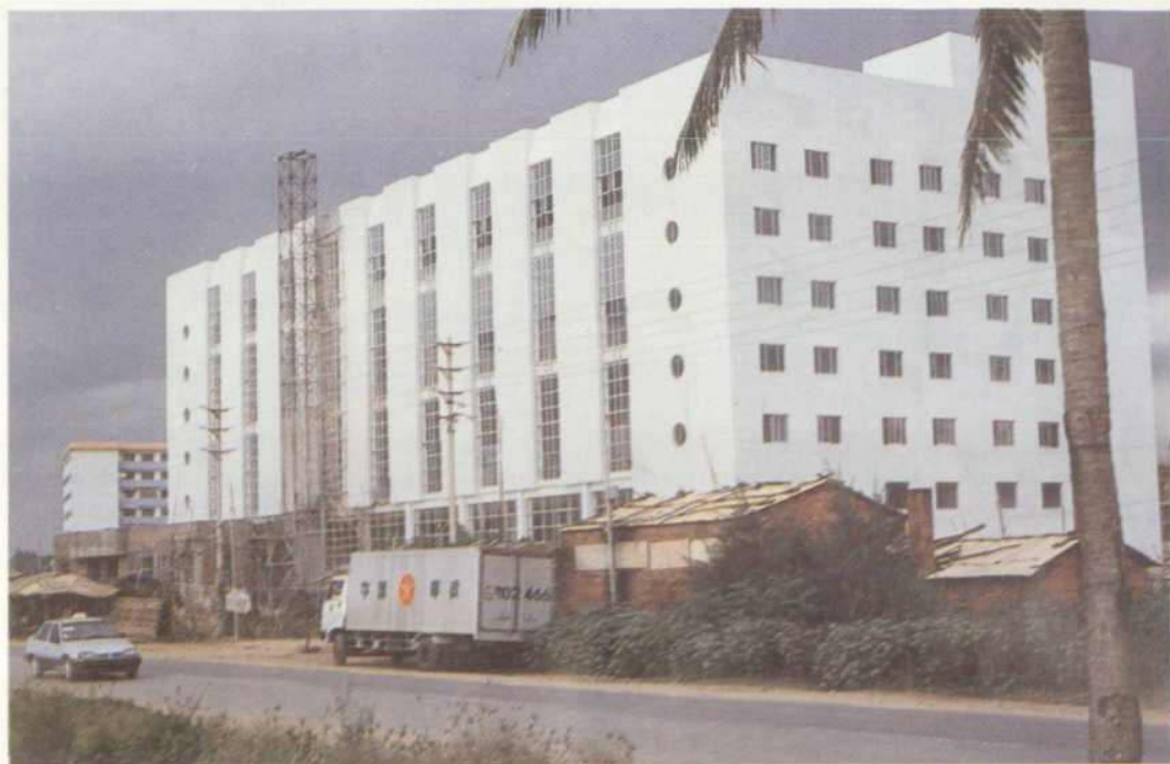
△海口市邮件处理中心