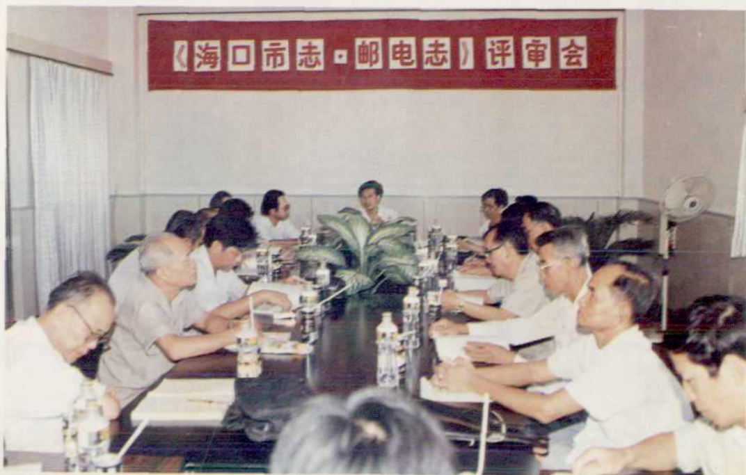
△《海口邮电志》审稿会