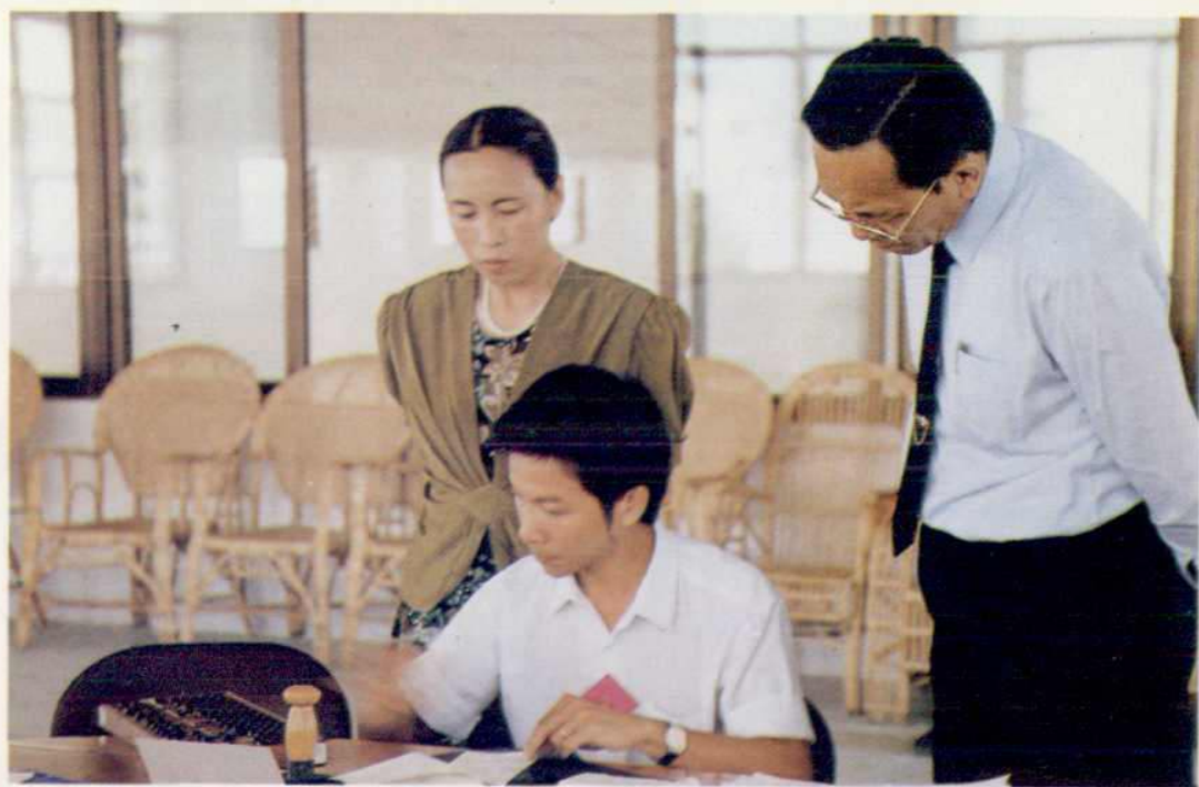
△ 邮政营业练功比赛