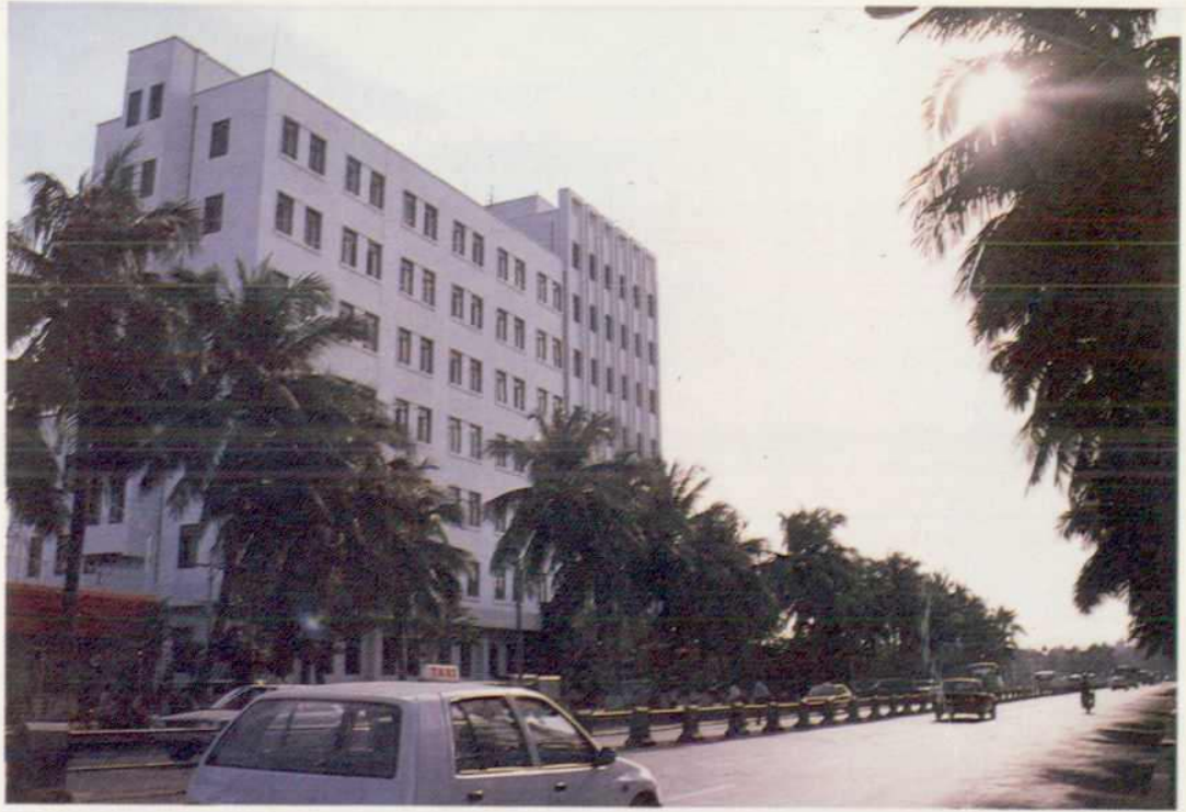
△白坡通讯大楼（市电信局）