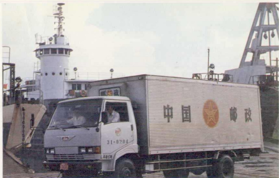
△邮车到码头接运邮件