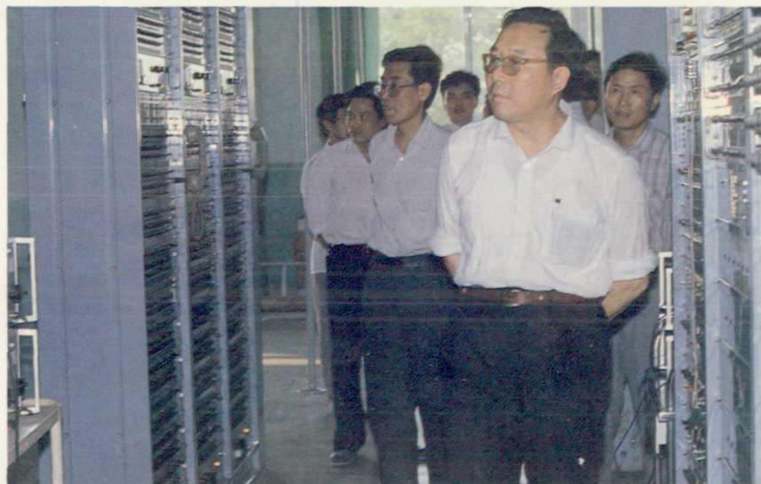
△邮电部副部长吴传基视察海口通讯机房