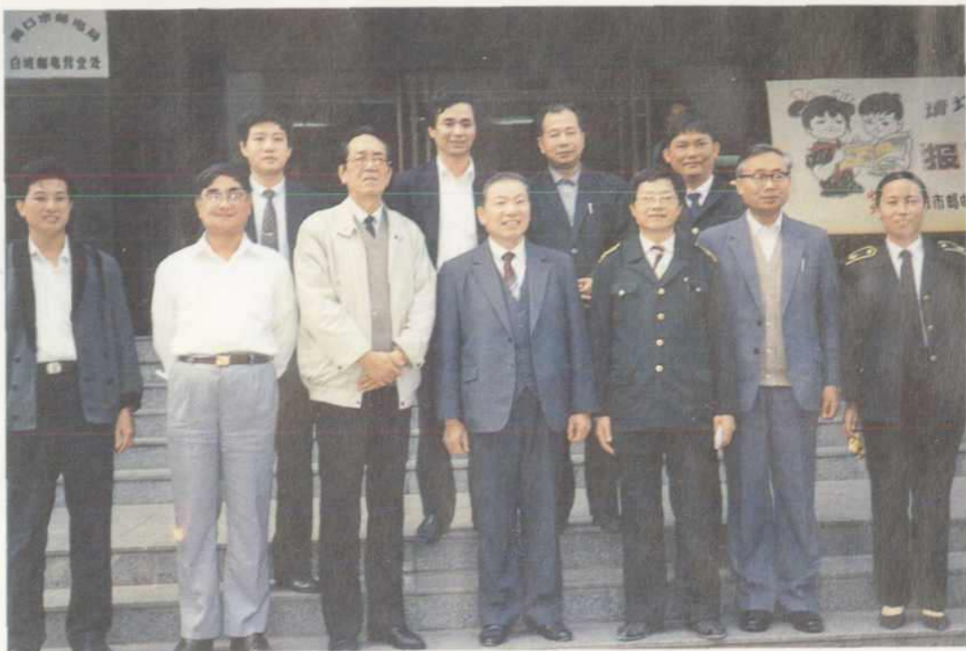
△1990年12月8日，邮电部长杨泰芳来琼视察工作，同省、市邮电局领导合影。前左起：文兴元（市电信局党组书记）、吉太之（省局副局长）、孙甫（省局局长）、杨泰芳（邮电部部长）、谢成杰（市局副局长）、王俊（省局副局长）；后排：市局副局长王祖益（左二）、市局副局长常志嘉（左三）、市局工会主席王式忠（左四）