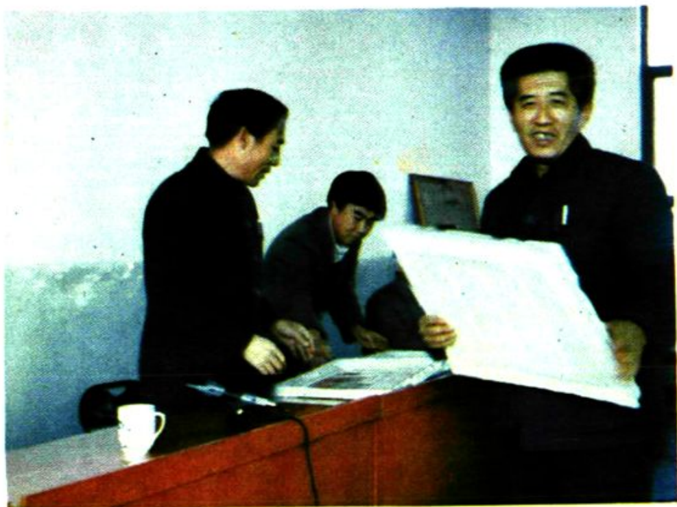
马文亮市长在发奖