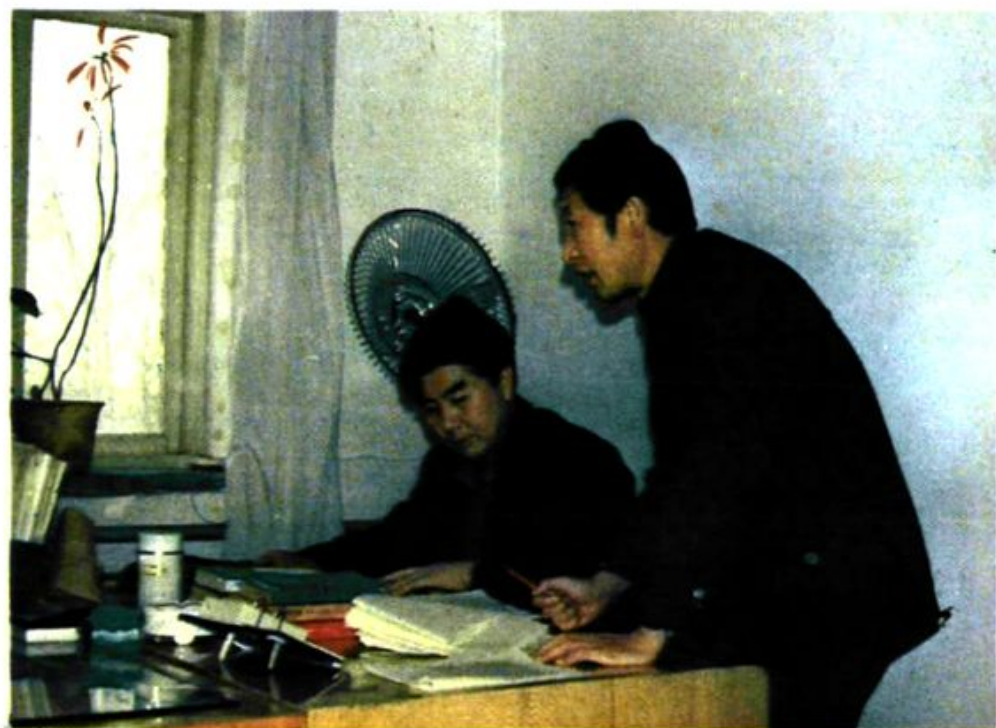
市统计局领导研究工作