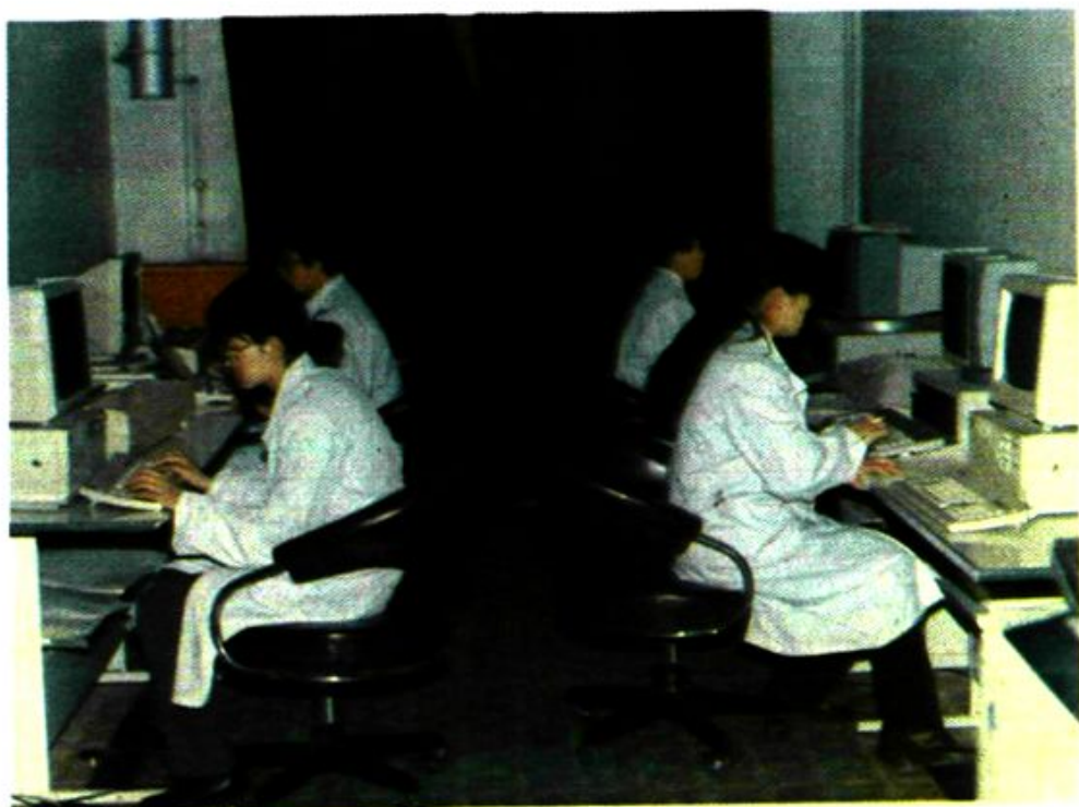
市统计局计算站工作室一角