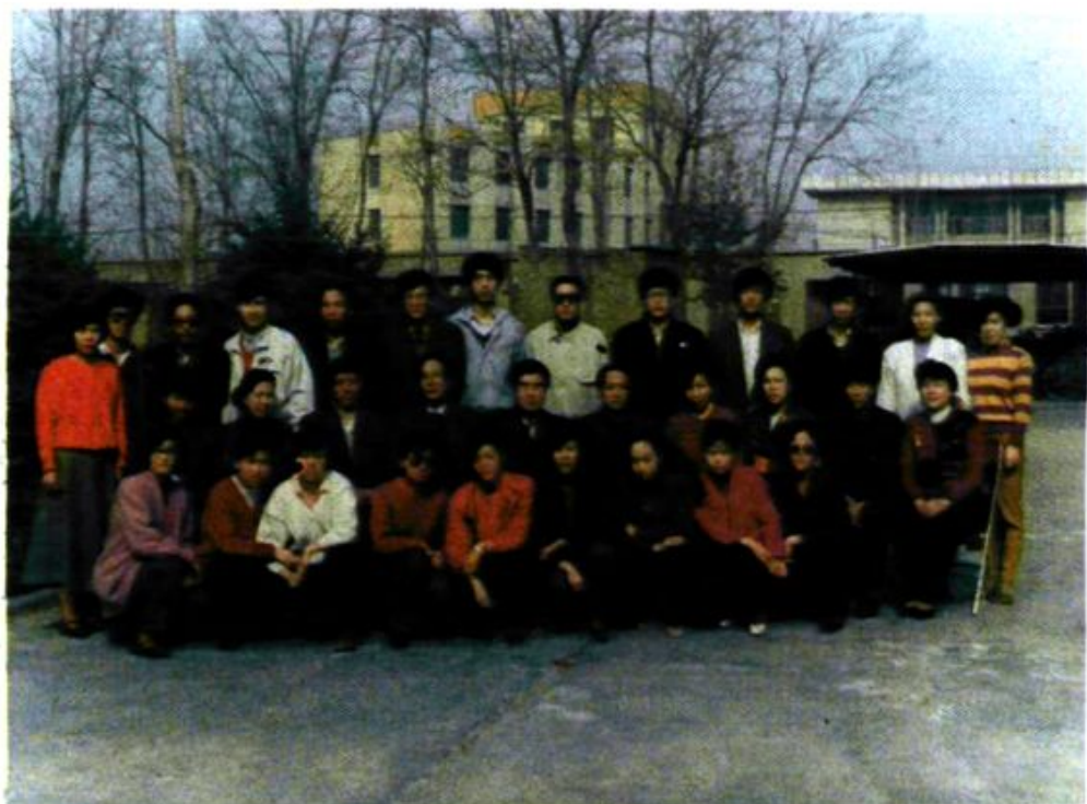
市统计局全体同志合影