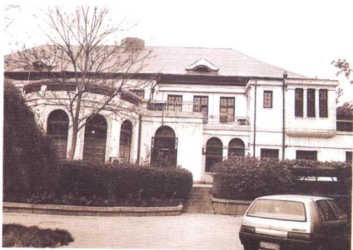
1971—1984 年天津动植物检疫所 办公地址 (一楼右侧房间)