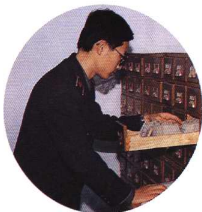
天津动植物检疫局图书资料室