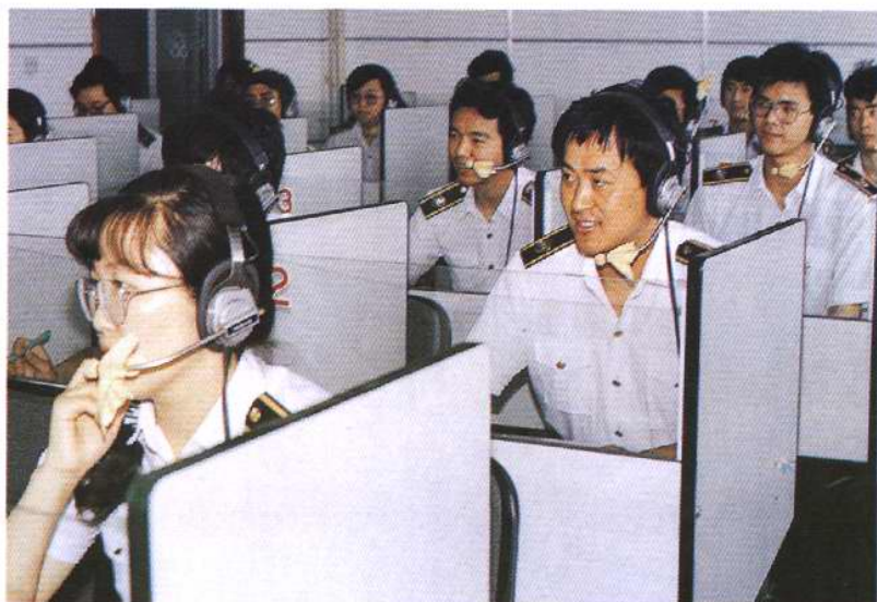
受农业部委托，从1981年起，天津动植物检验检疫局组建全国口岸培训中心，承担本系统在职干部业务培训任务，图为来自各口岸局的检疫官在外语听力课教室上英语听力课