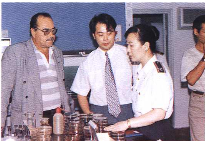
向外宾讲解实验室操作程序