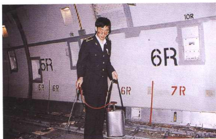
对进境飞机进行防疫消毒