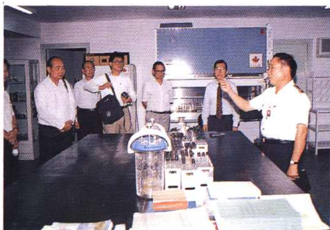
向外宾介绍实验室情况