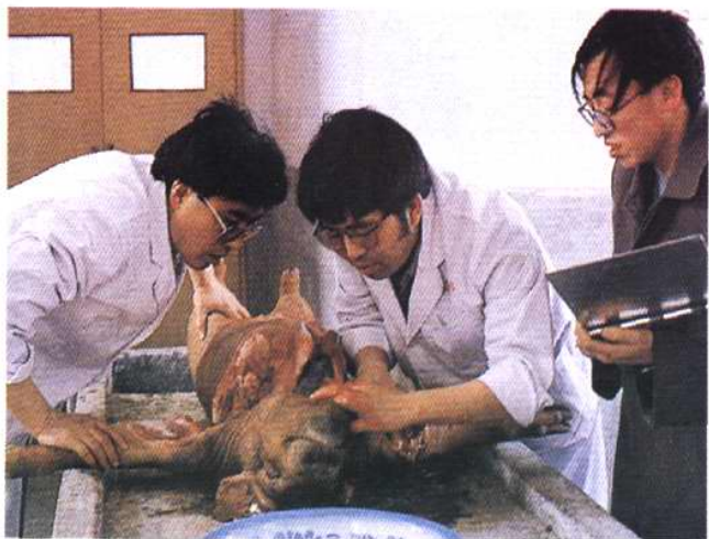
对进境病猪进行尸检