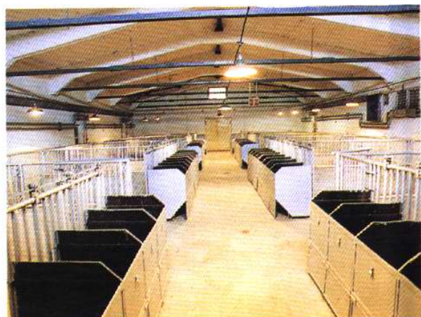
进口动物检疫隔离场内外景