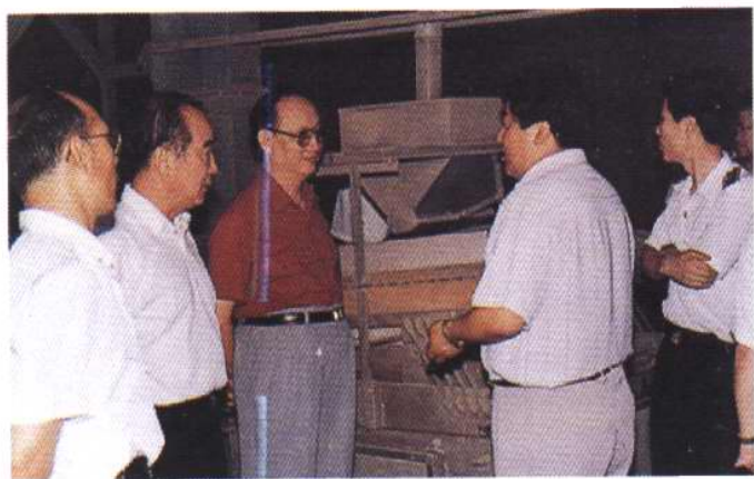
1996年6月，天津市政协医卫体委员会领导视察天津动植物检疫局