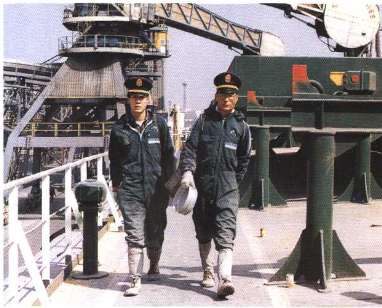
登轮检疫进口粮食