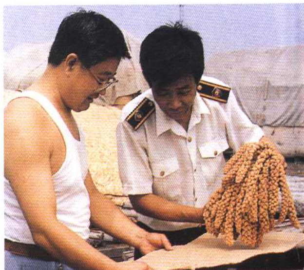
对出口谷穗进行检疫