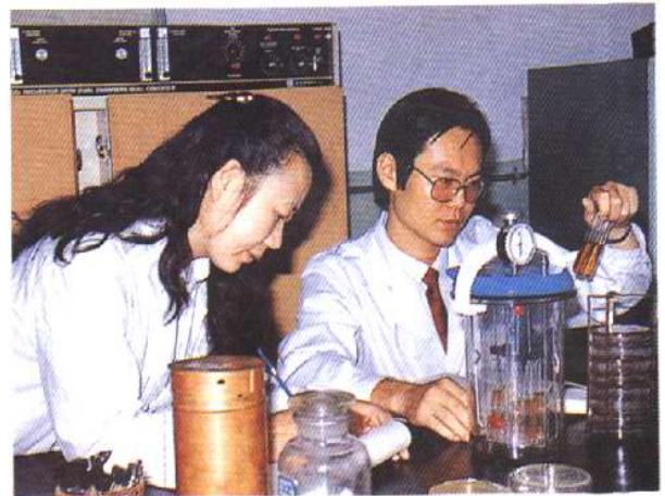
病原菌的培养观察