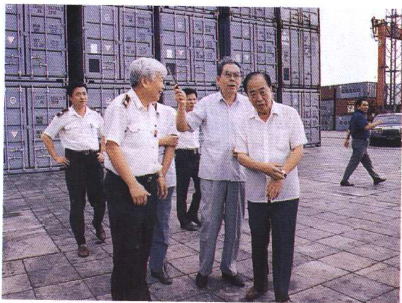
1994年9月，天津市人大常委会主任聂璧初（右1）、全国人大法工委副主任邬福肇（右2）视察天津口岸动植物检疫工作