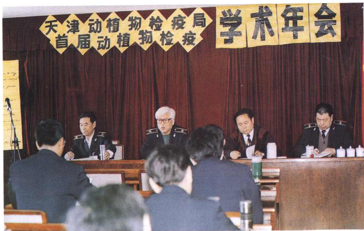
1996年12月，天津动植物检疫局举办首届动植物检疫学术年会