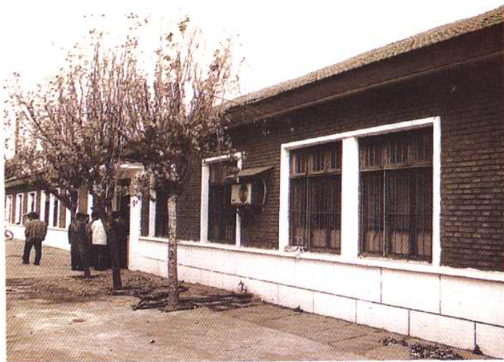
1966—1980 年塘沽动植物 检疫所办公地址