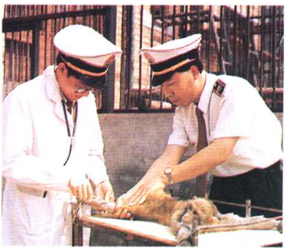
对实验动物进行临床诊断