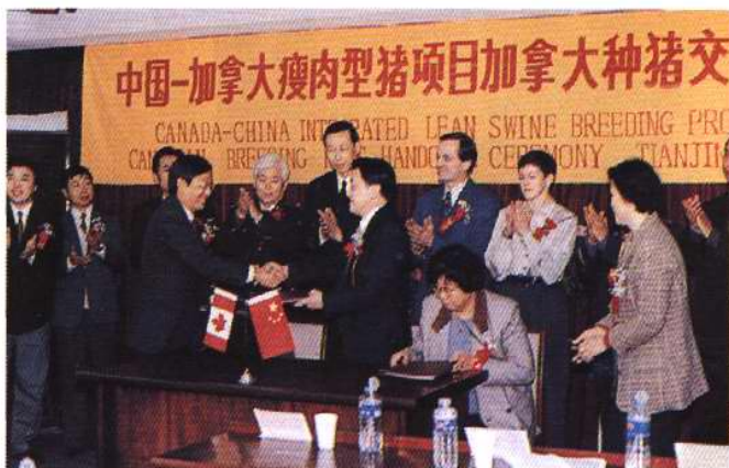
1996年3月12日,在天津动植物检疫局举行中国—加拿大瘦肉型猪项目加拿大种猪交接仪式