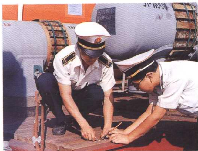
检疫官员检疫船体带虫情况