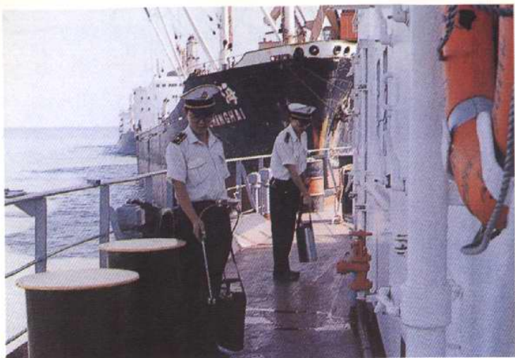
对进境船舶甲板进行防疫消毒