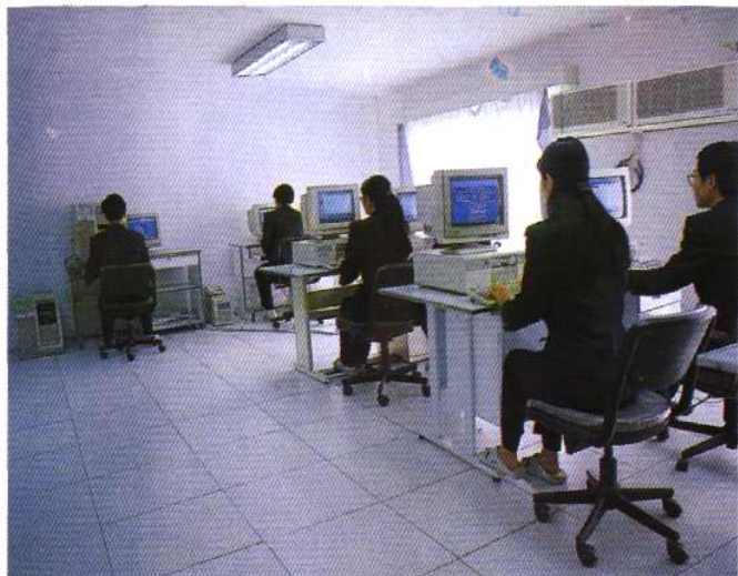
天津动植物检疫局计算机机房