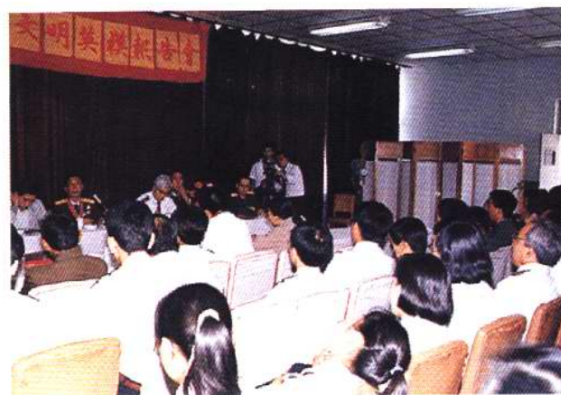
1991年6月，上甘岭战斗英雄吴世金为天津动植物检验检疫局职工作英模报告