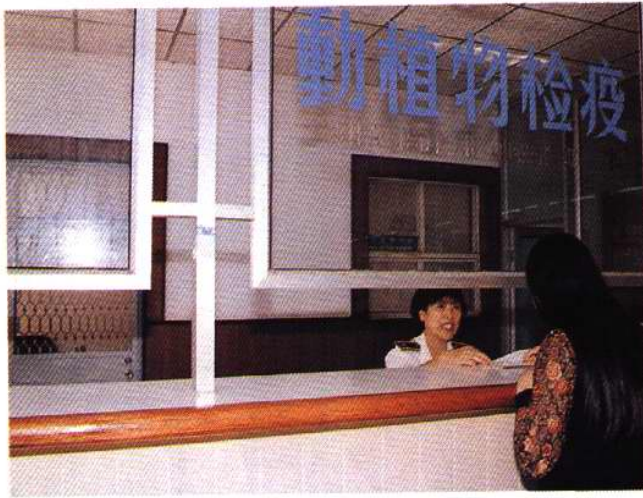
天津滨海国际机场动植物检疫申报窗口