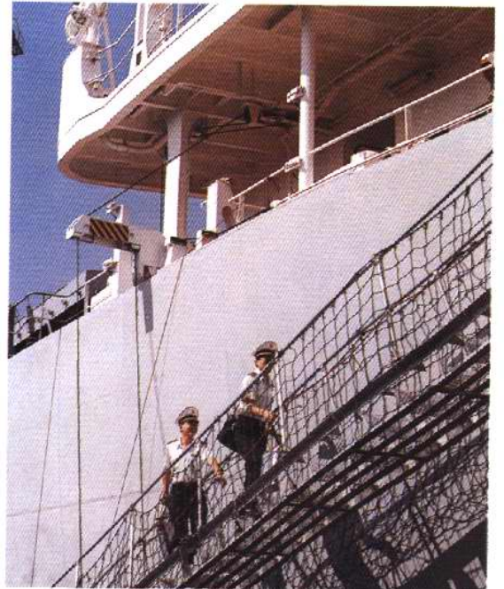
检疫官员执行外轮梯口消毒任务