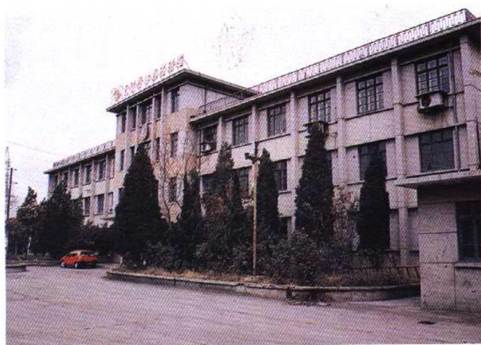
1981—1993 年塘沽动植物检疫所办公地址