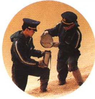
轮船内筛选进口大豆