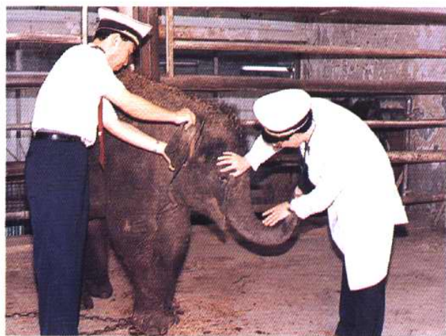
对进境幼象进行临床检查