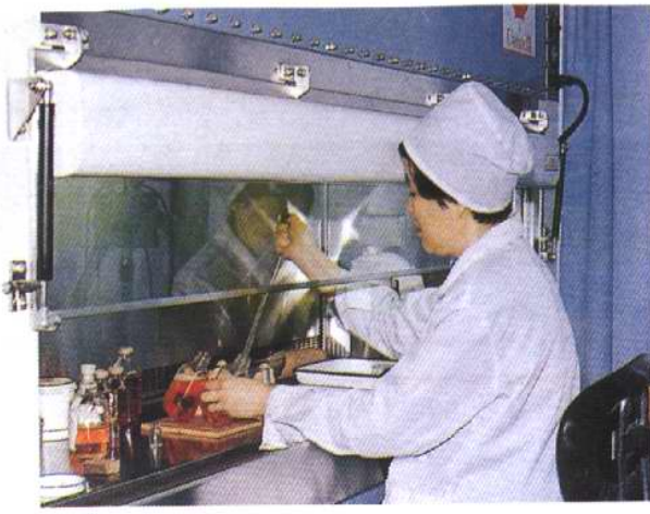
在动物病毒实验室进行病毒检测