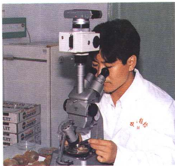
对发现的害虫进行实验室鉴定