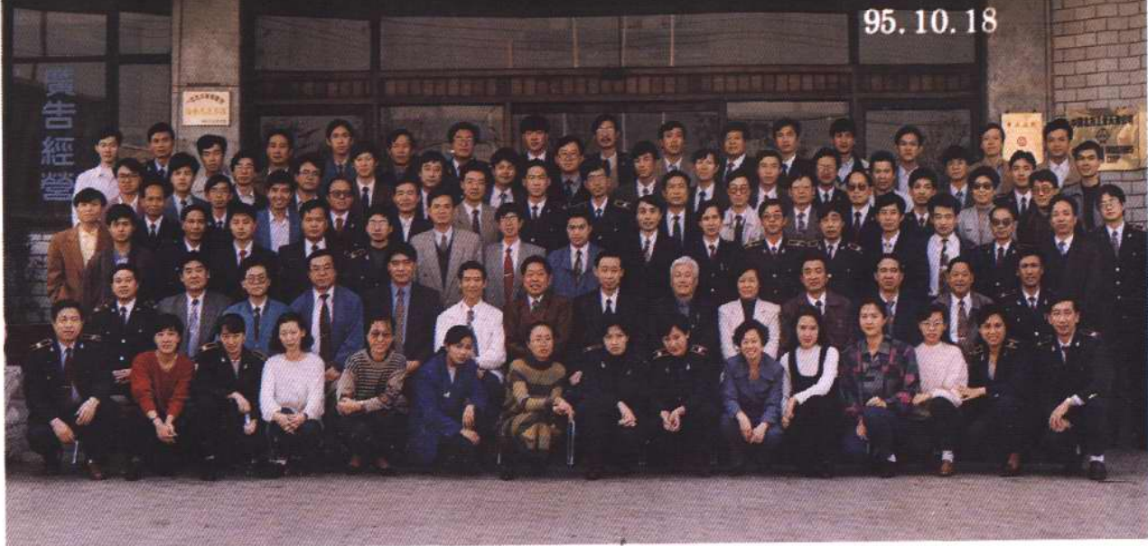
1995年10月，在塘沽北方大厦召开全国口岸动植物检疫、检务管理和计算机应用工作会议，会上对天津动植物检疫局开发的计算机软件进行推广应用