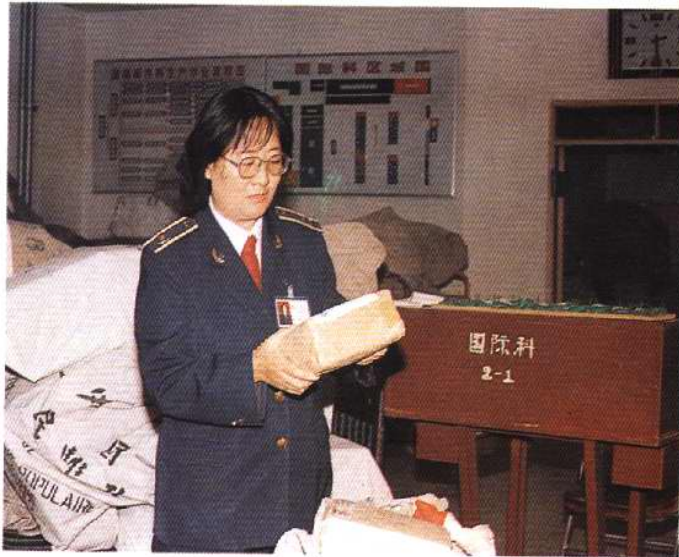
值勤人员在邮件交换局值勤