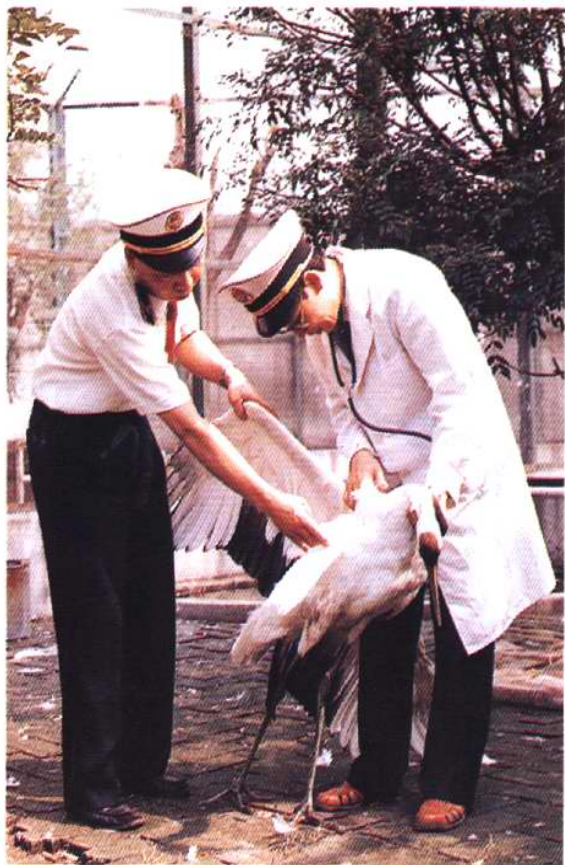
对发病丹顶鹤进行诊断检测