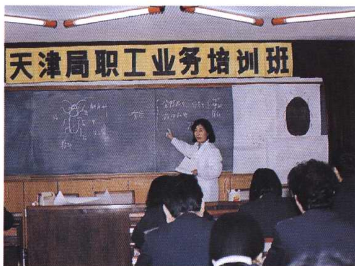
1996年3月，天津动植物检验检疫局举办职工业务培训班