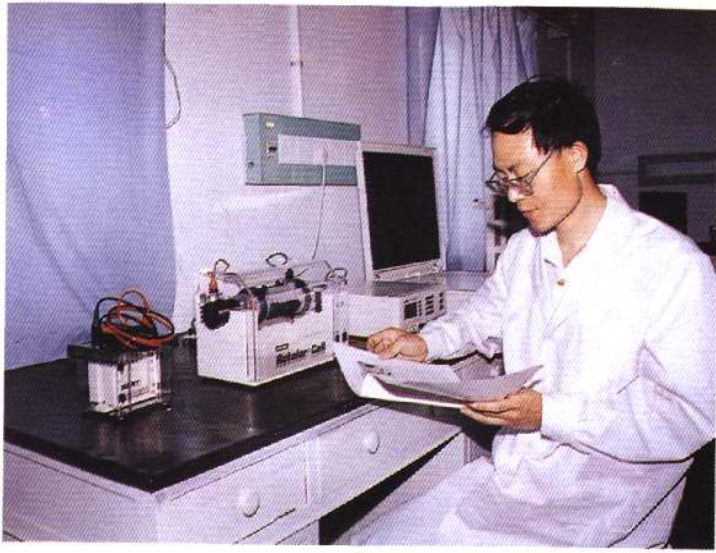
审阅进境种苗单证