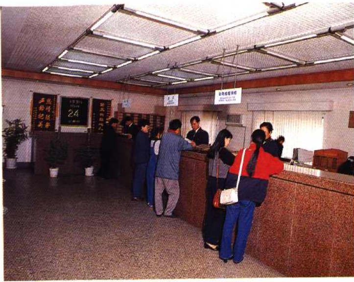
天津动植物检疫局报检大厅