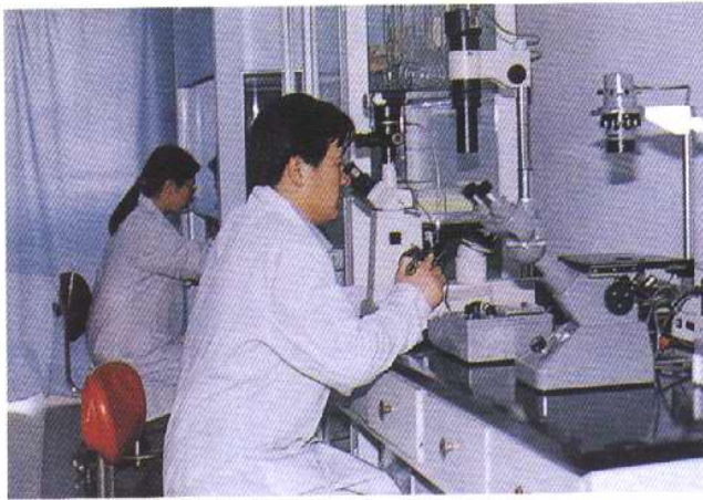
动物疾病病原菌检测