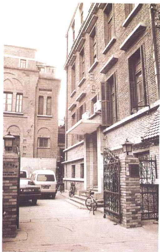
1967—1970 年天津动植物检疫所办公地址 (右侧建筑)