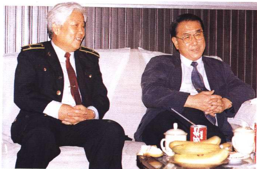
1995年5月，中共天津市委书记高德占听取天津动植物检验检疫局局长杨维长的工作汇报