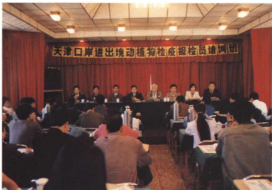
1994年5月，天津动植物检验检疫局举办第一期报检员培训班