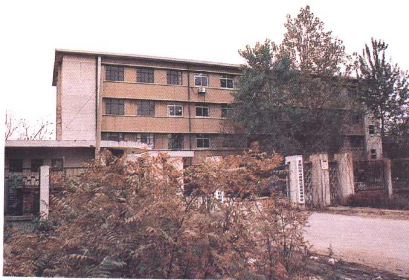
1984—1990 年天津动 植物检疫所办公地址