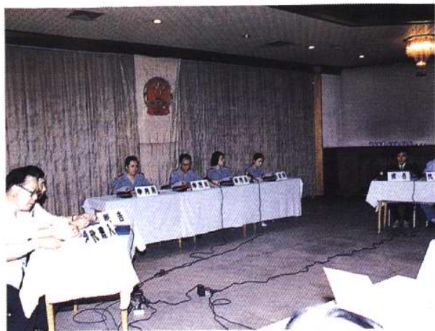
1995年5月，国家动植物检验检疫局在塘沽北方大厦举办第一期执法教育培训班，其间，天津动植物检验检疫局演示模拟法庭