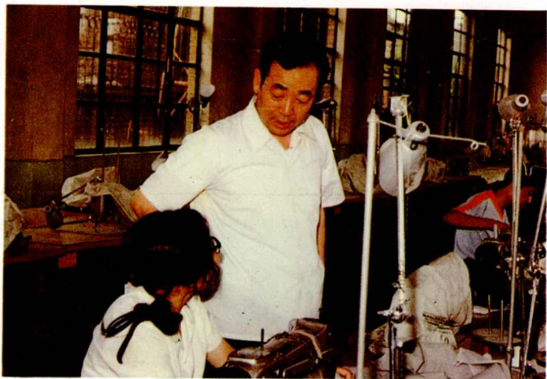
4. 南開區教育局王文忠 局長到天津市服裝職 業學校考察