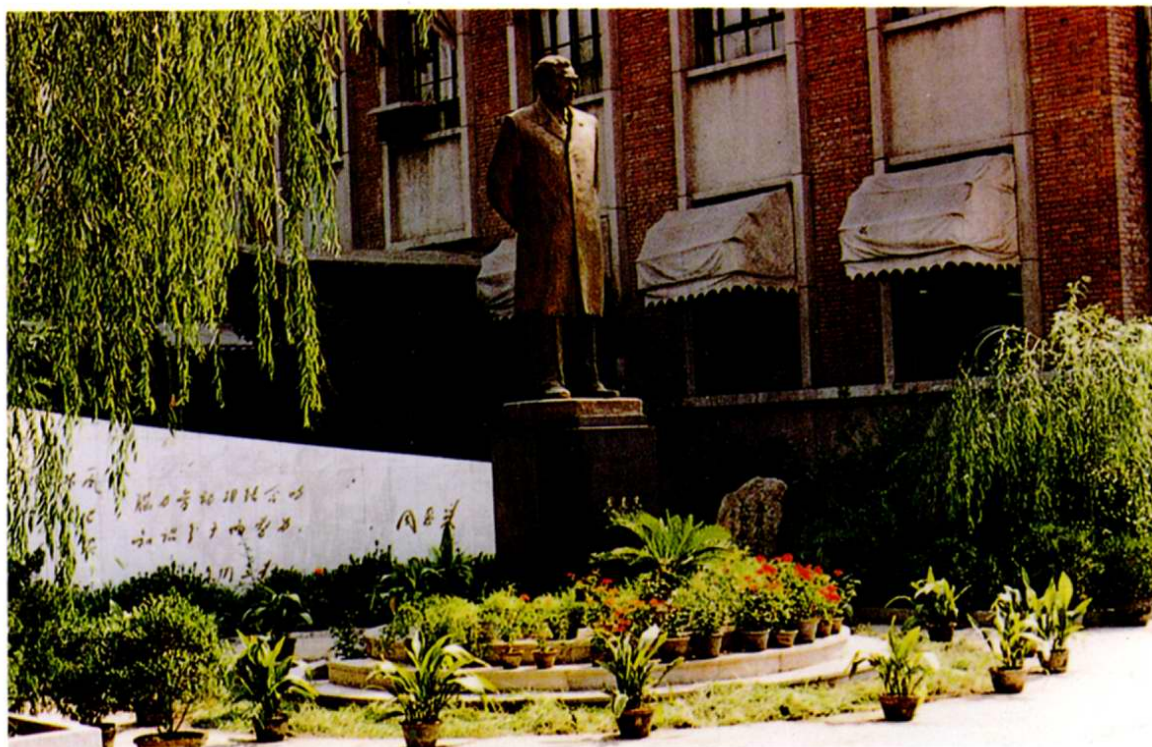
1. 周恩來總理的塑像屹立在南开中學校園