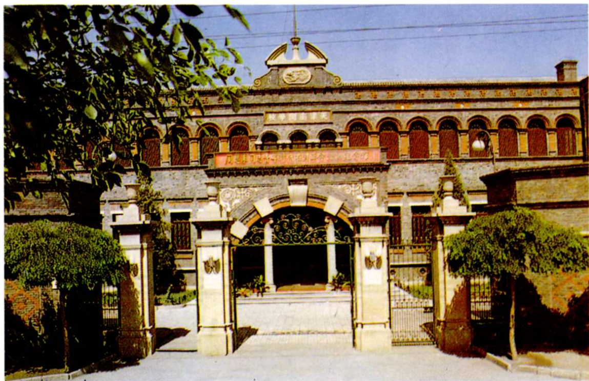
2. 周恩來同志青少年時代在津革命活動紀念館—周恩來同志在南開中學學習時的教學樓