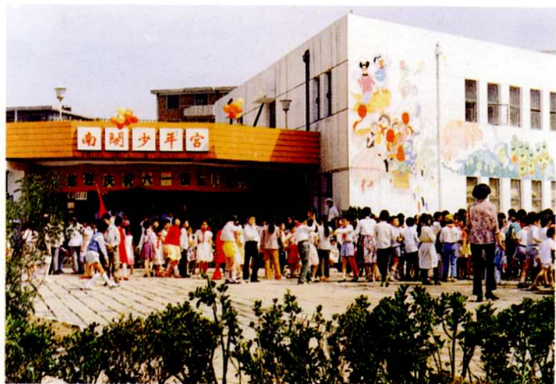
1. 南開區少年宮活動 場地