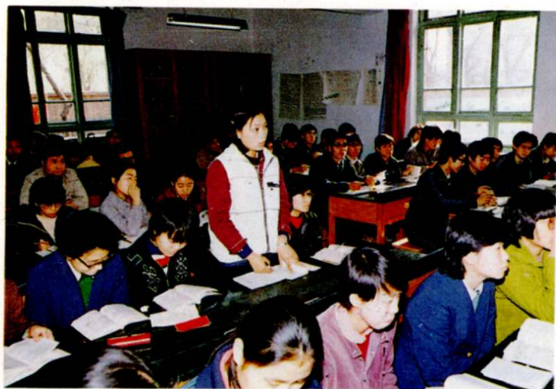
5. 四十三中的學生正在 上課