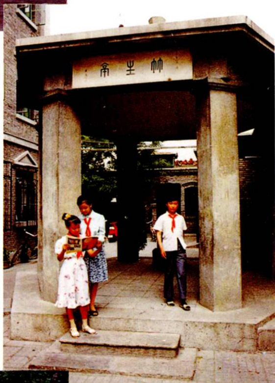
7. 中營小學竹生亭—爲 紀念學校創始人、老 教育家劉寶慈(字竹 生)校長而建