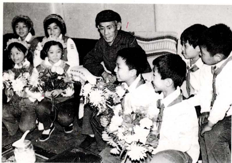
3. 革命傳統代代傳 —1983年中國的保 爾吳運鐸同志來南 開少年宮與少先隊 員座談