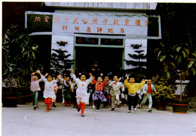
10. 南开一幼的活潑歡 快的小朋友們