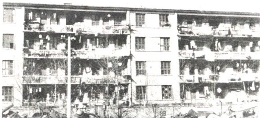
市物资局西流湾职工宿舍区