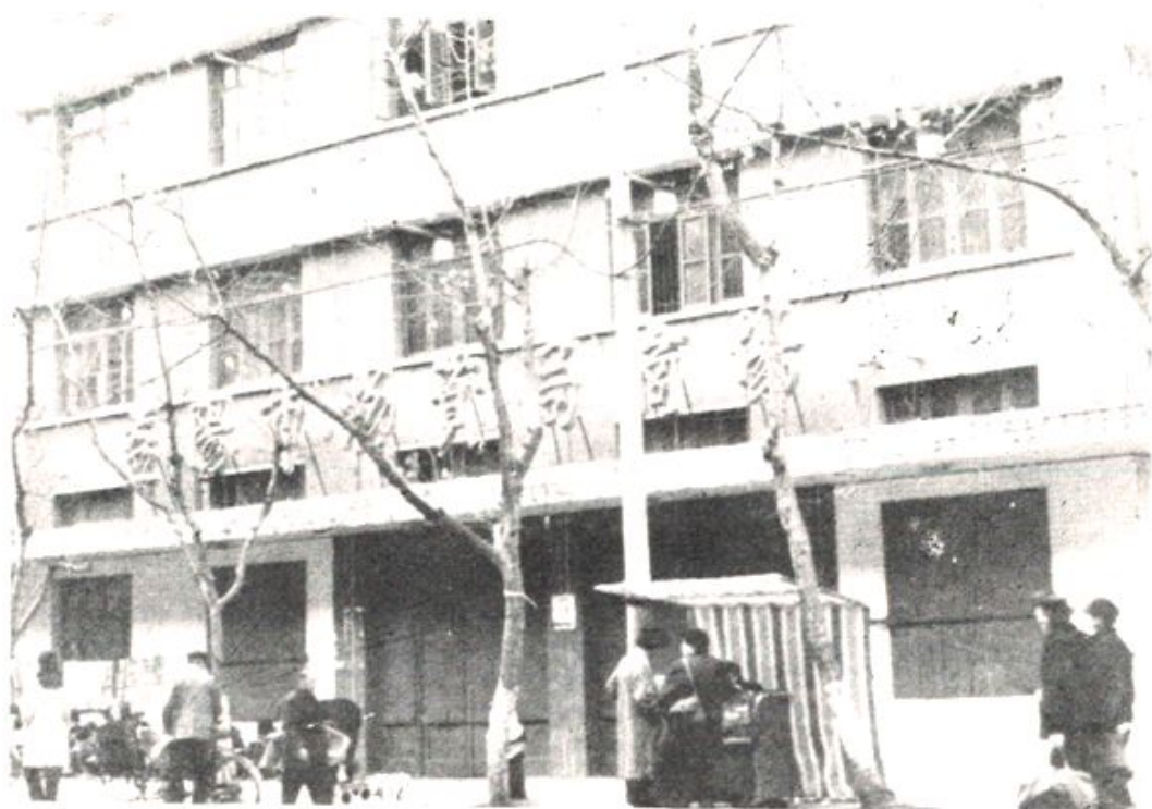
市物资局商场外貌