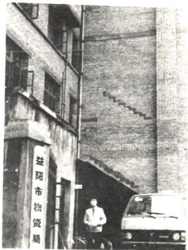
市物资局职工宿舍区