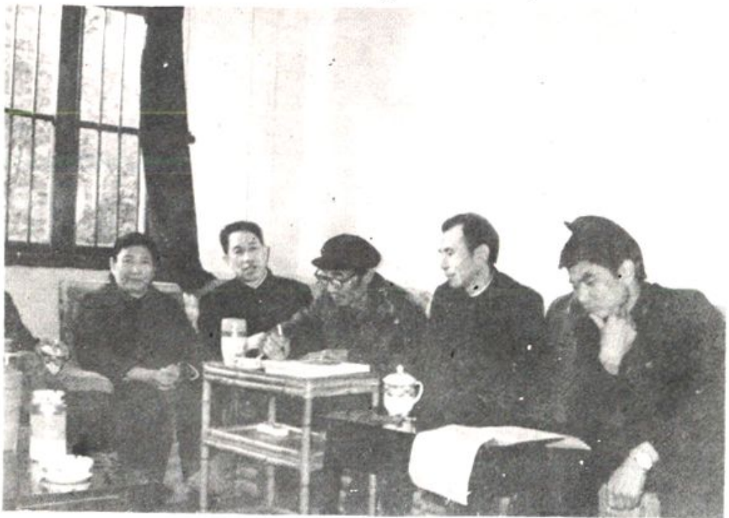
市物资志编委部分人员及办公室人员审稿