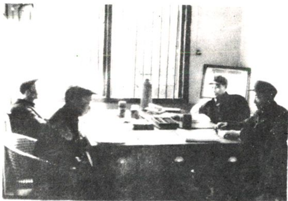
领导和志办人员审志稿