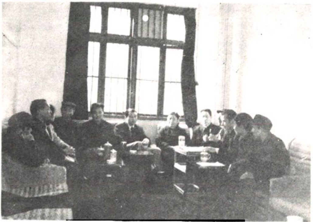
市物资志编委人员第二次审稿