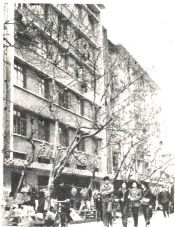
市物资局正门外貌