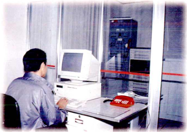
1993年12月全县第一个开通程控电话的乡 ——古县乡程控机房。