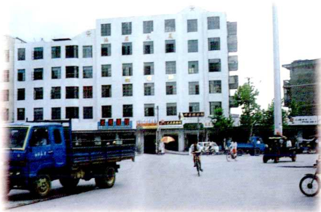
1992年11月邮电职工集资兴建的鸿雁大厦。