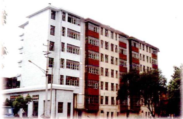
1994年底建成的县邮电局职工宿舍 (座落在大园村东北隅)