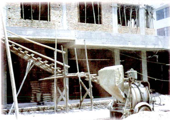
1994年正在建设中的藤田邮电大楼 (座落在藤田镇老街农贸市场右侧)