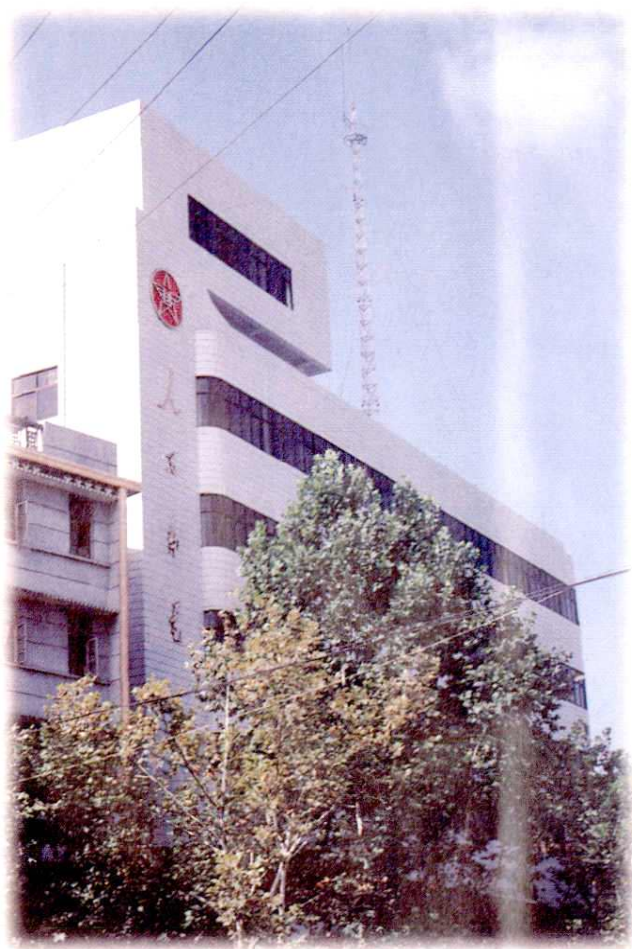
1994 年底建成的永丰县邮电局程控电话大楼