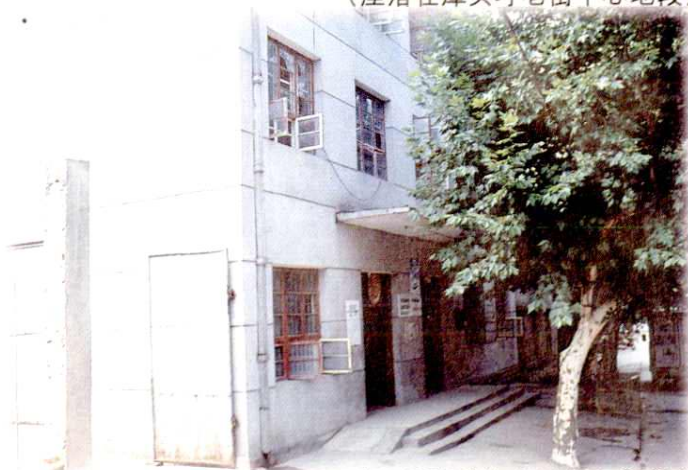
1991年9月建成的龙冈邮电所所房 (座落在龙冈圩中心地段)