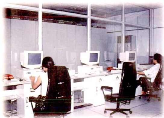
1994年6月开通的永丰万门程控电话机房。