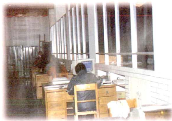
1994 年底建成的永丰县程控电话大楼营业厅。 营业员正在工作。