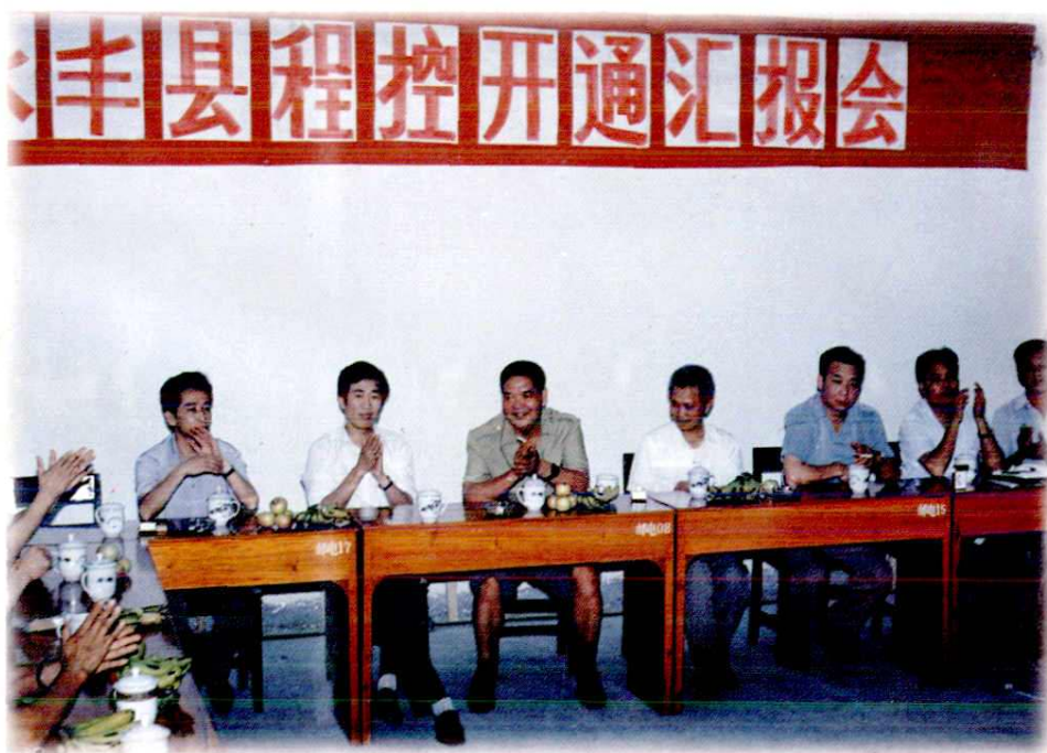
1994年6月12日,永丰县程控电话开通汇报会场景。