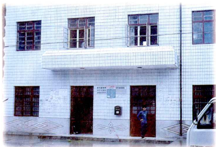
1993年10月建成的潭头邮电所所房 (座落在潭头圩老街中心地段)