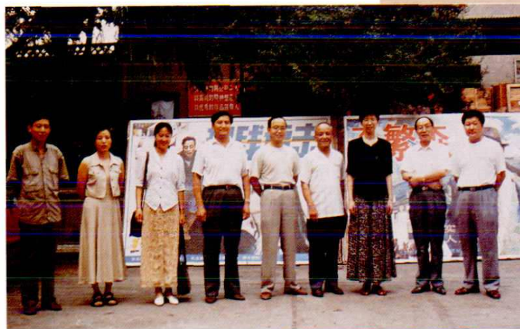
广播电影电视部副部长赵实（右三）视察西安市电影公司特大型电影海报。