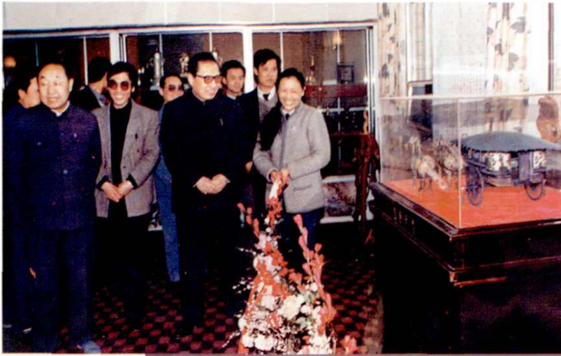
中共中央政治局常委、中央纪律检查委员会书记乔石（前排右二）在省委副书记牟玲生（左一）陪同下视察西安电影制片厂。图为参观该厂荣誉室。（1989.3.7）