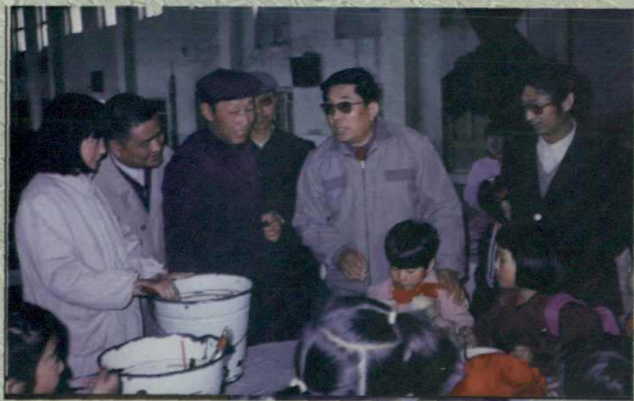
自治区党委副书记张丁华视察我校