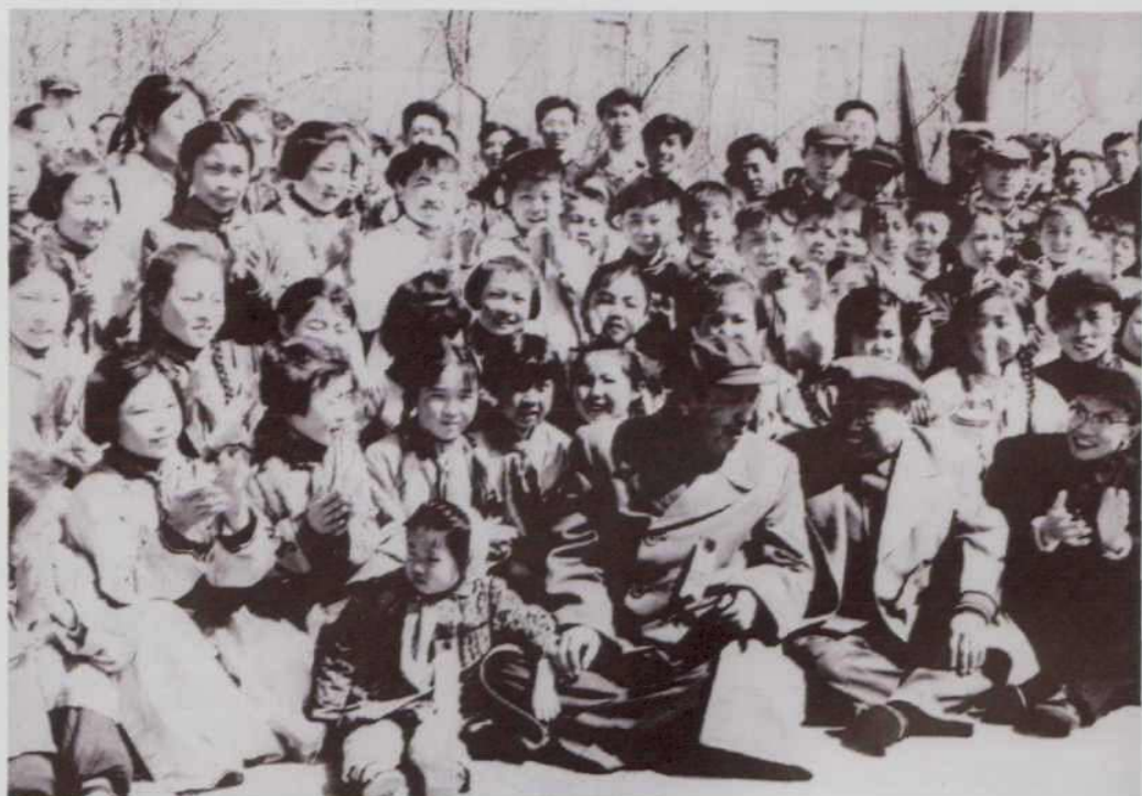
乌兰夫主席同我校师生在一起