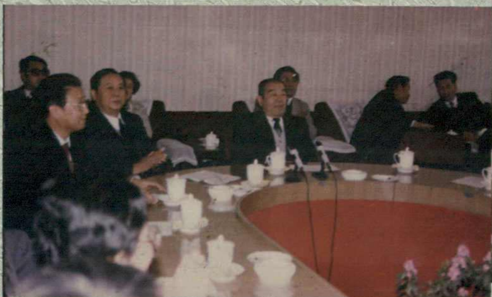
布赫、王群、乌力吉等自治区党政领导欢迎我校女足凯旋归来