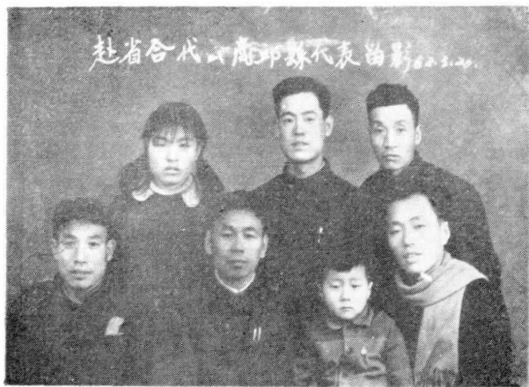
赴省合代、廣邛縣代表留影 6.2.20