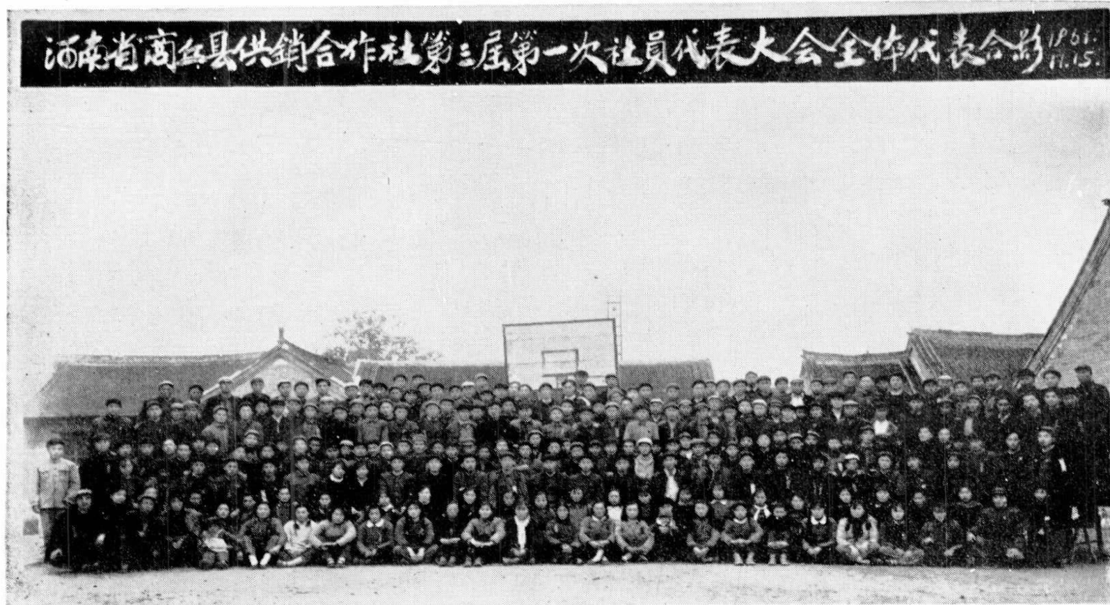
19 第三届一次社员代表大会全体代表1961年11月15日