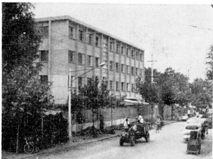
棉麻公司大楼 1982年建