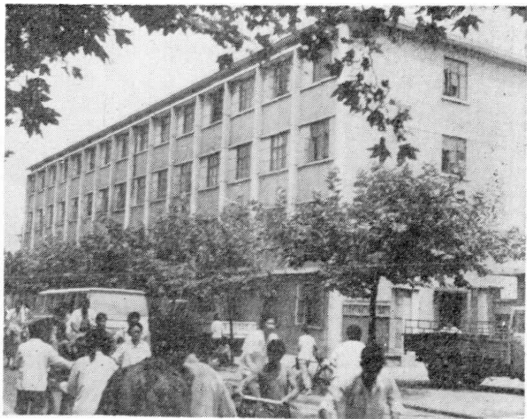
生产公司大楼 1978年建