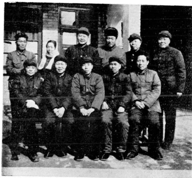
监事会全体成员(四届一次代表会选出)