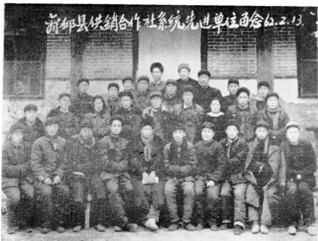
新邛县供销社系统先进单位留念 6.2.13