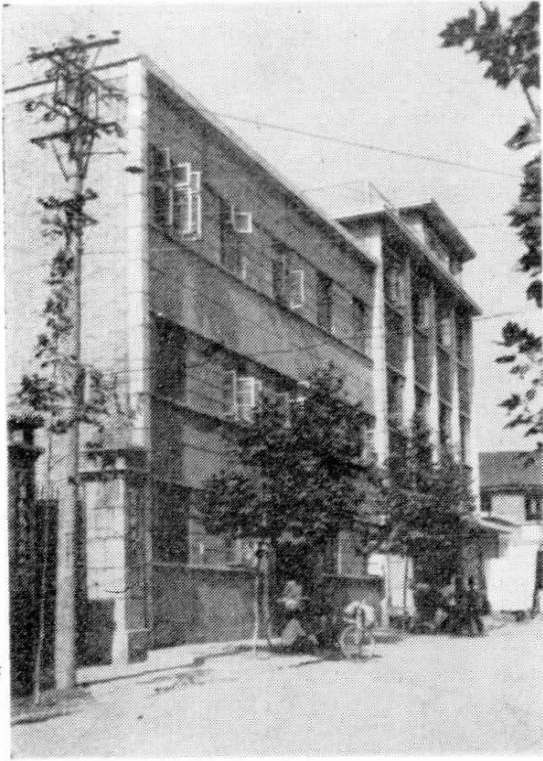
县社营业大楼 1977年建