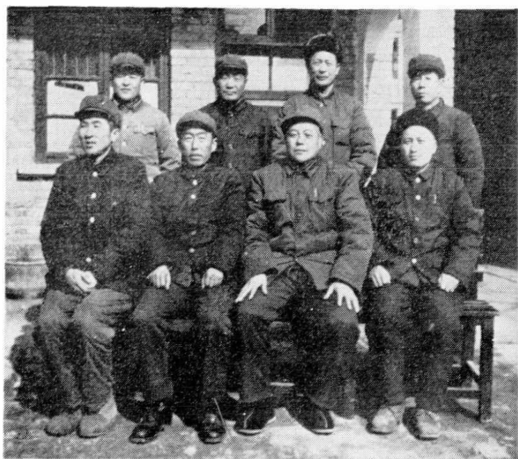
理事会全体成员 (四届一次社员 代表会选出)