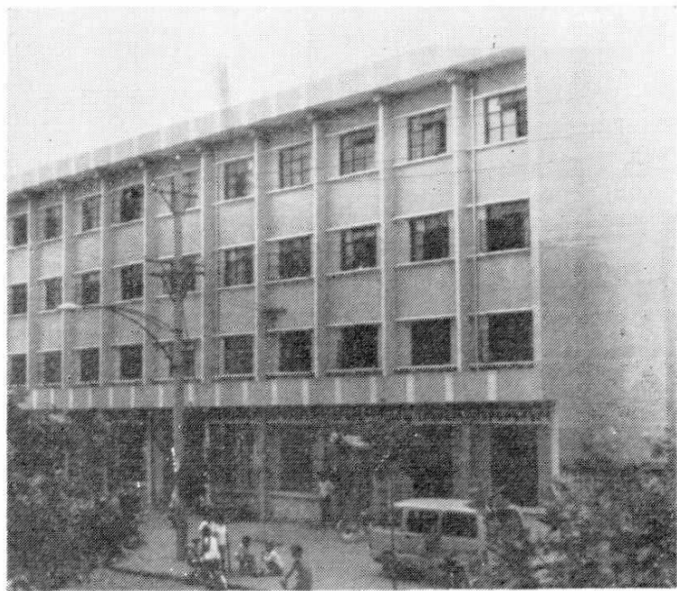
贸易货栈 大楼 1983年建