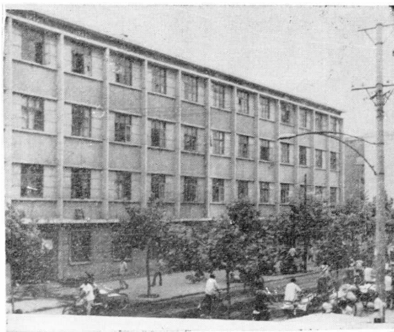
土产公司 大楼 1978年建