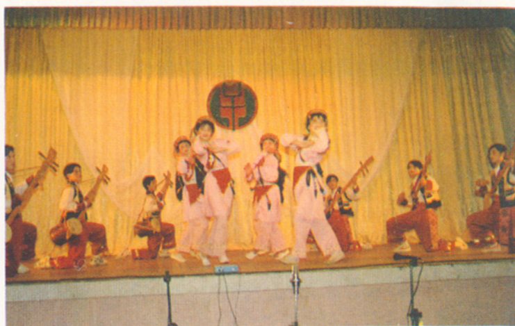
▲学生表演文艺节目