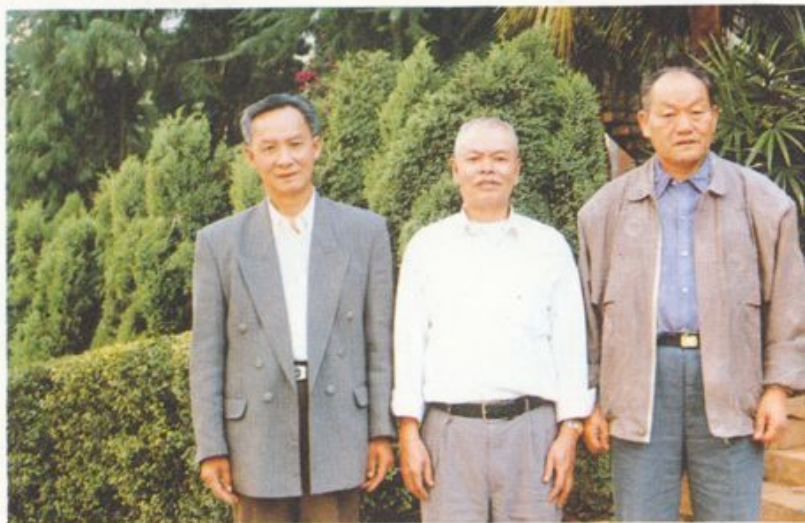
参加《校志》评审会议的老领导