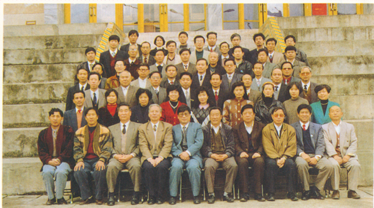
1994年10月,全国农行中南、西南片区校长年会在我校召开,农总行教育部、云南省教委职教处、省分行人事教育处、楚雄州政府、州政协、州教委各级领导出席了会议。