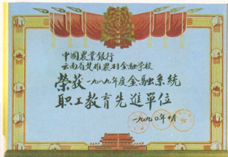
中国人民银行、中国金融工会、中国农业银行 总行授予奖状