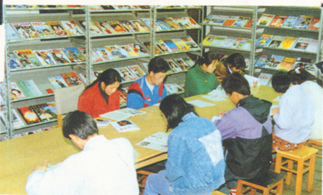
▲学生课余在阅览室读书