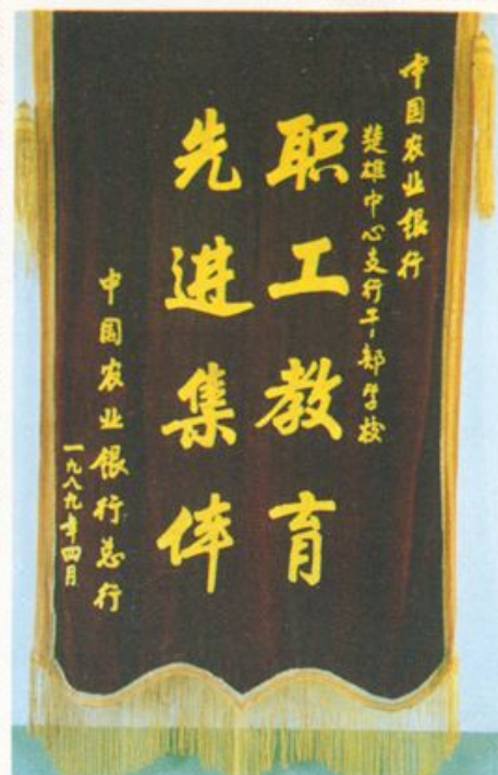
中国农业银行总行授予奖旗