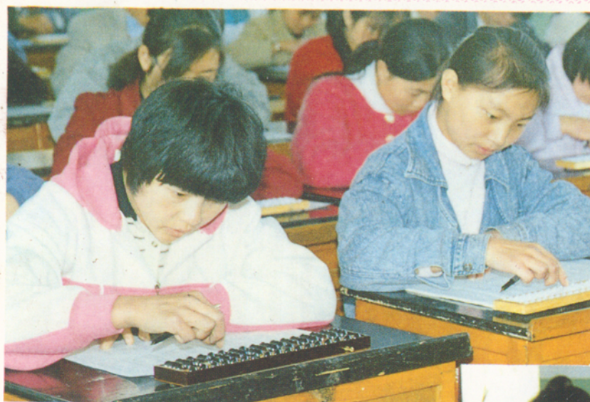
◀学生进行珠算技能训练