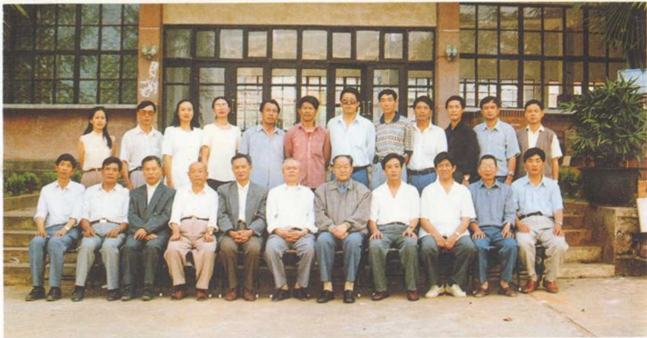
参加《校志》评审会议的全体同志