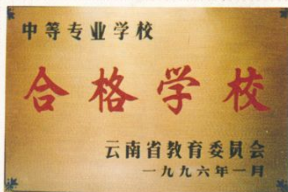
1996年1月,学校被省教委评为 合格中等专业学校