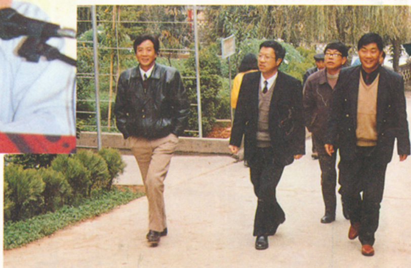
▼省教委主任杨崇龙来校视察