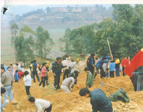
◀师生参加青年林挖沟植树