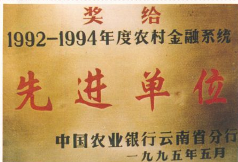
1984年以来连年评为省农行系统先进集体