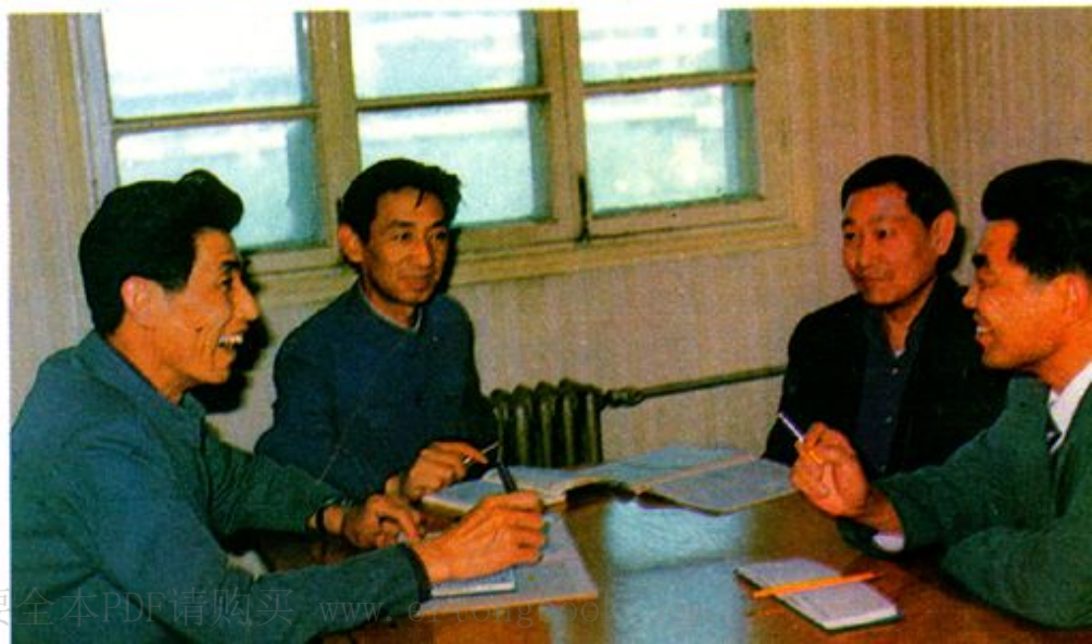
青海省百货公司党 政工领导在一起研究工 作（1988年）