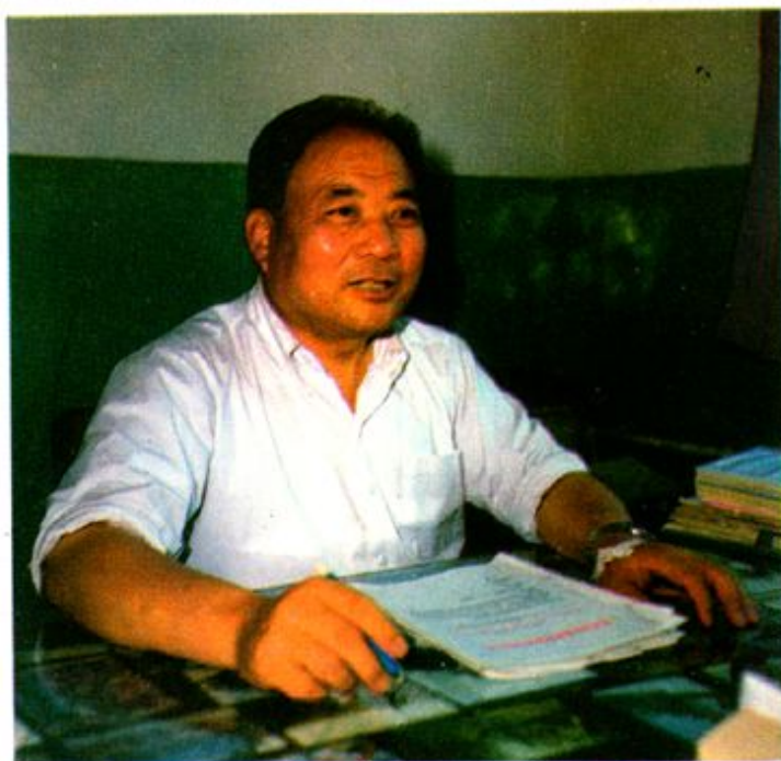
青海省商业厅长杨景福 同志在青海省百货公司职工代 表大会上讲话