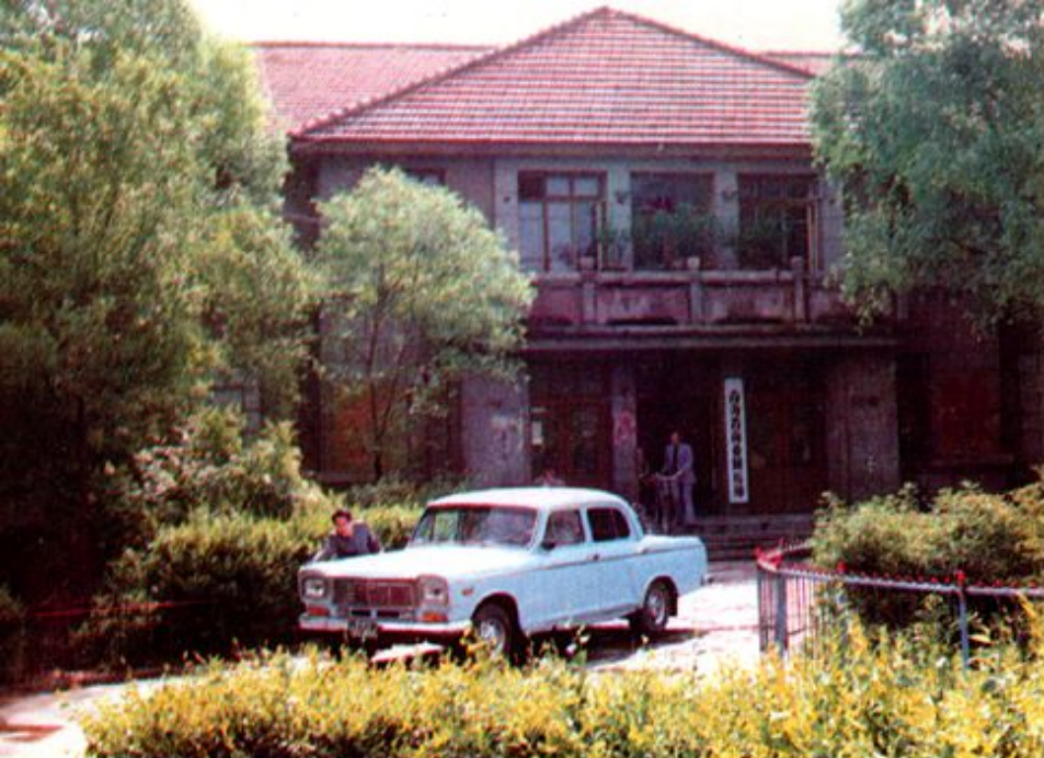
青海省百货 公司仓库办公楼