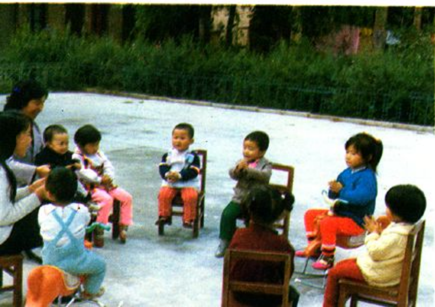
朝阳百货 仓库托儿所