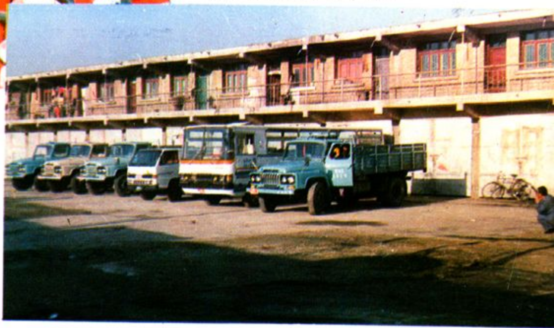
青海省百货公司汽车队