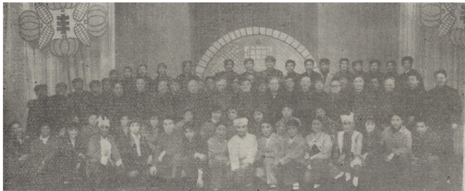
延川剧团进京为中央首长专场演出后，中央首长与演职人员合影