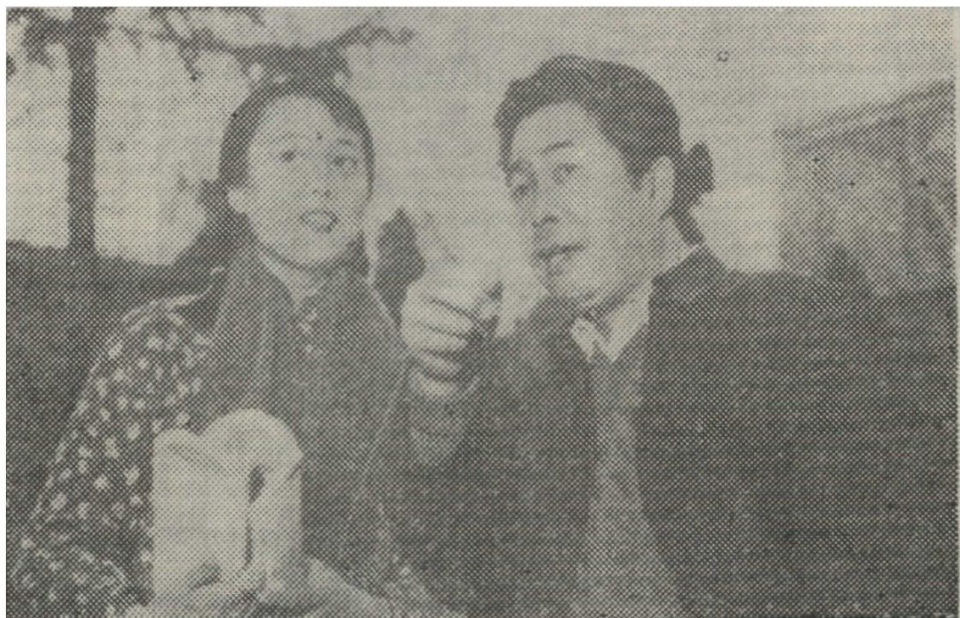
导演吴天明（右）在跟演员说戏