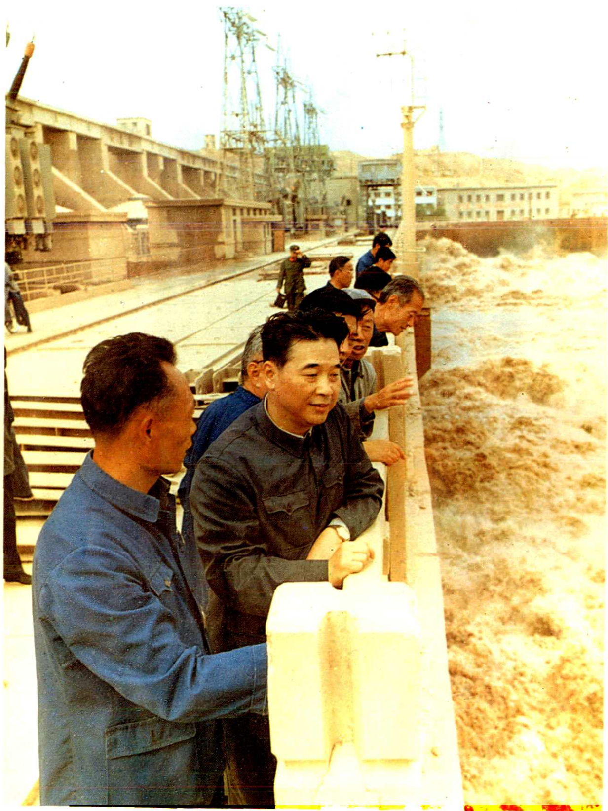
一九八一年电力部副部长李鹏来水电厂检查防汛工作