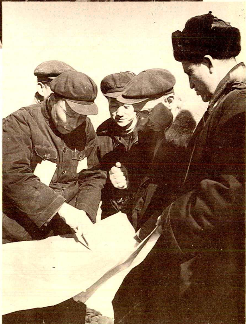
苏联专家在建筑工地 作现场指导