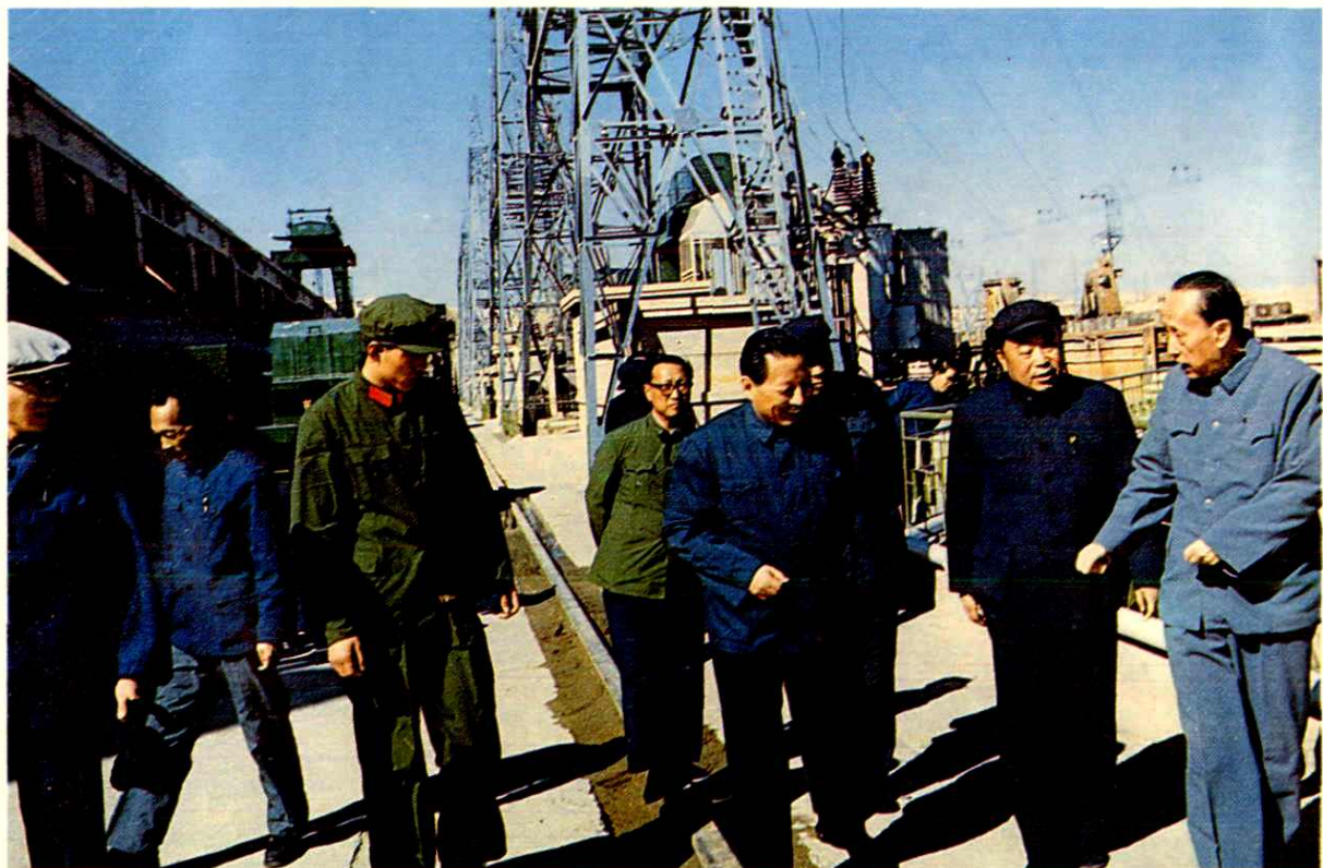
中共中央政治局候补委员乔石来青铜峡水电厂视察