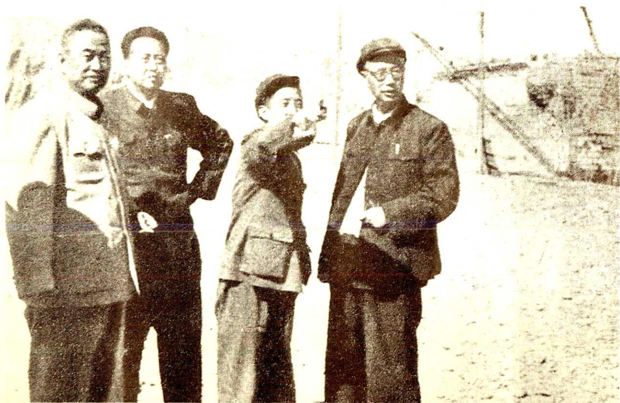
农业部部长廖鲁言、水电部副部长李葆华来枢纽工地视察