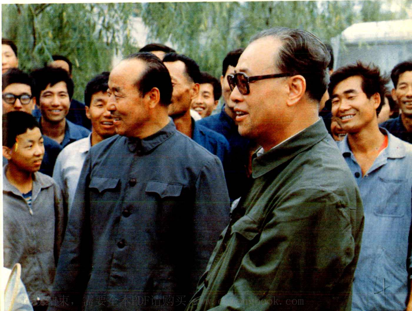
赵紫阳总理同水电厂职工在一起