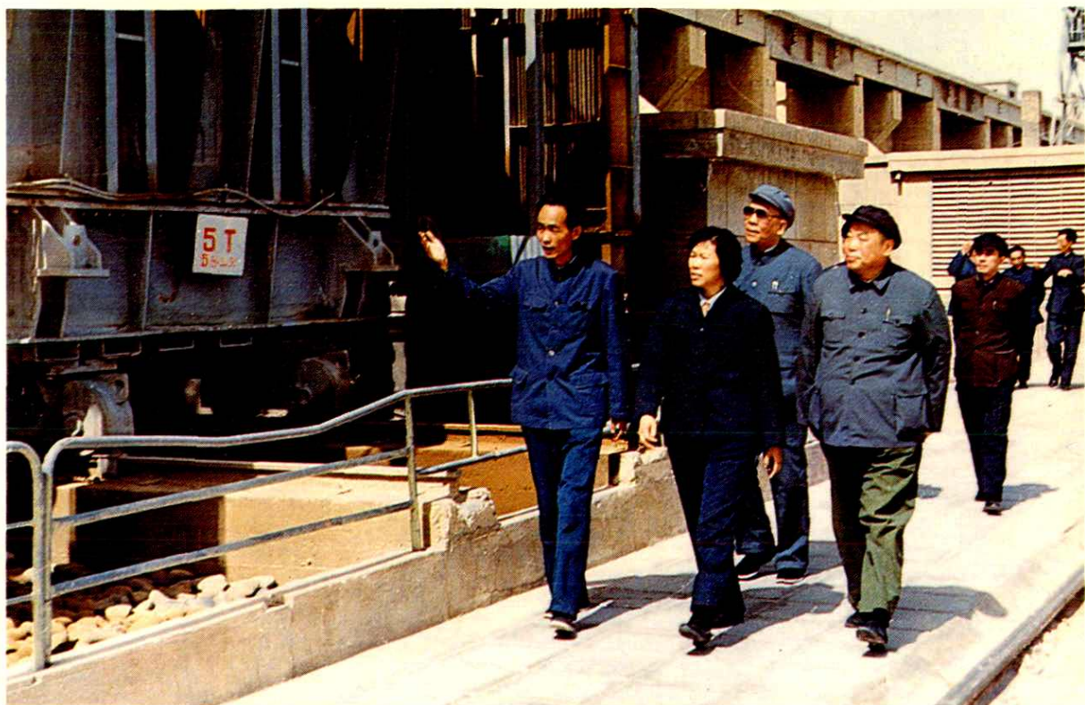
一九八四年五月中共中央书记处候补书记郝建秀来厂视察