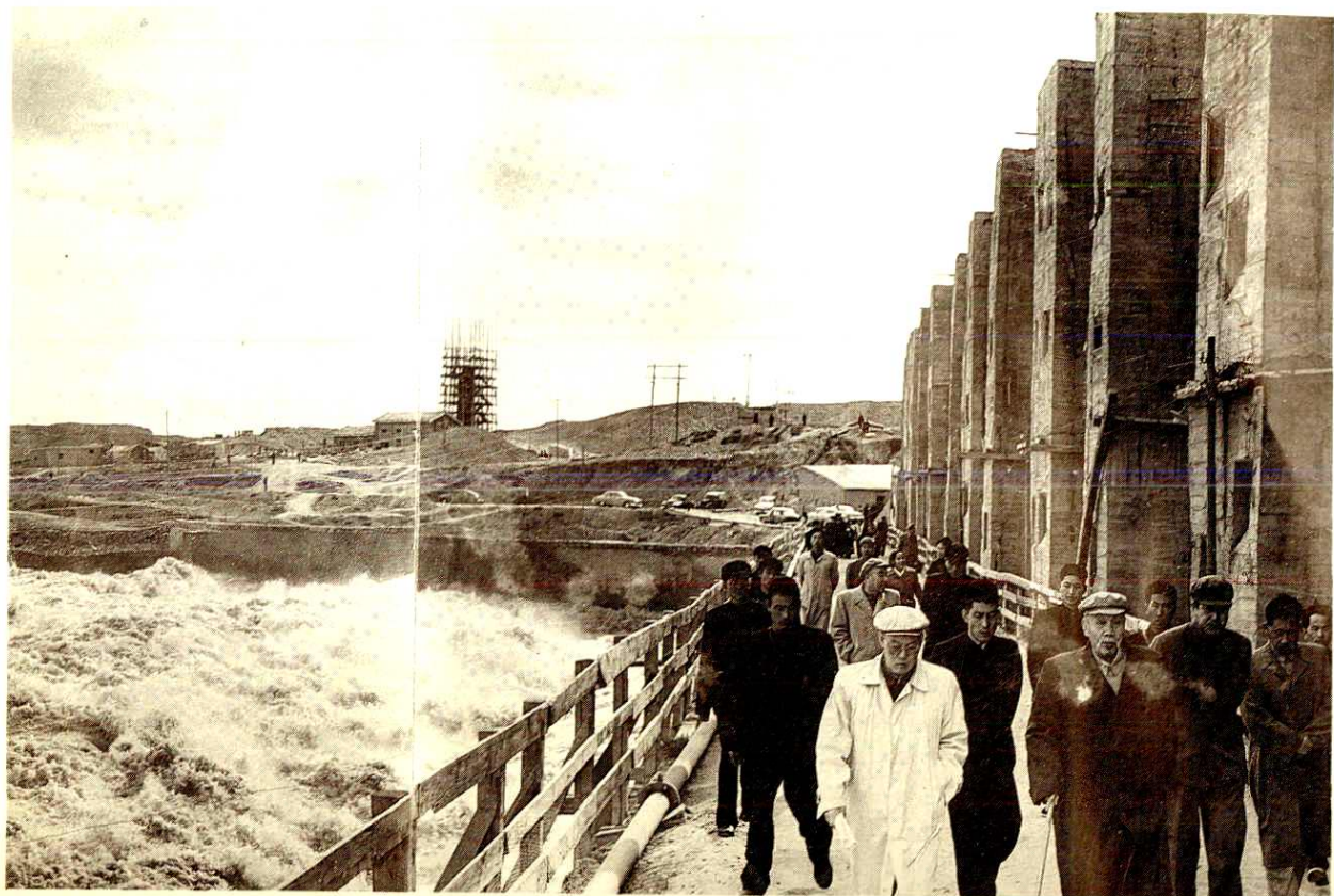
一九六三年董必武同志视察青铜峡水利枢纽工程