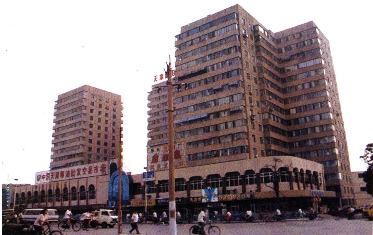
赤峰桥东侧高层住宅