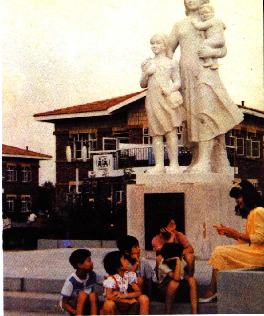
国际 SOS 儿童村