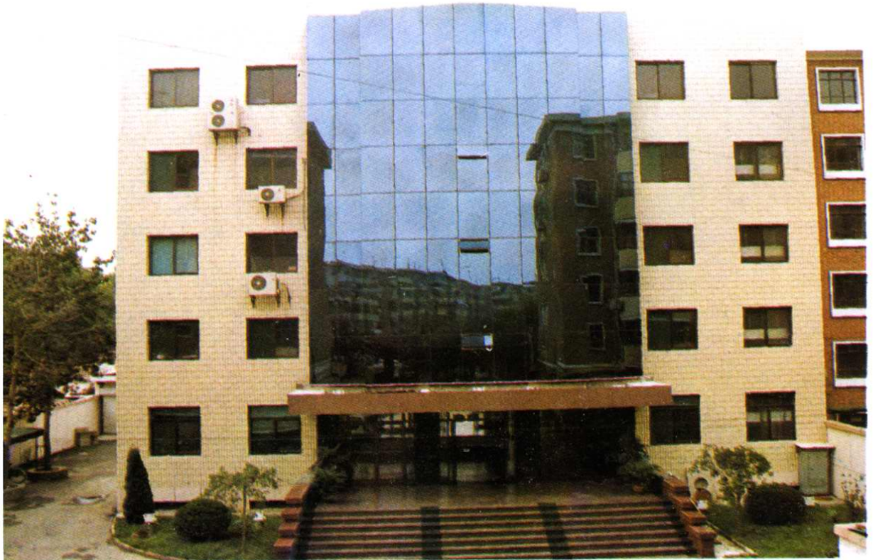
天津市河东房地产开发总公司