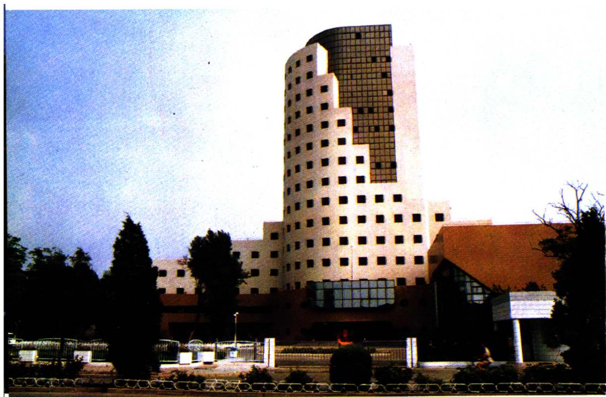
天津音乐学院教学楼