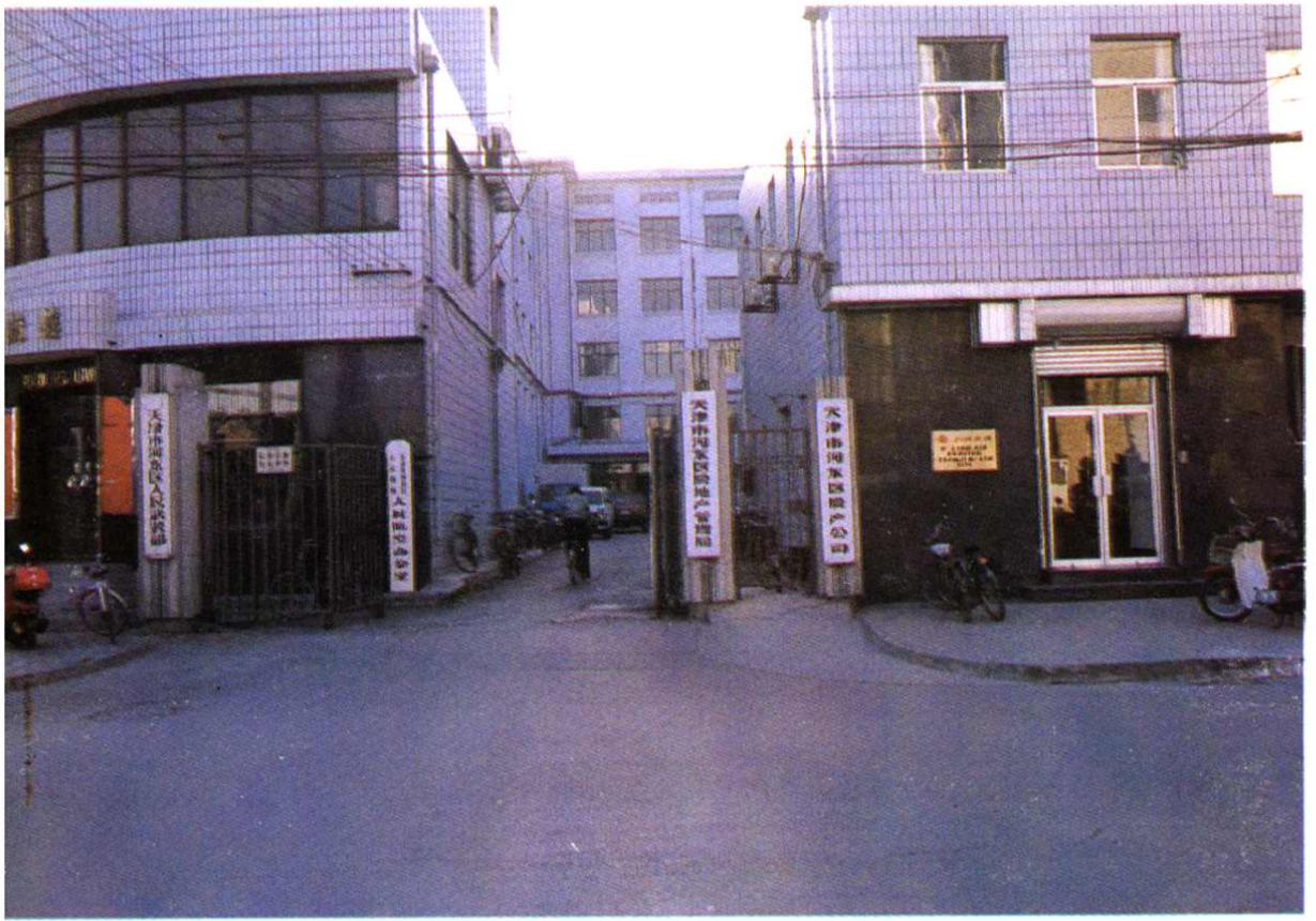
天津市河东区房管局