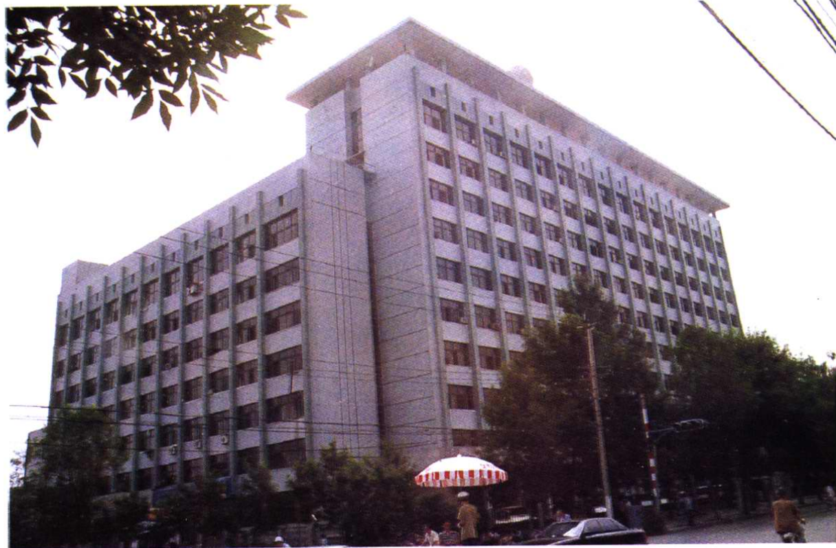
国家海洋局海洋科技情报研究所