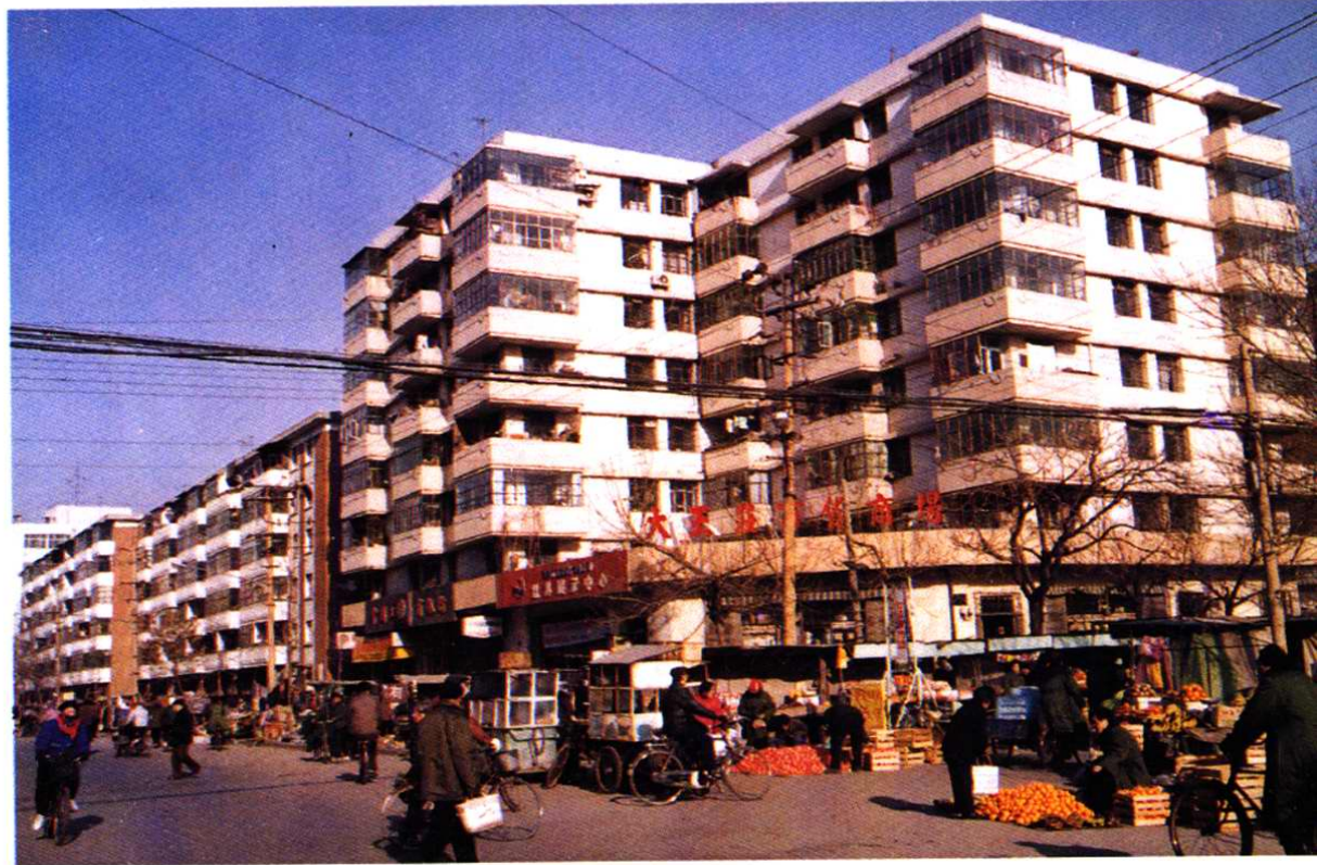
大王庄七纬路七经路交口处一角