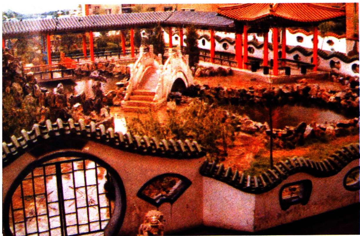
常州道居民区鹤园