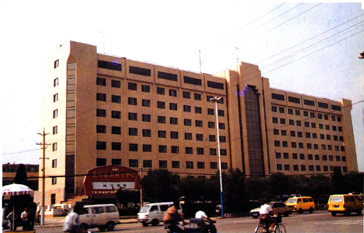
中共河东区委河东区人民政府办公大楼