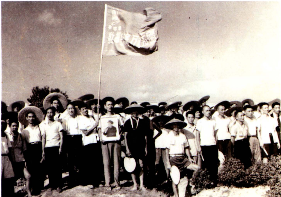
1970年7月全国边销茶生产通城现场会代表参观锦山茶场合影,左四为商业部办公厅主任苏奋。