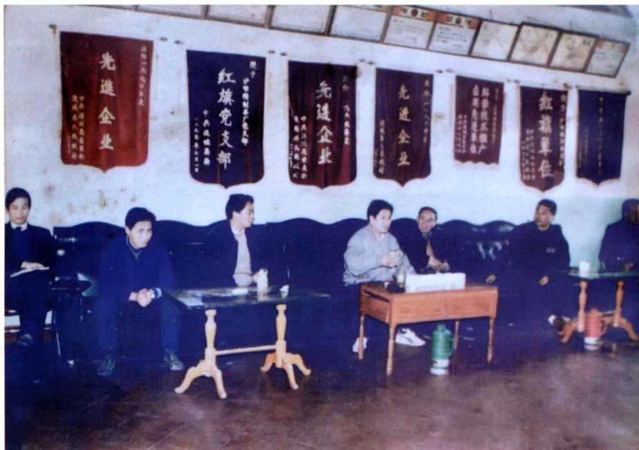
1991年3月湖北省委书记关广富(中)、视察通城时考察了锦山乡、沙堆镇农业、茶叶开发典型,并与当地干部、企业经营者座谈,右三为县委书记皮雄飞。