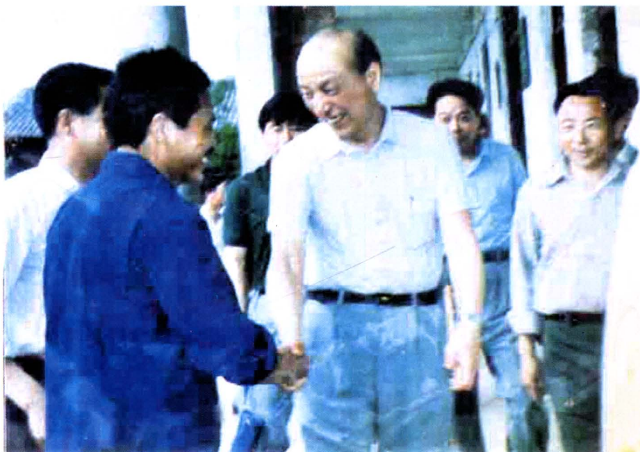
1991年7月湖北省省长郭树言(中),在通城视察时,接见茶叶经营能人柳落秋同志并与其亲切握手交谈。