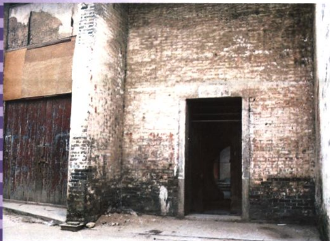
解放初期县邮电局租用民房旧址（十字街35号）