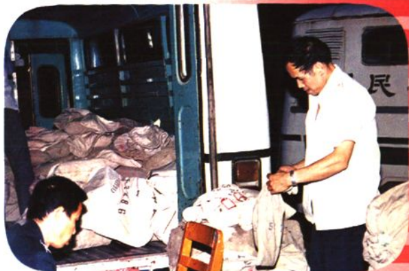
接发人员在接发邮件 (1993年8月)