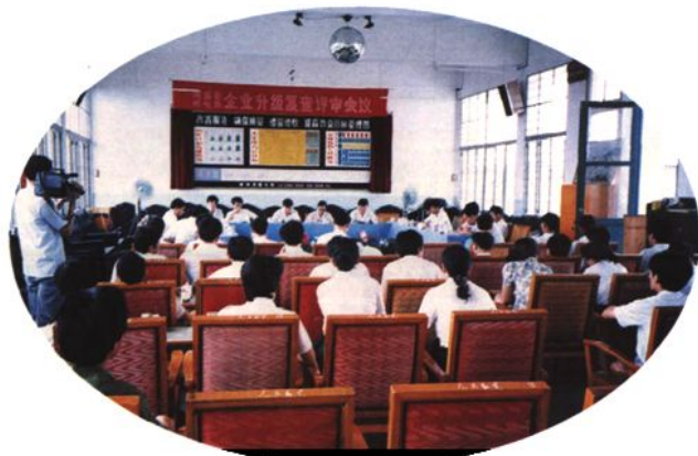
1991年8月5日，鹿寨局企业升级复查通过评审，继续保持自治区级先进企业称号