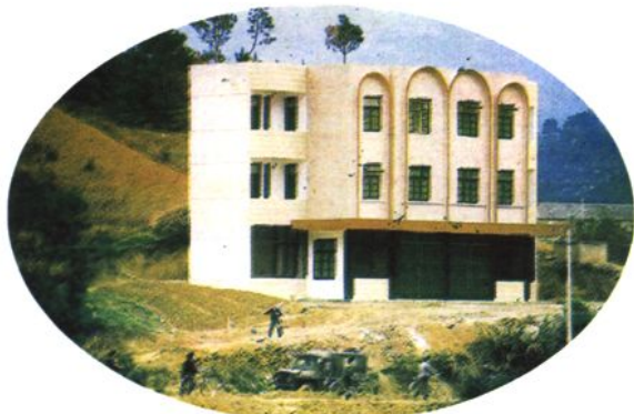
拉沟邮电所 (1993 年建)