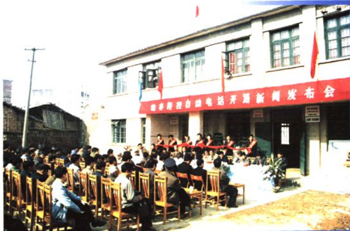
1993年元月12日，雒容镇成为鹿寨县第一个开通程控电话的乡镇