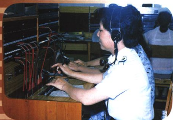
农话话务员在接转电话（1990年）