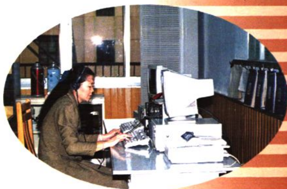
无线寻呼126人工台（1994年）