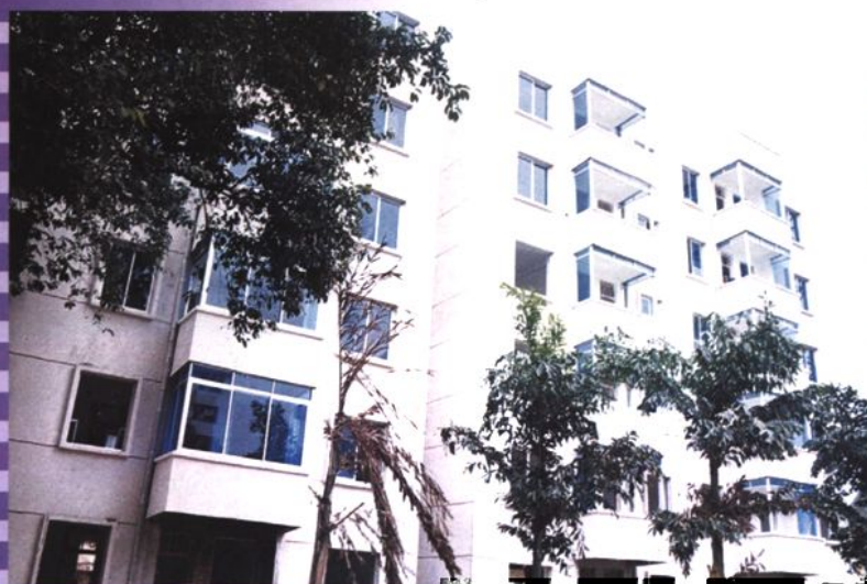
90年代建的县邮电局部分职工住宅楼