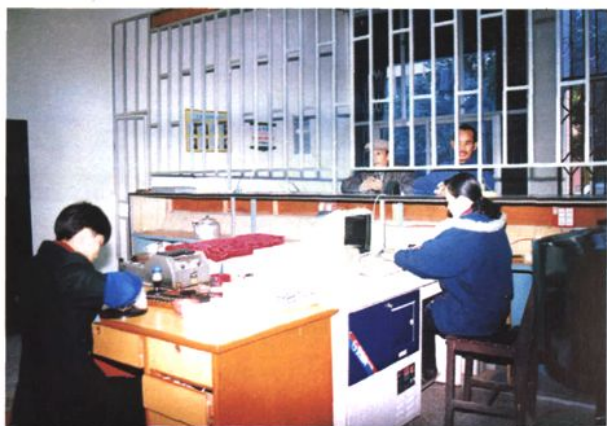
1997年12月，鹿寨局邮政储蓄实现全国通存通取