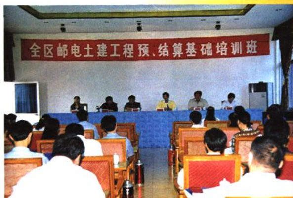
1998年4月，自治区邮电管理局在鹿寨县邮电局举办土建工程预、估算基础培训班