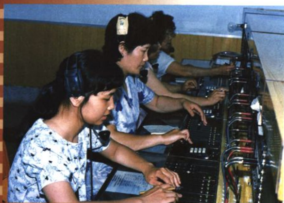
长途话务员在工作（1990年）