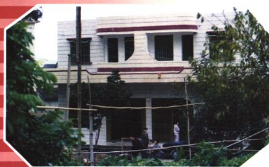
导江邮电所 (1994 年建)