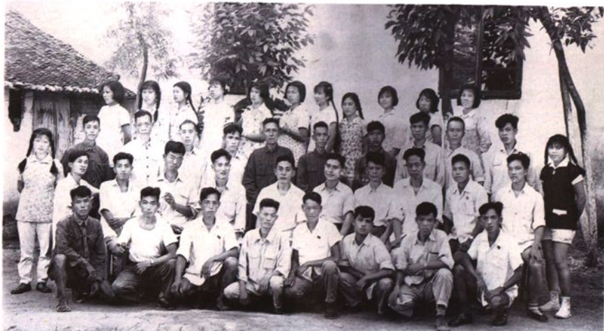
鹿寨县邮电局全体职工欢迎自治区邮电管理局张局长来我县检查工作合影 60.6.6