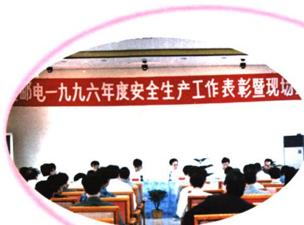
1997年4月22日，全区邮电安全生产现场会在鹿寨县邮电局召开