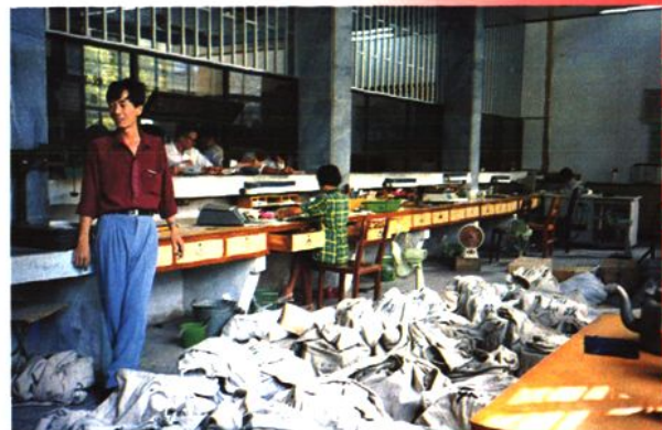
营业窗口人员忙着收寄邮件 (1994年)