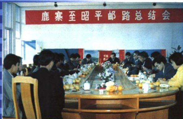
1994年12月，鹿寨至昭平的县间干线自办汽车邮路已运行19年，今改为由柳州至昭平，图为在鹿寨局召开总结会