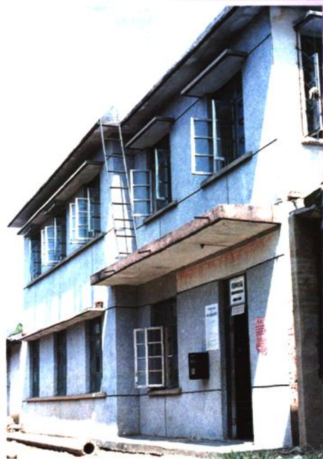
黄冕邮电支局（1983年建）