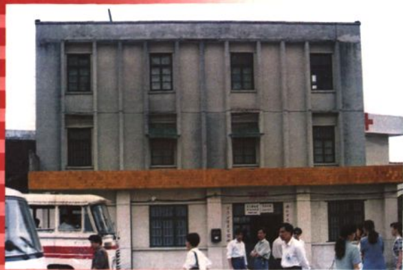
龙江邮电所 (1986 年建)