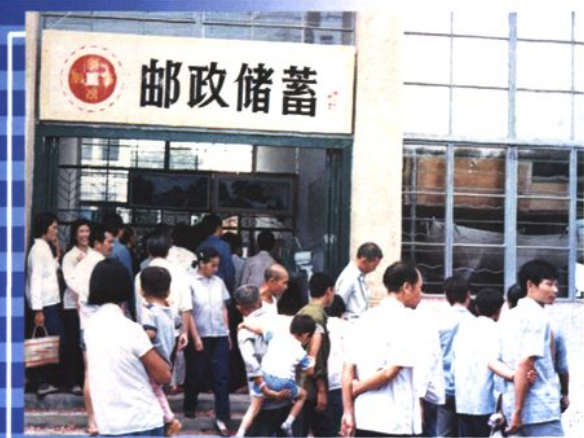
社会群众到邮政储蓄所办理存取款业务（1986年）