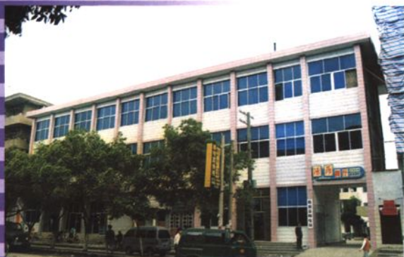
鹿寨县邮政综合楼（正面）（1984年建）