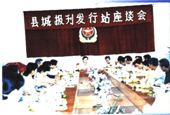
充分利用社会力量做好报刊发行工作