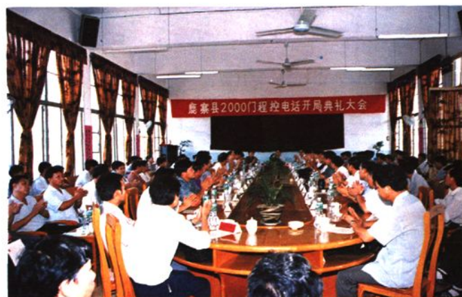
1993年10月9日22时，鹿寨开通2000门程控电话。图为开局典礼大会会场