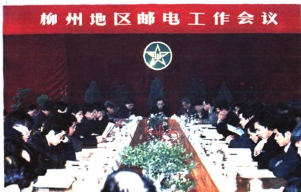
1992年3月19日，柳州地区邮电工作会议在鹿寨县邮电局召开，图为会议会场