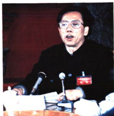
柳州地委书记曹息余在会上讲话