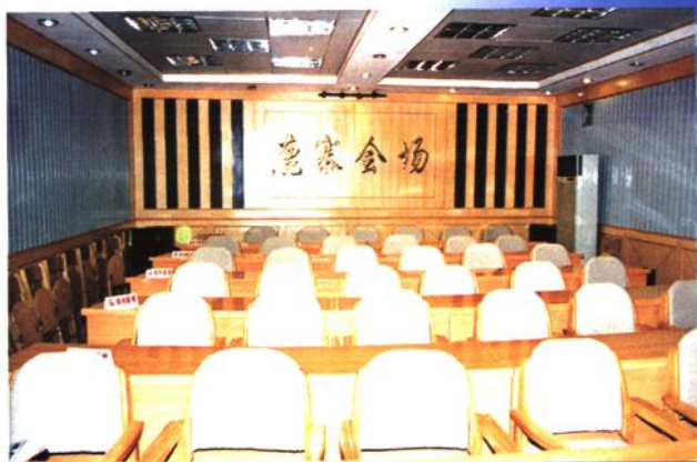
电视电话会议室 (1998年)