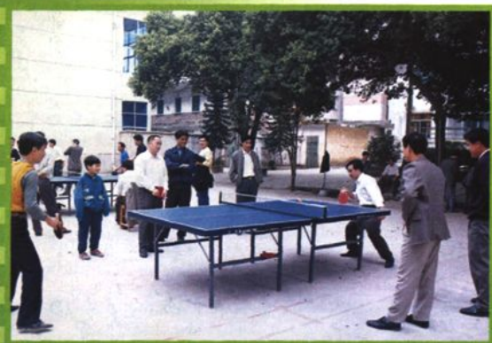
1996年3月，鹿寨局举行乒乓球比赛