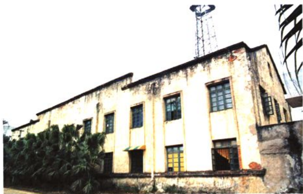
1961年在广场路建的县邮电局旧址