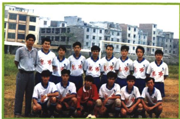
鹿寨邮电男子足球队员（1996年9月）