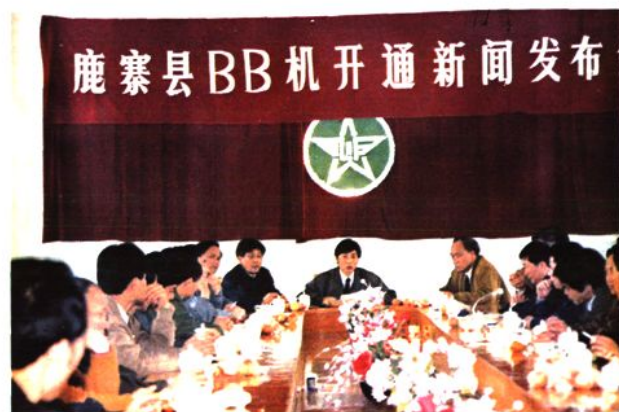
1993年4月10日，鹿寨开通无线寻呼通信。图为召开新闻发布会会场