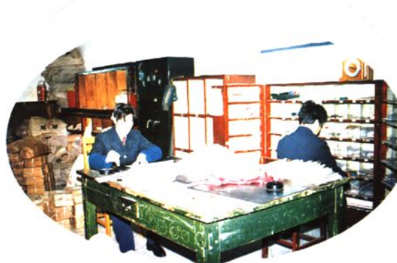
盖好落地日戳, 按路由细心分拣 (1994年)