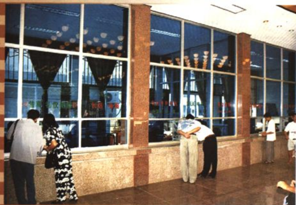
鹿寨县邮电局营业大厅（1996年）