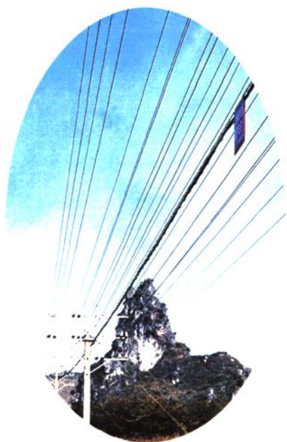
明线、光缆传输线路 (1995年)