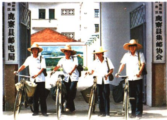
投递人员在出班 (1988年6月)