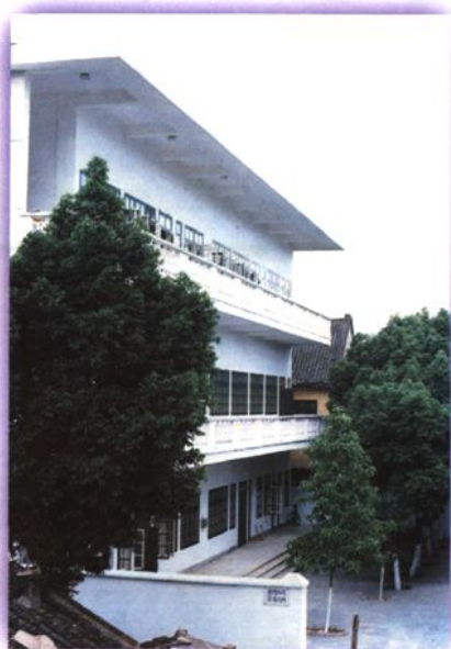
鹿寨县电信综合楼（1989年建）