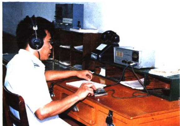
报务员在收发电报