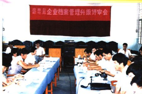
1991年，鹿寨县邮电局企业档案管理升级评审会