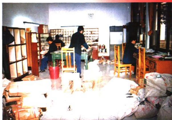
封发分拣人员正忙着分拣登单 (1994年)