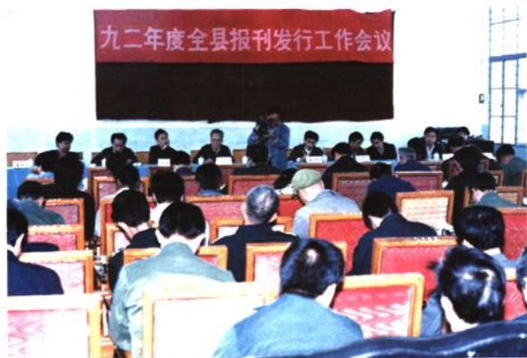
每年秋末冬初召开一次总结表彰动员会，部署下年度的报刊收订工作，县委领导亲自作指示