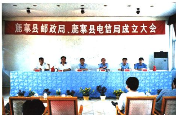
1998年9月3日，鹿寨县邮电局分营，成立邮政、电信局。图为两局成立大会会场