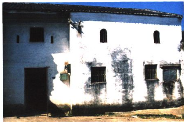
50-70年代雒容邮电支局旧址