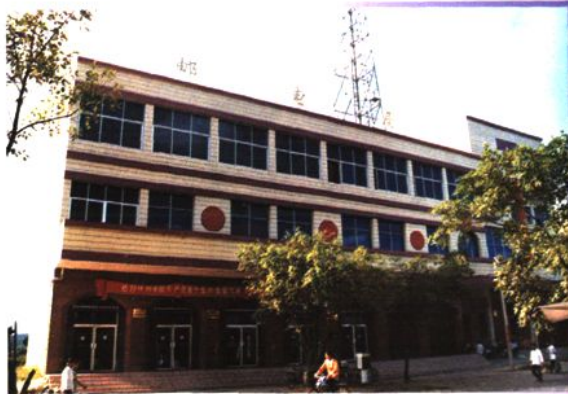
90年代建的雒容邮电支局