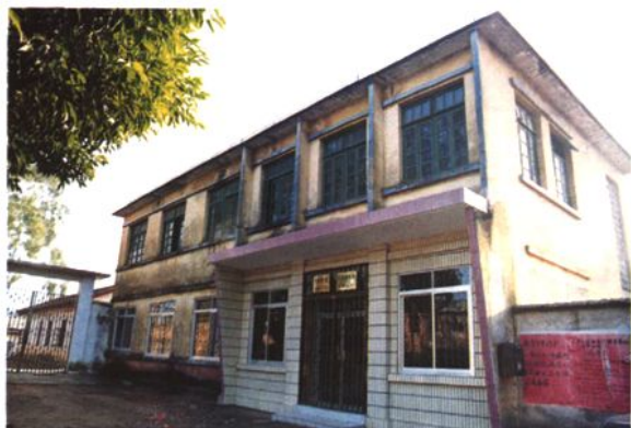
四排邮电所 (1978 年建)