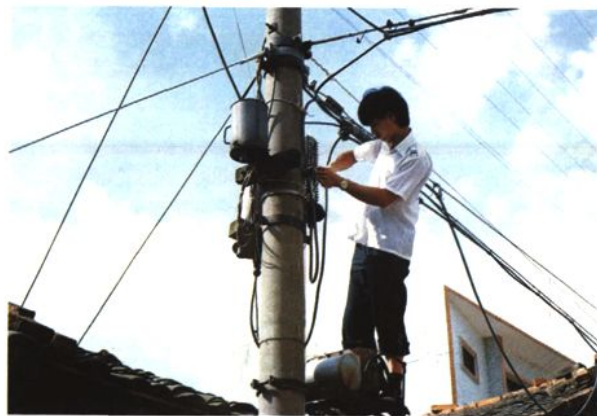
机线员在检修线路（1993年）