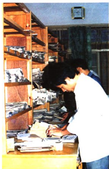
投递人员在分理信函报刊, 做好出门投递前的准备工作 (1993年)