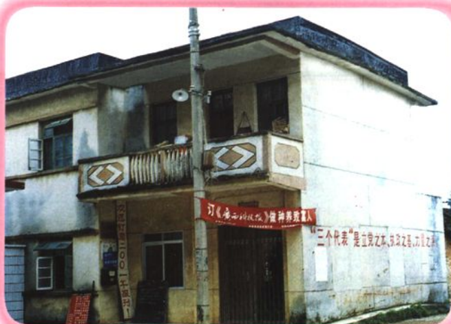
江口邮电所 (1985 年建)