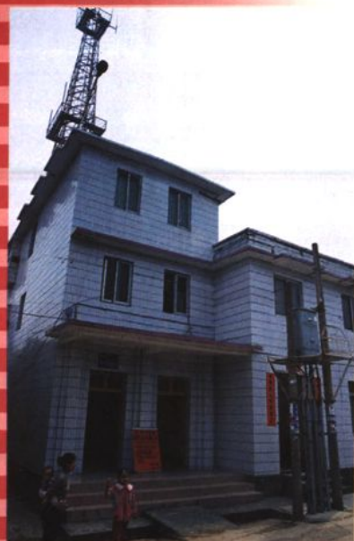
中渡邮电支局 (1983 年建)