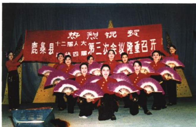
鹿寨县邮电局文艺队演出