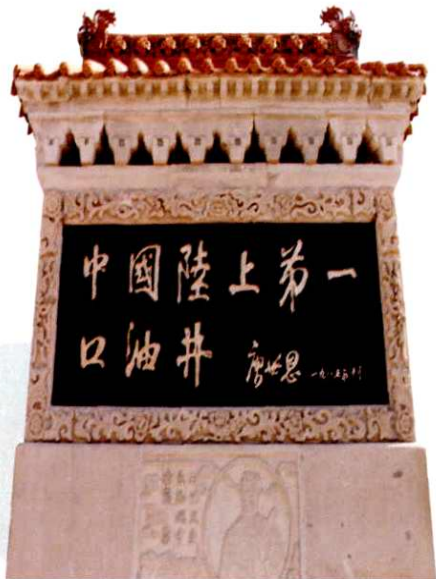
中国陆上第一口油井