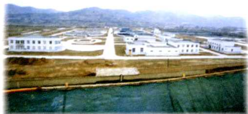
延安市污水处理厂