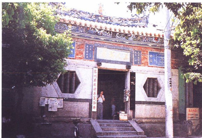
福建泉州花橋宮外貌。（引自《青礁慈濟東宮》）

根據大正八年（1919），丸井圭治郎所編著的《臺灣宗教調查報告書第一卷》統計，至日治中期全臺以保生大帝為主神的廟宇共有一〇九座，其中以臺南的五十五座，與嘉義的二十九座最多，臺北地區則僅有四座 26 。一九六〇年劉枝萬的臺灣省寺廟教堂調查表記載，全臺寺廟供奉的主神有二四七種之多，其中真正被普遍奉祀超過一百座以上的僅有九種，其中保生大帝廟便有一四〇座 27 。在一九八五年，仇德哉則統計出臺灣供奉保生大帝的廟宇共計一六五座 28 。依民國九十二年全國保生大帝會員名冊，現今全臺至少有二六四座保生大帝廟宇。這些調查大致可以看出保生大帝信仰在臺灣的興盛，在諸多廟宇中，南部以臺南學甲的慈濟宮最著名，北部則是臺北保安宮為盛。