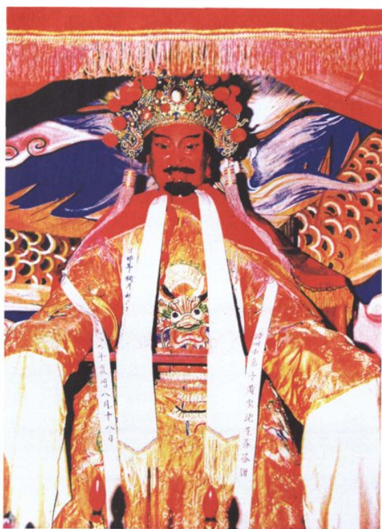
白礁慈濟祖宮保生大帝寶像。

雖然如此，莊夏的〈慈濟宮碑〉也非全無可取之處，如其記載吳本受封的原因，可能即是真的，楊志〈慈濟宮碑〉即說：