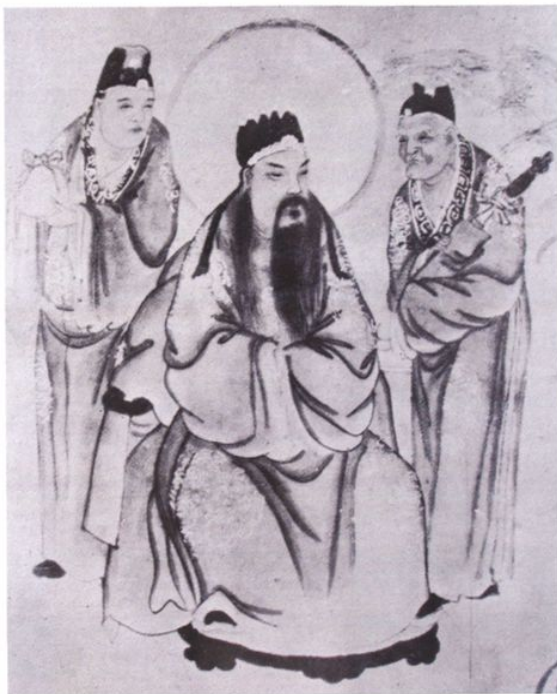
保生大帝在史書典籍上稱為「吳真人」，民間俗稱「大道公」。

保生大帝，又稱為吳真人，俗稱「大道公」。根據現存最早的資料南宋流傳的「譜牒」，保生大帝「姓吳名夲（音Tao），父名通，母黃氏」，北宋太宗太平興國四年（979）三月十五日生，仁宗景祐三年（1036）五月二日卒，享年五十八歲 1 。