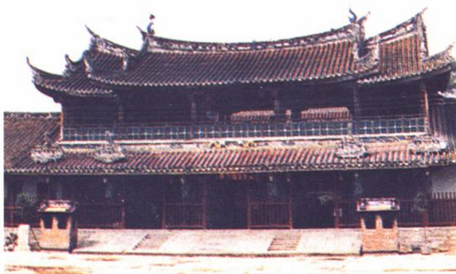
福建白礁慈濟祖宮外貌。

外。至元代，福建地方人士增建南安武榮舖慈濟真人祠、長泰榮津橋畔慈濟宮。一直到明清時期，相關的宮廟才迅速擴建起來，分布的範圍含括泉州漳州各地縣市，單是廈門市一地，便先後建造了三十四座保生大帝廟，可見其在民間的信仰已達到一個高峰 21 。