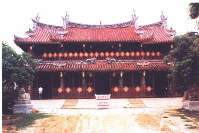
福建青礁慈濟東宮外貌。

閩臺兩地一衣帶水，地理上相近、文化上亦屬同源，臺灣社會流行的民間信仰也大都來自福建。在十七世紀，伴隨著福建移民的入臺開發，便將這些民間信仰傳衍開來，其播遷的方向與範圍，與移民的開拓與路線發展大抵一致，而保生大帝信仰也是在此時傳來臺灣。