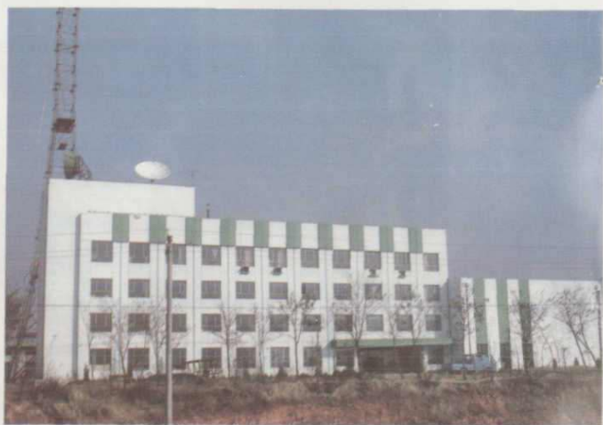
新泰市广播电视中心