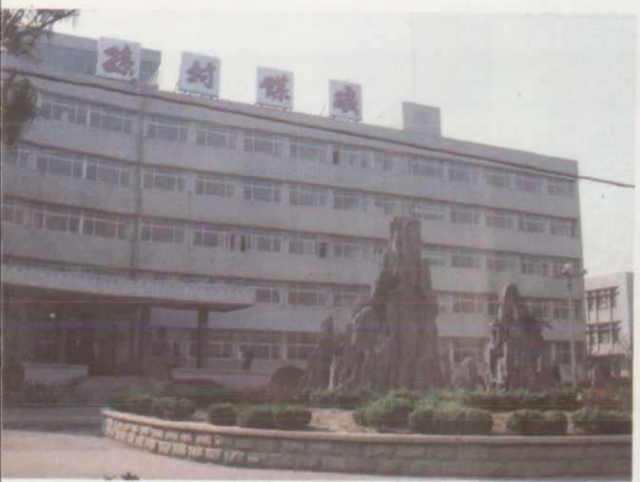
新汶矿务局孙村煤矿