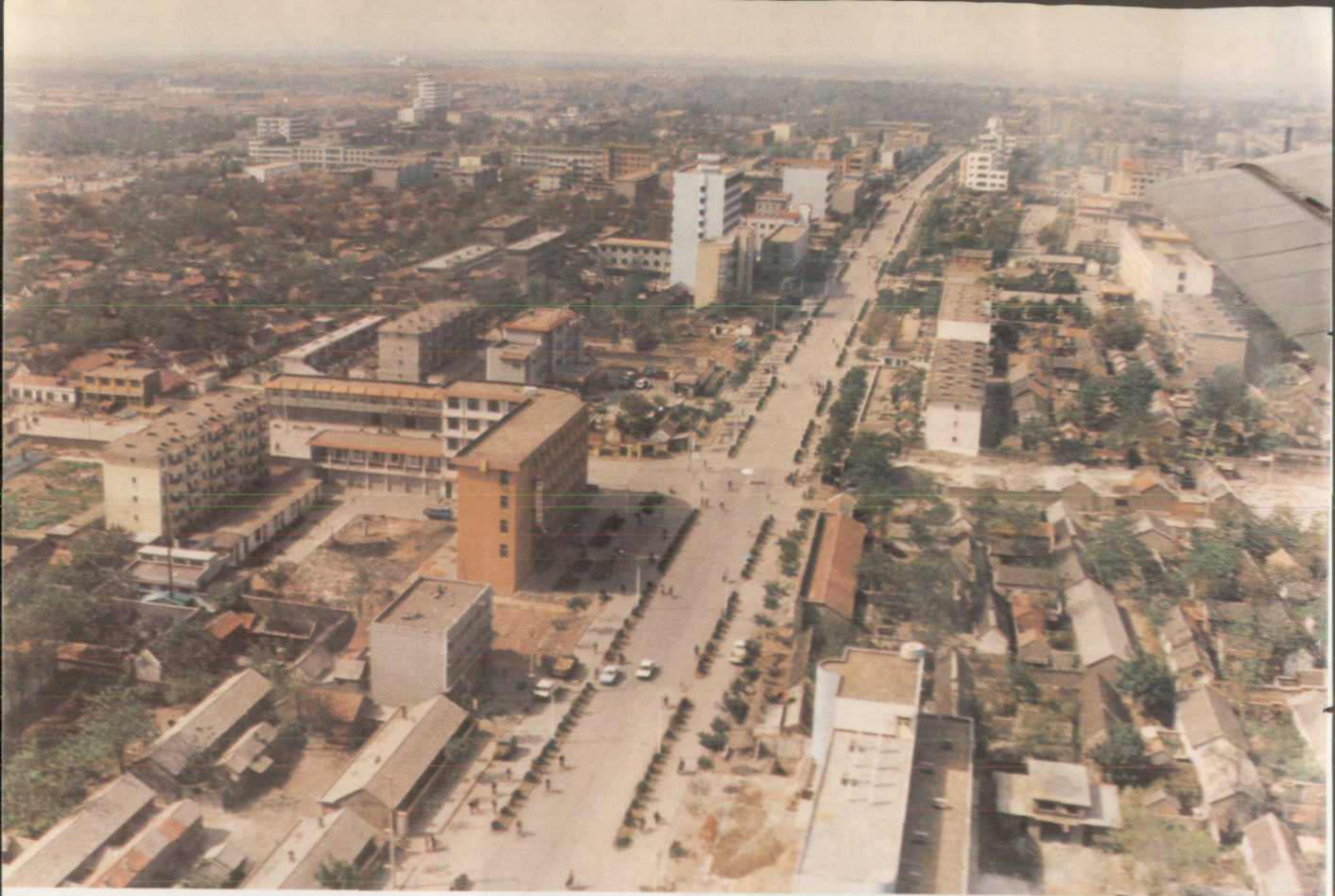
新泰市城区鸟瞰图