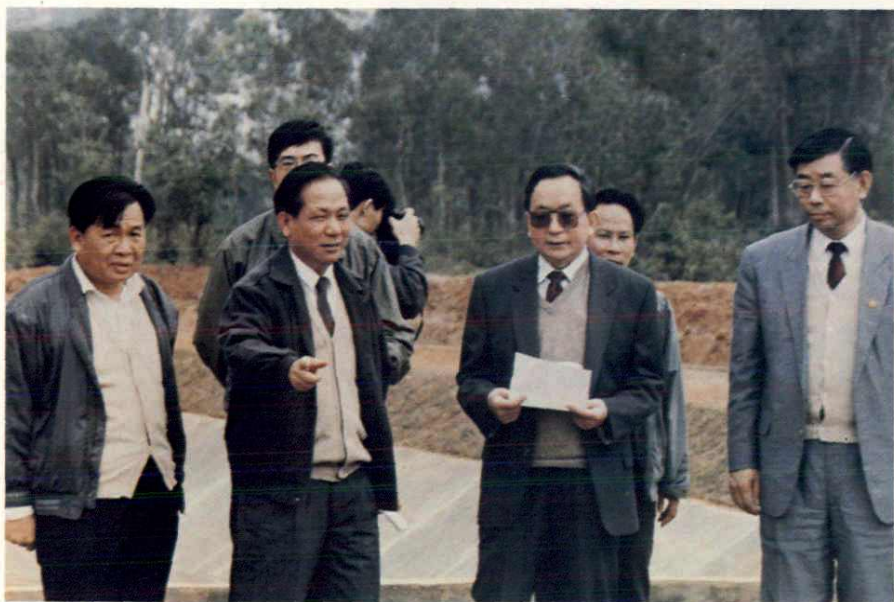
1992年12月国务院副总理田纪云（右二）在省长刘剑锋（右一）、副省长陈苏厚（左二）陪同下视察松涛灌区。