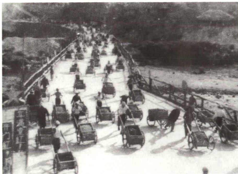
运土主力——胶轮车运土进坝