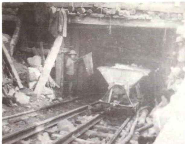
正在开挖中的南丰隧洞