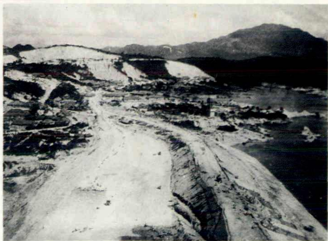
大坝前堤 185 米拦洪断面完成。