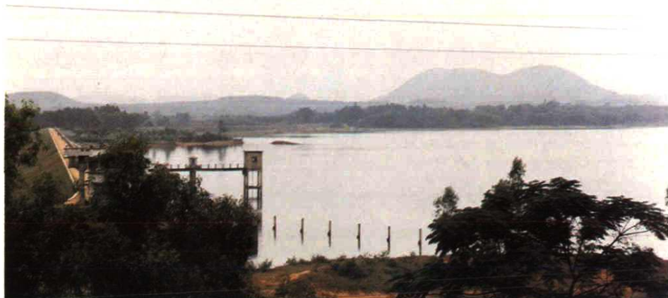
东干渠反调节水库之一——跃进水库