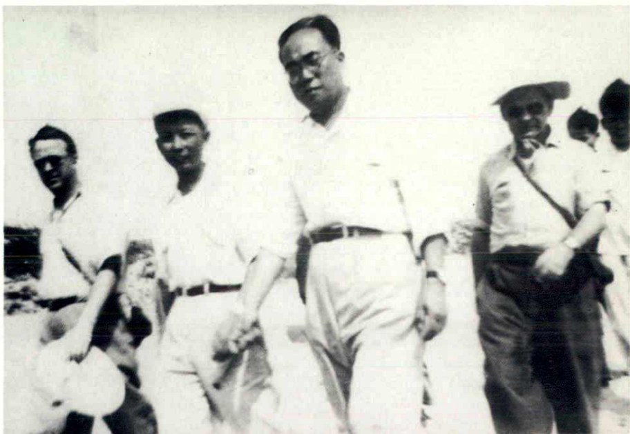
1958年12月，水利部副部长冯仲云（右二）、苏联专家组组长沃洛宁（右一）、专家儒可夫（左一）在广东水电厅长刘兆伦（左二）陪同下视察松涛水库工地。