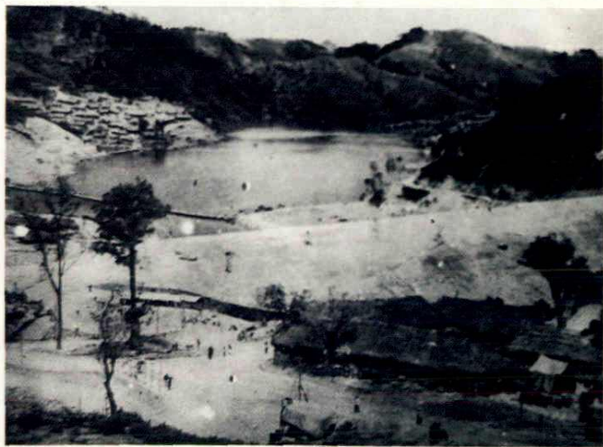
大坝前堤 170 米拦洪断面完成。