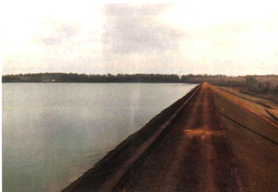
东干渠反调节水库之二——福山水库