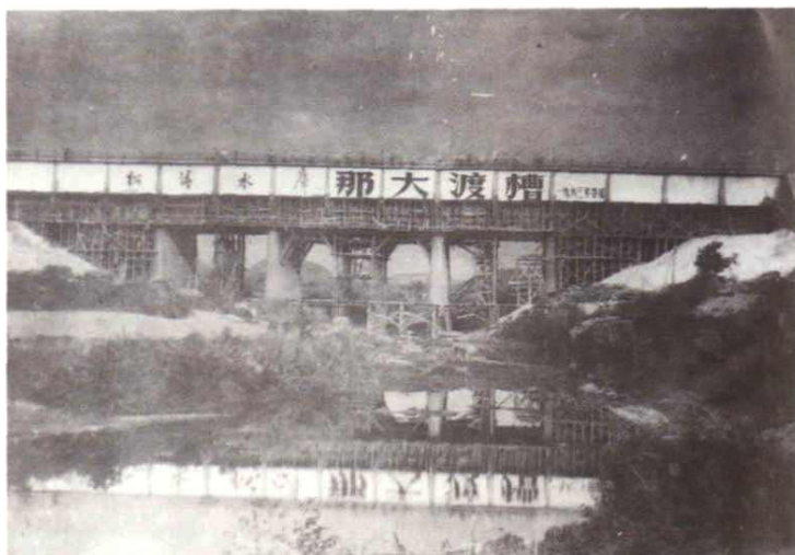
松涛灌区流量最大的那大渡槽