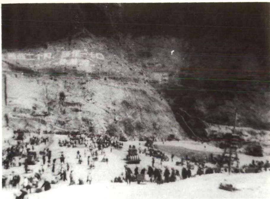
大坝填筑场面，拖拉机带肋形碾碾压。