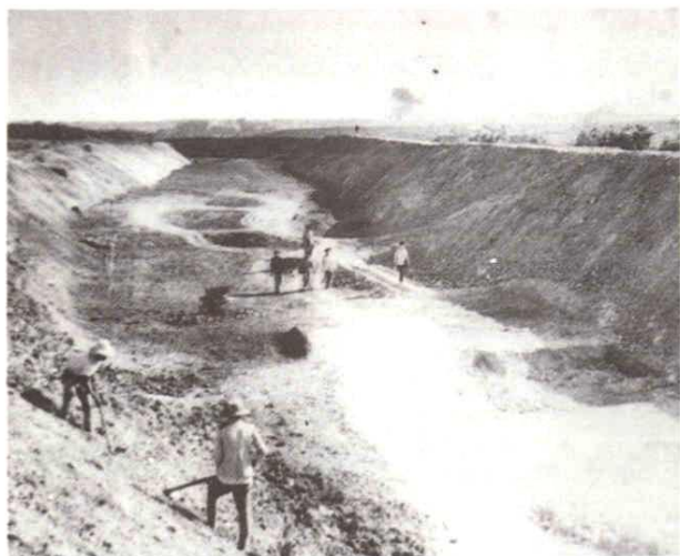
即将完工的松涛东干渠