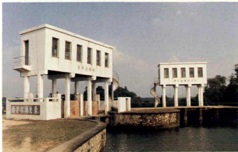
东干渠节制闸及那 大分干渠进水闸