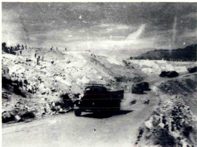
广东省派来汽车百辆， 支援填坝运土。