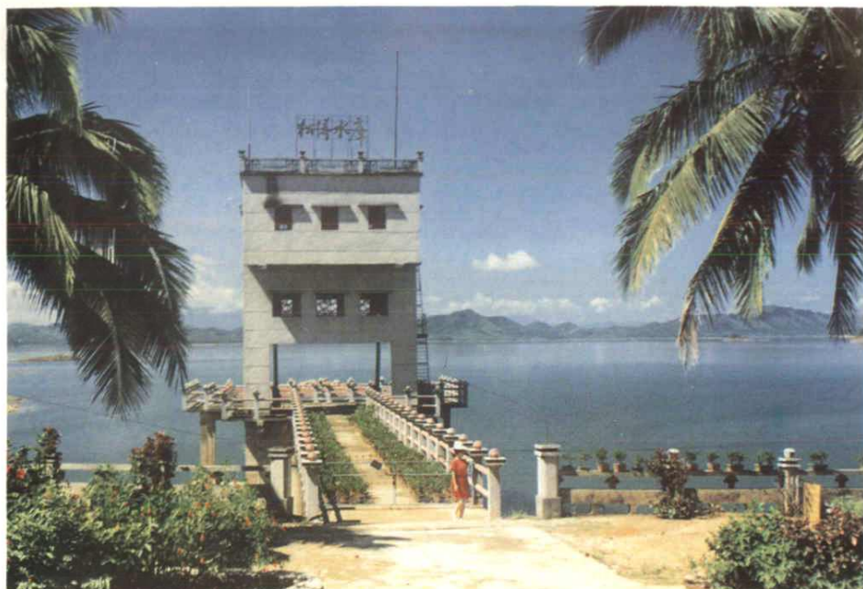
南丰输水隧洞进水塔