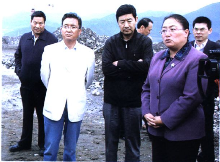
州委副书记、州长尼玛卓玛来我县视察