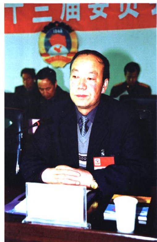
县政协第十三届委员会主席陈国顺