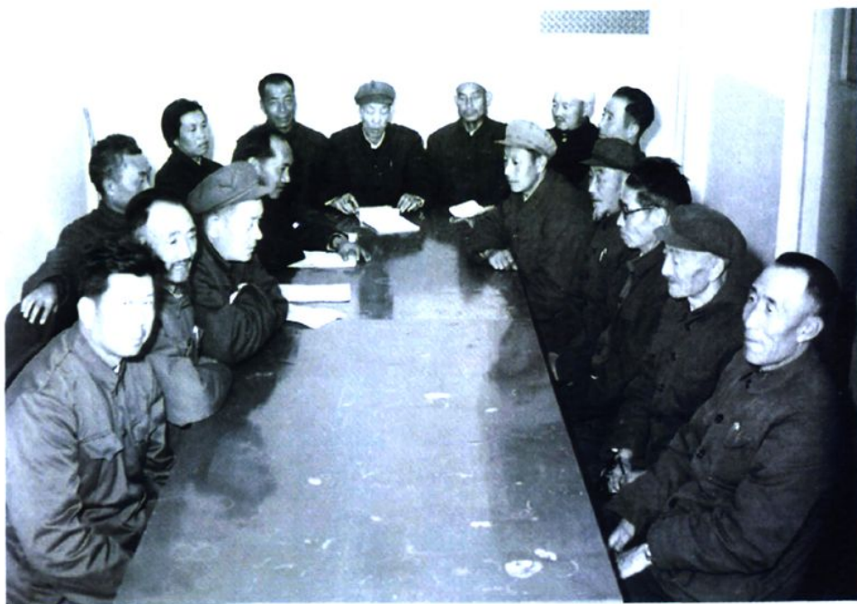
政协恢复后各族各界委员参政议政,共商发展大计