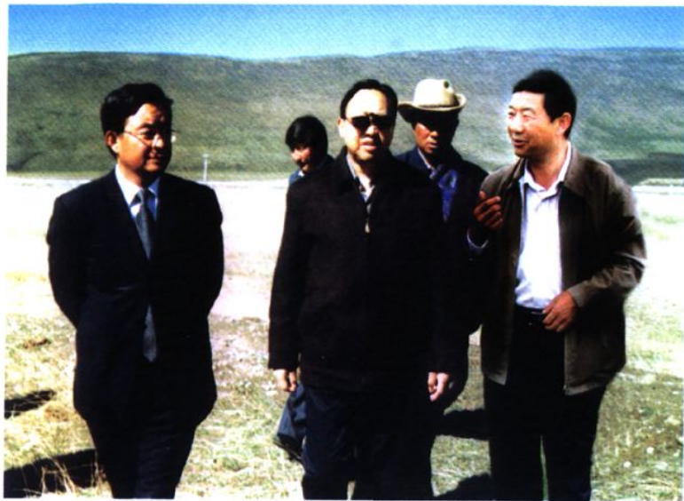
省政协主席白玛(左二)视察现代高效畜牧业生产