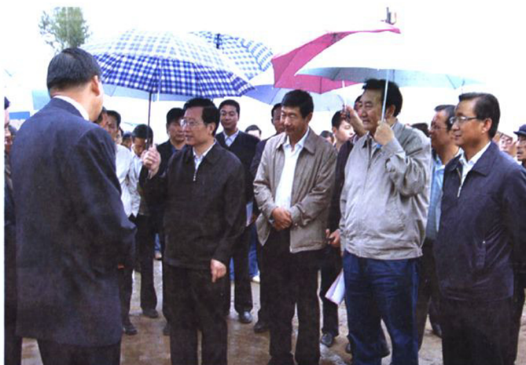
省委书记强卫(左二)来我县视察