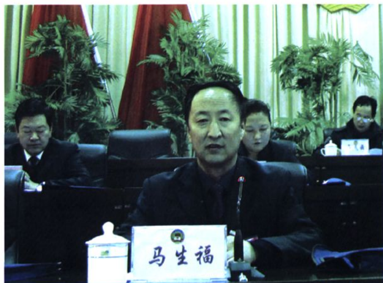
县政协第十四届委员会主席马生福