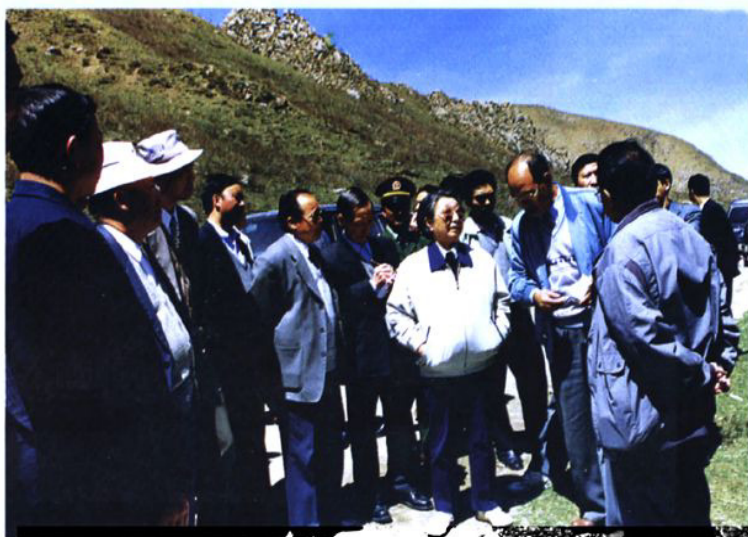
全国政协副主席钱正英来我县视察石头峡水库选址情况