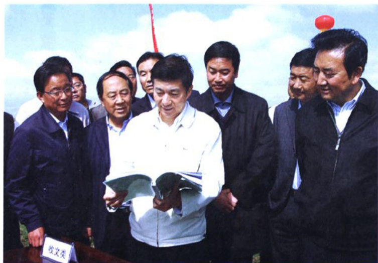
省长骆惠宁(左二)在门源县调研