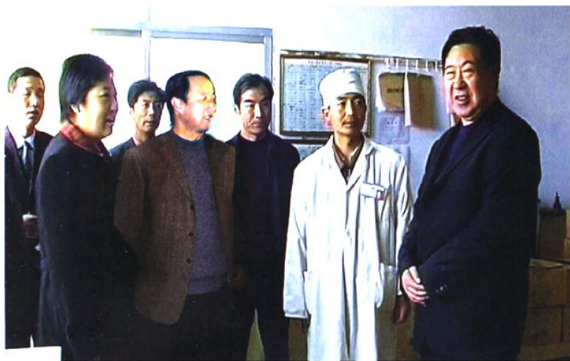
州政协主席苏廷贤(右一)来我县视察新农合工作