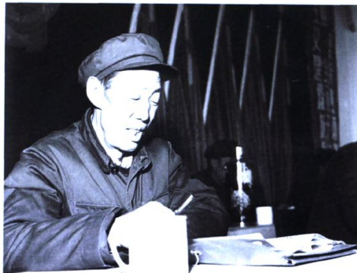
县政协第八、九届委员会主席王积元