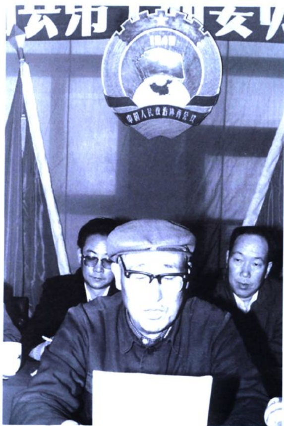
县政协第十届委员会主席马德义