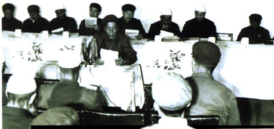
1981年4月5日政协恢复后召开七届一次全体会议