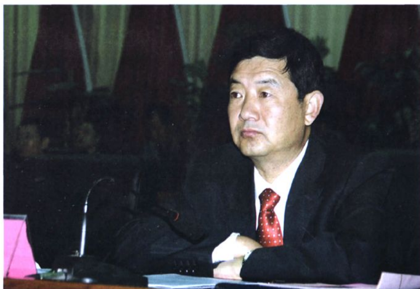
县委副书记、县长马应寿在全县政协工作会议上