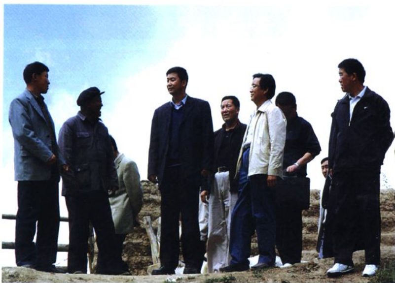
州委书记严金海来我县调研