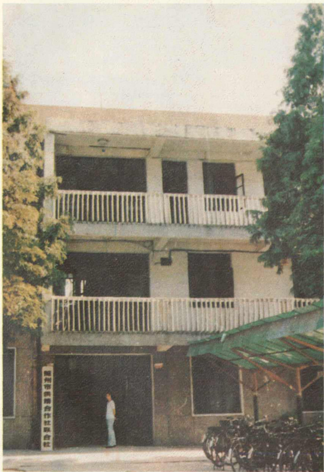
随州市供销社联合社办公楼