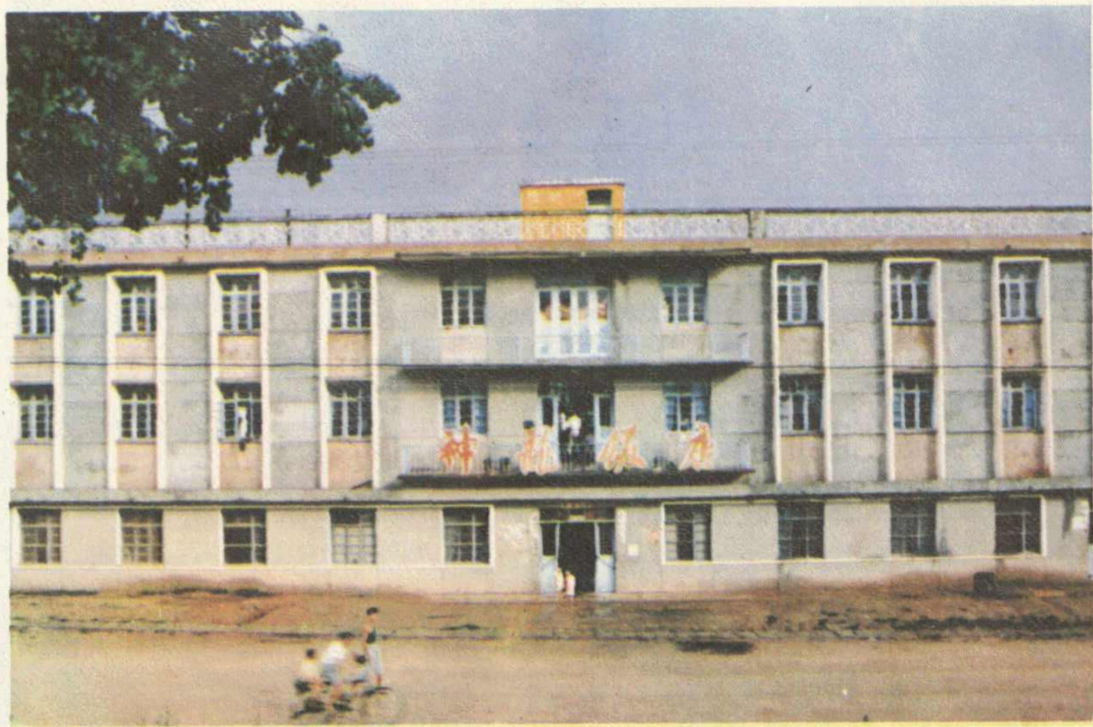
英店供销社神龙饭店