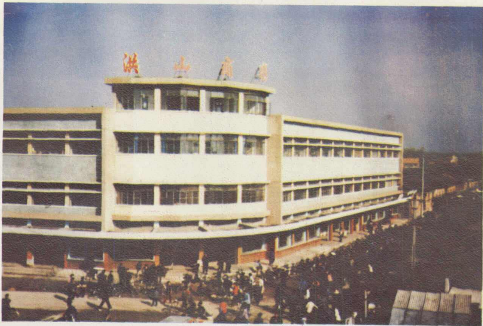
洪山供销社洪山商场