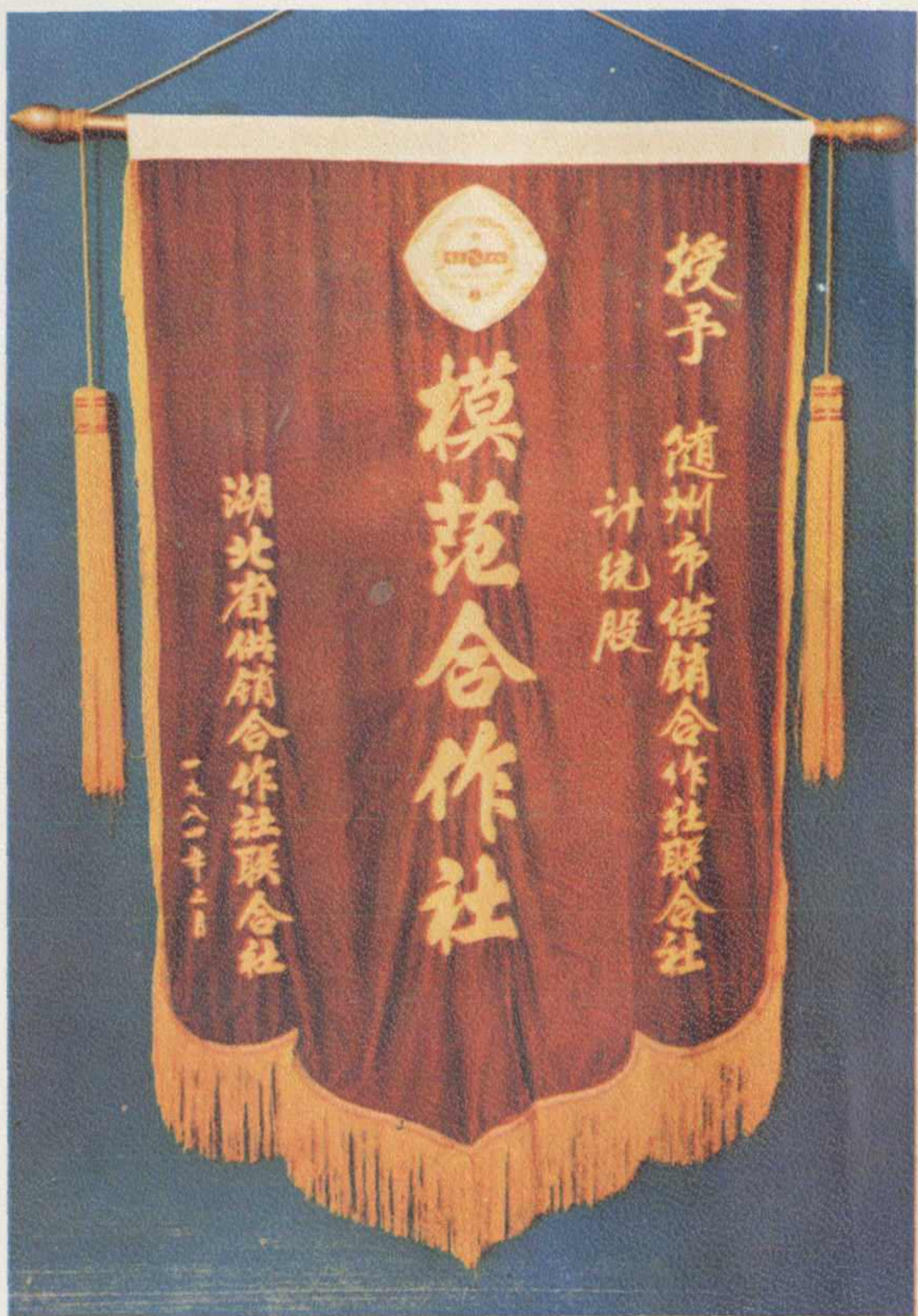
湖北省供销社合作社联合会授予的锦旗