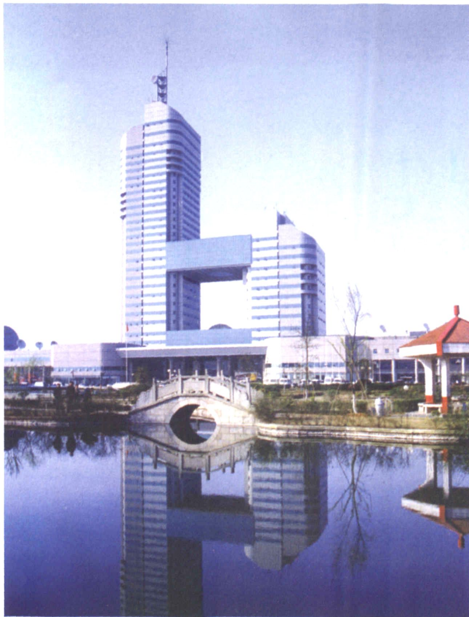
金鹰大厦是金鹰影视文化城的标志性建筑，是广电湘军的大本营。历经8年建成，2001年10月全面投入使用。