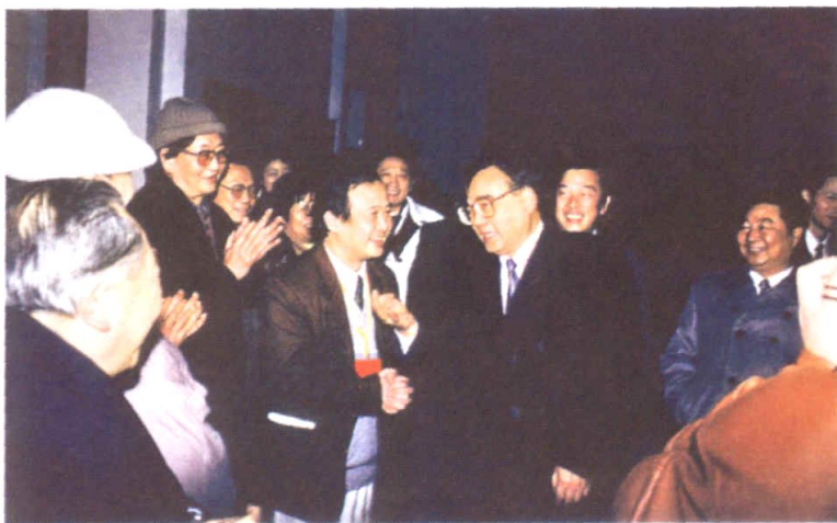
1996年3月23日，全国电影工作会议期间，中共中央政治局委员、书记处书记、中宣部部长丁关根冒雨视察了潇影厂。