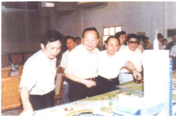
1996年6月21日，全国人大常委会副委员长田纪云（左二）在省领导熊清泉（右一）、杨正午（右二）的陪同下视察湖南省广播电视中心工地。