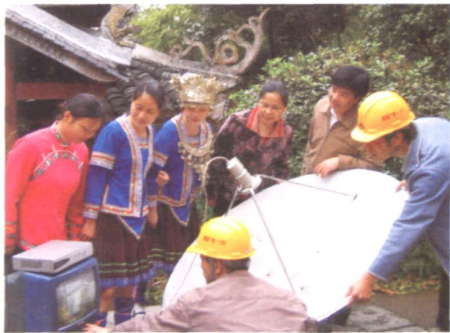
2000年4月，“天锅”（卫星接收天线）装进侗山寨。图为怀化市广电局负责人、工程技术人员和通道侗族自治县双江镇村民共享“天锅”调试成功的喜悦。