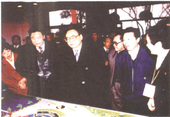
1996年3月23日，中共中央政治局委员、书记处书记、中宣部部长丁关根（左二）在中共湖南省委书记王茂林（左一）陪同下视察湖南省广播电视中心工地。