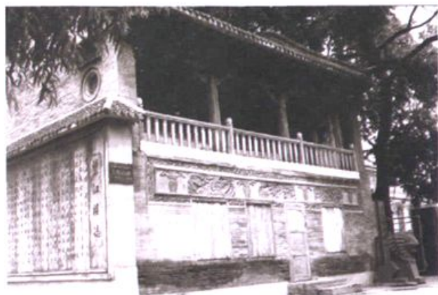
宁古塔师范学堂旧址