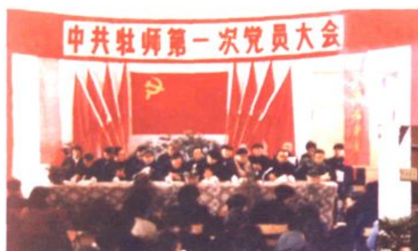
牡丹江师范学校第一次党员大会