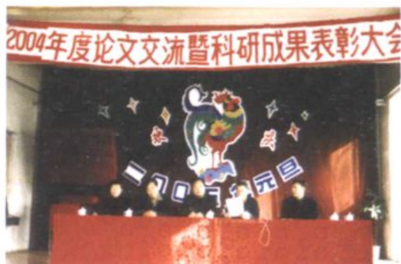
论文交流及暨科研成果表彰大会