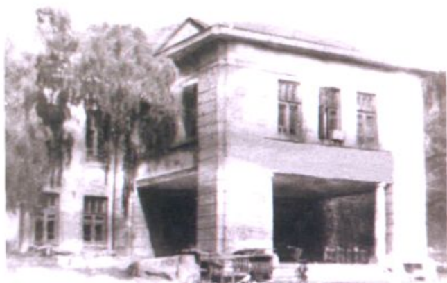
1950年牡丹江师范学校校舍