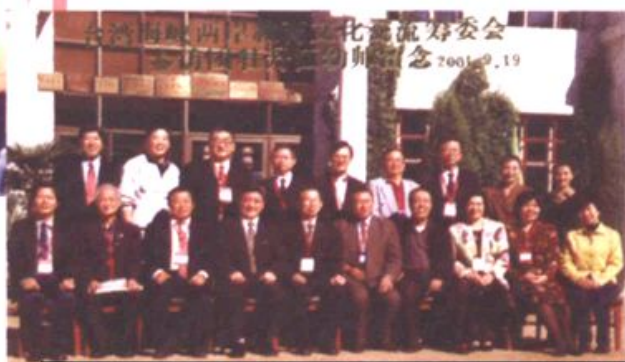
台湾海峡两岸教育文化交流筹委会参访团访问牡丹江幼儿师范学校