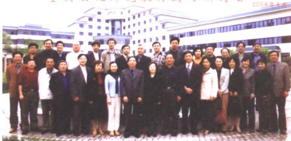
学校参加全国幼儿师范教材编写研讨会