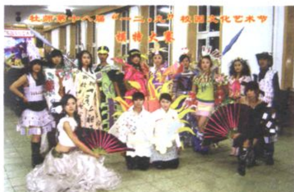
第十八届“一二·九”校园艺术节剪影