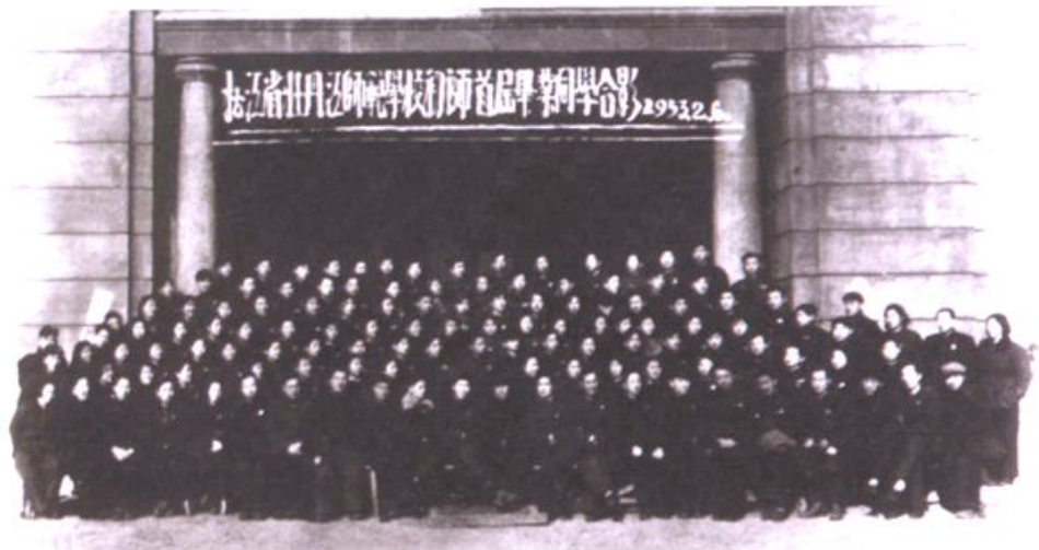
1953年松江省牡丹江师范学校首届初师毕业生