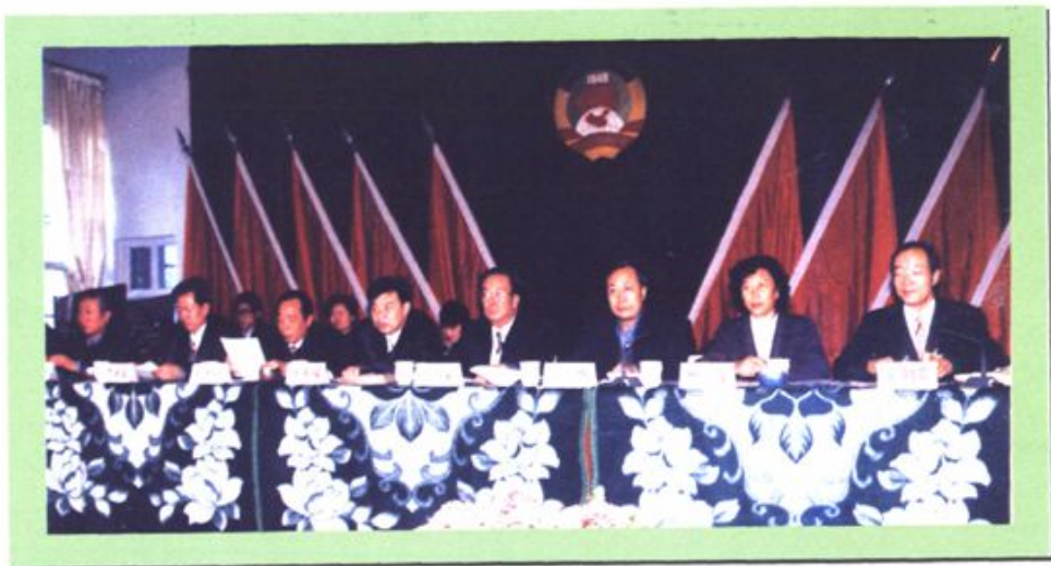
政协大武口区三届一次会议开幕式