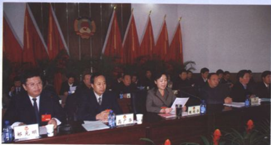
政协大武口区五届二次会议开幕式