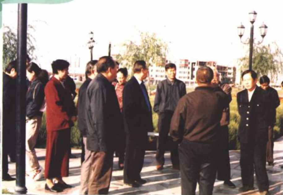
政协委员在视察工作