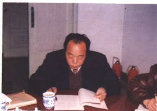
区二届政协主席那兆祥主持政协常委会