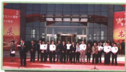
区政协举办庆祝人民政协成立60周年“书画展”