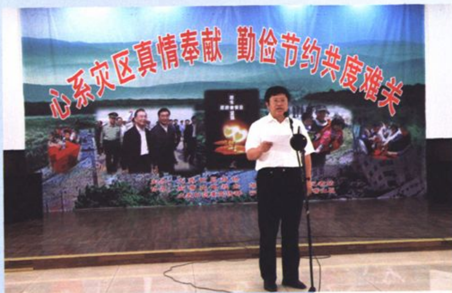
祁光明主席在区政协举办的“5.12”汶川地震捐款仪式致词