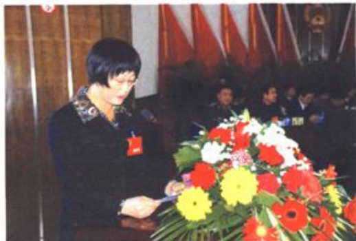
陈志芳副主席政协五届二次会议 上作《政协工作报告》