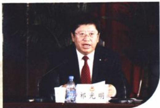
祁光明主席在政协五届二次会议上讲话