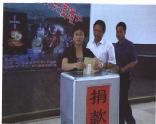
政协领导及委员捐款