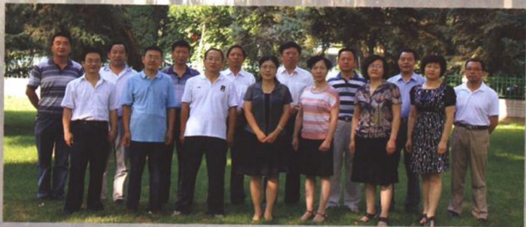
区政协全体机关修志人员