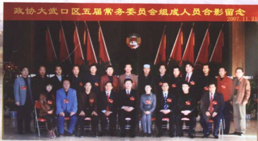
政协大武口区五届常委会组织人员