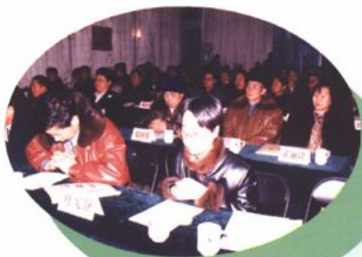
区二届一次政协列席人代会一角