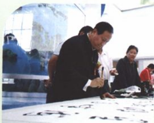
自治区政协副主席安纯仁在庆祝人民政协成立60周年“书画展”笔会现场