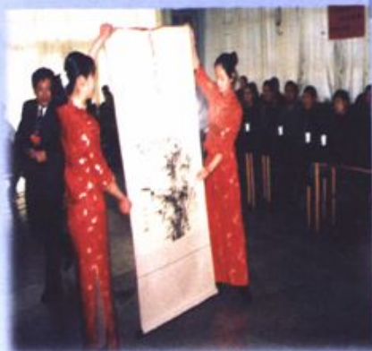
政协四届二次会议委员即兴作画