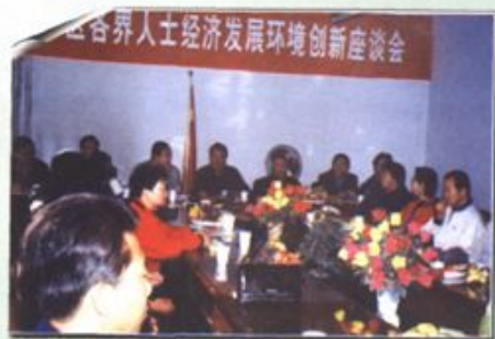
各界人士经济发展环境创新座谈会