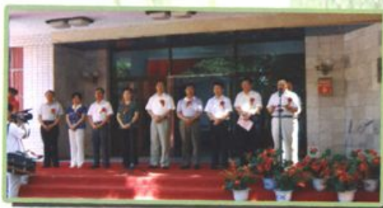
区政协举行“政协大武口区书画院”成立揭牌仪式