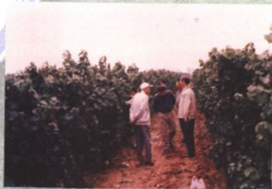
政协委员在视察工作