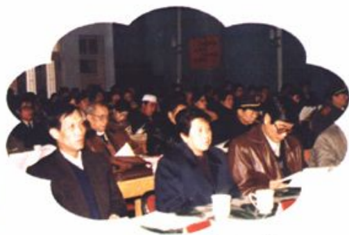
政协一届二次会议会场一角