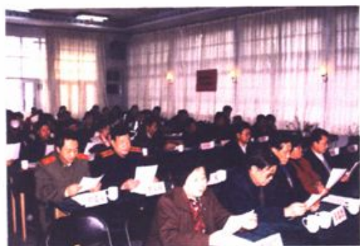
政协大武口区二届一次会议会场