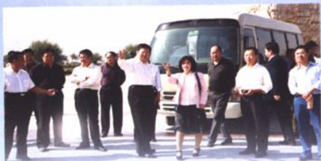
内蒙古自治区乌海市及区内部分县(区)政协来我区考察