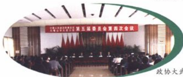
政协大武口区五届四次会议会场