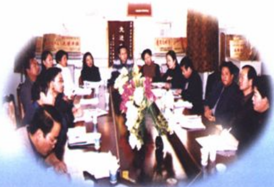
四届政协领导在基层调研工作