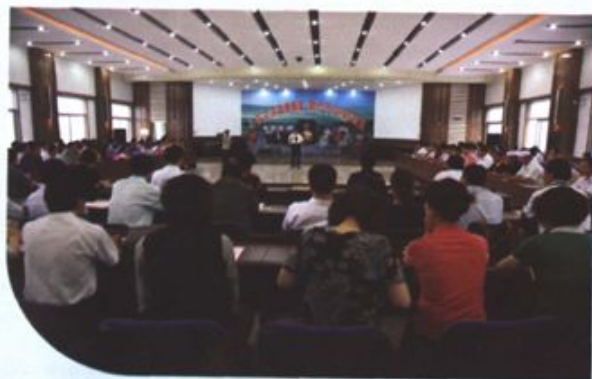
区政协举办的“5.12”汶川地震捐款现场