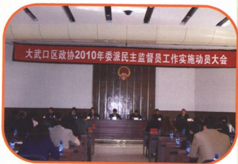
区政协召开2010年委派民主监督员工作实施动员大会