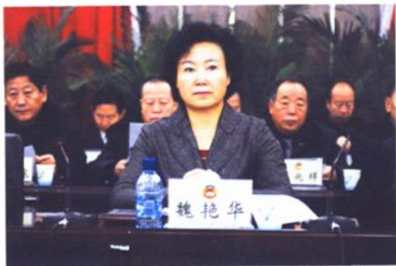
市委常委、区委书记在政协五届二次会议上讲话