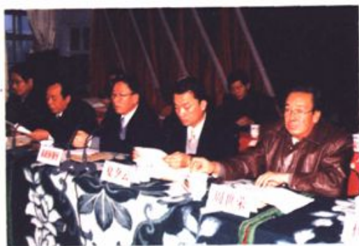
政协大武口区二届一次会议开幕式