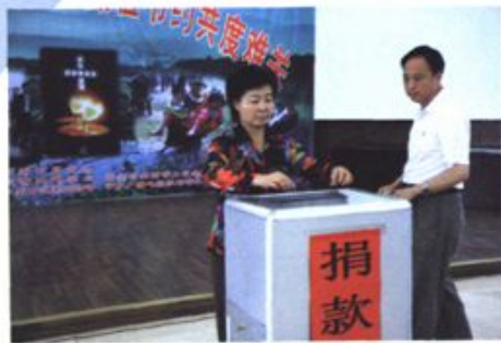
市委常委、区委书记魏艳华捐款