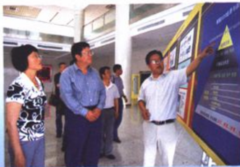
部分政协委员赴浙江招商引资