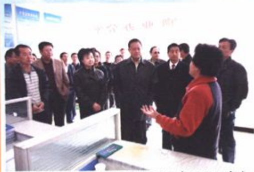
祁光明主席陪同自治区政协副主席陶源视察我区社区工作