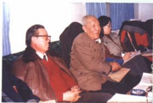
委员在讨论发言中