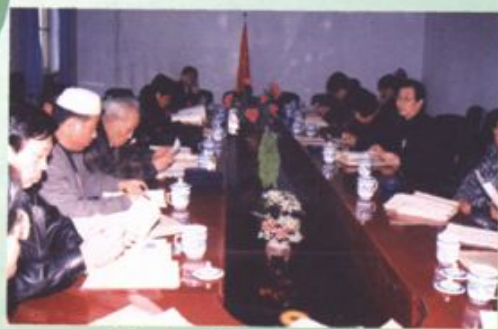
委员在认真讨论“两会报告”