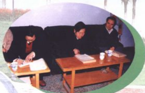
提案委员会审查委员提案