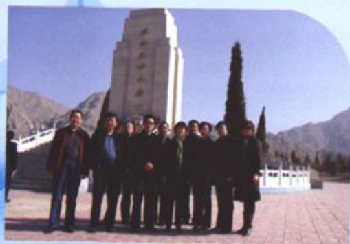
政协机关干部职工在烈士陵园缅怀革命先烈