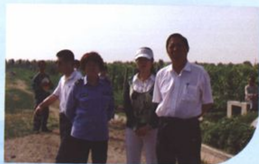
政协委员视察生态园林建设