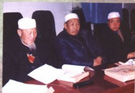
回族委员在座谈工作中