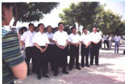
自治区党委书记张毅来我区视察