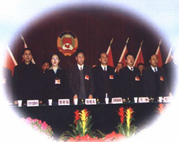
四届一次政协会议开幕