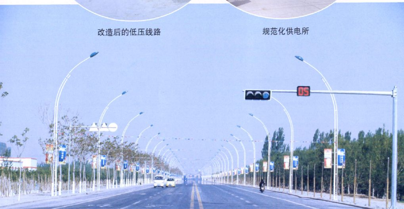
电缆入地的银河街