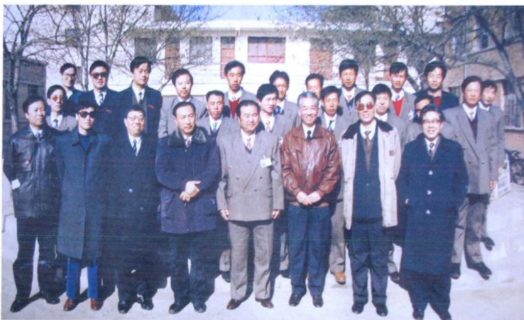
1993年,电力部副部长汪恕诚(右三)、西北电管局局长刘宏(左四)在宁夏电力局局长孟昭靖(右二)的陪同下视察贺兰县供电局,并与习岗电管站职工合影留念