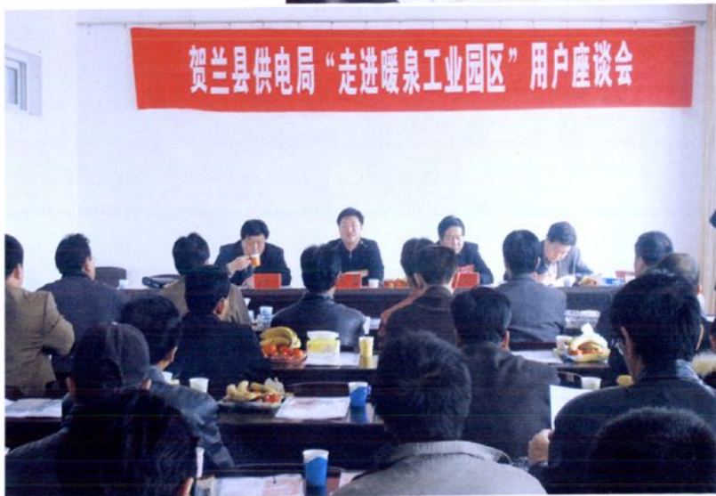
贺兰县供电局 领导现场为工业园 区用户排忧解难