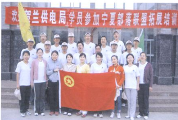
贺兰县供电局职工参加拓展培训