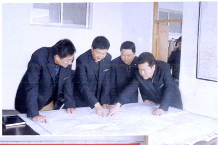
贺兰县供电局领导班子 规划电网