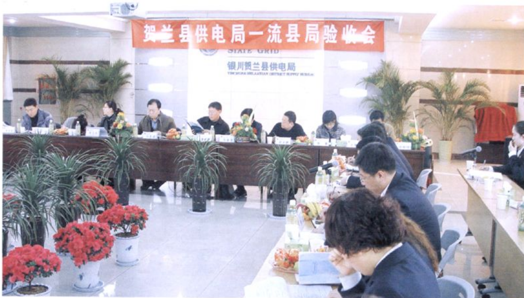
贺兰县供电局创区级“一流县供电企业”验收会