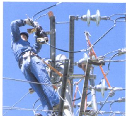
配网改造初见成效，供电可靠性得到提高