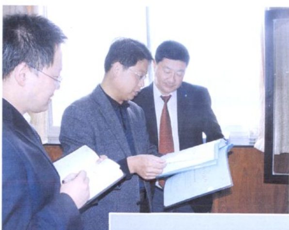
贺兰县供电局创国家二级 档案管理单位验收