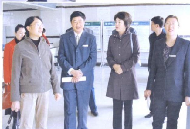
自治区精神文明建设指导委员会验收贺兰县供电局创建“文明单位”工作