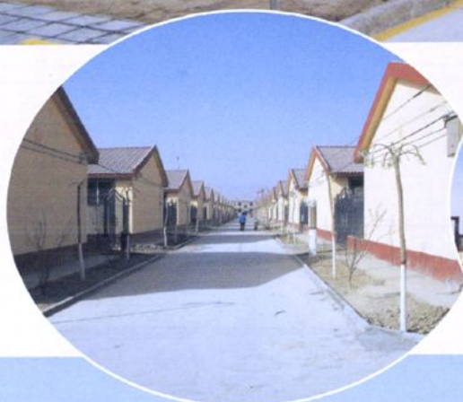
改造后的低压线路