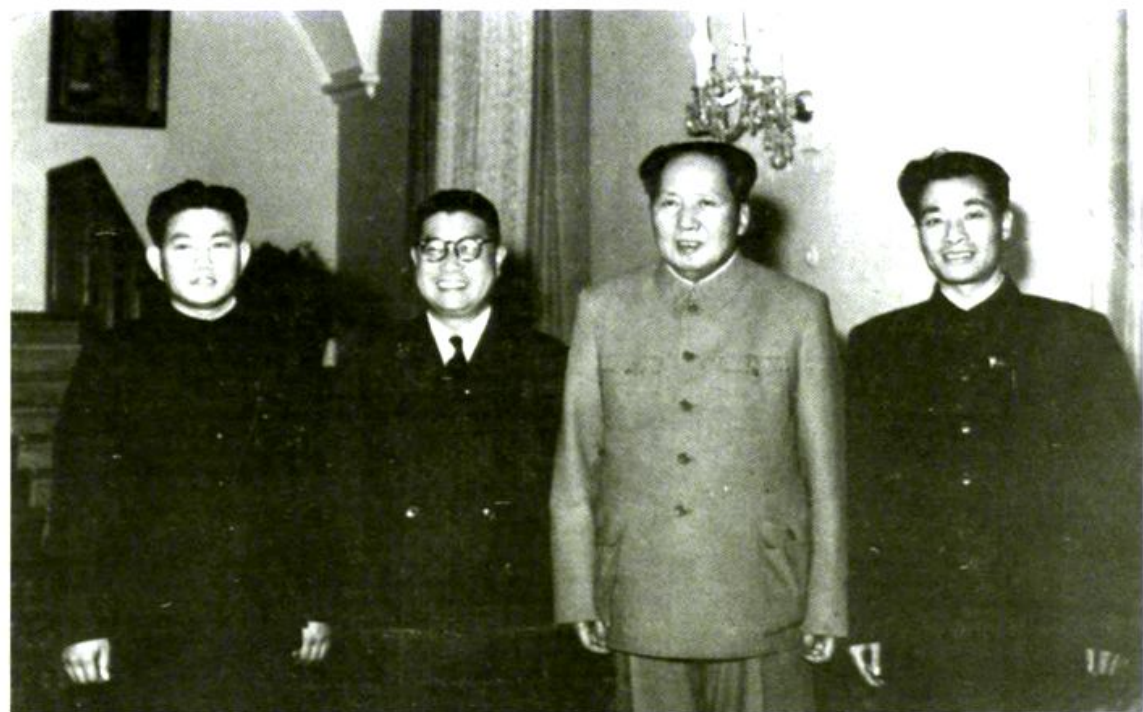
刘晓和毛泽东主席在一起 (左二为刘晓)