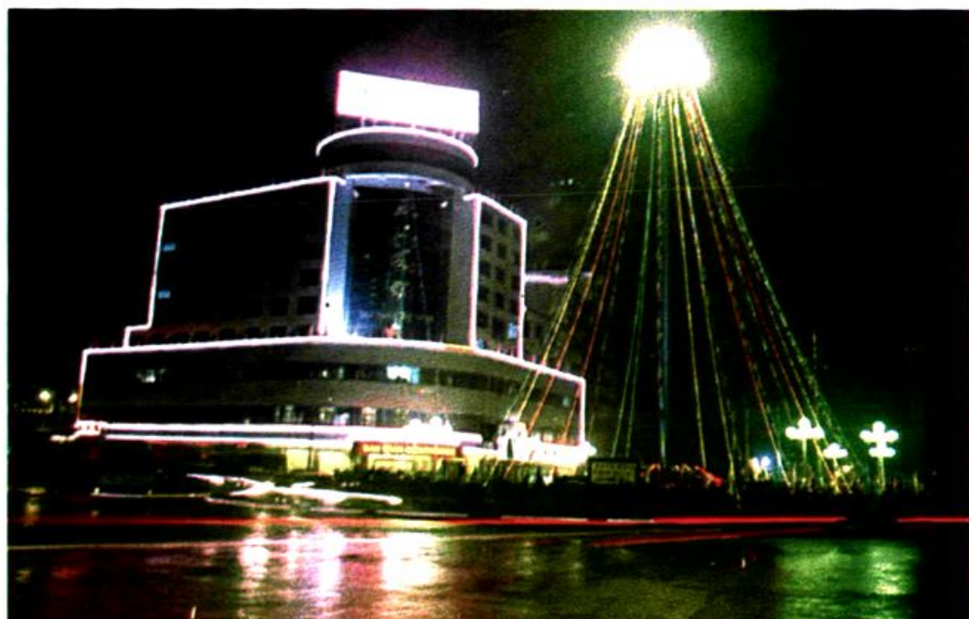
辰溪丹山宾馆夜景

辰溪丹山宾馆总投资 3000 万元, 占地面积 4800 平方米, 拥有客房部、美食城、夜总会等 10 层营业楼, 装有中央空调、电梯、闭路电视, 房间电话全球直拨。宾馆以“宾客至上, 优质服务”为宗旨, 竭诚为顾客提供周到的服务。