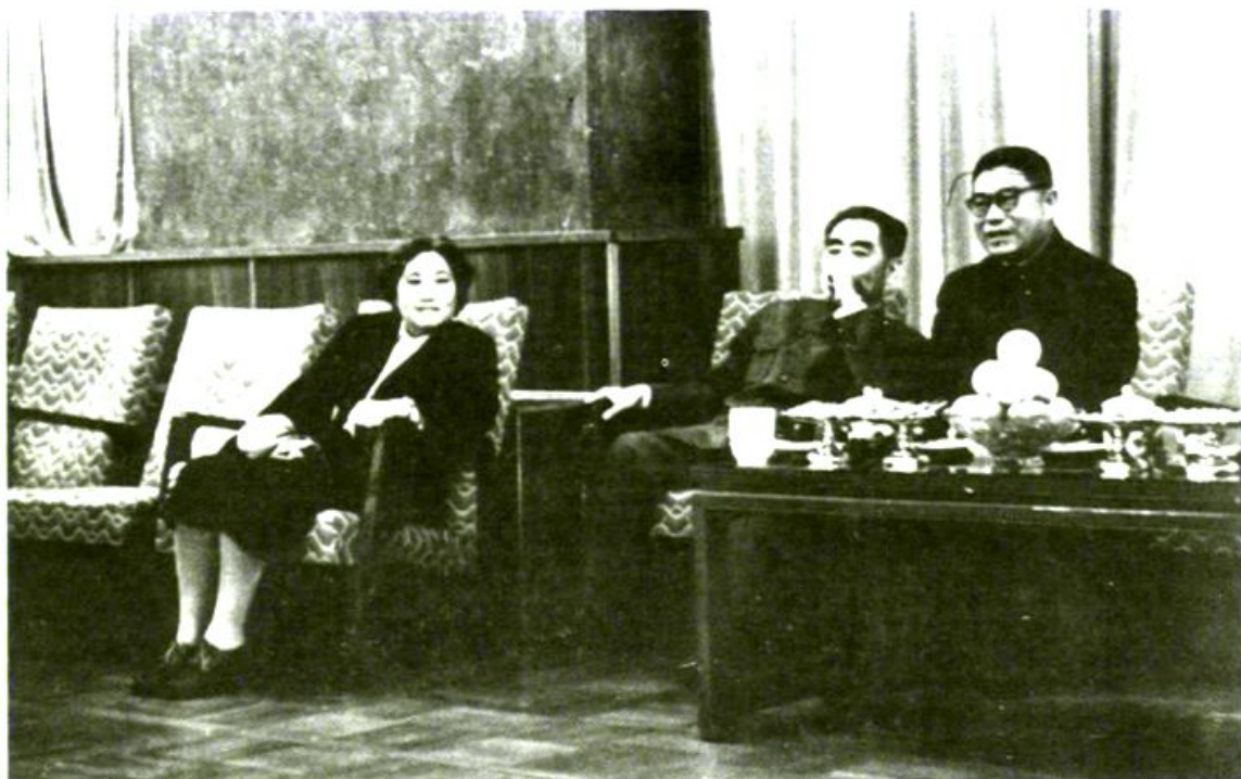
刘晓、张毅夫妇和周恩来总理在一起