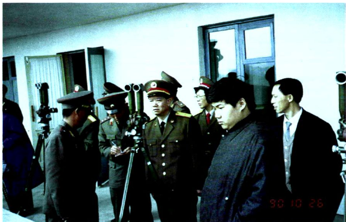
1990年10月，胡贵友将军率志愿军烈士家属代表团出访朝鲜，参加中国人民志愿军赴朝作战40周年纪念活动。（右二为毛新宇，右四为胡贵友）