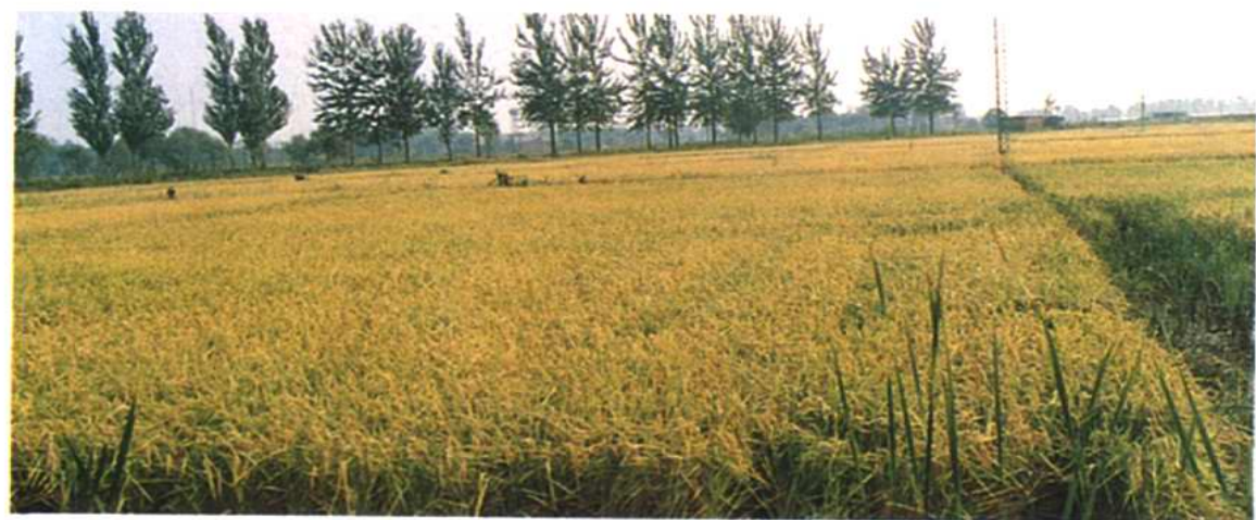
驰名中外的小站稻