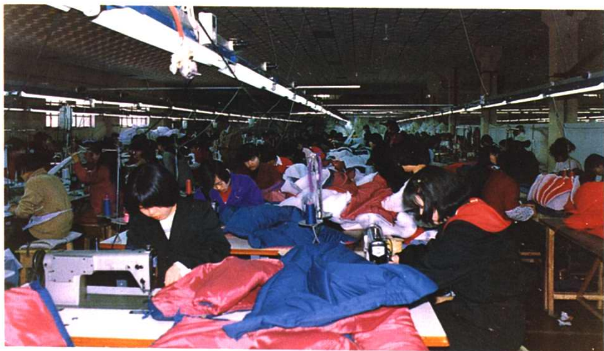
韩国独资企业“天津成日服装有限公司”生产场景