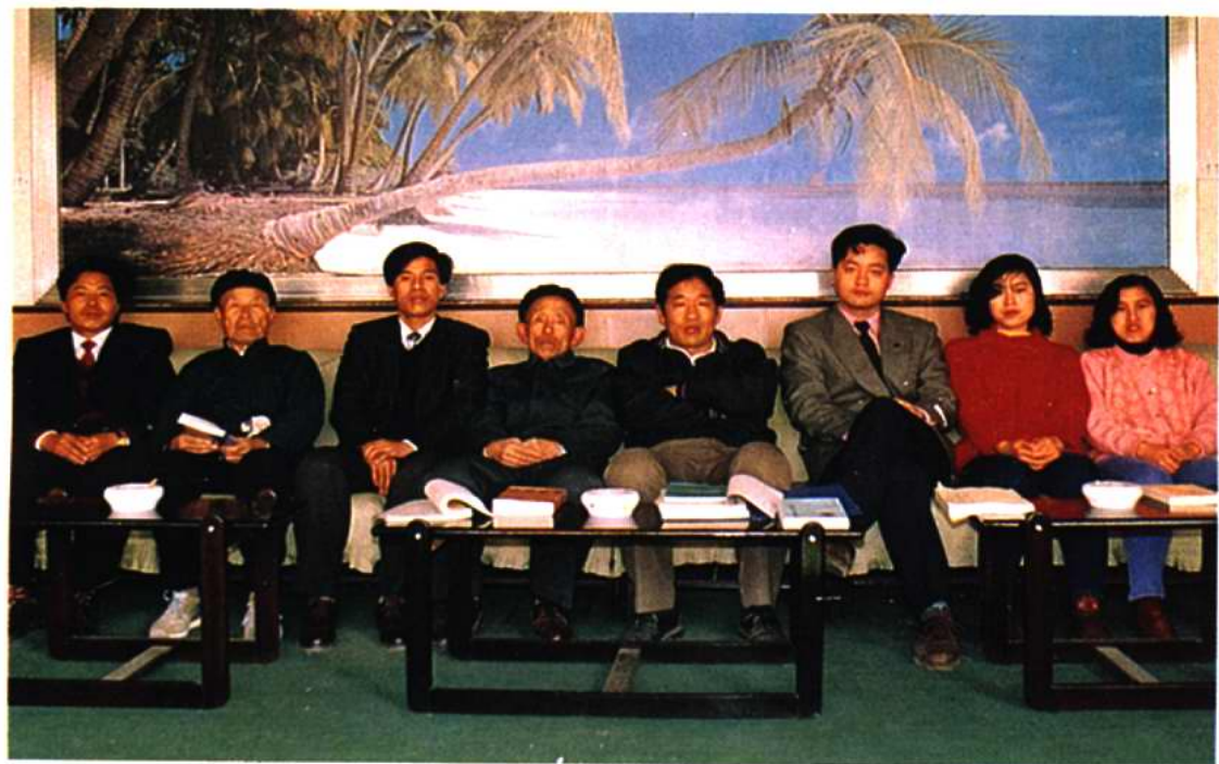
《八里台镇志》全体编修人员合影