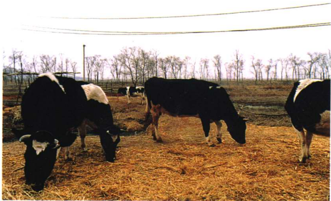
发展中的奶牛养殖业