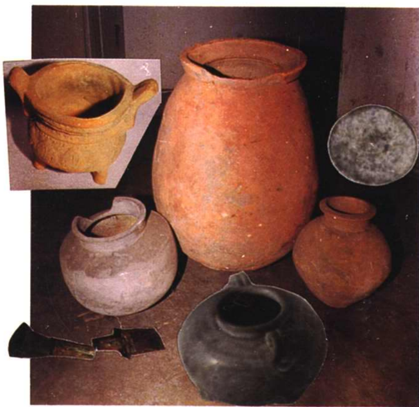
八里台镇出土的部分文物