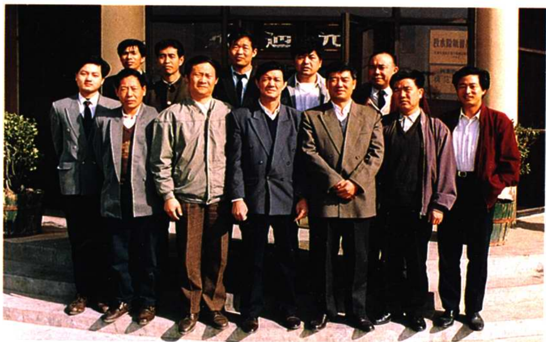
《八里台镇志》编修委员会合影