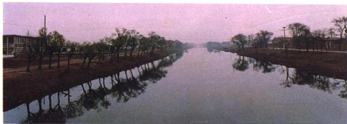
沟通海河、马场减河的洪泥河纵贯全镇