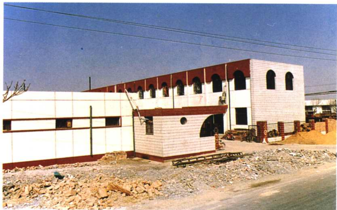
镇办企业——元通针织厂外景