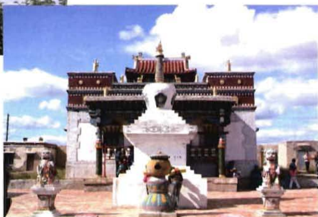
嘎黑拉庙 嘎黑拉庙