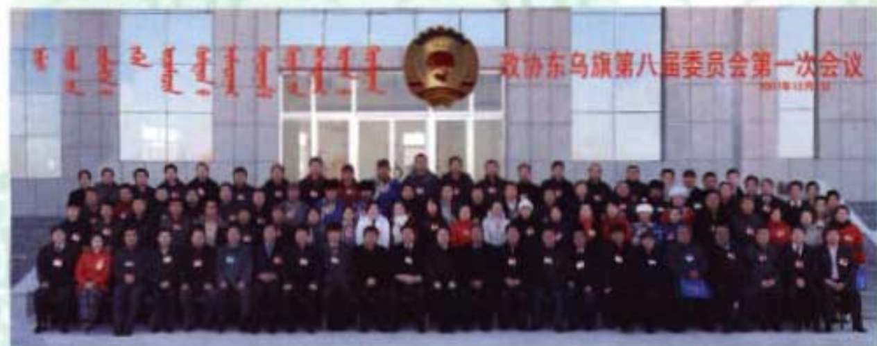
政协东乌旗第八届委员会第一次会议留念