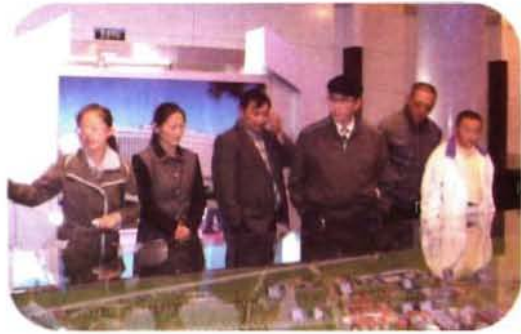
政协牧民委员在阿荣旗参观历史博物馆

ᠠᠮᠠᠨᠢᠯᠠᠭ ᠲᠡᠭᠦᠨ ᠲᠤᠨ ᠲᠤᠨ ᠲᠤᠨ ᠲᠤᠨ ᠲᠤᠨ ᠲᠤᠨ ᠲᠤᠨ ᠲᠤᠨ ᠲᠤᠨ