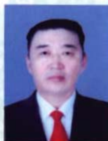
照·东布日勒：第七届主席