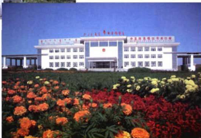
国家一级陆路口岸——珠恩嘎达布其 珠恩嘎达布其 珠恩嘎达布其