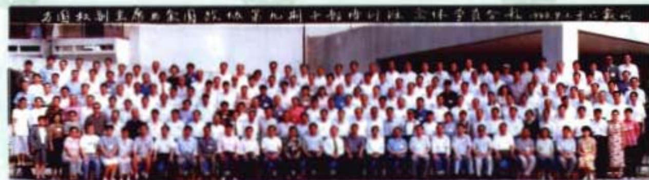
万国权副主席与全国政协东第九期干部培训班全体学员合影