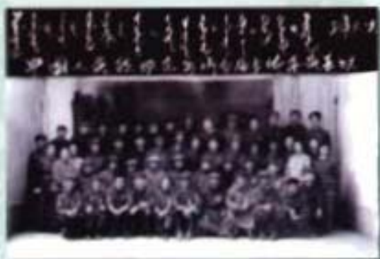
政协东乌旗第一届 委员会全体委员合影