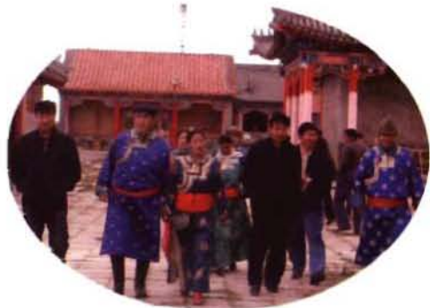
政协牧民委员在甘珠日庙参观

ᠠᠮᠠᠨᠢᠯᠠᠭ ᠲᠡᠭᠦᠨ ᠲᠤᠨ ᠲᠤᠨ ᠲᠤᠨ ᠲᠤᠨ ᠲᠤᠨ ᠲᠤᠨ ᠲᠤᠨ ᠲᠤᠨ