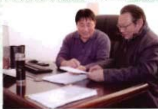
政协提案委员会审查提案提交 情况：(左) 导弹、照日格图