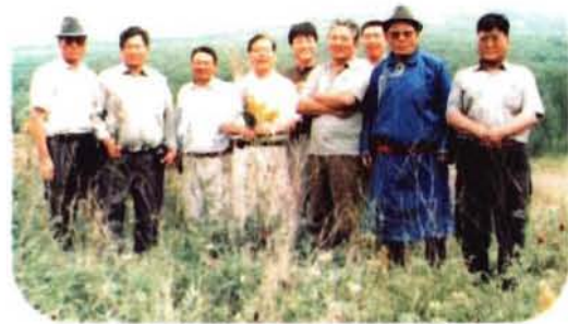
政协委员在博格达山林场边

ᠠᠮᠠᠨᠢᠯᠠᠭ ᠲᠡᠭᠦᠨ ᠲᠤᠨ ᠲᠤᠨ ᠲᠤᠨ ᠲᠤᠨ ᠲᠤᠨ ᠲᠤᠨ ᠲᠤᠨ ᠲᠤᠨ ᠲᠤᠨ