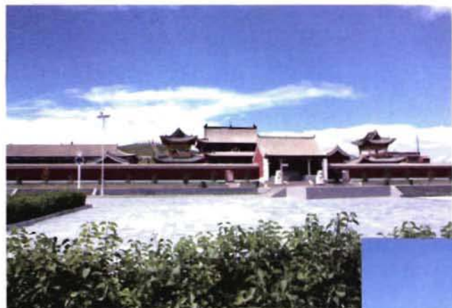
莫罗木喇嘛库伦庙 莫罗木喇嘛库伦庙