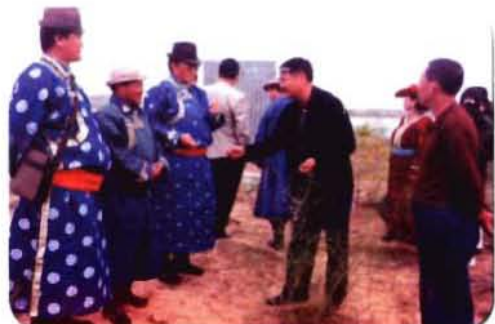
政协委员在鄂尔多斯市参观学习

ᠠᠮᠠᠨᠢᠯᠠᠭ ᠲᠡᠭᠦᠨ ᠲᠤᠨ ᠲᠤᠨ ᠲᠤᠨ ᠲᠤᠨ ᠲᠤᠨ ᠲᠤᠨ ᠲᠤᠨ ᠲᠤᠨ