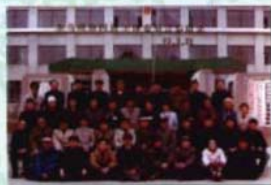
政协东乌旗第四届 委员会全体委员合影