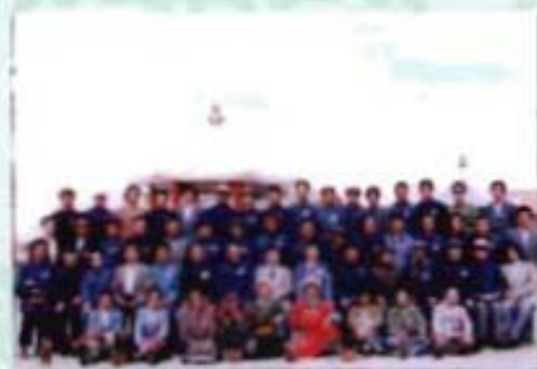
政协东乌旗第三届 委员会全体委员合影