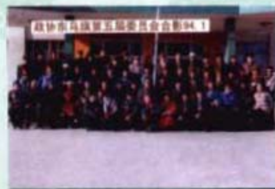
政协东乌旗第五届 委员会全体委员合影