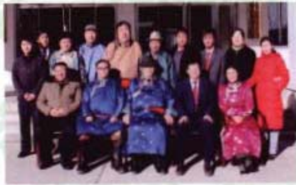
政协东乌旗第八届委员会主席、副主席和机关工作人员