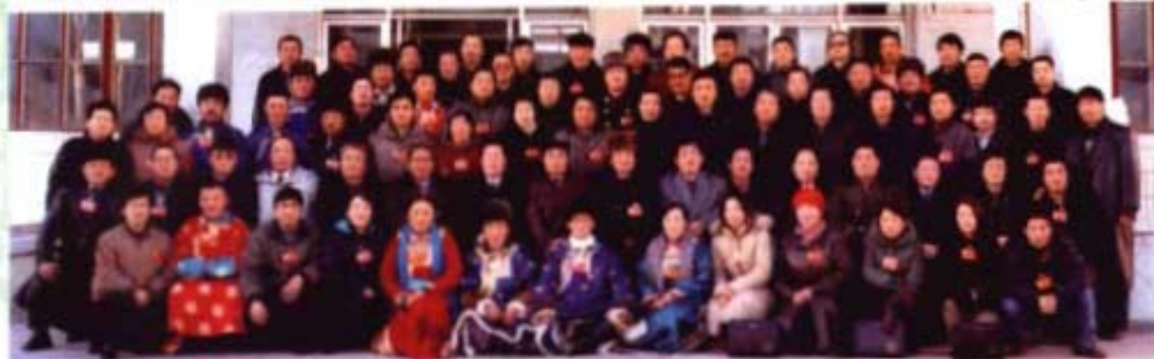
政协东乌旗第七届委员会第一次会议留念