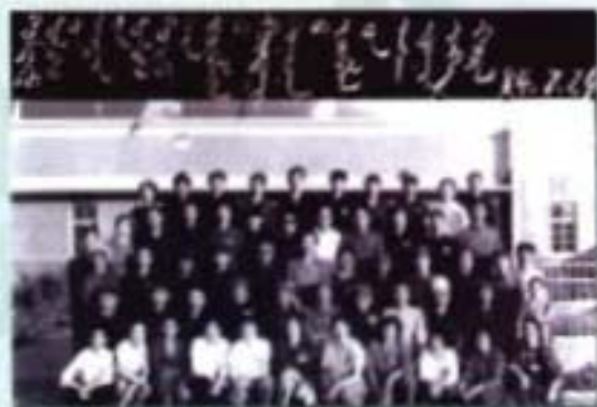
政协东乌旗第二届 委员会全体委员合影