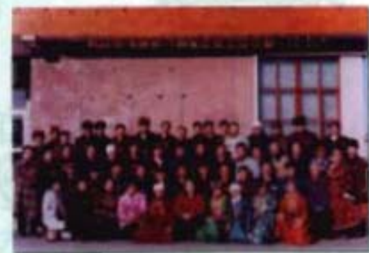
政协东乌旗第六届 委员会全体委员合影