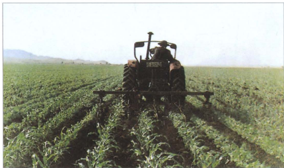
东方红—80型拖拉机在 进行机械化中耕作业