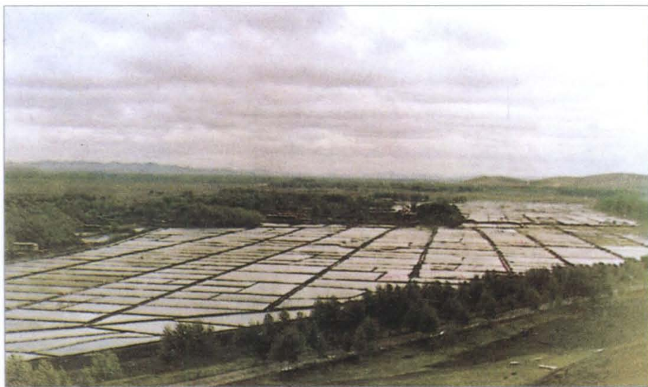
大坝沟镇水田一角