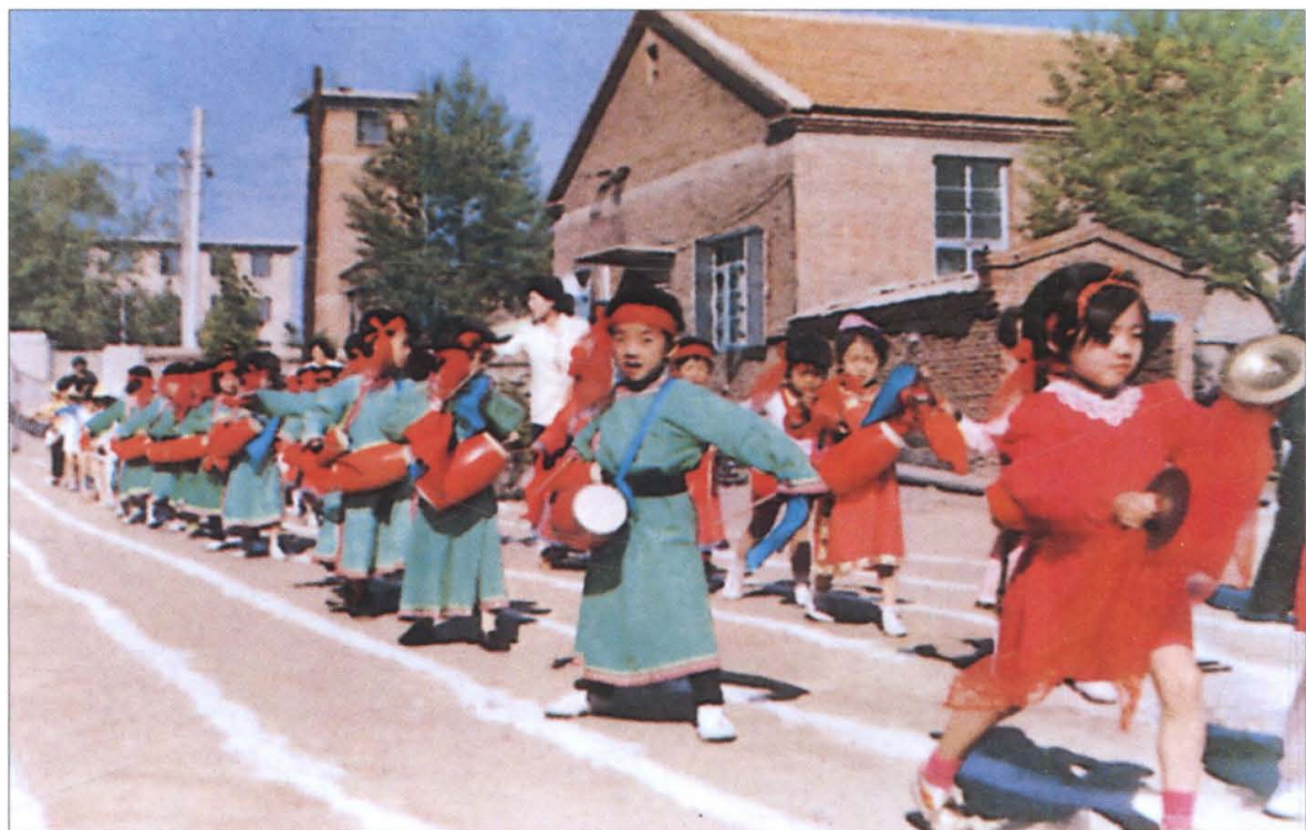
旗幼儿园孩子们表演安代舞