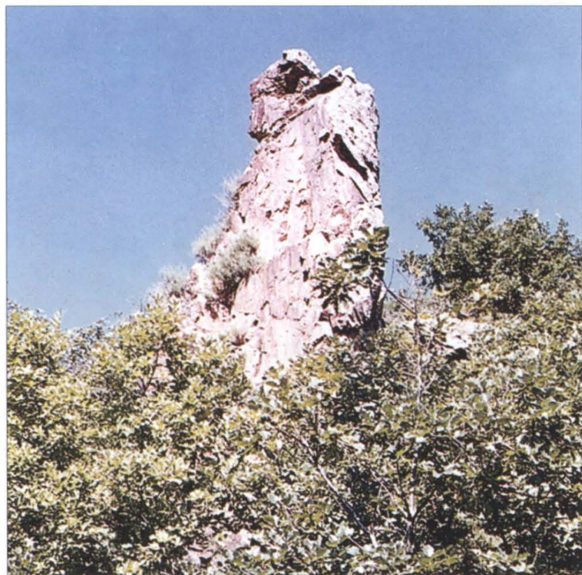
▼ 永丰水库 ▶ 鸽子峰