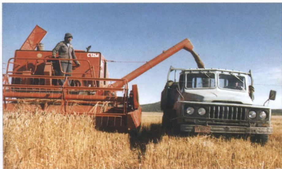
机械化家庭农场收割小麦