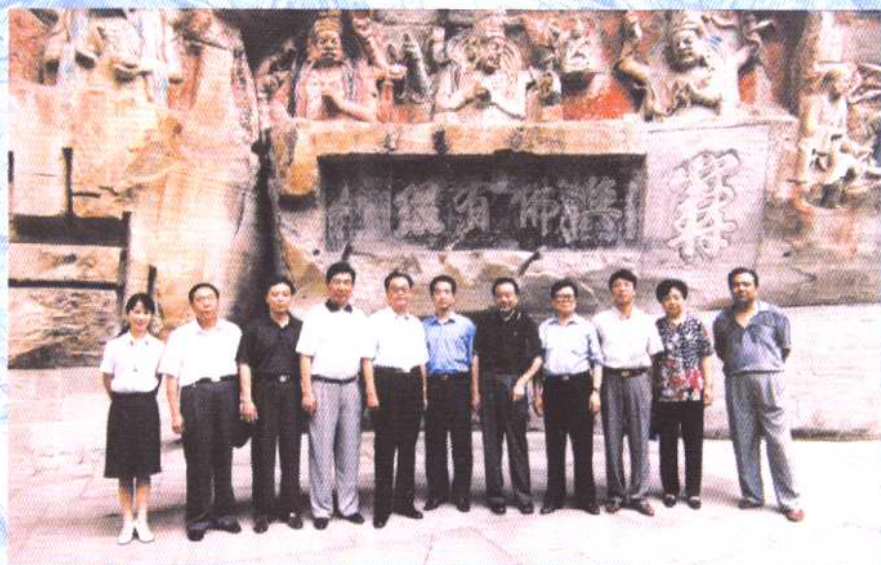
2000年9月，全国政协副主席毛致 用(左五)参观大足石刻，与市县领导张忠 惠、丁先发、黄晓春等合影。