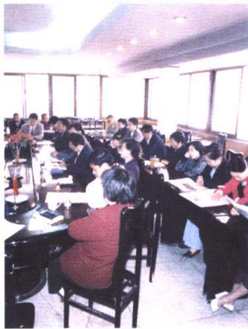
县政协机关干部职工在学习。