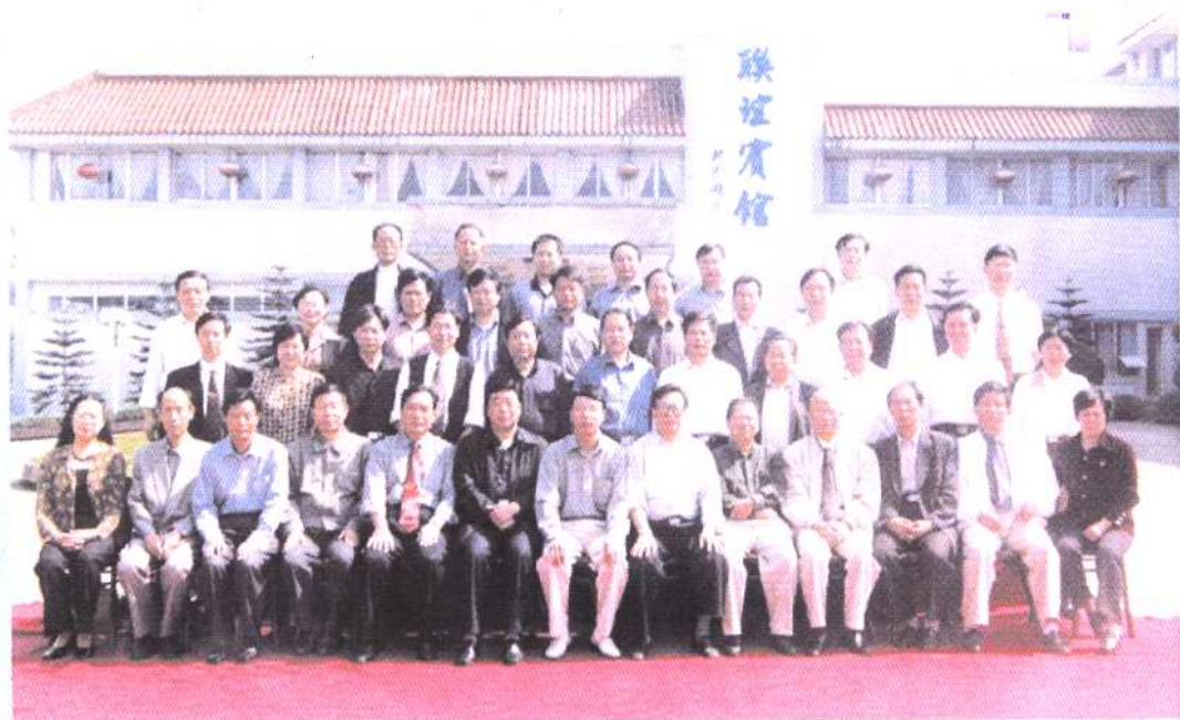
2001年10月，安徽黄山市、湖北钟祥市、江苏苏州市、湖南张家界市、江西九江市、福建武夷山市、重庆大足县等地政协，在大足县龙水湖畔联谊宾馆举行第二届世界遗产地政协联谊会，与会人员合影留念。