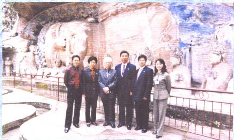
2002年，全国政协副主席周铁农 (左三)参观大足石刻，与市县领导张 忠惠、裴智、聂坤健等合影。