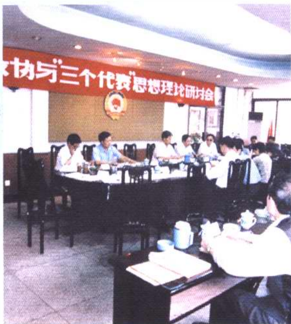
县政协召开人民政协与“三个代表”重要思想理论研讨会。