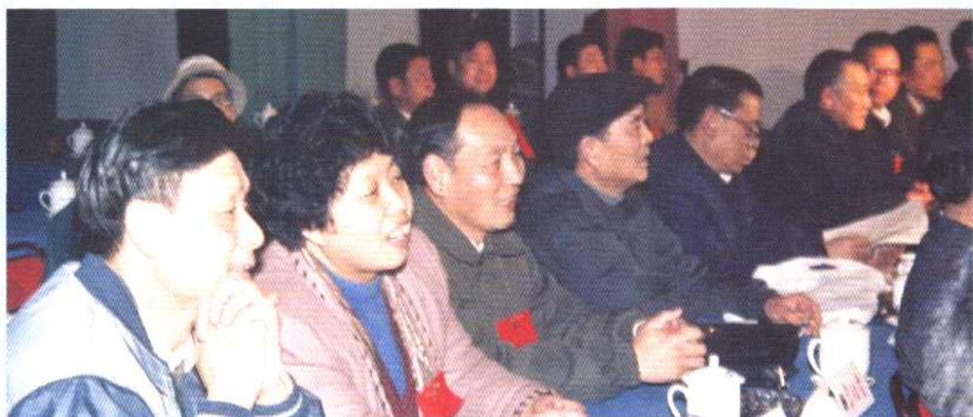
县政协五届一次会议主席台一角，政协领导在主席台上。