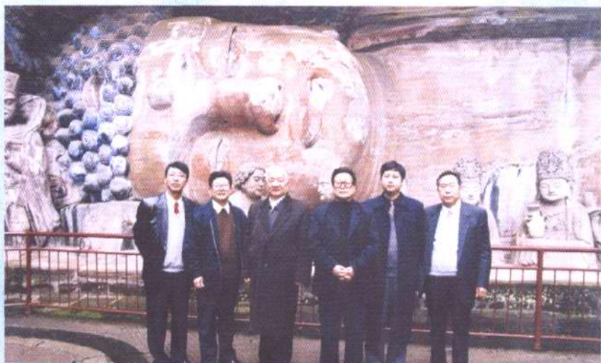
2002年，全国政协副主席王文元(左三)参观大足石刻，与县领导吕明良、丁先发、黄晓春等合影。