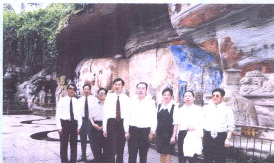
1999年10月，全国政协副主席白立忱(右四)参观大足石刻，与市县领导黄立沛、吕明良、丁先发、黄晓春、曾足幼等合影。