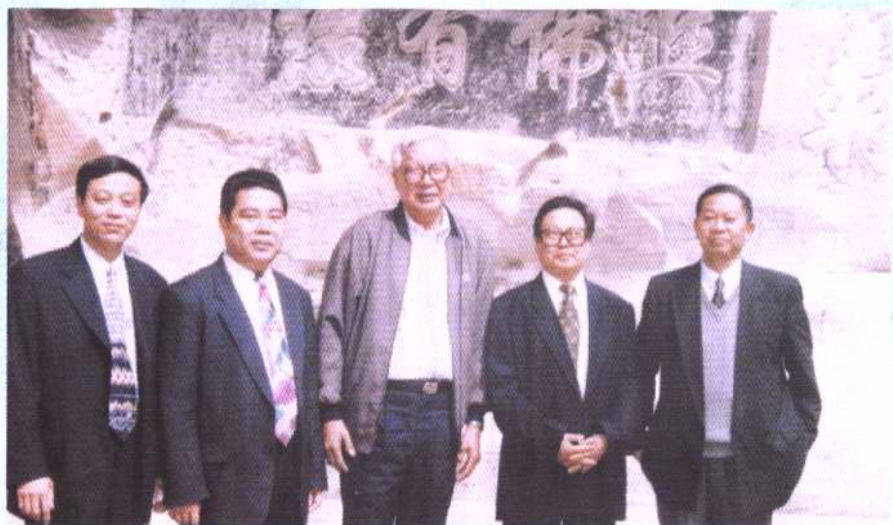
1998年12月，全国政协副主席罗豪才(中)参观大足石刻，与县领导丁先发、陈中举、刘书勇等合影。