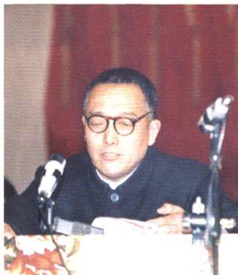
县政协主席韦治国在三届一次全委会上致词。