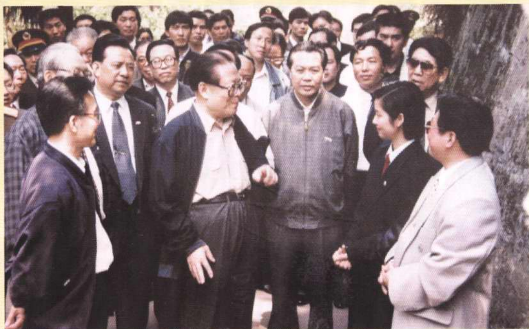
1998年4月15日，市政协主席张文彬等领导同志陪同江泽民总书记参观大足石刻。