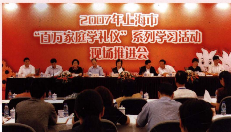
● 8月23日，百万家庭学礼仪系列活动现场推进会