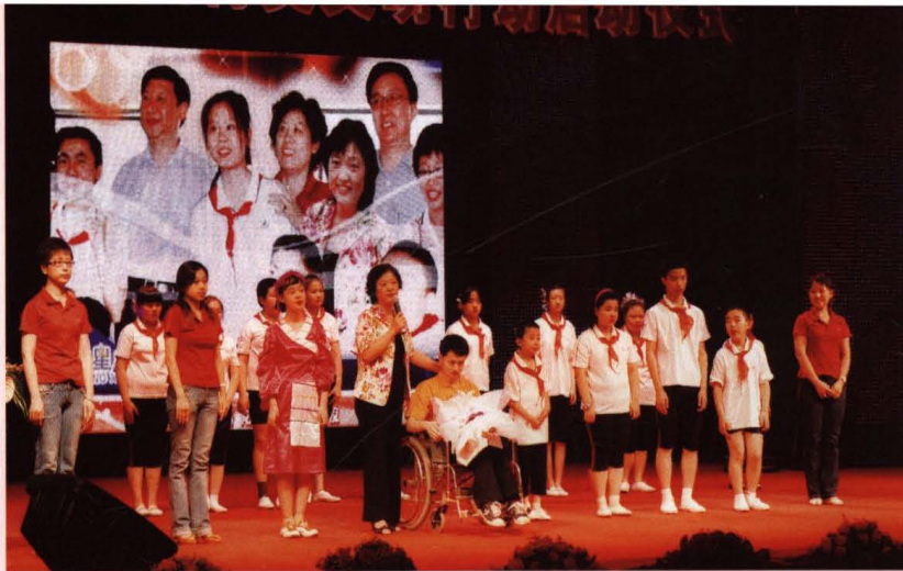
● 爱心传递——迎特奥 文明行动启动仪式