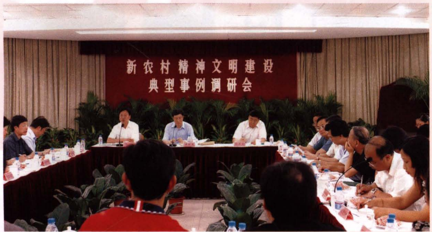
● 新农村精神文明建设典型事例调研会