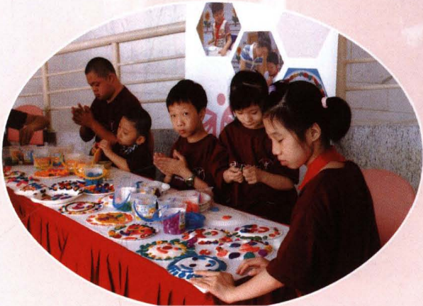
● 6月24日，特奥会倒计时100天活动