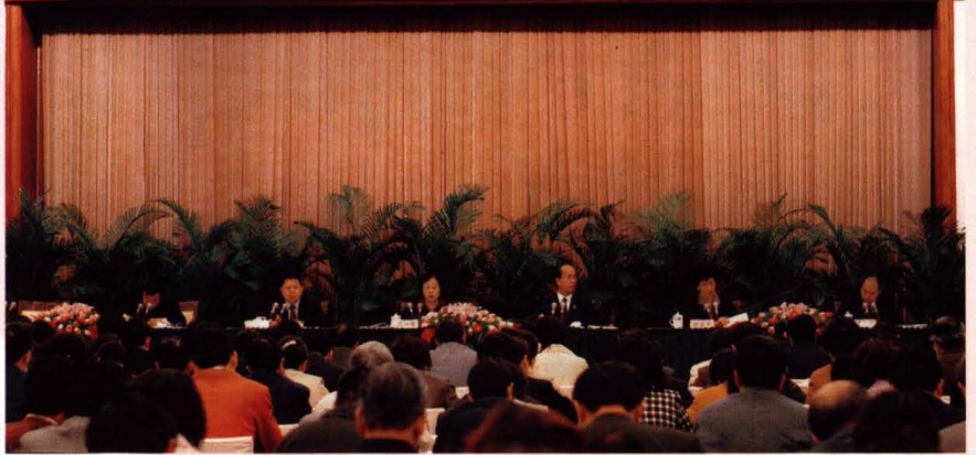
● 上海市推进学习型社会建设大会