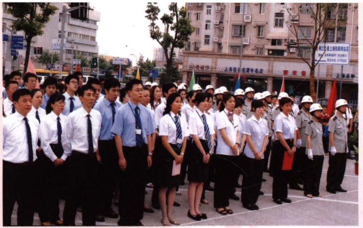
● 7月14日，爱心传递之交通行业温馨通道专项活动启动仪式