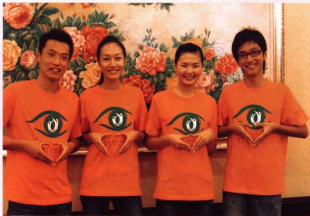
● 9月20日，“特奥阳光衫”新闻发布会