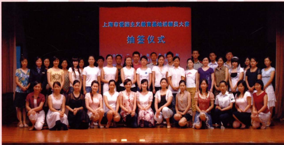
● 2007年7月 - 2008年1月，上海市爱国主义教育基地讲解员大赛，赛前举行了抽签仪式