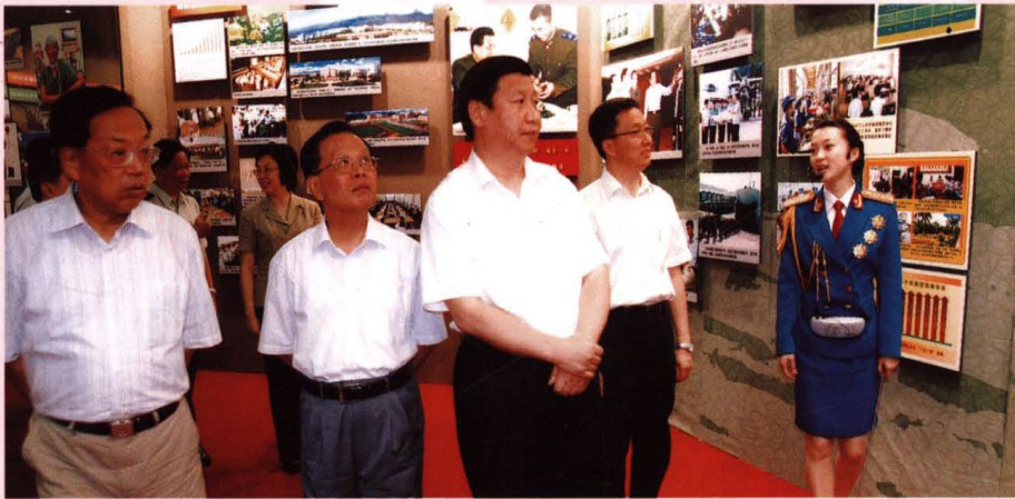
● 7月31日，时任中共上海市委书记习近平等上海市领导参观《我们的队伍向太阳》——新中国成立以来国防和军队建设成就图片展