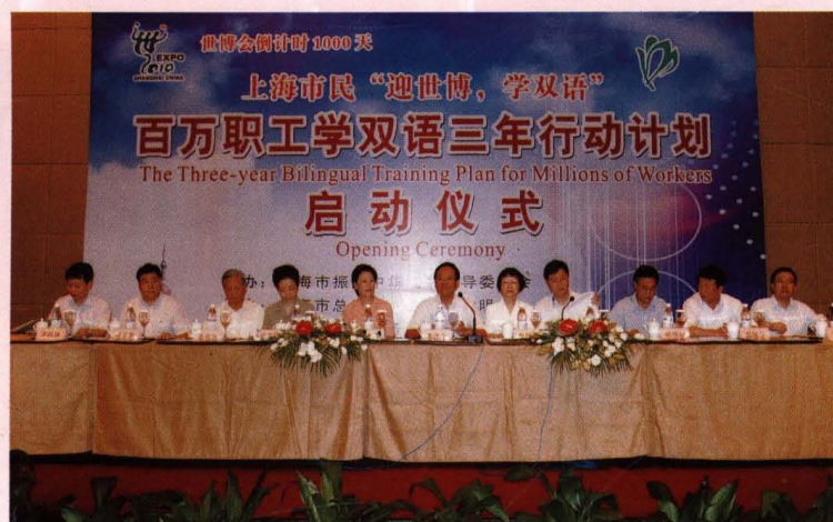
● 8月25日，迎世博，百万职工学双语