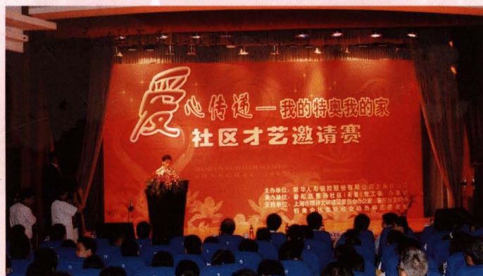
● 9月13日，“爱心传递——我的特奥我的家”社区才艺邀请赛