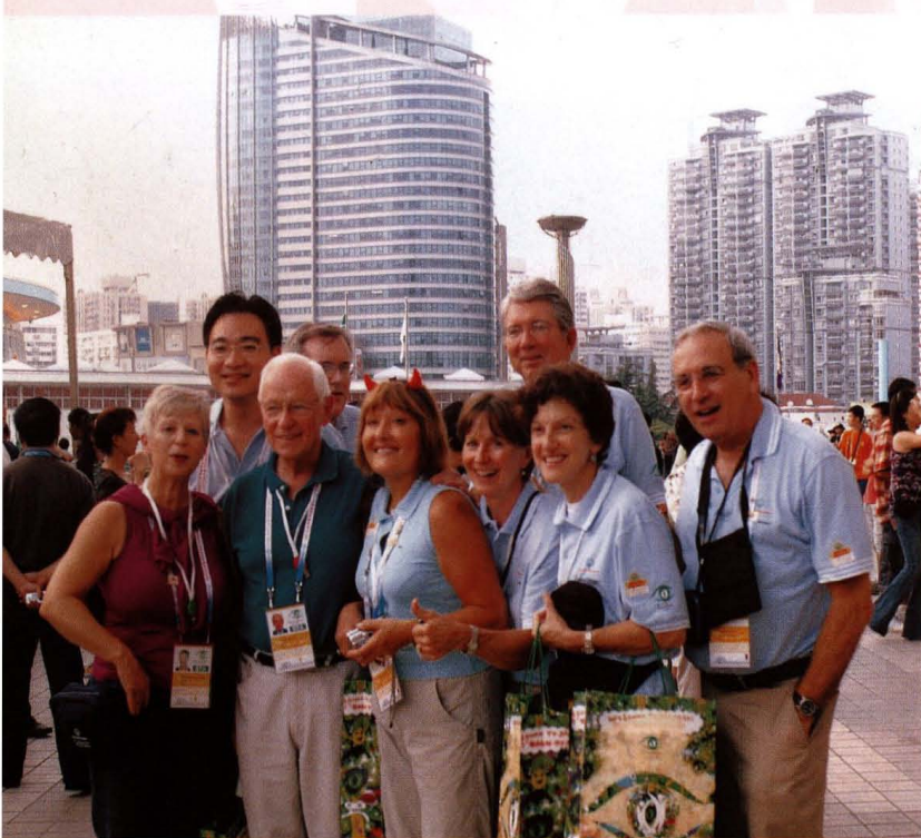
● 特奥开幕当天，不同国别的人走到了一起为特奥加油