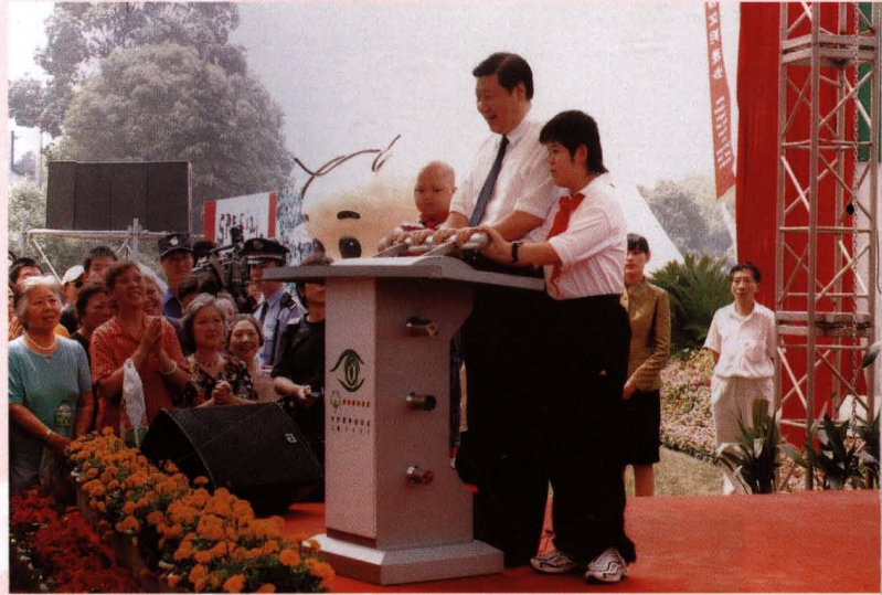
● 6月24日，特奥会倒计时100天活动