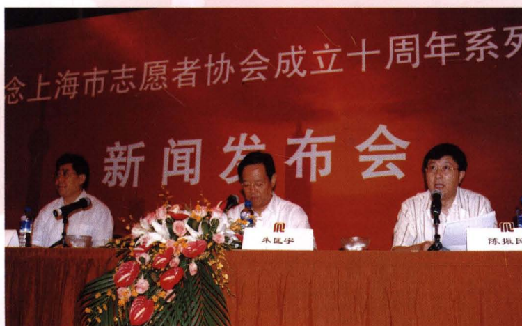
● 8月23日，纪念志愿者10周年新闻发布会