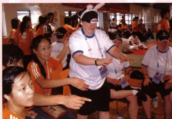
● 为2007上海世界特殊奥林匹克运动会柔道项目比赛提供志愿服务