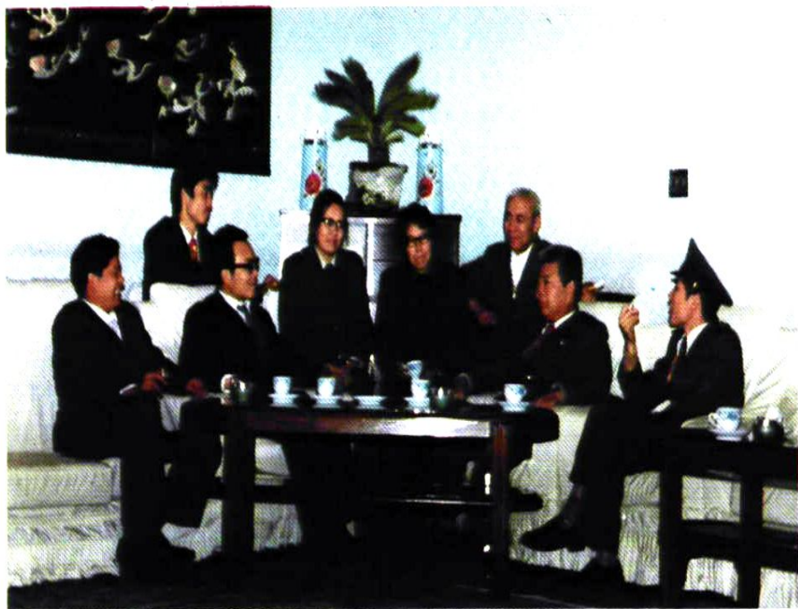
车站主要领导在讨论站志内容