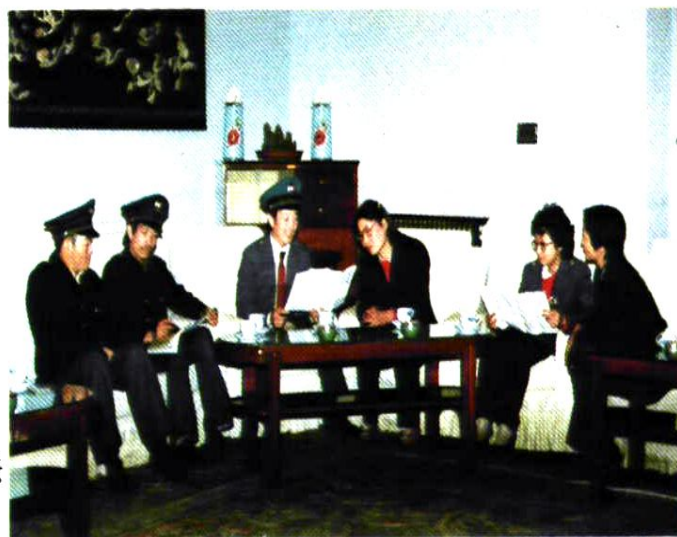
编委在研讨站志体例和编写方法