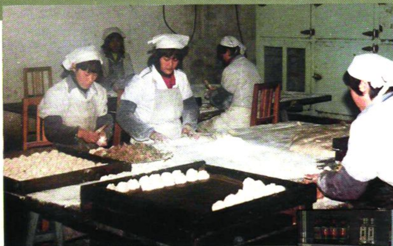
旅行服务站的面食品加工工艺