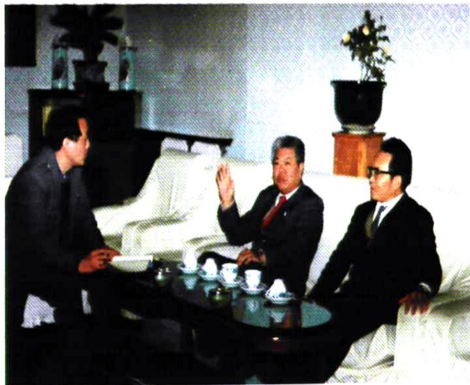
党委书记为“党群工作”的编写提供参考意见