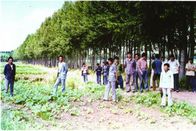
县土地管理局 组织有关人员现 场规划改造利用 废弃地。