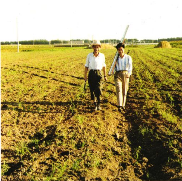
肇州县土地管理局的领导检查 验收土地详查作业质量。