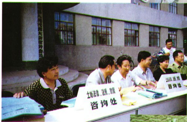
的咨询处。 『土地日』设立