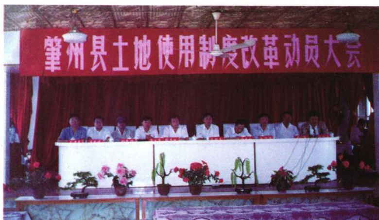
1992年8月19日， 县政府召开土地使用制 度改革动员大会。