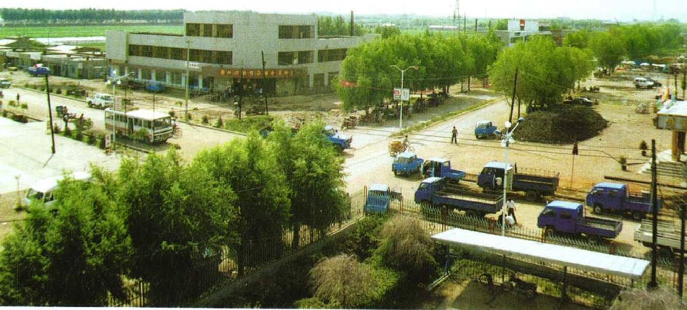
朝阳沟镇新建镇区一角