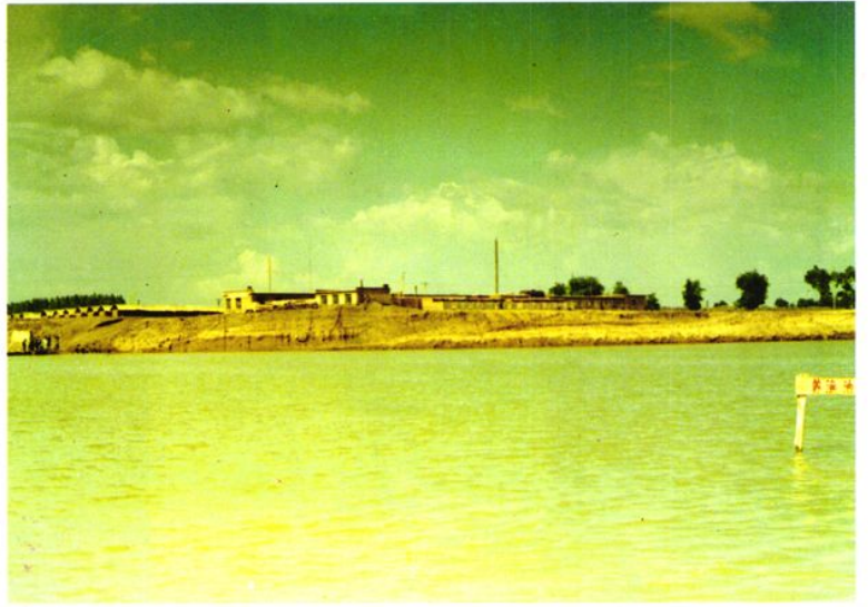
肇州镇砖厂 改造利用取土废 弃大坑养鱼。