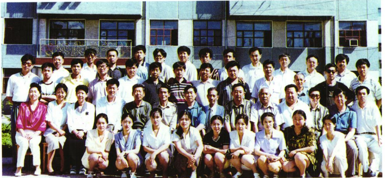
肇州县土地管理局全体人员合影(1996年)