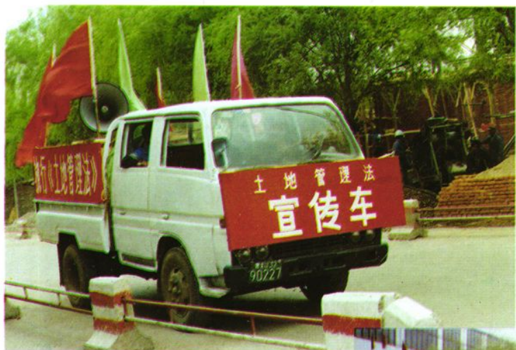
宣传活动。 《土地管理法》