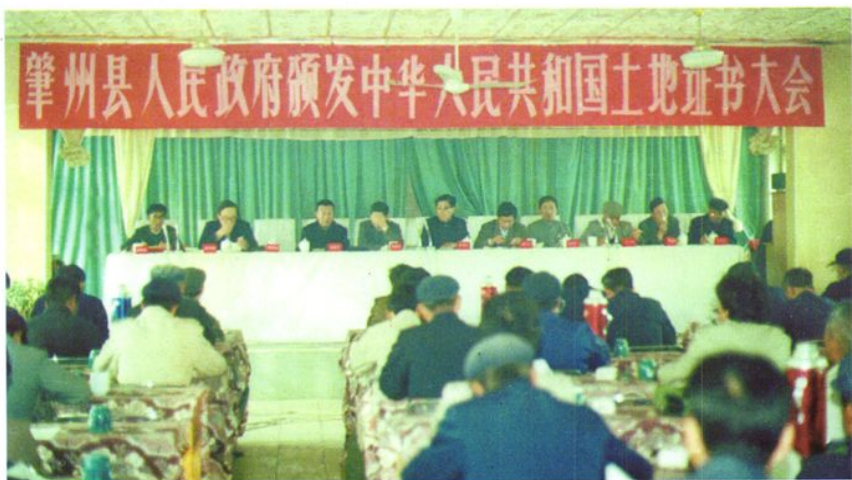
1988年10月26日，县政府召开颁发土地证书大会。