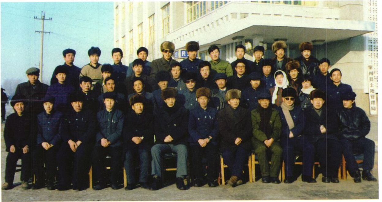
肇州县土地管理局和乡(镇)土地管理员全体合影(1990年)