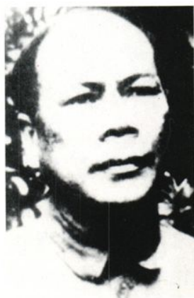
中共七届后补中央委员、中共西满分局常委秘书，1946年进驻肇州县开展土改工作团团团长古大存。