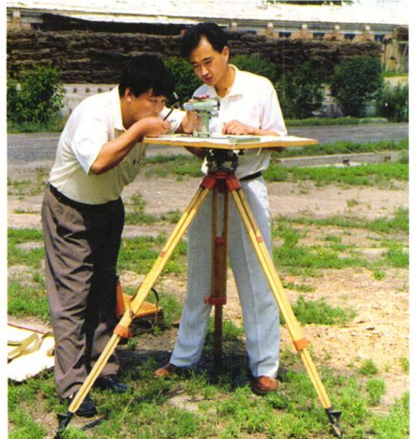
土地勘测队进行地籍测量。