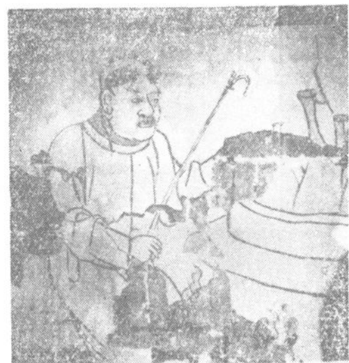
辽壁画：《契丹侍吏烹饪图》