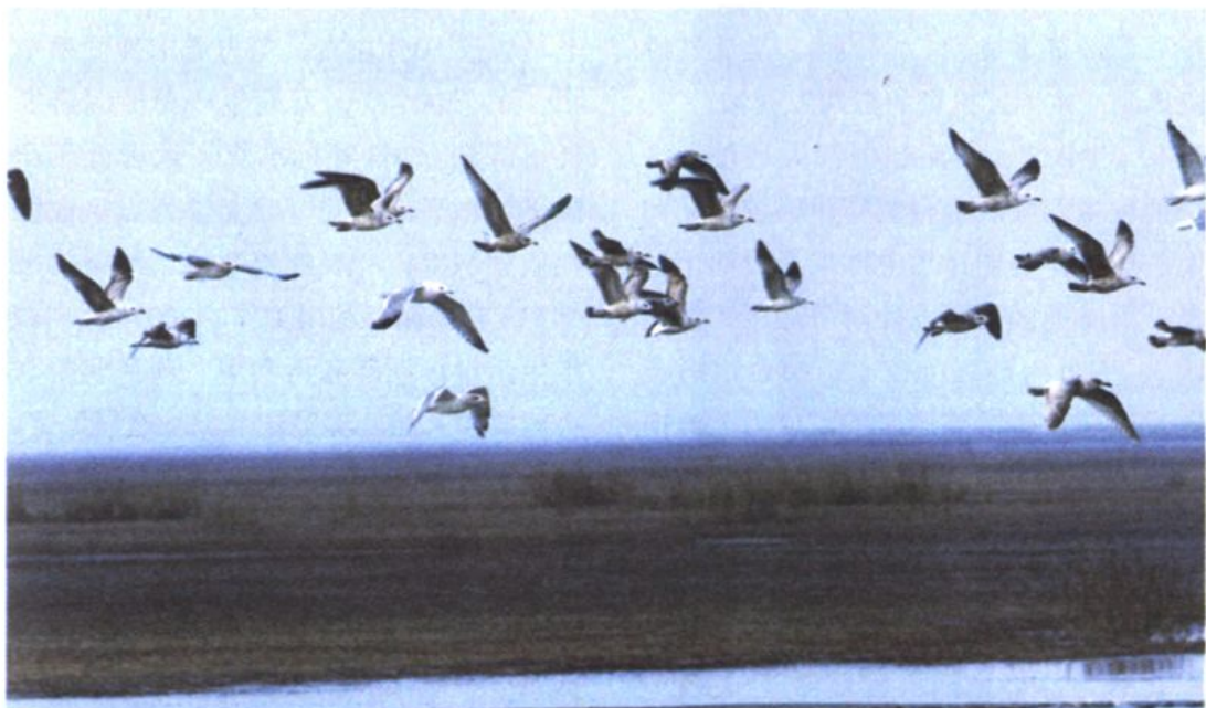
■ 九段沙湿地自然保护区

区以来, 新区基础教育校舍占地面积增长 100% 以上, 2007 年达到 569.91 万平方米; 校舍建筑面积增长 200% 以上, 达到 363.01 万平方米; 人均校舍建筑面积从 4.36 平方米增加到 13.27 平方米。学前教育基本构建了托幼一体化格局。义务教育资源配置更为合理, 学生接受教育的程度提高。高中教育超常规发展, 优质高中教育资源有所扩大。成人教育初步构筑起全覆盖的社区教育网络; 高等教育粗具规模, 上海中医药大学、上海金融学院、上海第二工业大学等整建制迁入浦东, 中欧工商学院、杉达大学等在浦东成立; 北大浦东微电子研究院、清华上海微电子研发中心、复旦大学软件学院等进驻张江高科技园区。2003 年, 新区调整了郊区基础教育管理体制, 实现了“二元并轨”, 原镇管的 86 所中小