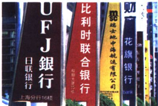
■ 外资银行集聚浦东

显著提升。金融发展环境进一步优化，陆家嘴金融城建设加快。至2007年，有各类金融机构459家，跨国公司总部或地区总部50余家。其二，随着“港区联动”功能拓展、国际贸易与现代物流联动发展，外高桥保税物流园区逐步成为跨国企业在亚太地区的重要采购配送基地，现代物流业迅速发展。2007年，在航线分流的情况下，实现集装箱吞吐量1556.8万标箱，占全市60%。其三，