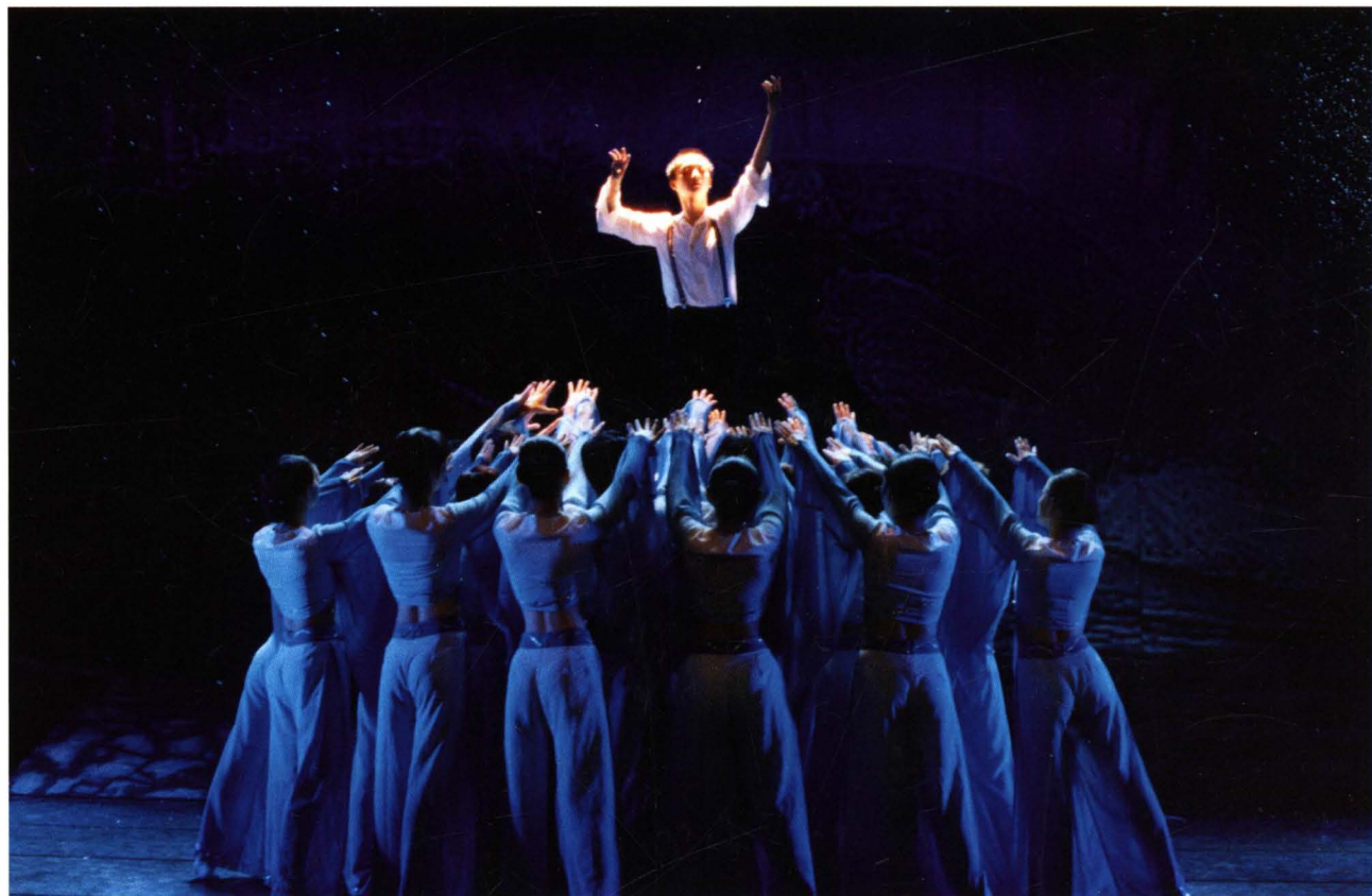
大型舞剧《聂耳》剧照，该剧于2004年获云南省新剧（节）目展演金奖