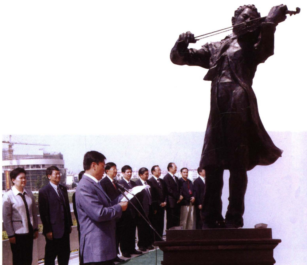
2009 年 5 月 22 日，省市领导出席聂耳音乐广场“聂耳铜像”落成仪式