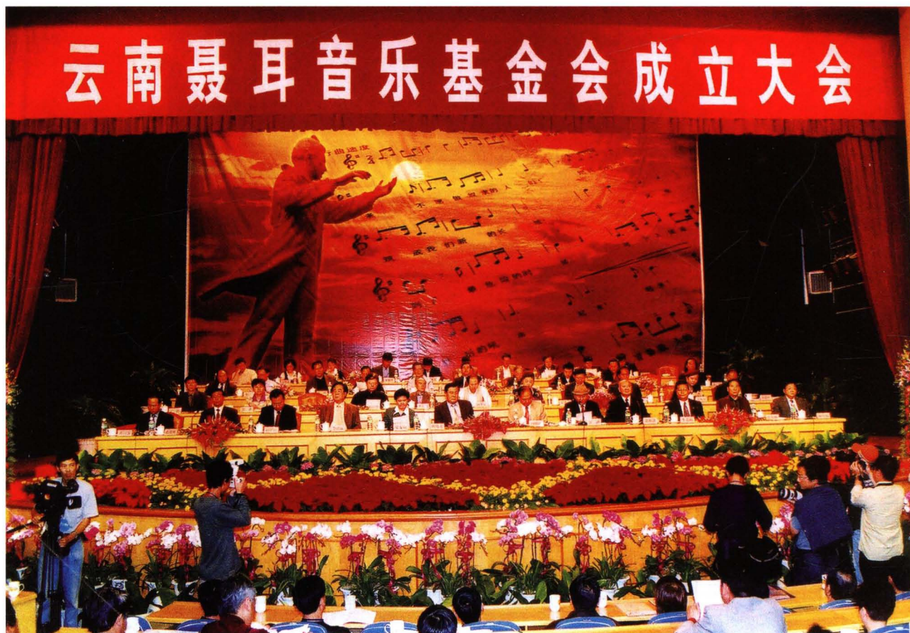
2004 年 5 月 25 日，云南聂耳音乐基金会在玉溪成立