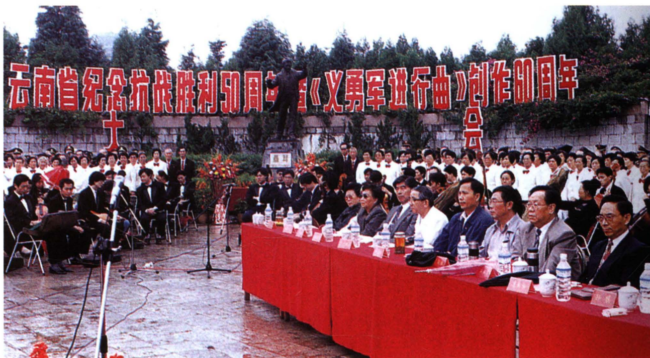
1995年，省、地党政领导和社会各界人士在聂耳公园参加聂耳纪念活动