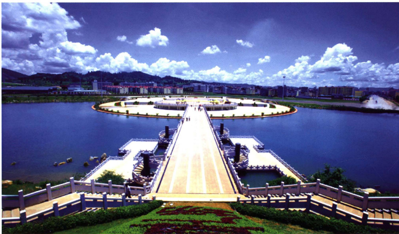
2006年7月，聂耳音乐广场建成