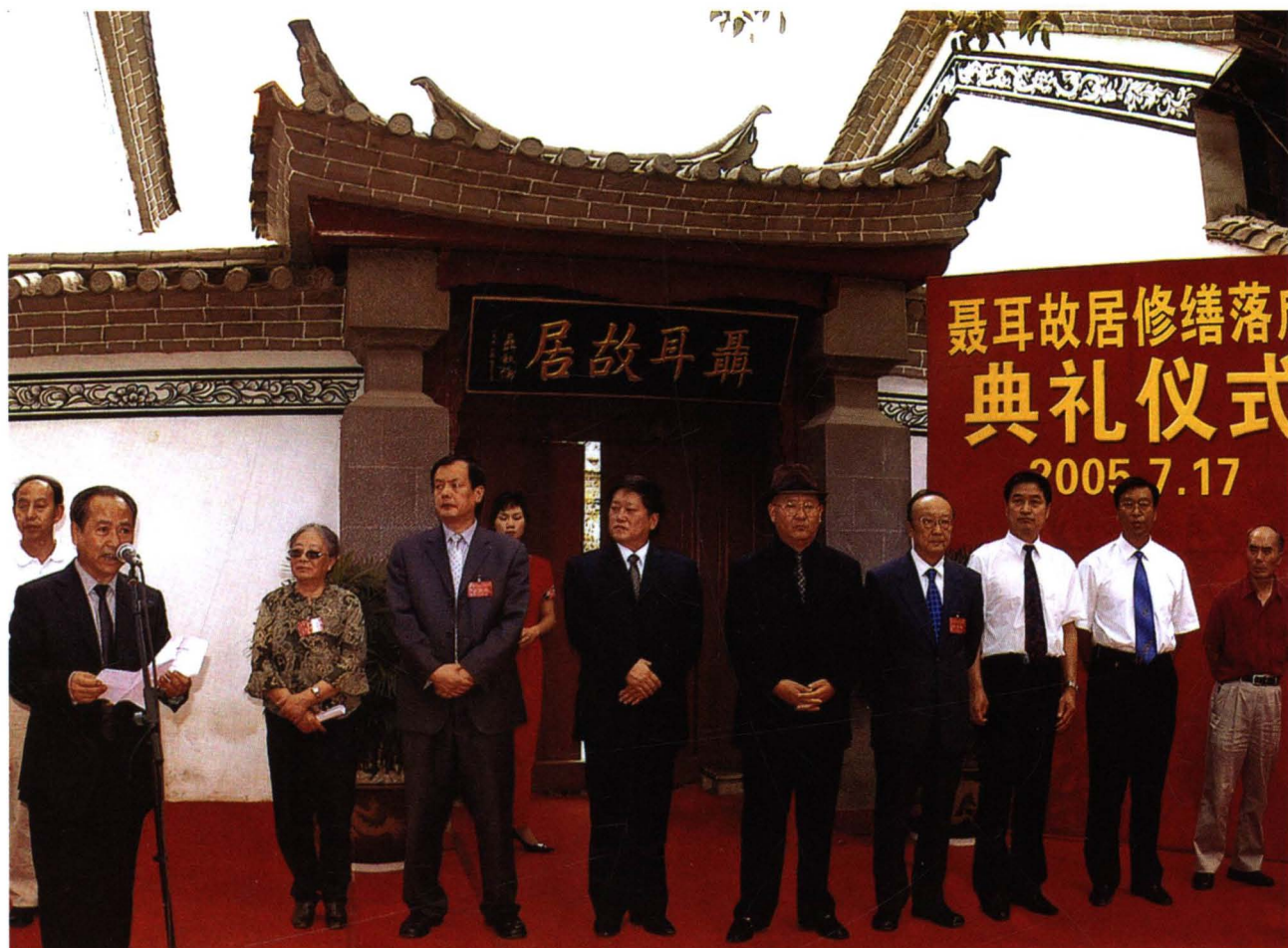
2005年7月，聂耳故居修缮工程落成