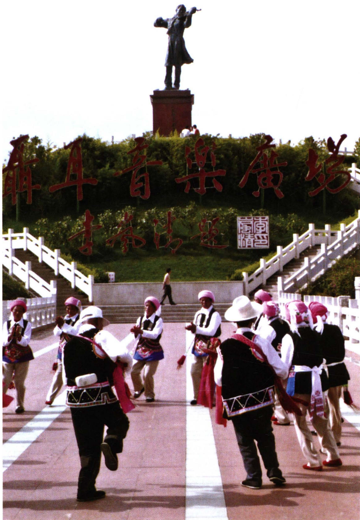
2005年9月，原中共中央政治局常委、国务院副总理李岚清为聂耳音乐广场题字