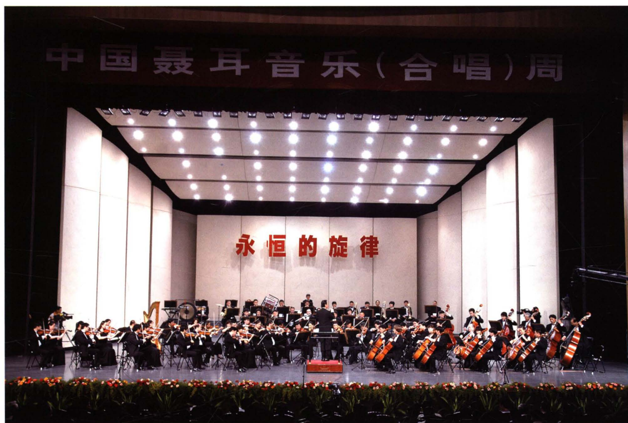
北京交响乐团在玉溪聂耳大剧院举办专场音乐会《永恒的旋律》。著名指挥家谭利华担任乐团指挥