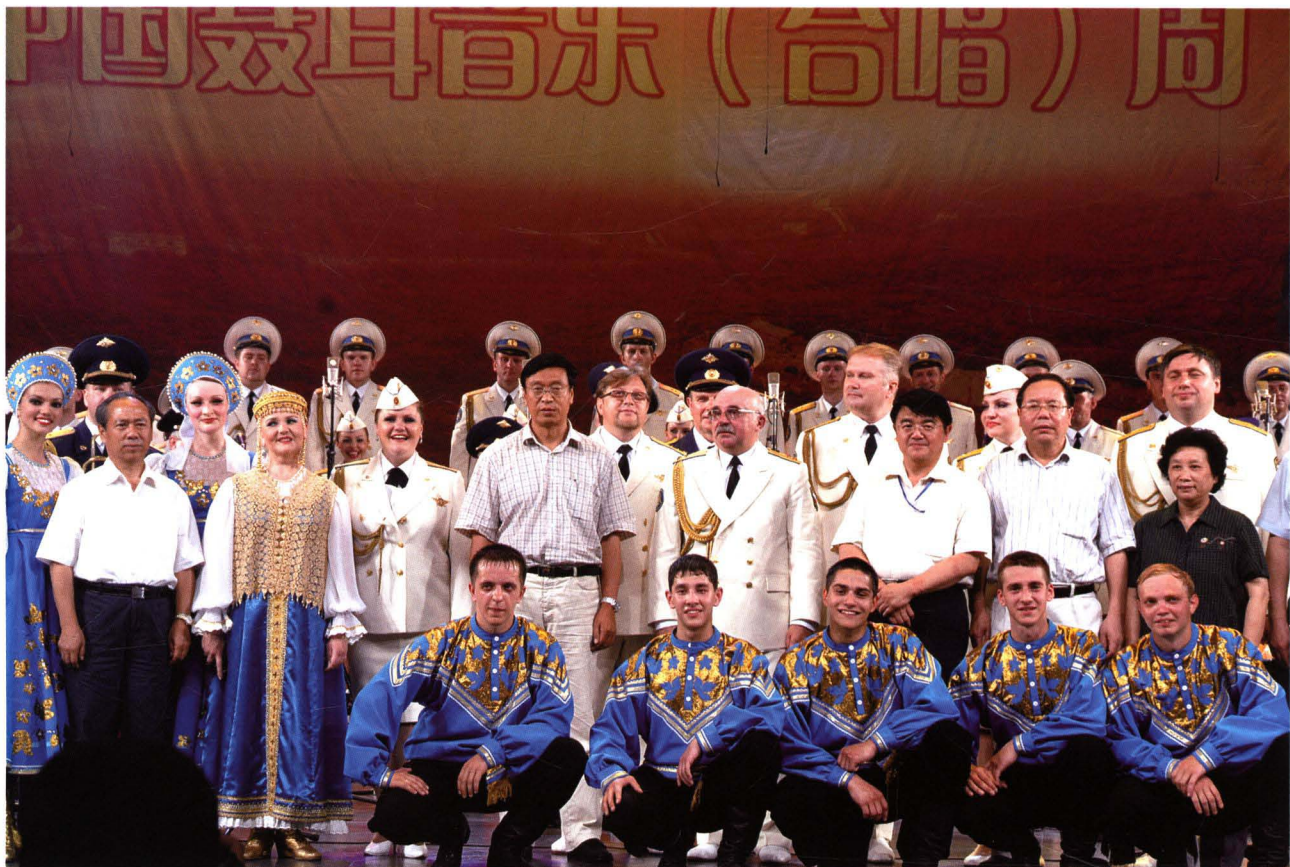
云南省委宣传部和玉溪市党政领导与演员合影