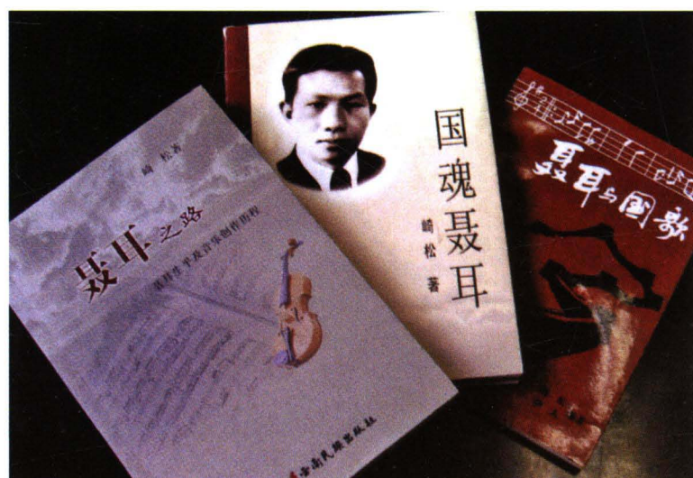
出版的部分聂耳研究书籍