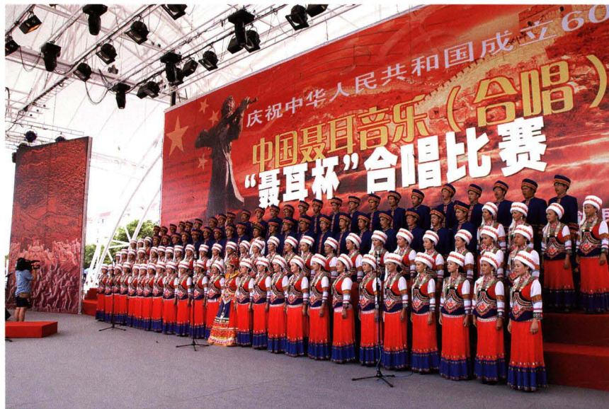
部分参赛队合唱比赛