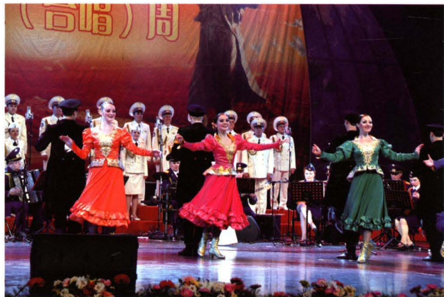
富有激情的俄罗斯模范红军歌舞团参加音乐(合唱)周演出