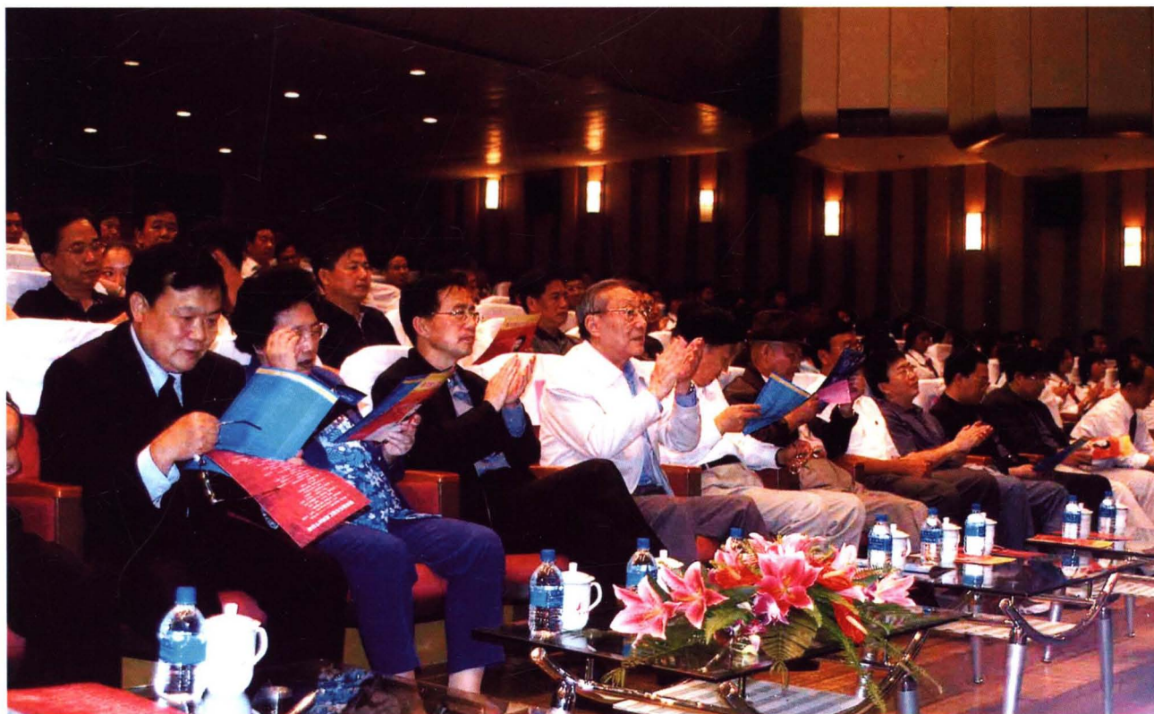
2005年9月，原中共中央政治局常委、国务院副总理李岚清和云南省、玉溪市有关领导在玉观看聂耳音乐研究汇报演出