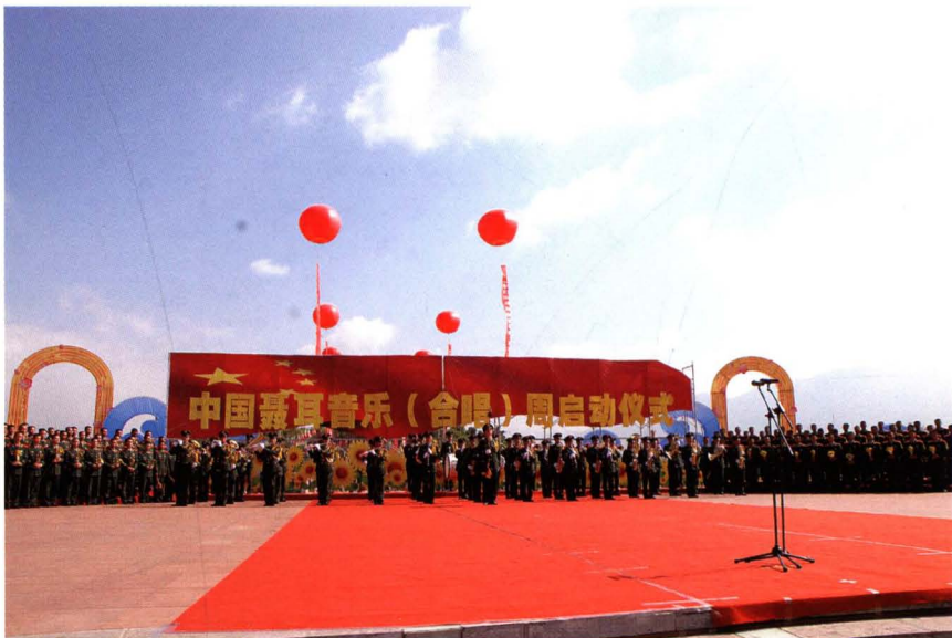
图为 6 月 12 日在聂耳音乐广场举行的启动仪式，拉开了音乐(合唱)周的序幕

中华人民共和国成立 60 周年之际，中国聂耳音乐（合唱）周于 2009 年 6 月 12 日至 18 日在人民音乐家聂耳的故乡——云南玉溪隆重举行。本届音乐（合唱）周由中共云南省委、省人民政府、中国文联、中国音乐家协会共同主办，中共云南省委宣传部、中共玉溪市委、市人民政府、云南聂耳音乐基金会承办。开幕式文艺晚会《前进颂》于 6 月 12 日在北京人民大会堂举行。玉溪市举办了丰富、精彩的系列活动。