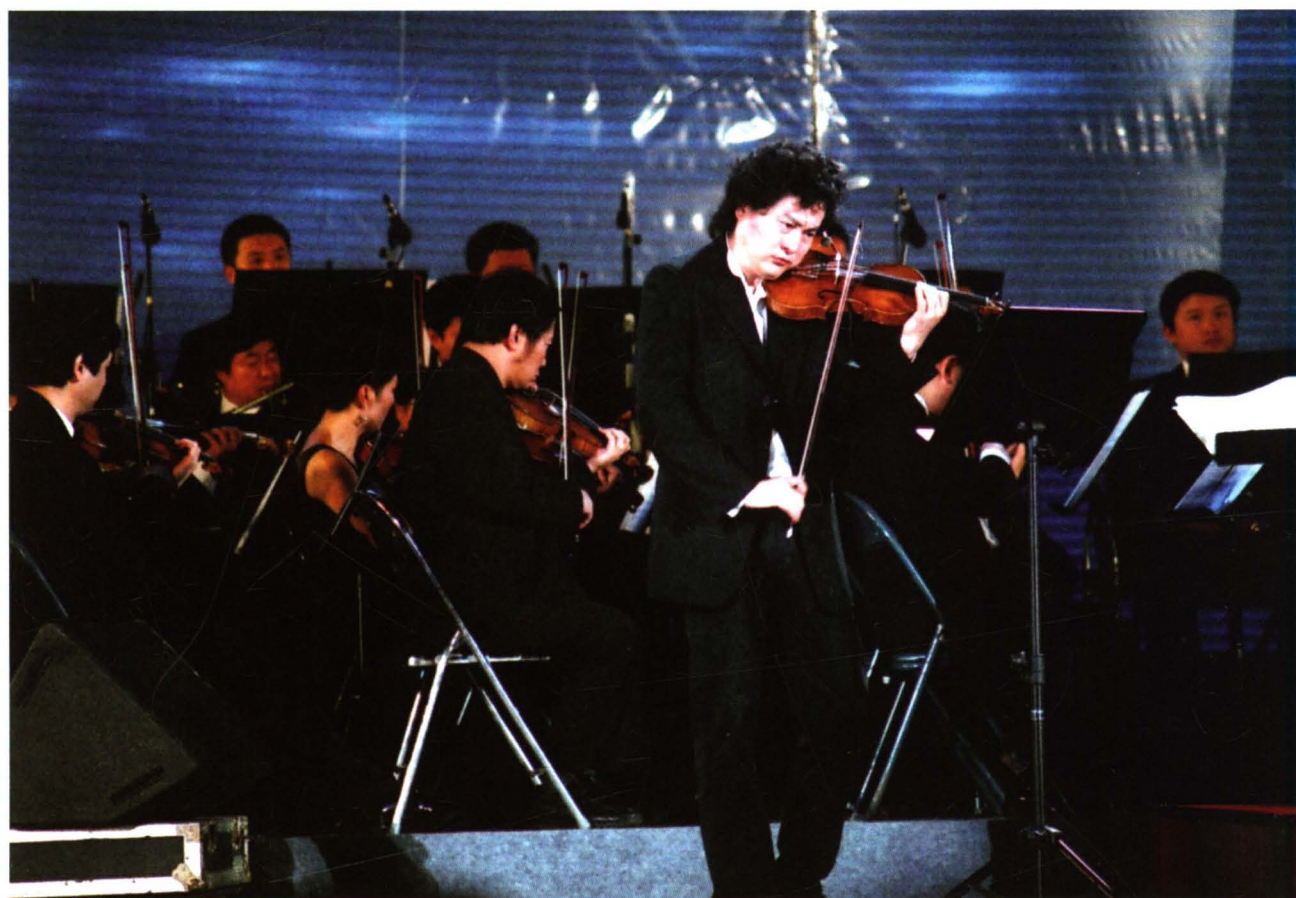
著名小提琴演奏家吕思清在演奏