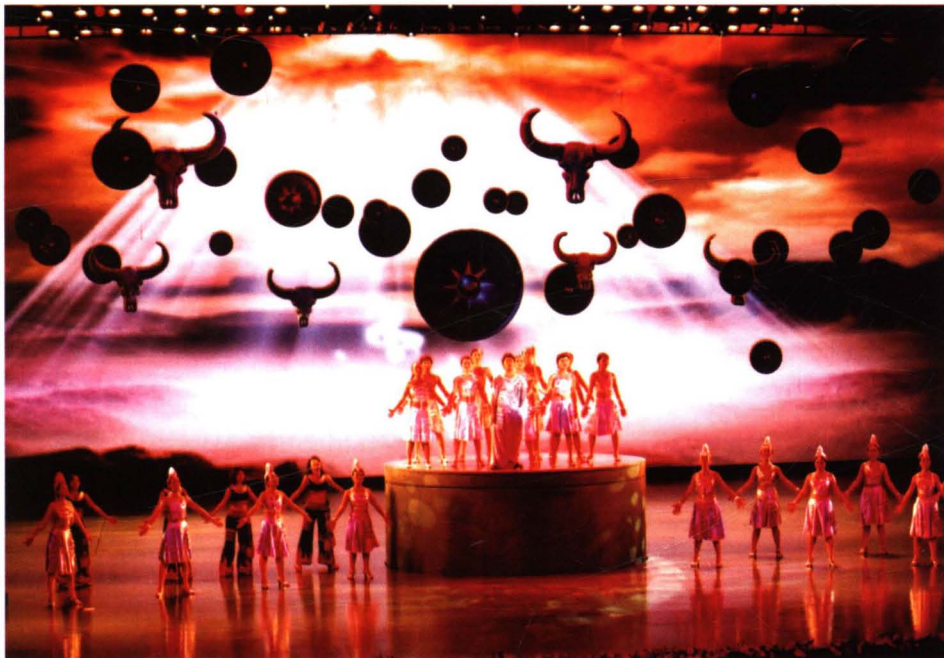
丰富的音乐舞蹈 节目为音乐(合唱)周 增光添彩