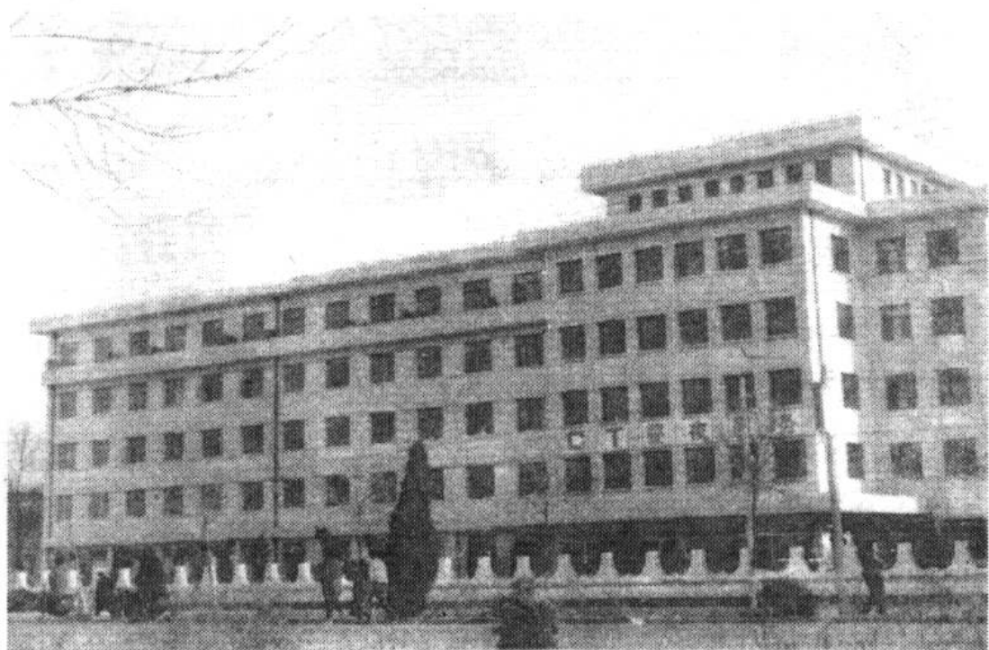
咸水沽医院住院部大楼外景