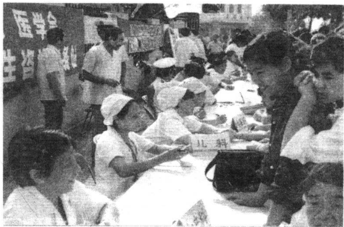
医务人员上街为群众进行义务咨询