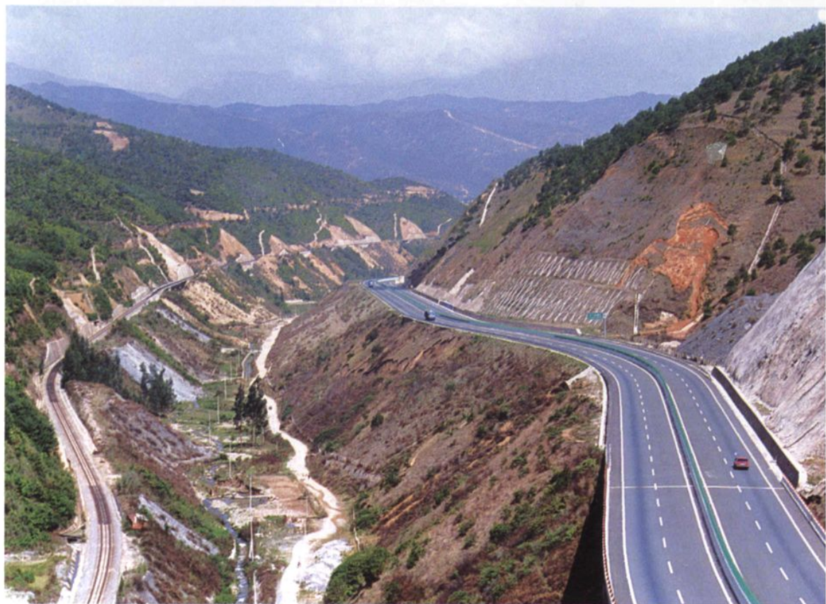
楚大公路、广大铁路（局部）