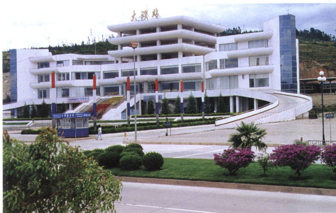
建成投入运营的大理火车客运站