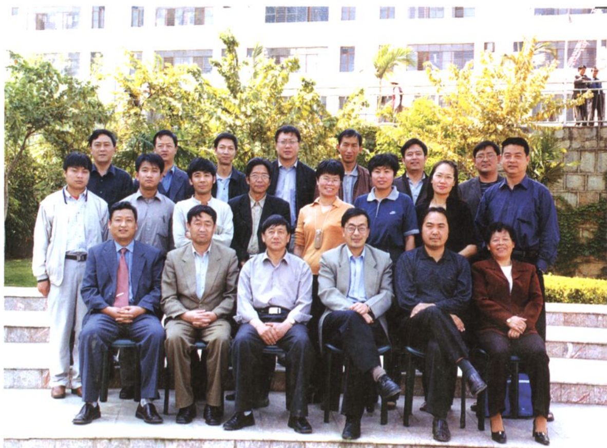
机构改革后的国土资源局全体人员