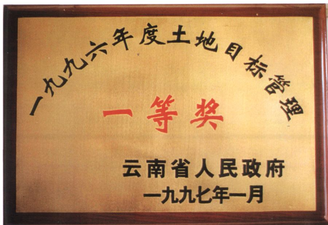
1995年至2001年间,在实行省政府对州政府的土地管理目标责任制中,大理州连续7年获得一等奖。