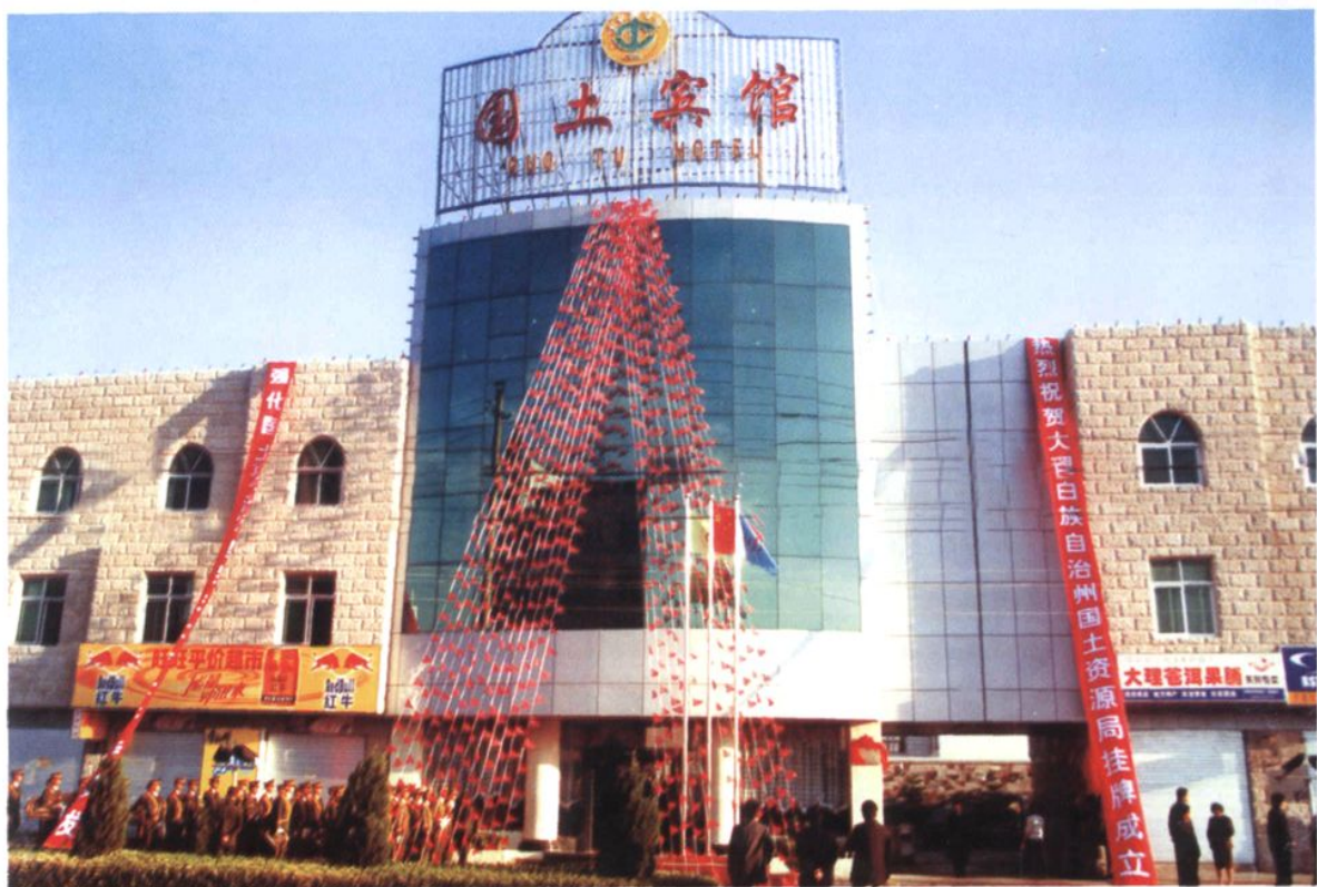
2002年2月,大理白族自治州国土资源局受印仪式