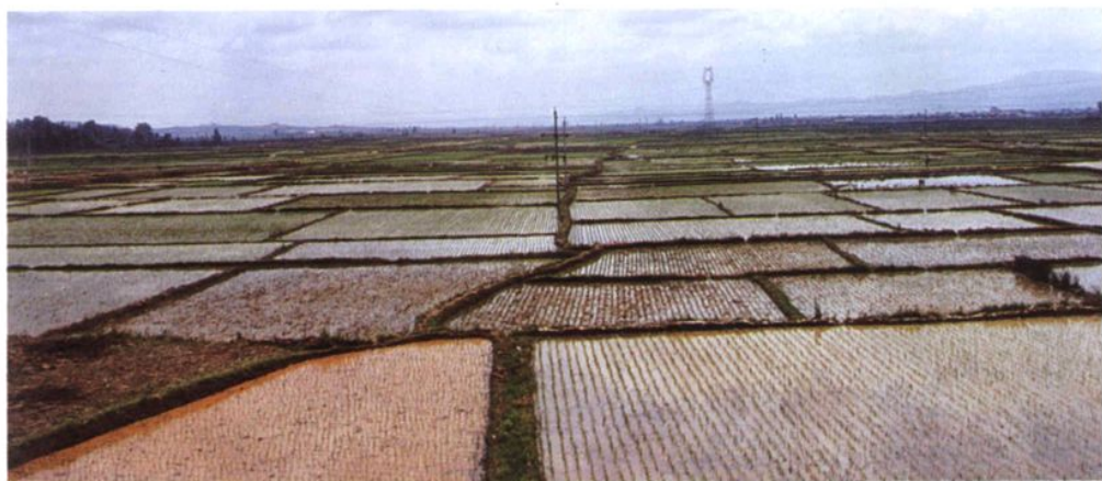
宾川县基本农田保护区