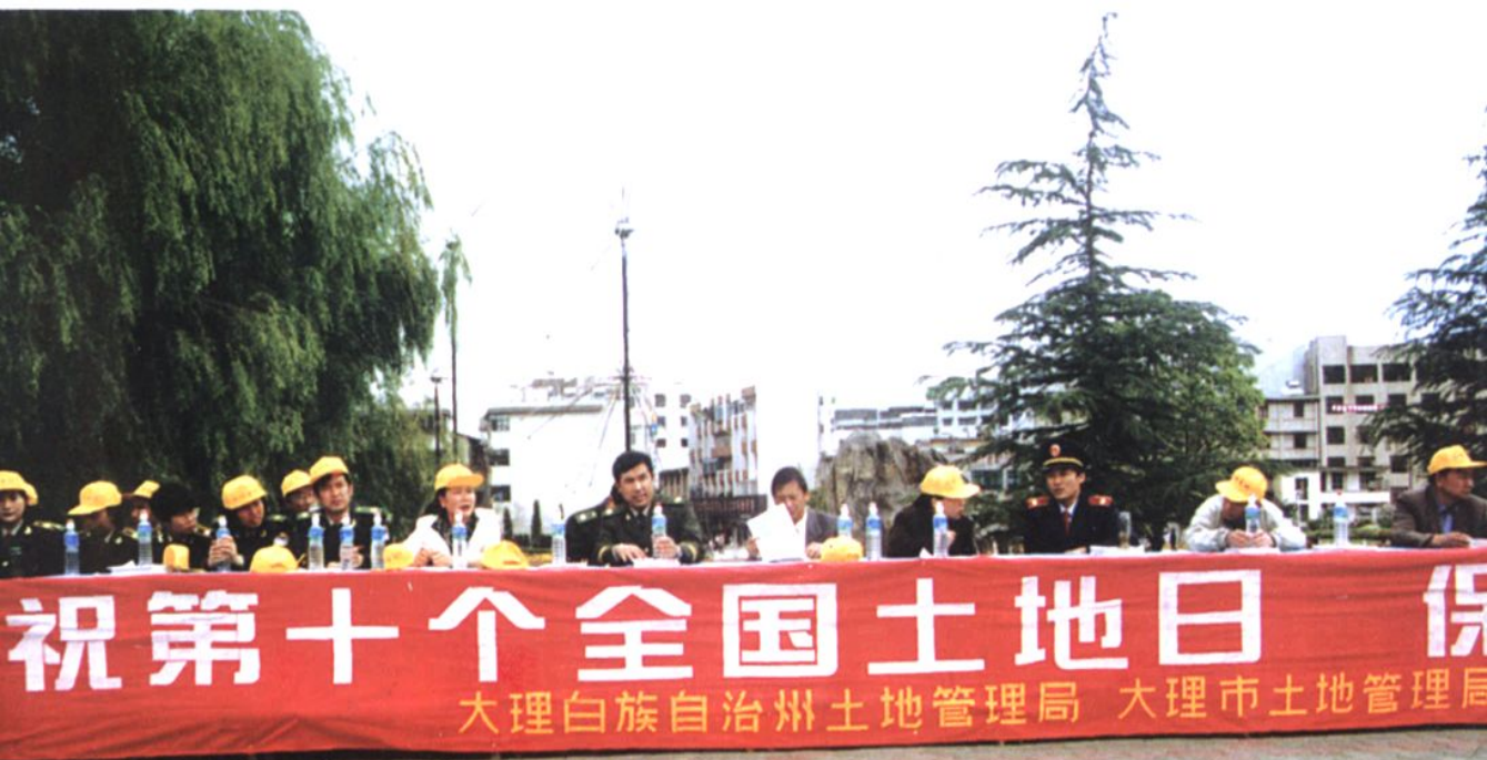
▽ “六·二五”土地宣传月活动(二)