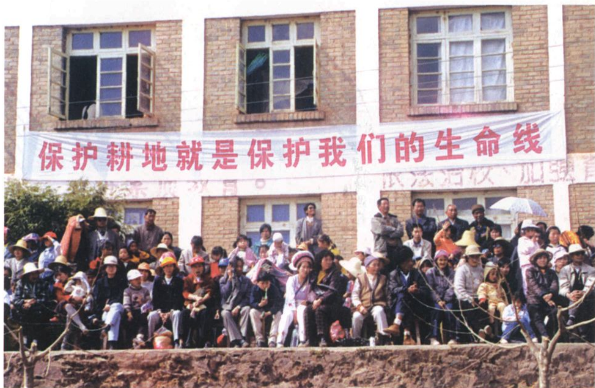
“六·二五”土地宣传月活动(一)