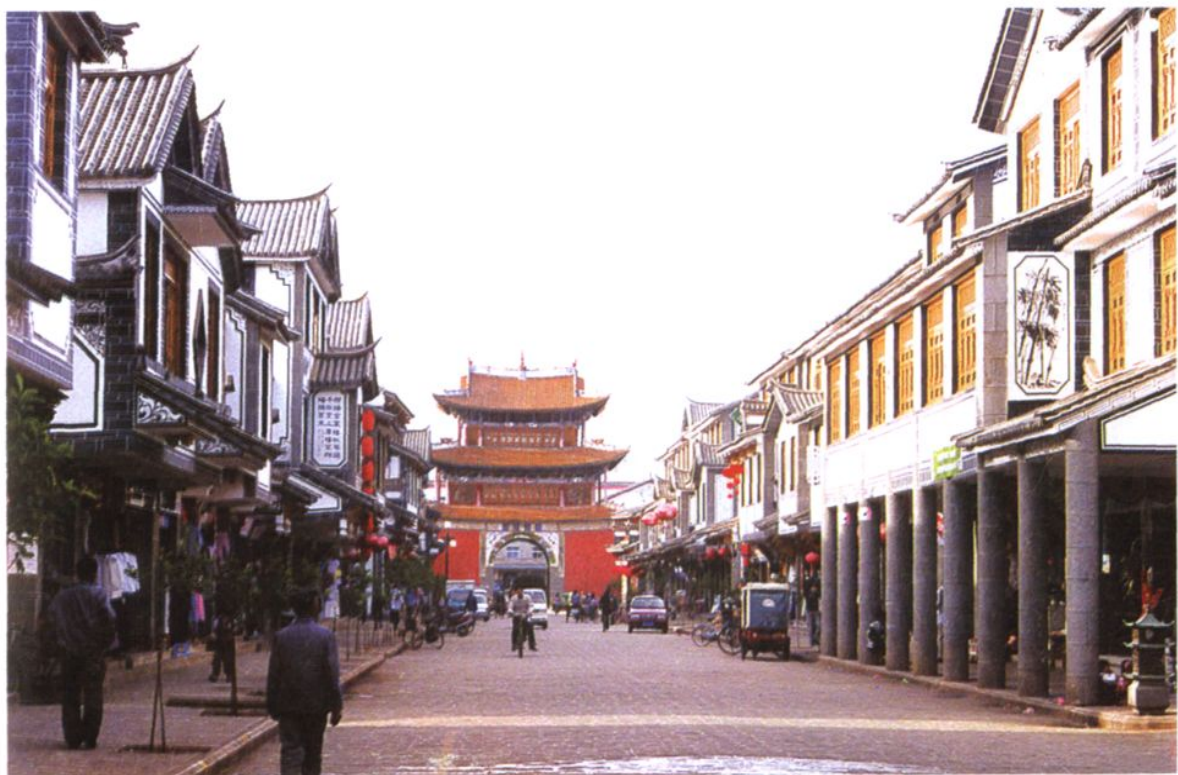
鹤庆县城民族街(局部)