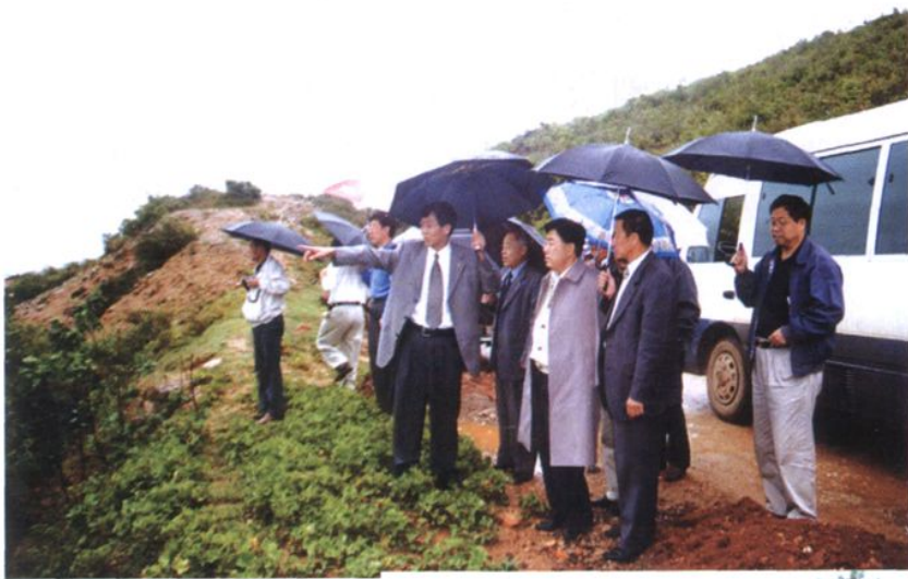
国土资源部部长田凤山到大理视察工作