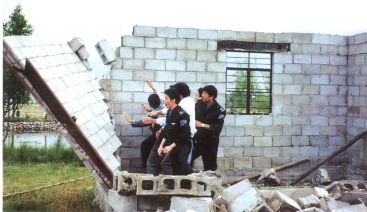
州、县土地执法队在金墩乡化龙村委会强制拆除违法建筑物