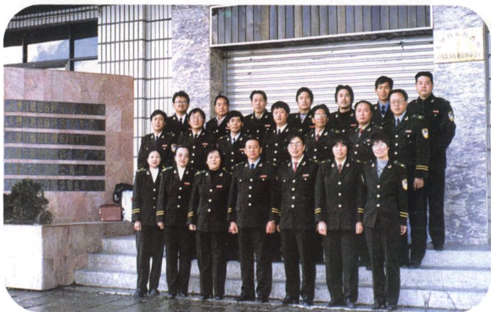
大理白族自治州土地管理局全体职工