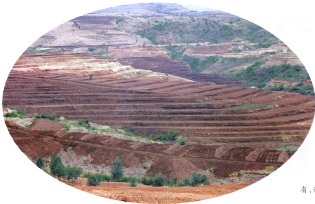
省、州领导视察弥渡寅街乡土地开发整理项目