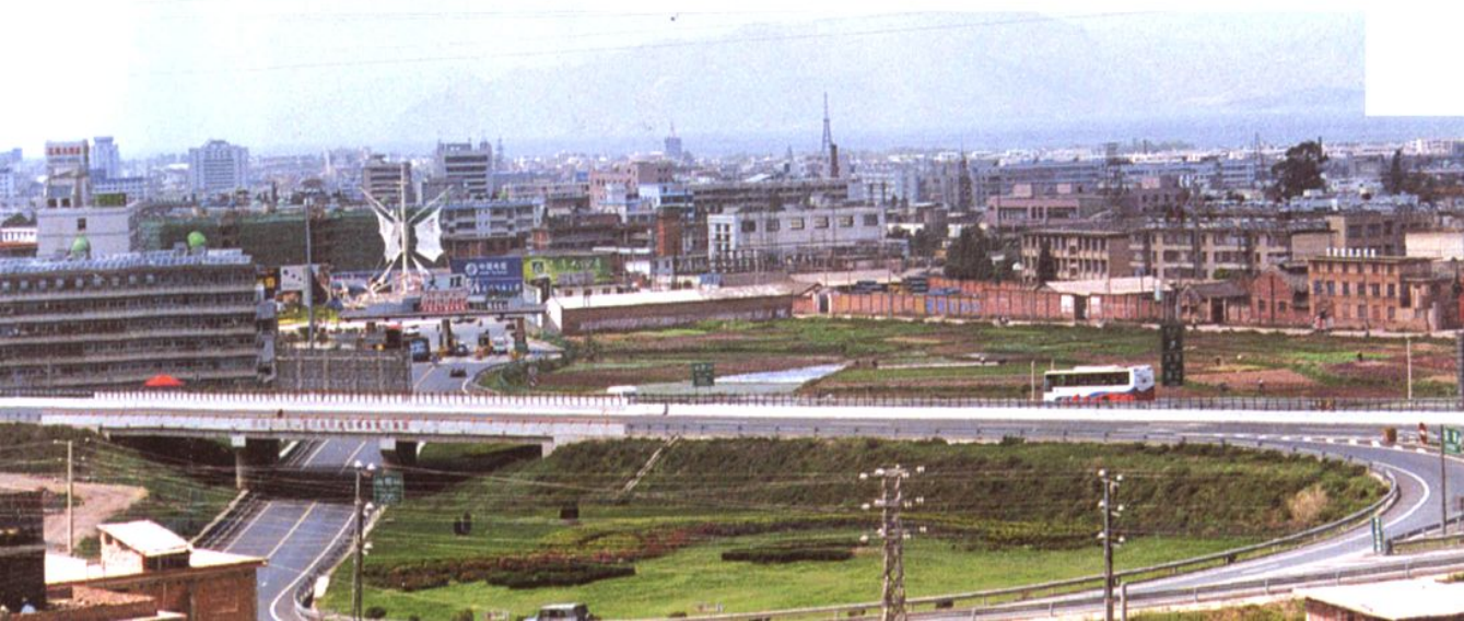
大理市下关南城区（局部）