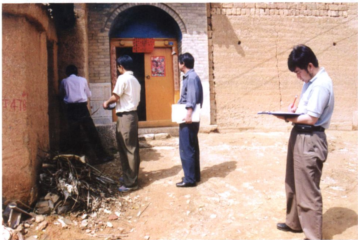
大理州土地管理局、祥云县土地管理局技术员在祥云云南驿进行城镇地籍调查