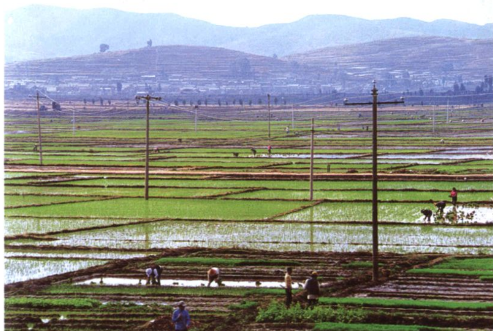
洱源邓川农地利用状况