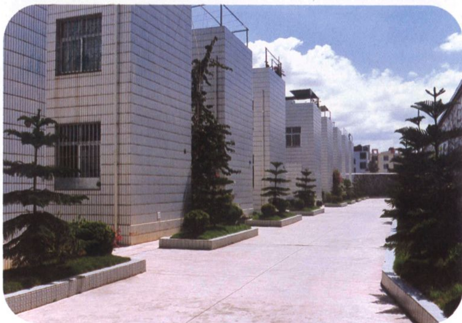
大理下关居民住宅用地新貌