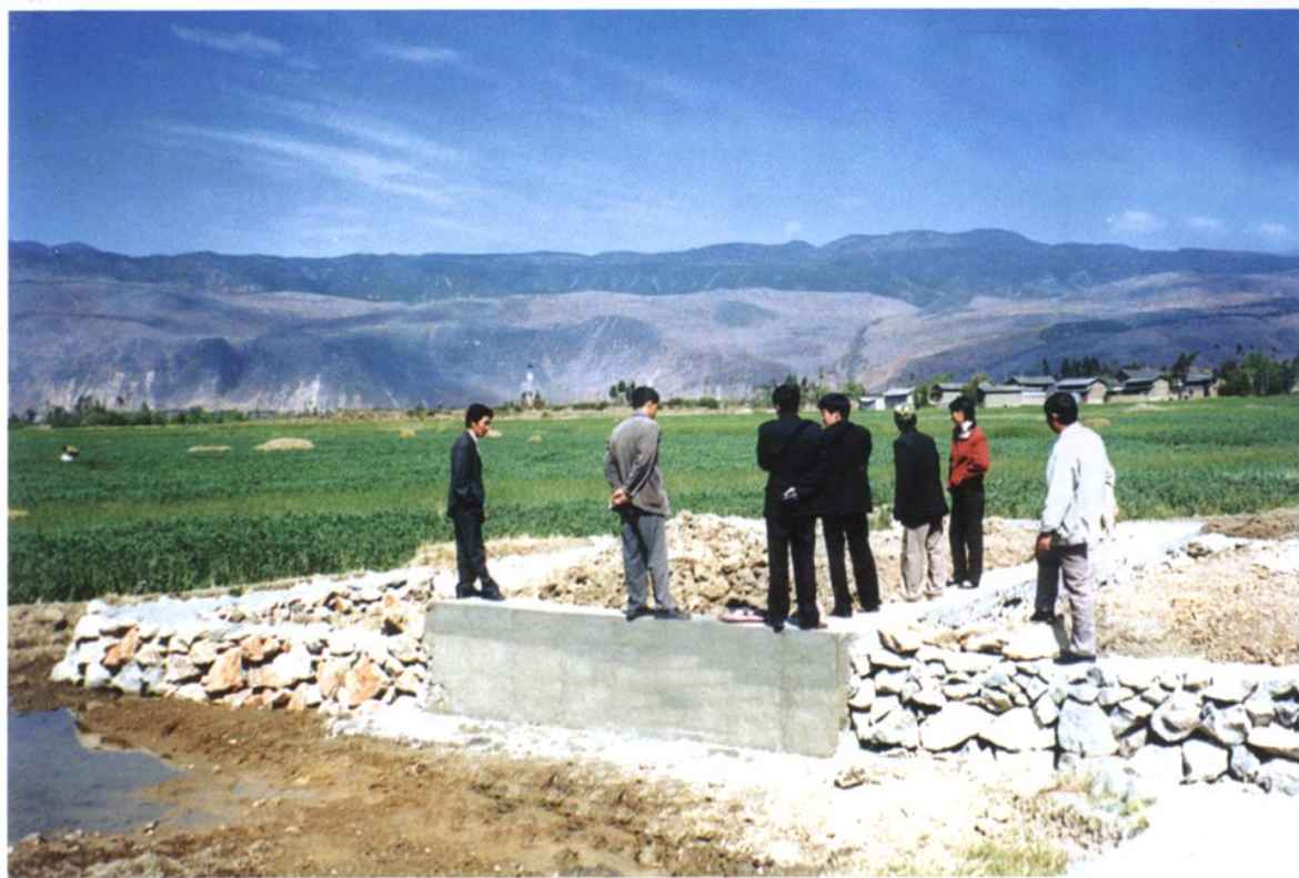
州、县土地执法队在辛屯镇莲义基本农田保护区制止违法占地行为