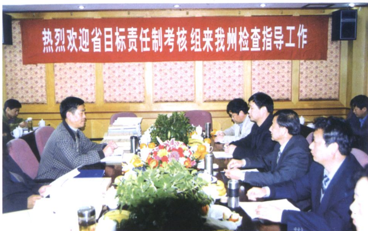
省政府土地管理目标责任制考核验收组来大理考核验收