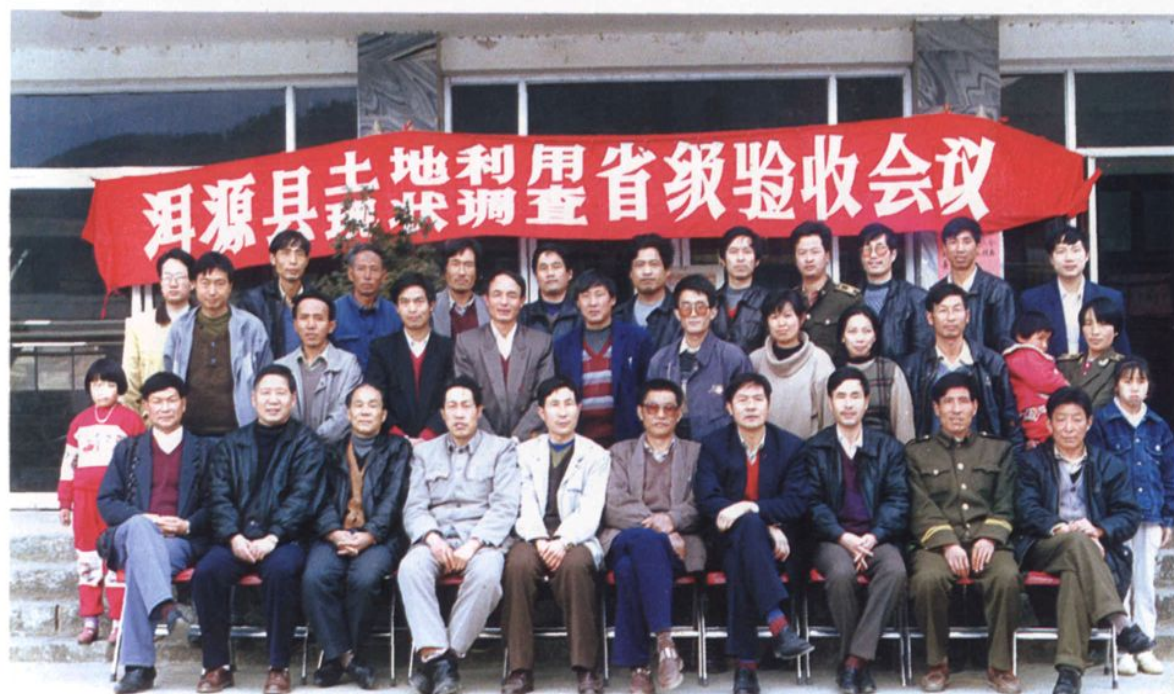
土地利用现状调查省级验收会议