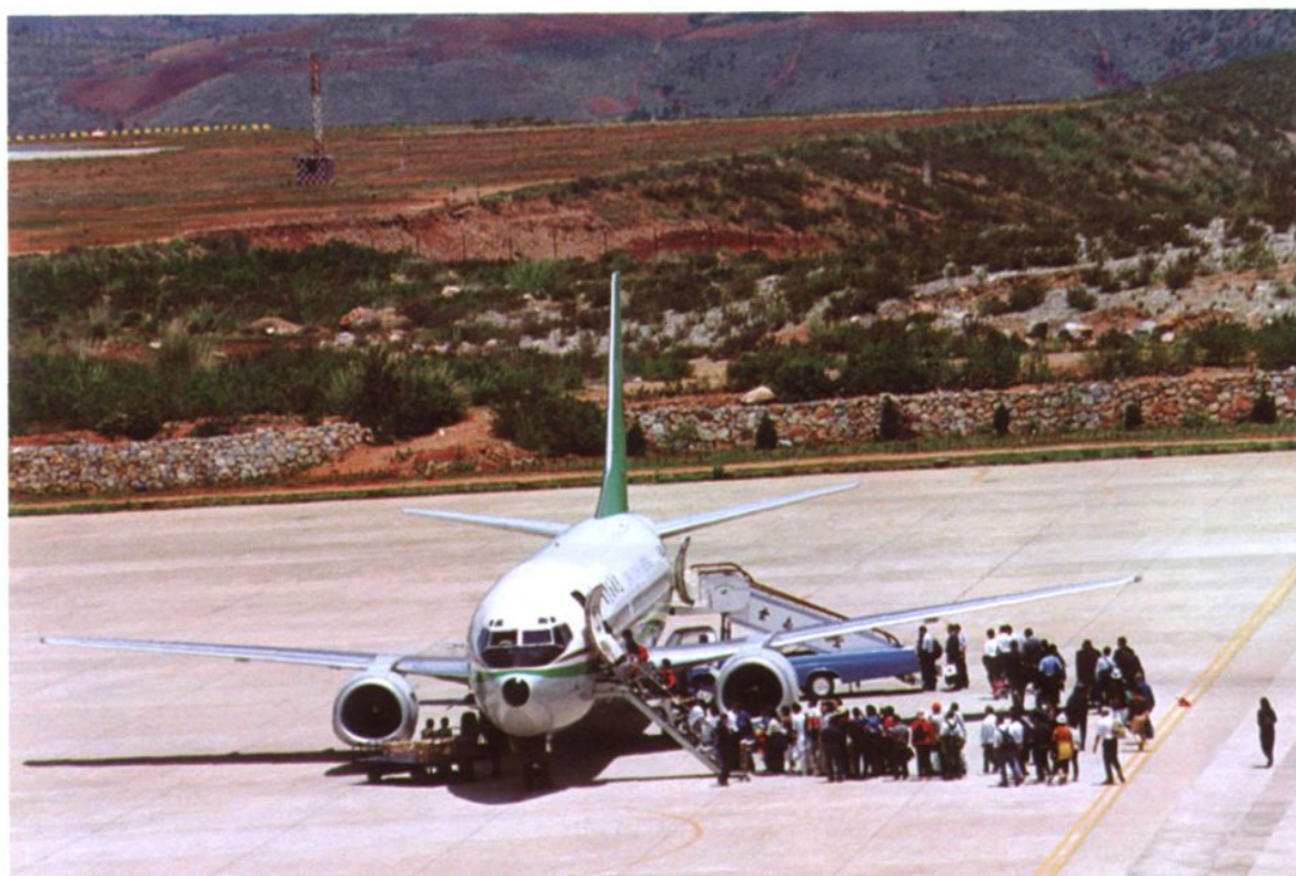
被列为全国土地开发利用典范百例之一的大理机场