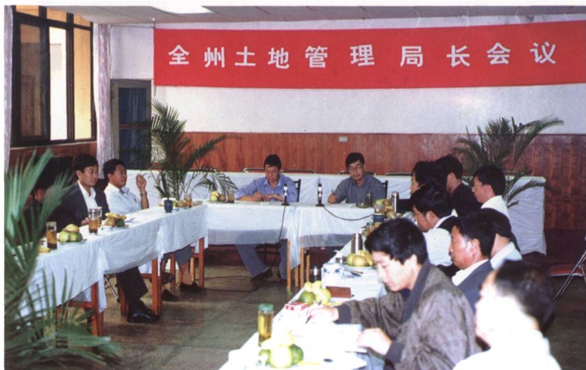
全州土地局长工作会议