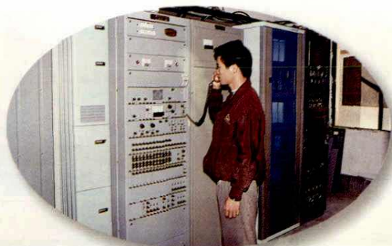
寨圩邮电支局程控机房