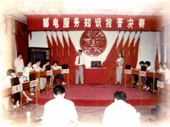
邮电服务知识抢答赛