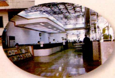
浦北县邮电营业厅