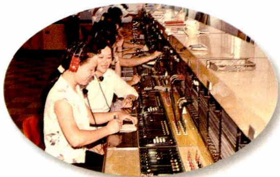
浦北县磁石交换机房