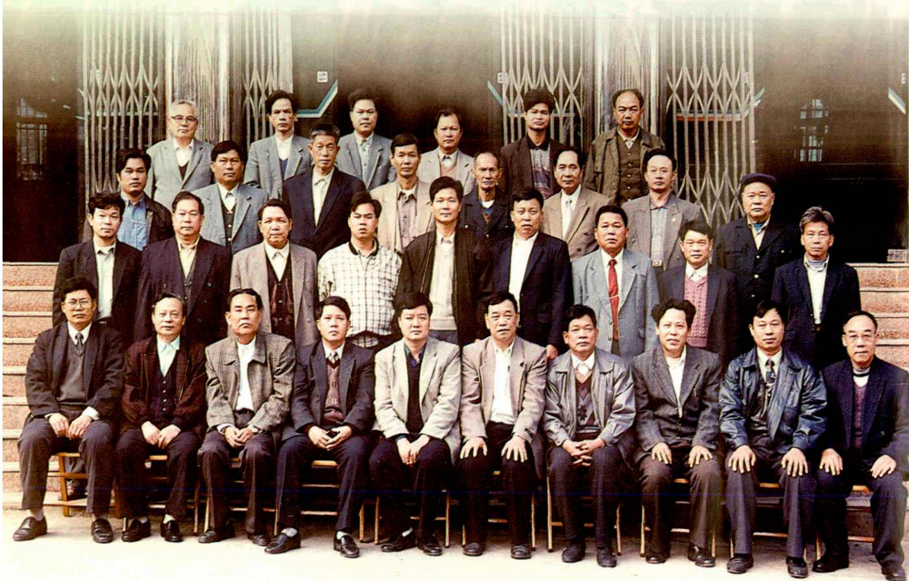
1999年12月,《浦北县邮电志》评审会全体代表合影。