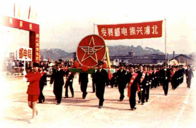
发展邮电振兴浦北