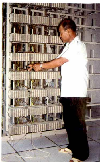
机务员在程控机房工作