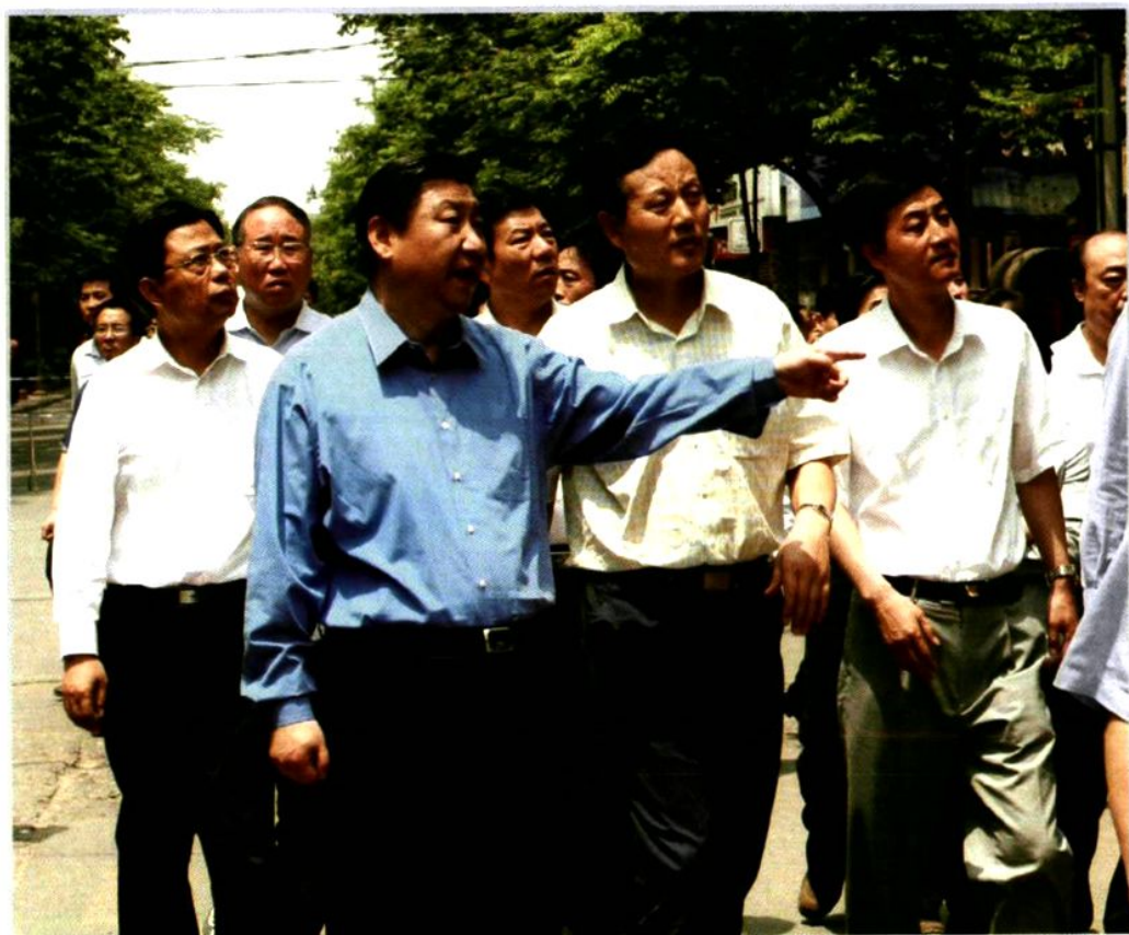
2008年5月21日，中共中央政治局常委、中央书记处书记、 国家副主席习近平来陈仓区视察指导抗震救灾工作