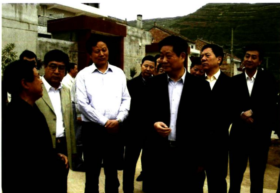
2008年4月6日，常务副省长赵正永来陈仓区考察调研惠民政策落实情况