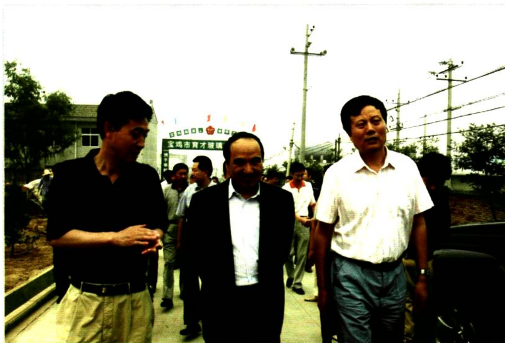
2007年6月11日，全国政协副主席阿不来提·阿不都热西提来陈仓区检查指导工作