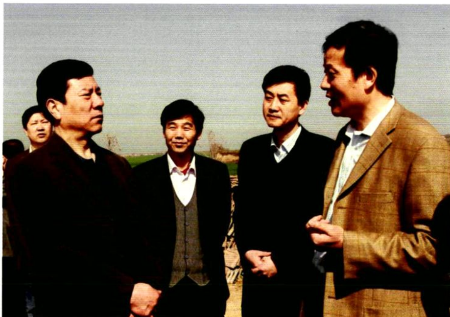
市委书记唐俊昌（左一）深入陈仓区企业、农村检查指导工作