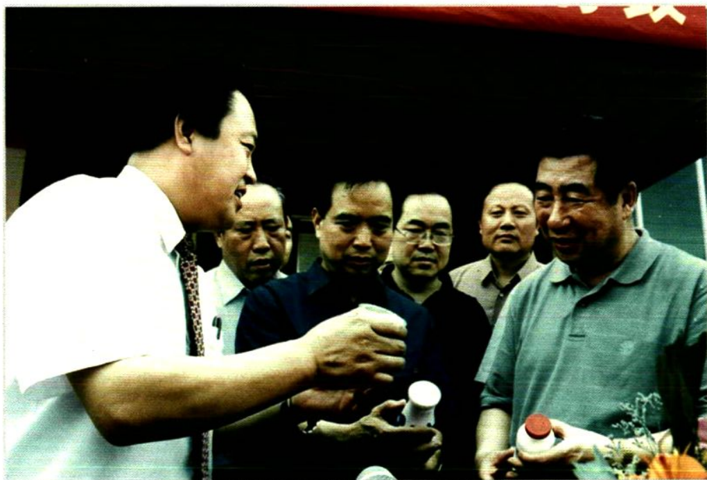
2003年6月3日，国务院副总理回良玉来陈仓区视察指导工作