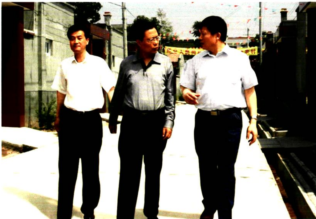
2008年6月16日，省委书记赵乐际（中）来陈仓区调研农民增收情况