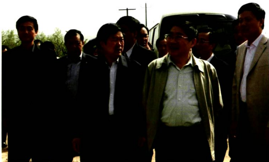
2007年10月26日，省长袁纯清来陈仓区考察调研民生八大工程运行情况