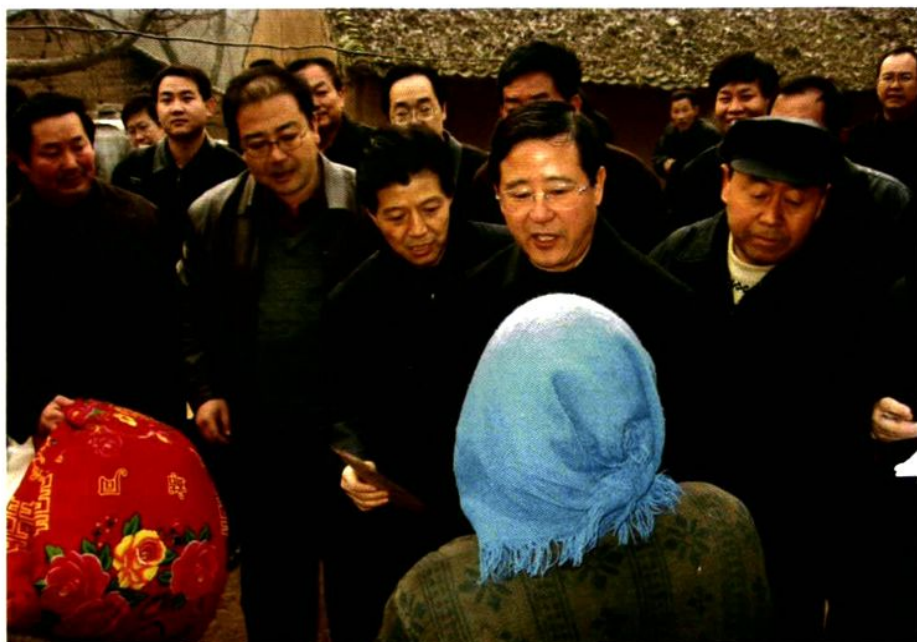
2004年3月12日，市委书记吴登昌深入陈仓区西部山区调研扶贫开发工作