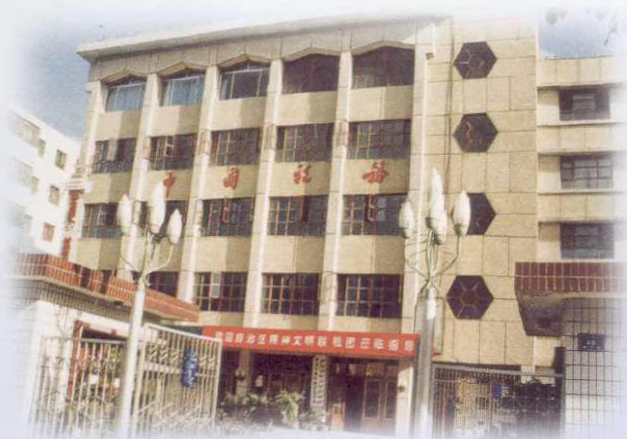
八十年代地区税务处外景