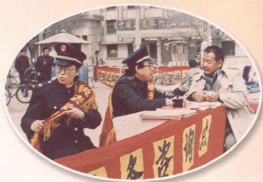
为个体工商户解答税收问题