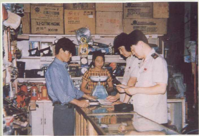
国税稽查人员对个体商店进行检查