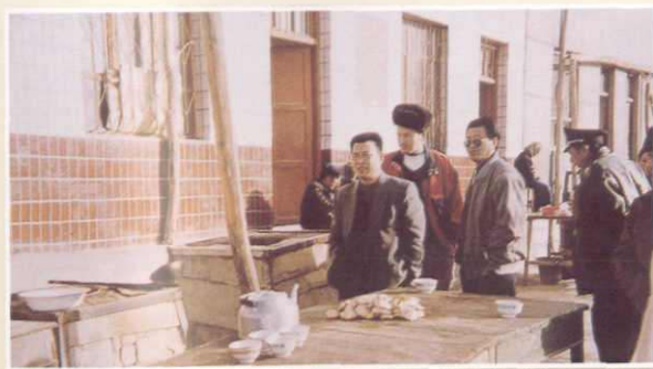
行风评议员进行调查