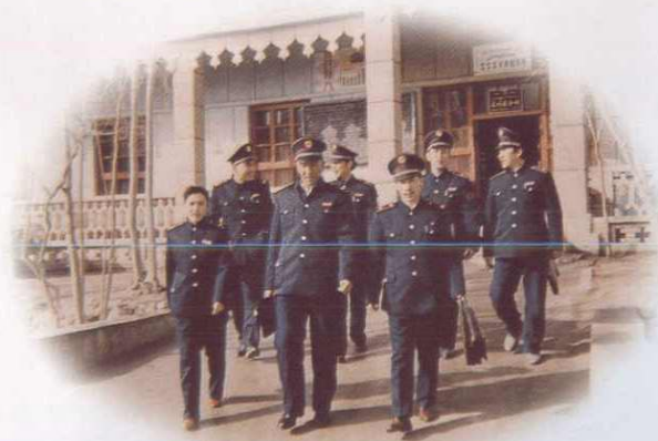
八十年代库车县齐满税务所外景