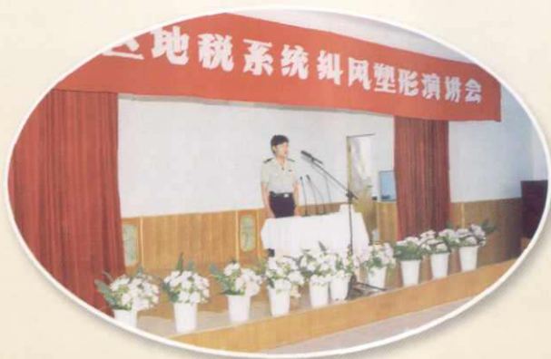
地区地税系统纠风塑形演讲