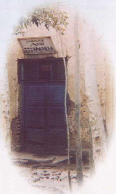
六十年代库车县依西哈拉税务所外景