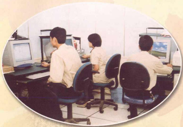
阿克苏市国税局微机房