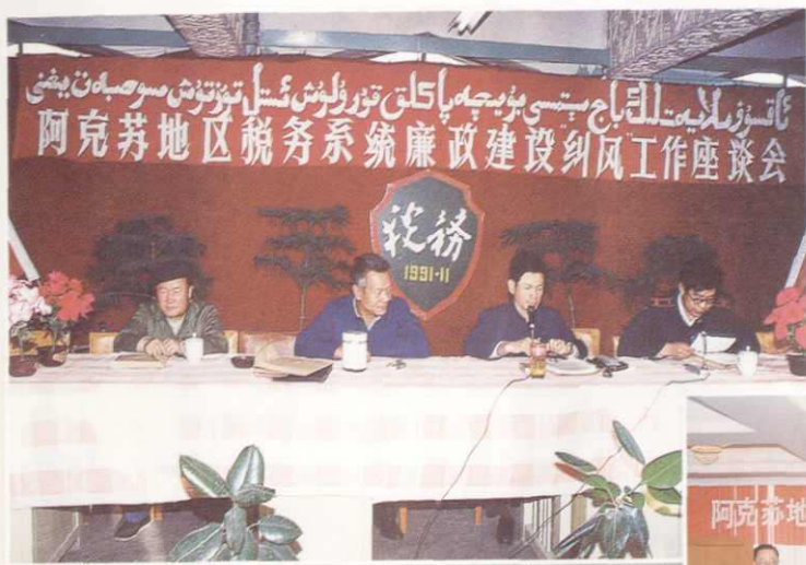
阿克苏地区税务系统廉政建设纠风工作座谈会