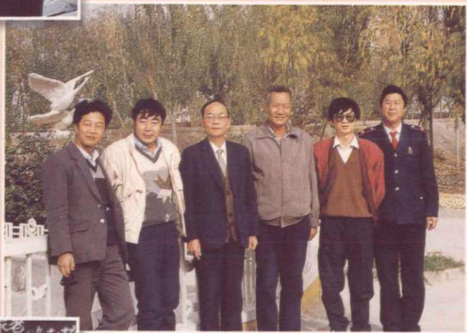
▶ 税务总局地方税管理司鲍司长来阿克苏调研