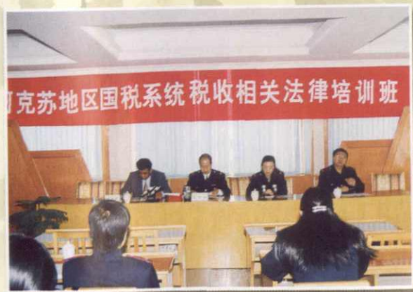
税收相关法律培训