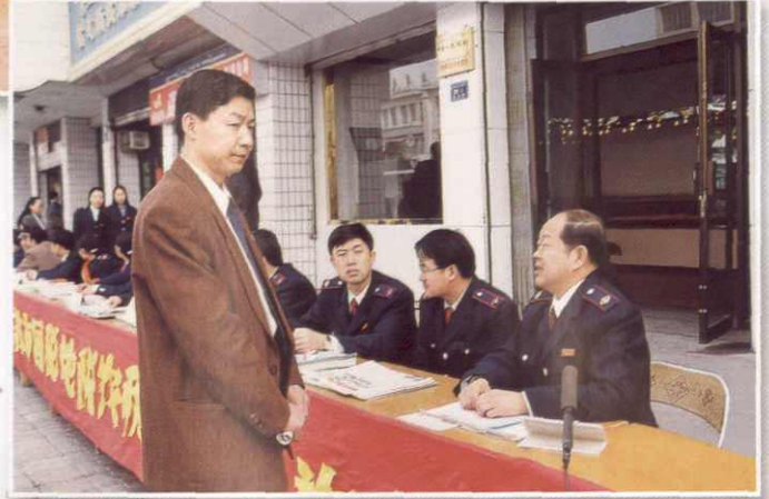
税法宣传月活动——地区国、地税领导 参加咨询活动