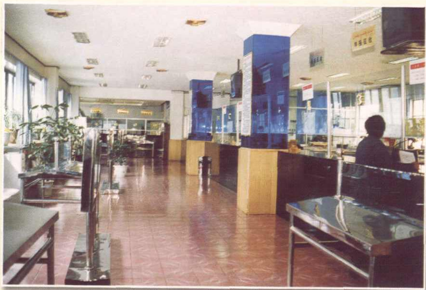
阿克苏市国税局办税服务大厅