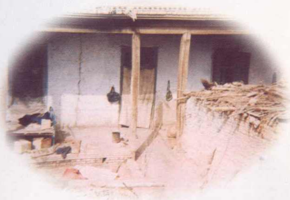
六十年代税务人员的住宅