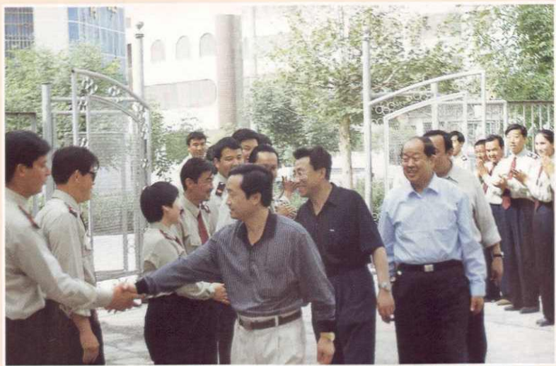
◀ 自治区国税局解爱国局长在沙雅县视察