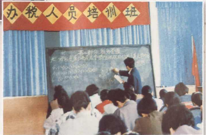
拜城市国税局为办税人员讲解税收基本知识