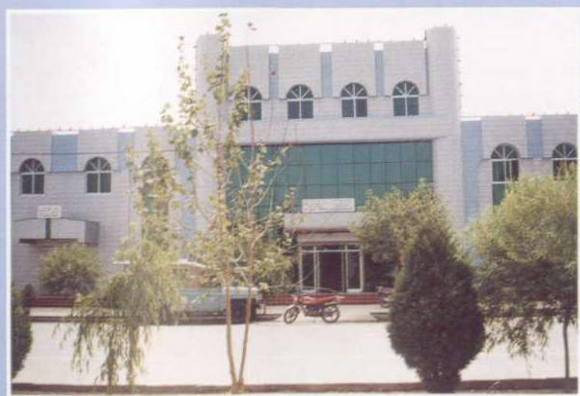
▶ 九十年代阿克苏市哈拉塔地税所办公楼外景