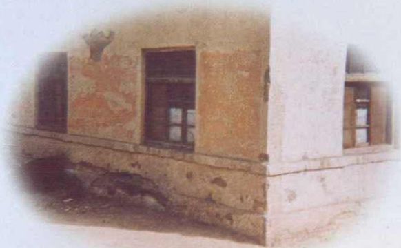
五十年代阿克苏专区税务局办公室旧址