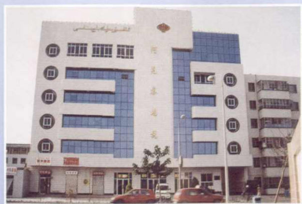
◀ 九十年代地区地税局办公楼外景