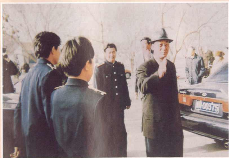
▶ 自治区地税局书记王志辉来阿克苏视察