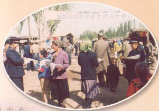
在农贸市场宣传税法