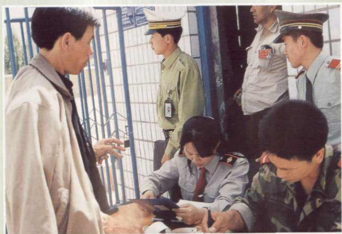
交警、税务部门联合进行运输业专项检查