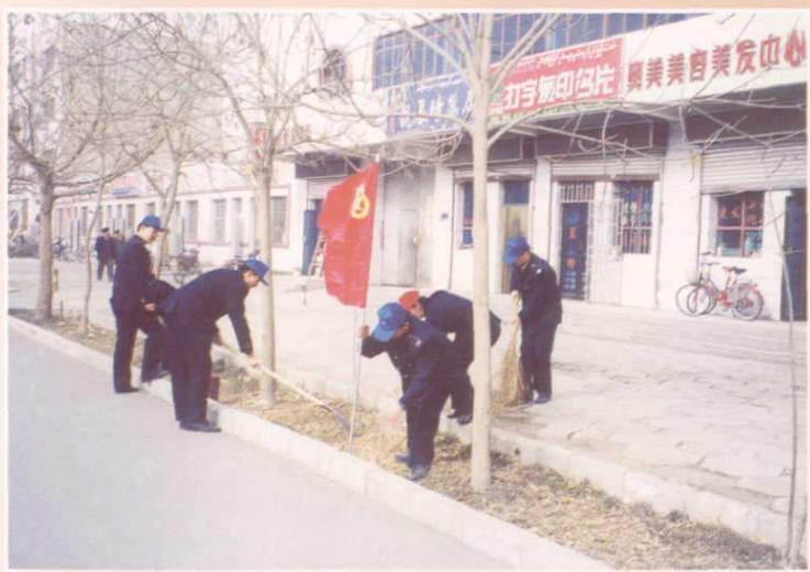
“青年文明号”成员在 团日活动