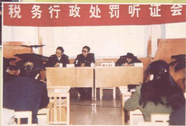
税务行政处罚听证