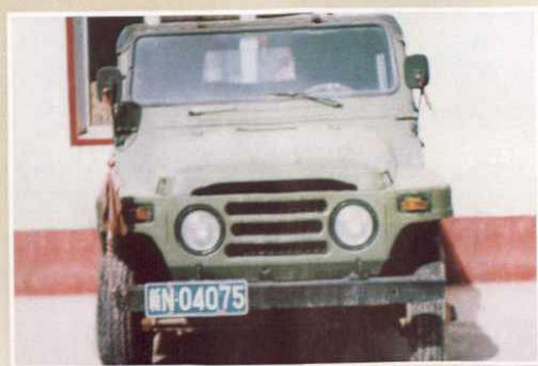
八十年代交通工具：212 吉普车