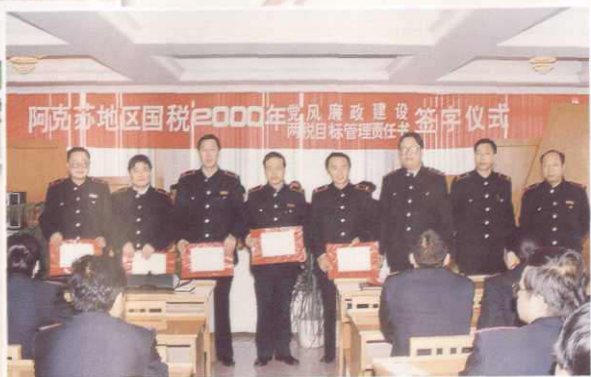
地区国税系统党风廉政建设责任书签字