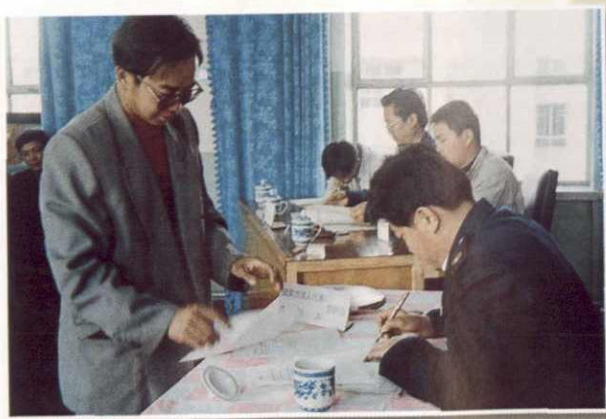
依法拍卖税收扣押物品