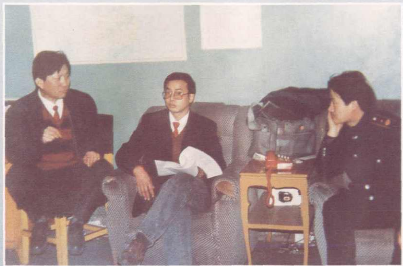
拜城县国税局深入企业调查