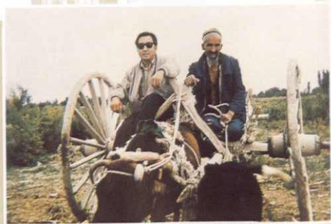
五十年代——七十年代征税交通工具。 木制牛车