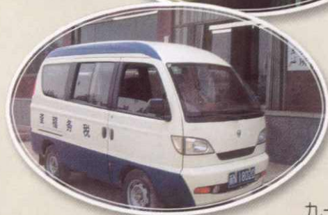
九十年代征税交通工具