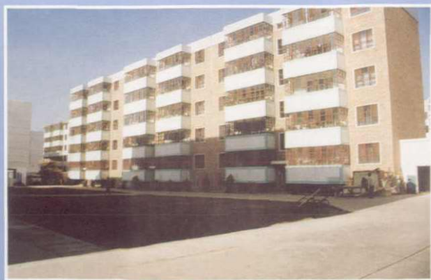
◀ 九十年代新建的拜城县地税局职工住宅