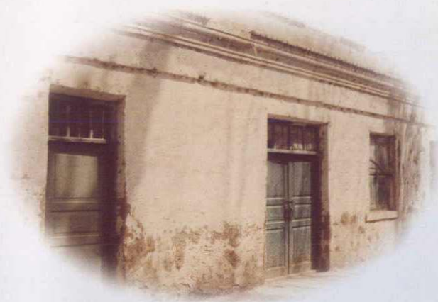
七十年代阿克苏市税务所外景