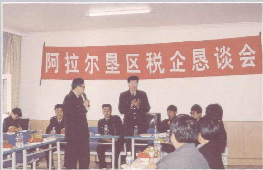
阿克苏市国税局阿拉尔垦区税企座谈会