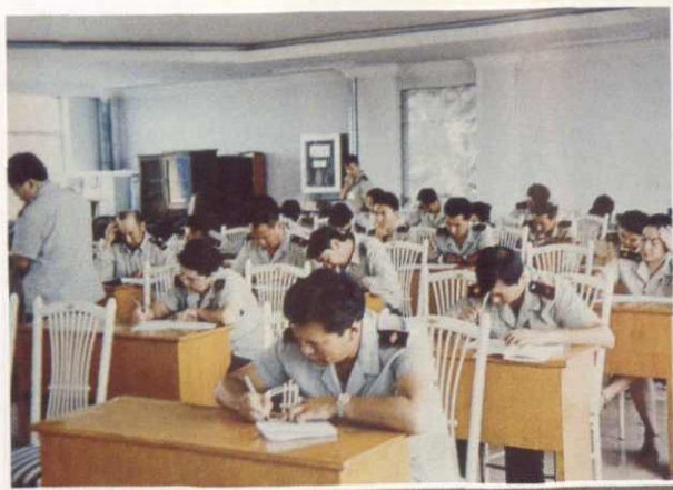
税务人员业务考试