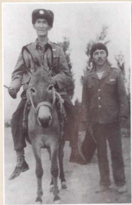
八十年代农村税务人员工作照