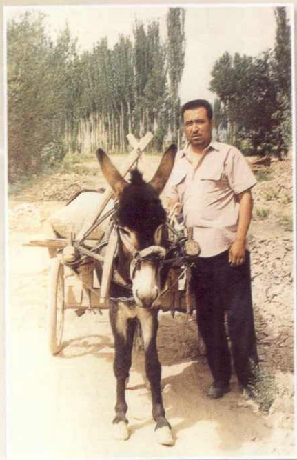
五十年代——七十年代胶轮驴车