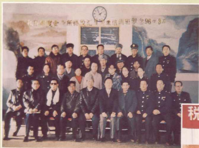
企业所得税汇算清缴培训