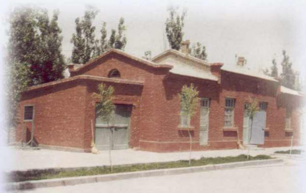
八十年代阿克苏市沙井子税务所外景