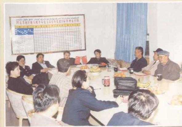
地区地税行风评议义务监督员进行座谈