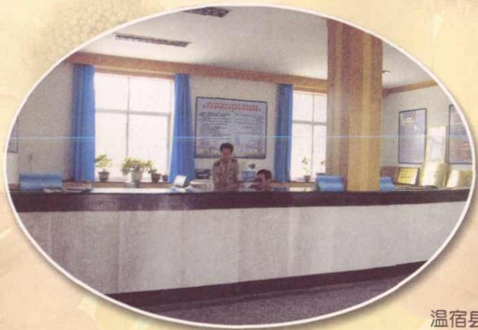
温宿县国税局农一师五团税务所