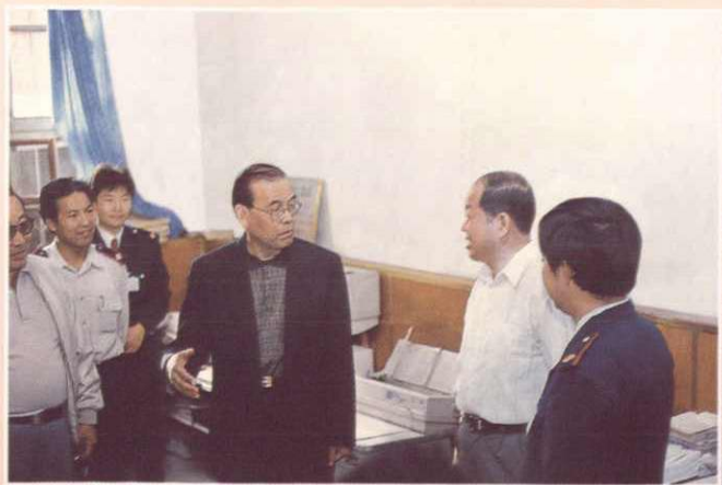
◀ 国家税务总局张相海总经济师来阿克苏视察