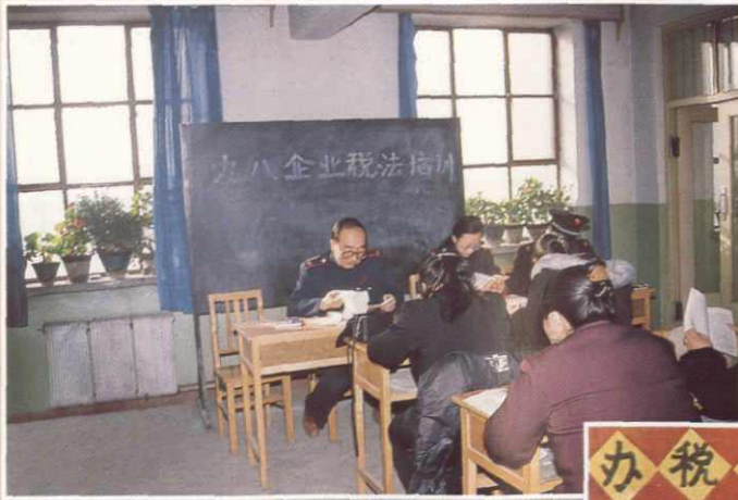
新和县地税局举办企业所得税培训班